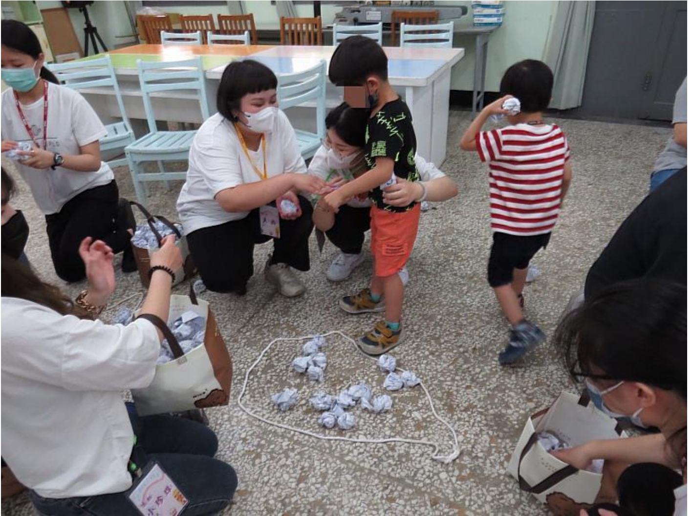
嘉藥餐旅系同學特地至瑞復益智中心陪伴慢飛天使玩遊戲