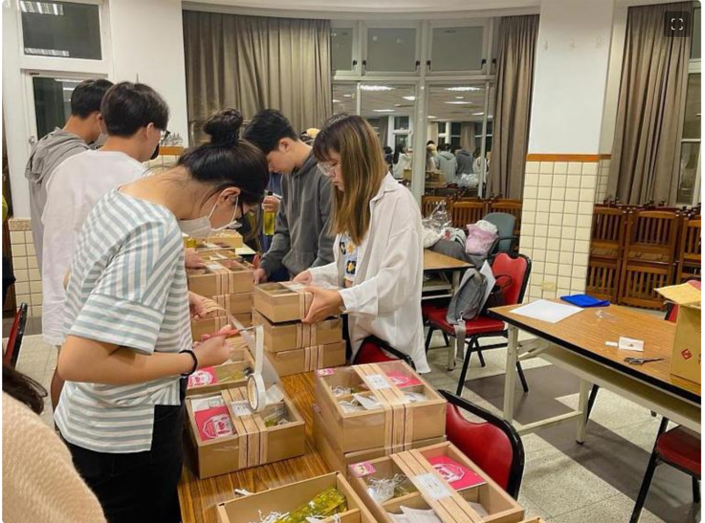
嘉藥餐旅系同學用心包裝將送往瑞復益智中心的「童心」禮盒

(中央社訊息服務20230606 09:27:01)又到了鳳凰花開畢業生離校之際，嘉南藥理大學餐旅管理系畢業生，顛覆以往傳統辦桌宴客的畢業成果展形式，改以將四年所學的廚藝、飲調、烘焙等技巧化為愛心餐盒，將一盒盒充滿祝福心意，滿載美味的「童心」感恩愛心禮盒，贈送給瑞復益智中心，也親自到現場陪著這群多重障礙的慢飛天使玩遊戲說故事，以最真誠與暖心的方式讓畢業成果展更有意義。