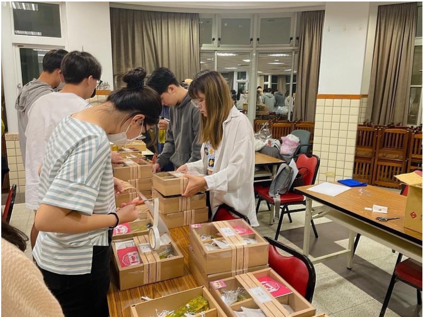
嘉藥餐旅系同學用心包裝將送往瑞復益智中心的「童心」禮盒

花開畢業生離校之際，嘉南藥理大學餐旅管理系畢業生，顛覆以往傳統辦桌宴客的畢業成果展形式，改以將四年所學的廚藝、飲調、烘焙等技巧化為愛心餐盒，將一盒盒充滿祝福心意，滿載美味的「童心」感恩愛心禮盒，贈送給瑞復益智中心，也親自到現場陪著這群多重障礙的慢飛天使玩遊戲說故事，以最真誠與暖心的方式讓畢業成果展更有意義。