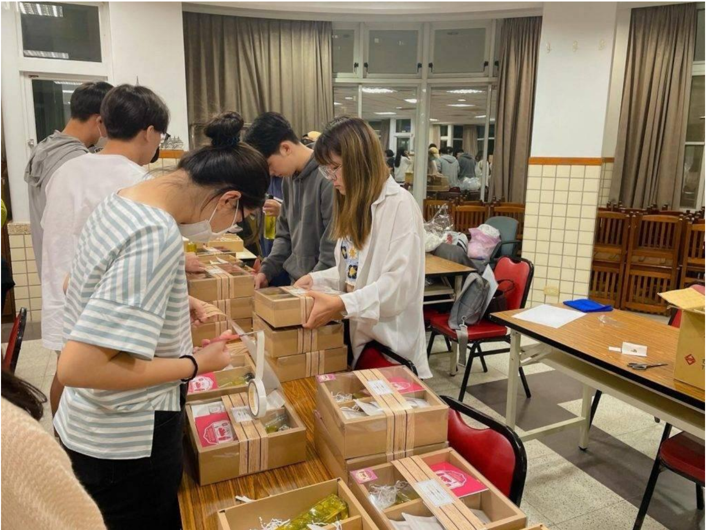
嘉藥餐旅系學生用心包裝要送往瑞復益智中心的「童心」禮盒。