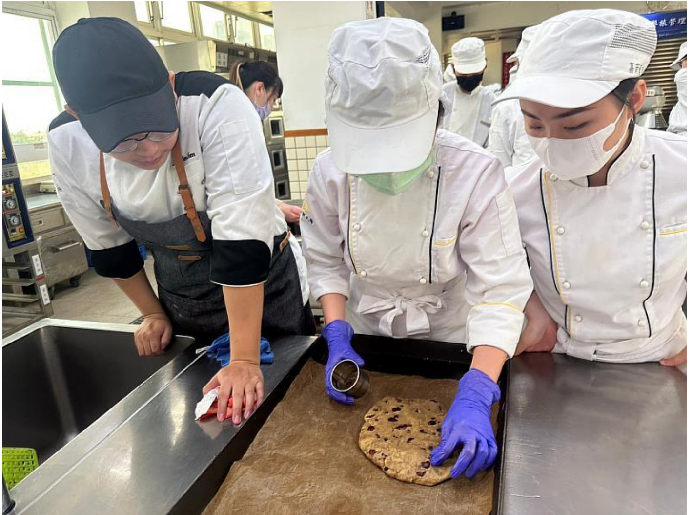
嘉藥餐旅系同學手工製作充滿愛的手工餅乾

此次的「童心」感恩愛心禮盒內容相當豐富，包含了幸運餅乾、曲奇餅、雪Q餅、司康、香料油、咖啡包及花茶包，每項點心都是由餐旅系學生親手製作完成，為了保有點心的新鮮度，同學們特地在活動的前一天才開始製作包裝，隔天一大早便將餐盒送至瑞復益智中心。瑞復益智中心一直以來就是餐旅系固定關懷單位，平常就會不定時的分享烘焙選手們所製作的麵包、蛋糕，有空閒的時間也會去陪伴小朋友玩遊戲，讓他們的生活更加豐富多彩。