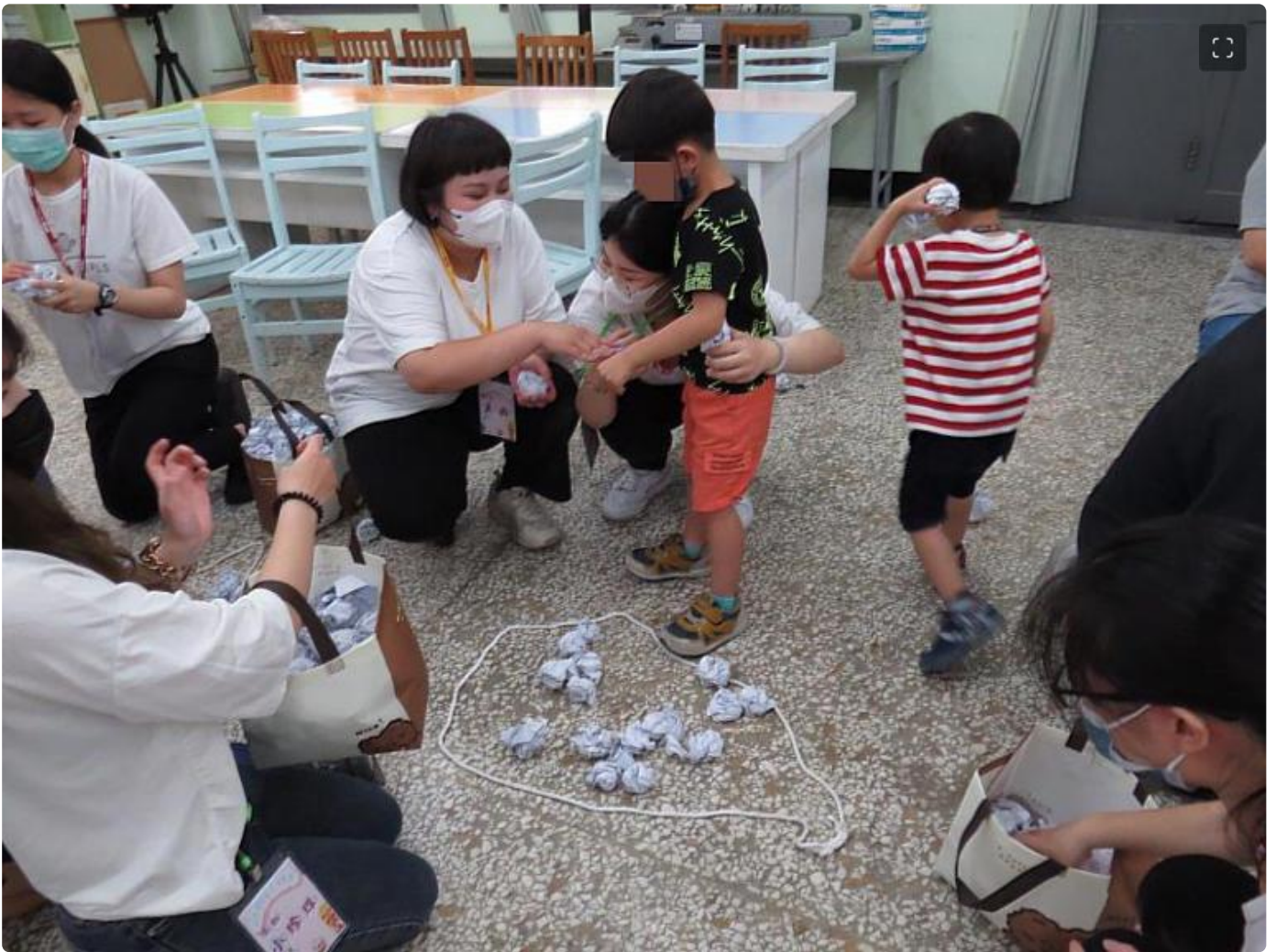
嘉藥餐旅系同學特地至瑞復益智中心陪伴慢飛天使玩遊戲