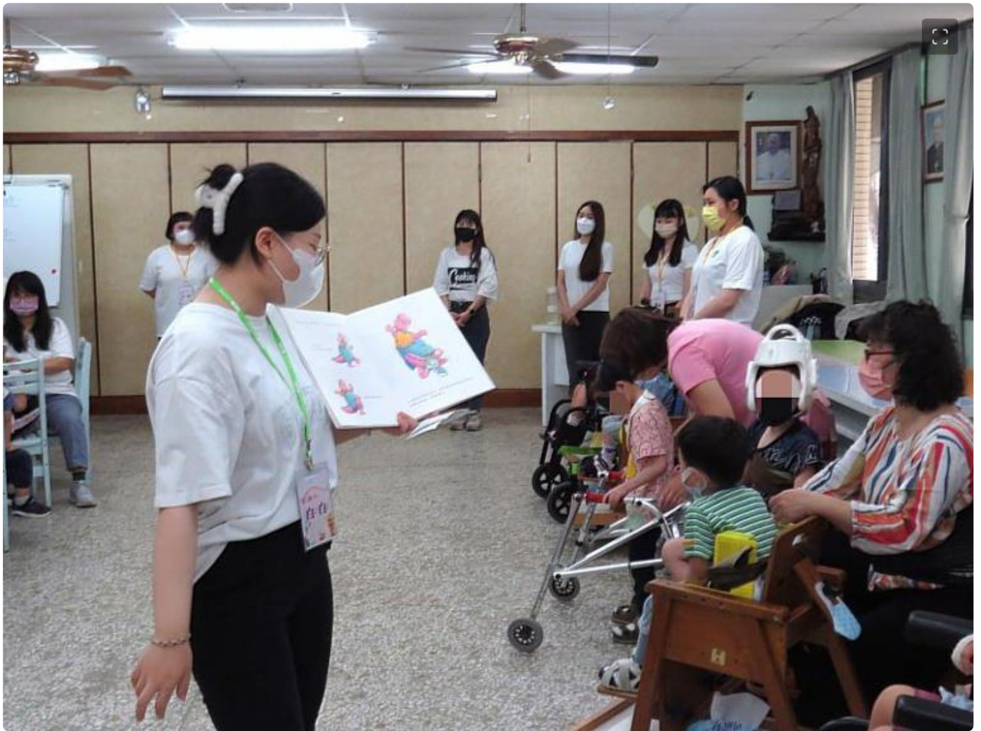
嘉藥餐旅系同學特別準備有趣的童書陪伴小朋友度過一下午

負責指導老師鄧杞祝表示，同學從三年級開始籌備規劃，當中經歷過疫情高峰到結束，從線上開會到實體製作，除了訓練同學的團結及溝通能力，讓他們在大學畢業前有更不同的體驗，將每一份的愛心餐盒化作一個祝福，送給瑞復益智中心的慢飛天使，這也是大學生應盡的社會責任，他們能以實際行動力挺公益，深深感到驕傲與自豪。