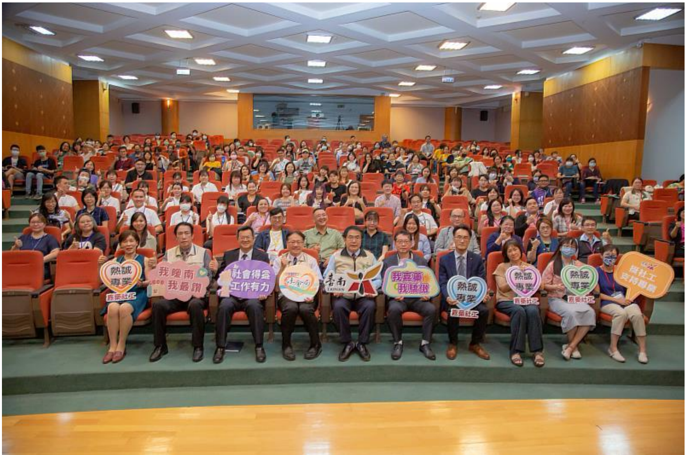
嘉藥攜手南市社會局舉辦「家庭暴力與司法社會工作實務研討會」

攜手臺南市社會局6月2日於該校國際會議中心舉辦「家庭暴力與司法社會工作實務研討會」，除了臺南市市長黃偉哲及衛福部保護服務司張司長親臨會場外，其他包括臺南市社會局局長盧禹璵、家防中心主任施清發及秘書林育如等，相關領域的專家學者及實務工作者也都到場來共襄盛舉。