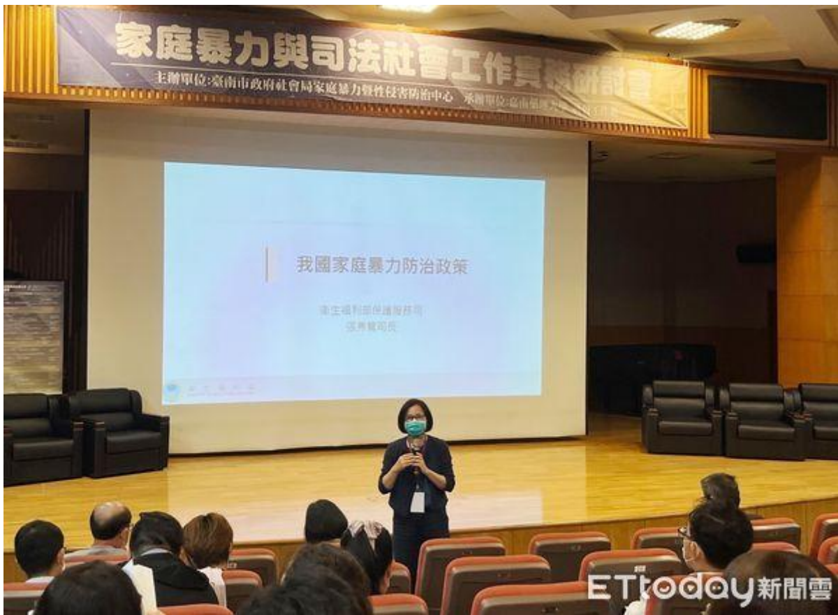
▲台南市政府積極落實「活力台南、全齡照顧」施政理念，社會局攜手嘉南藥理大學社會工作系推動合作計畫，特舉行「2023年家庭暴力與司法社會工作實務研討會」。