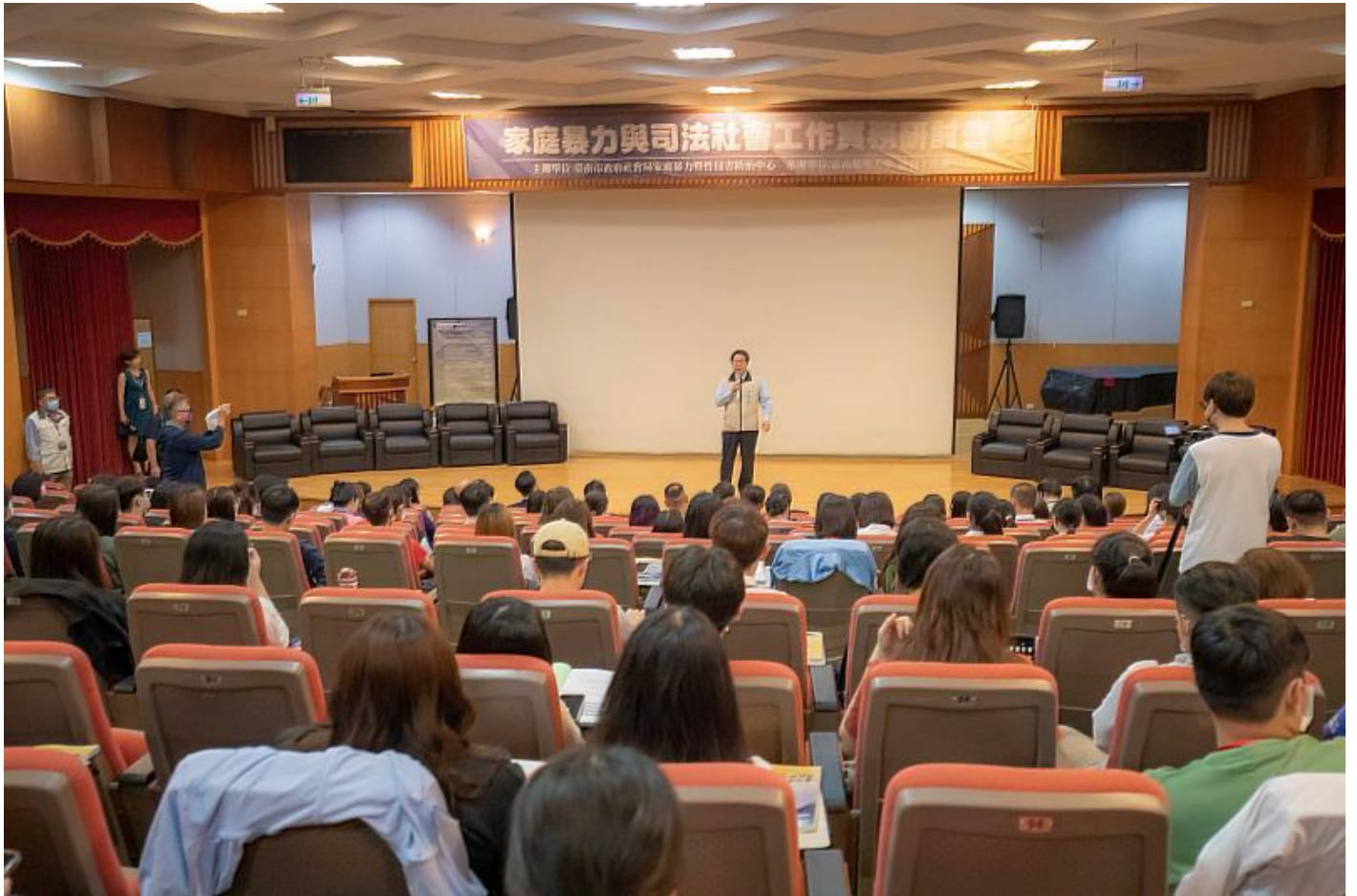
市長黃偉哲特地親臨研討會現場

害防治、曝險少年、司法社會工作等議題，期待透過實務界與學術界的對話，增進司法機關與市府社會工作者之默契，提升專業知能、增廣實務深度。