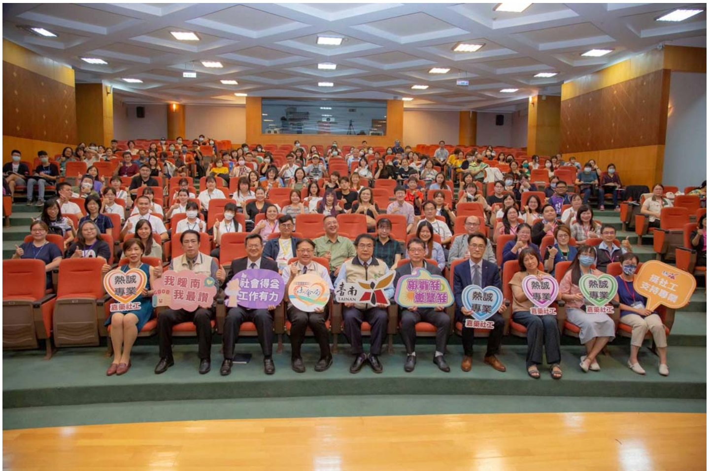
圖說：南市社會局攜手嘉南藥理大學舉辦「家庭暴力與司法社會工作實務研討會」。

【記者黃鐘毅 / 台南報導】南市府社會局攜手嘉南藥理大學社會工作系推動合作計畫，2日舉辦「112年家庭暴力與司法社會工作實務研討會」，市長黃偉哲表示，社會安全事件日益受到各界重視，包含家庭、親密關係暴力或校園、職場霸凌等不同的生活場域，因此強化社會安全網有賴政府與民間各界共同努力，讓傷害即早停止、公義即早介入。