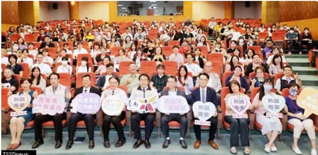
南市長黃偉哲、社會局盧禹璵出席與嘉南藥理大學社會工作系合作的「家庭暴力與司法社會工作實務研討會」。(記者李嘉祥攝)

▲南市長黃偉哲、社會局盧禹璵出席與嘉南藥理大學社會工作系合作的「家庭暴力與司法社會工作實務研討會」。(記者李嘉祥攝)