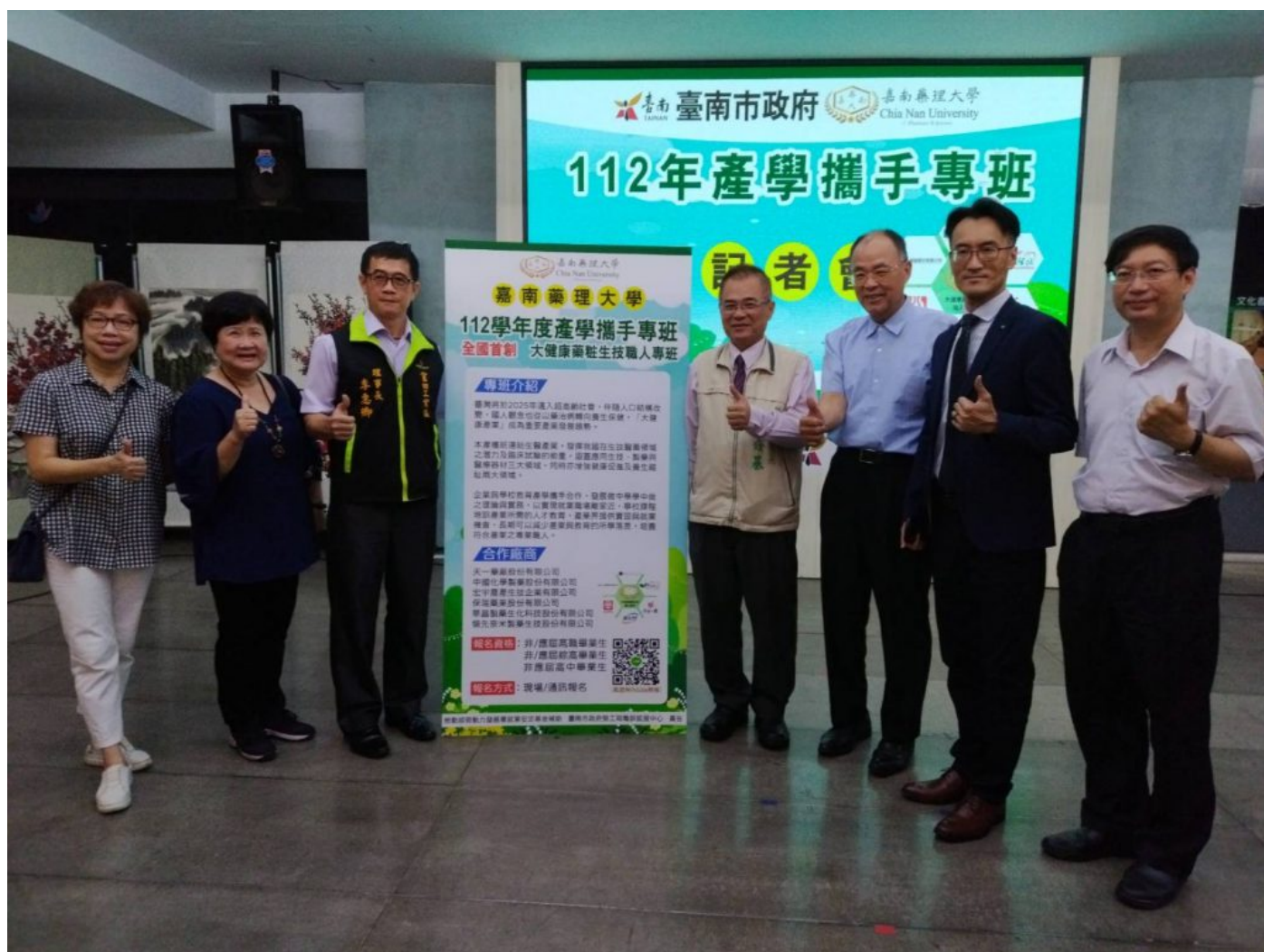
勞工局作媒促成產學攜手培育人才，嘉南藥理大學率先推大健康藥粧生技職人專班。