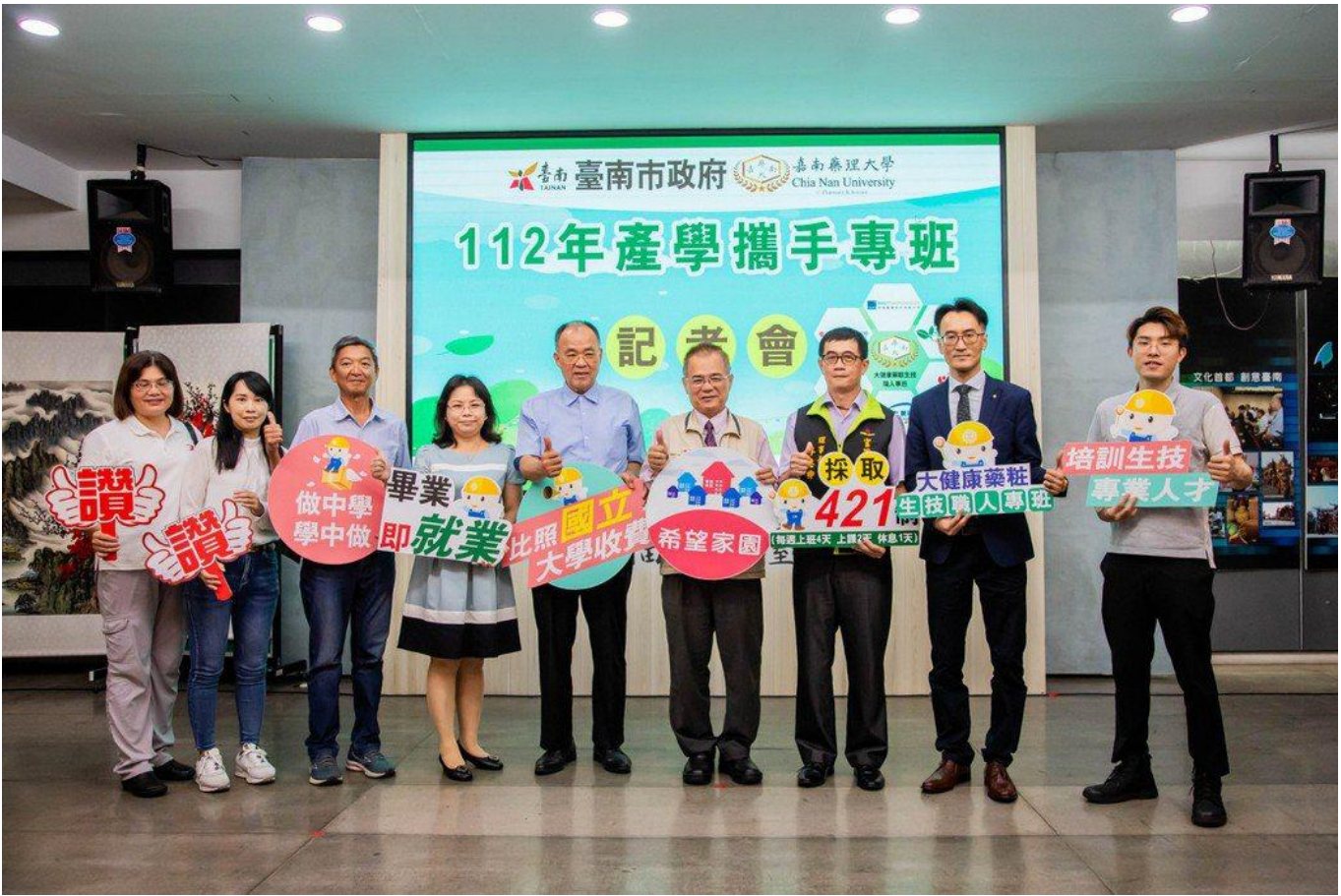
嘉藥與臺南市勞工局攜手辦理「產學攜手專班」記者會由勞工局局長王鑫基(右4)開幕致詞。