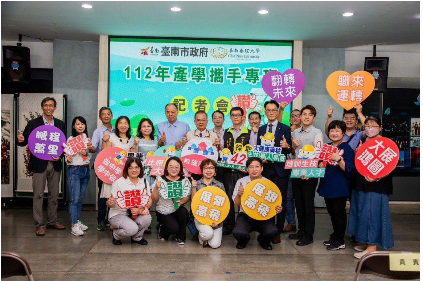
嘉藥攜手臺南市勞工局在市府民治市政中心辦理「產學攜手專班記者會」。