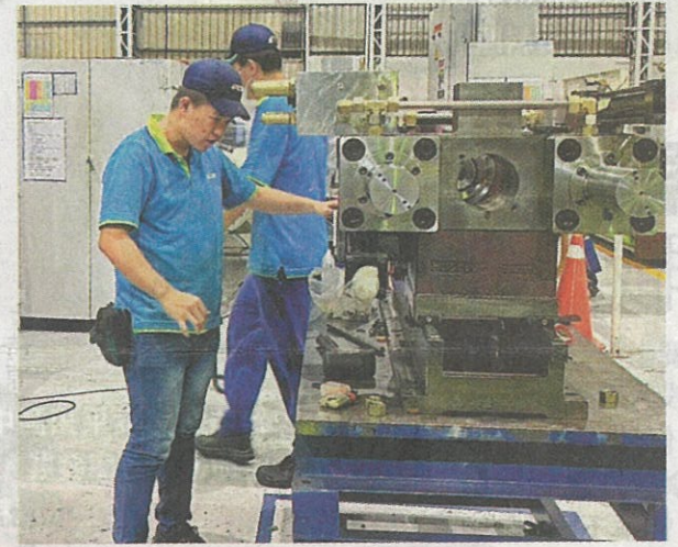
勞動部「產學攜手2.0」計畫讓學生到企業上班學以致用，兼顧就學與就業。

勞動部、經濟部及教育部為培育產業人才，仿建教合作推出「雙軌訓練旗艦計畫」，去年再轉型為「產學攜手2.0」計畫，兼顧學生就學與就業，台南有六所科大參與，勞工局加入共同推出產學專班，預計五所科大開辦六專班。