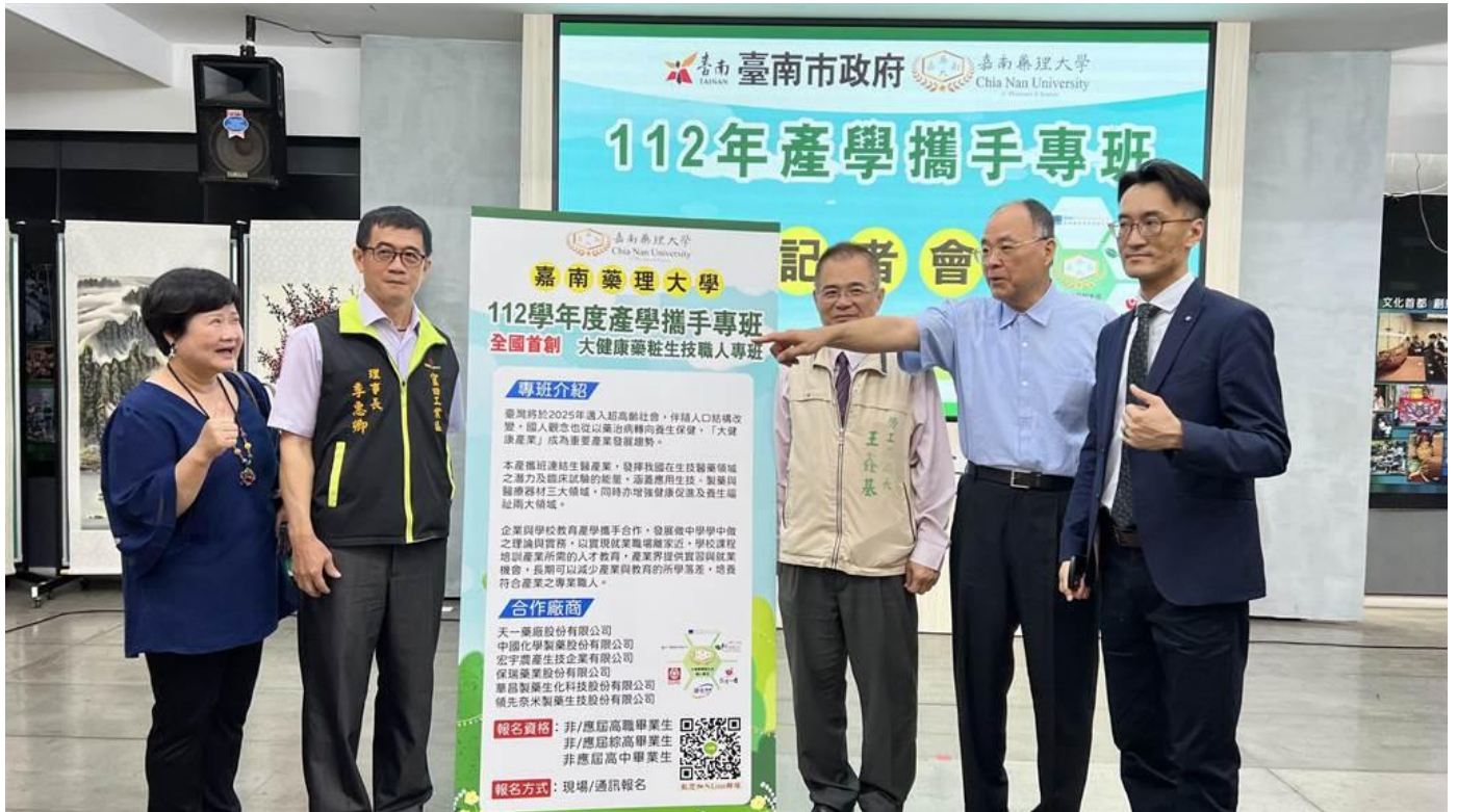
台南市政府勞工局今年促成產官學合作，由官田工業區生醫業者盤點人力需求，與嘉南藥理大學合力開辦「大健康藥粧生技職人專班」。

台南市政府勞工局今年促成產官學合作，由官田工業區生醫業者盤點人力需求，與嘉南藥理大學合力開辦「大健康藥粧生技職人專班」，業者提供工作機會、薪資，學校針對產業生態需求設計彈性學制與課程，將產業界與學校連結在一起，學生完成大學學業的同時，練成一技在身。