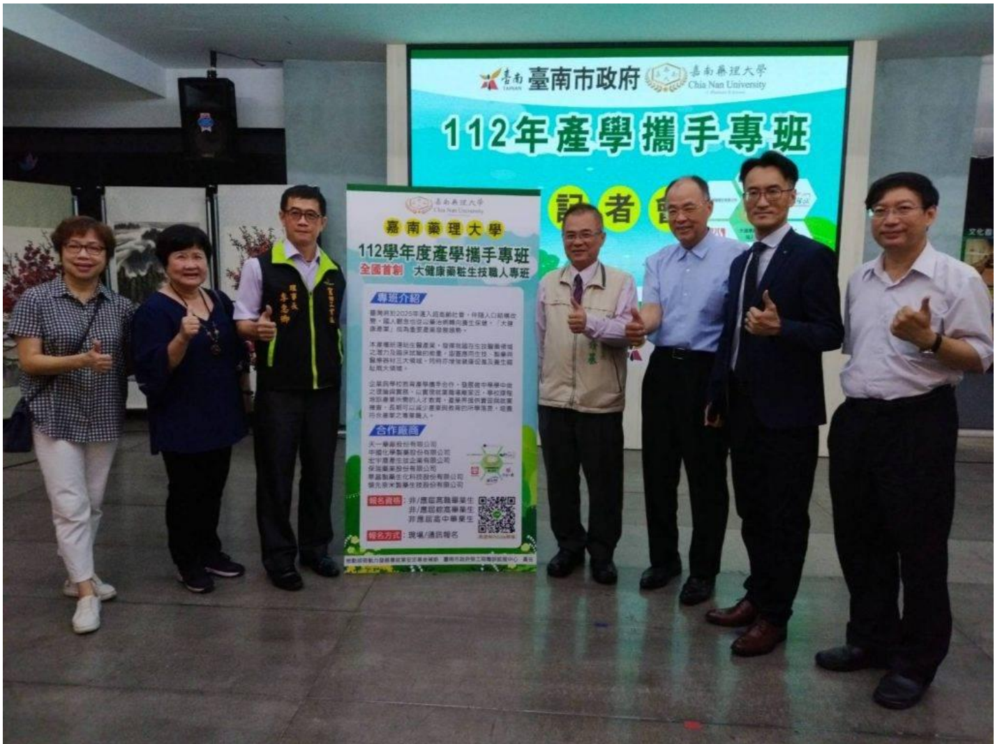
勞工局作媒促成產學攜手培育人才，嘉南藥理大學率先推大健康藥粧生技職人專班。