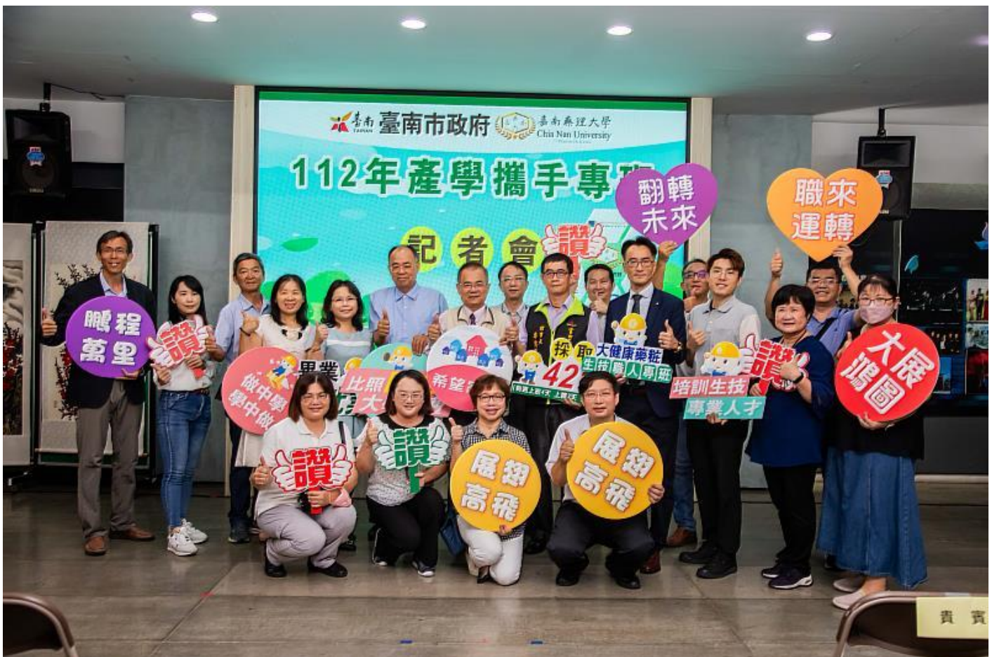
嘉藥攜手臺南市勞工局在市府民治市政中心辦理「產學攜手專班記者會」

攜手臺南市勞工局6日在市府民治市政中心辦理「產學攜手專班記者會」，藉由產官學攜手合作育才平台，學校端發揮技職教育的優勢，除了協助學生在校取得專業知識與學歷，更連結企業職場實務經驗與留才機制，讓就學與就業無縫結合，不僅藉此降低學用落差，縮短學生進入職場後的適應磨合期，更可契合產業對於人才在質與量上的需求。