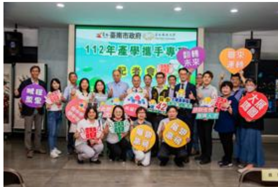
嘉藥攜手臺南市勞工局在市府民治市政中心辦理「產學攜手專班記者會」。

【記者孫宜秋 / 南市報導】嘉南藥理大學攜手臺南市勞工局（今）6日在市府民治市政中心辦理「產學攜手專班記者會」，藉由產官學攜手合作育才平台，學校端發揮技職教育的優勢，除了協助學生在校取得專業知識與學歷，更連結企業職場實務經驗與留才機制，讓就學與就業無縫結合，「產學攜手專班記者會」。