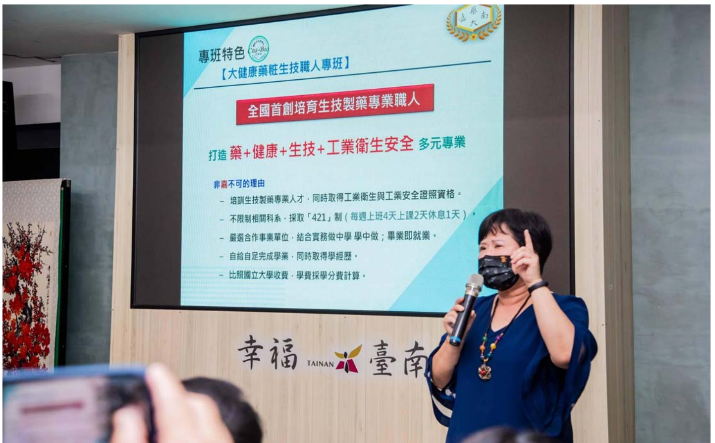
圖：嘉藥王四切院長介紹產攜專班421制的學習讓未來的人才能提前與職場接軌。

「大健康藥粧生技職人專班」培育製藥專業人才，可同時取得工業衛生與工業安全證照資格，凡29歲以下國民，非/應屆高職(綜高)畢業生及非應屆高中畢業生皆可報名參加，採取「421制」(每週上班4班上課2天休息1天)，畢業留任即就業，比照國立大學收費，學費採學分費計算，報名請洽詢06-2664911分機2700。