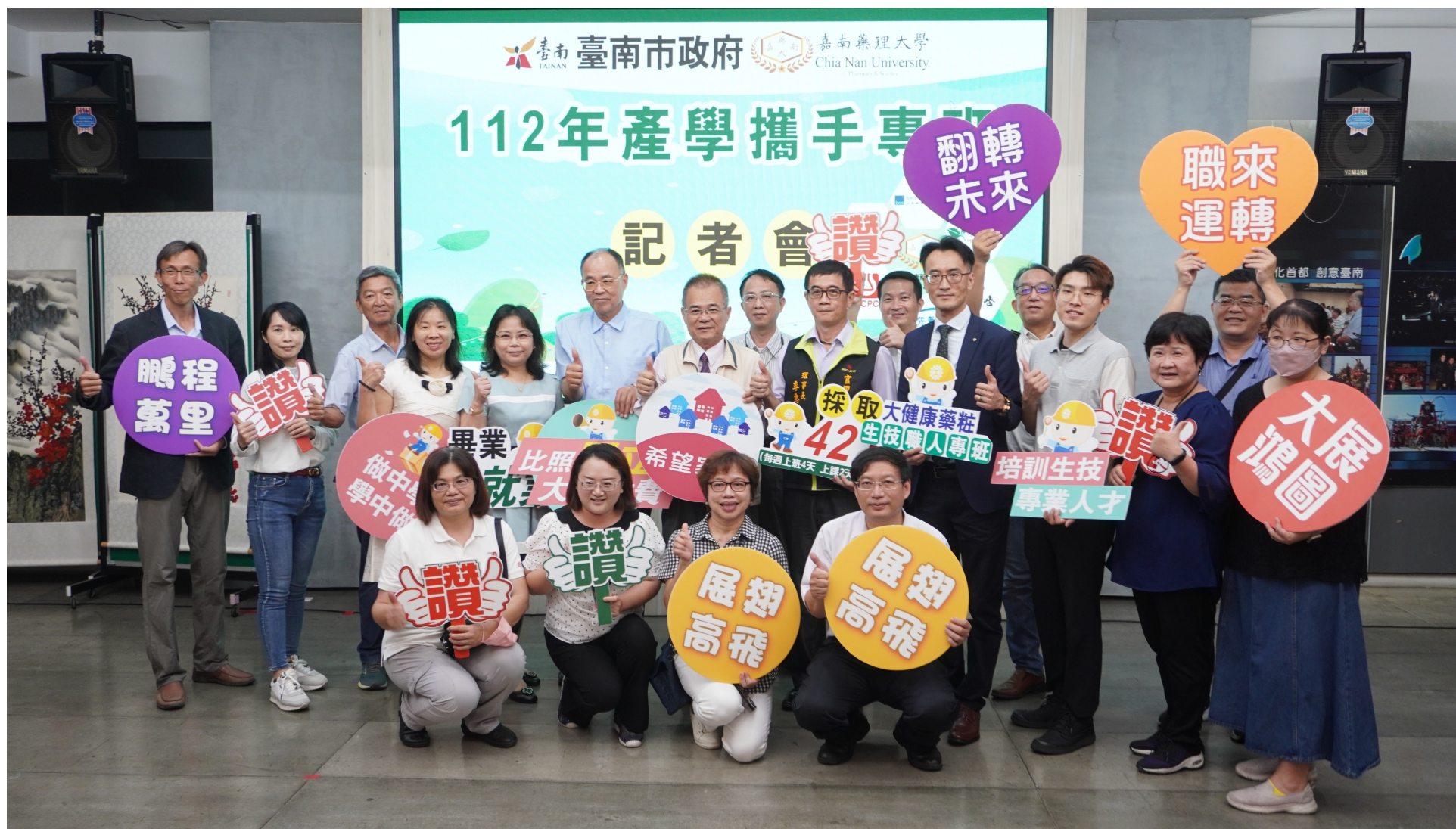
台南市政府勞工局促成產官學攜手推動「產學攜手專班」。

「大健康藥粧生技職人專班」培育製藥專業人才，可同時取得工業衛生與工業安全證照資格，採取每週上班4班、上課2天、休息1天的「421制」，畢業留任即就業，比照國立大學收費，學費採學分費計算，報名請洽詢06-2664911分機2700。