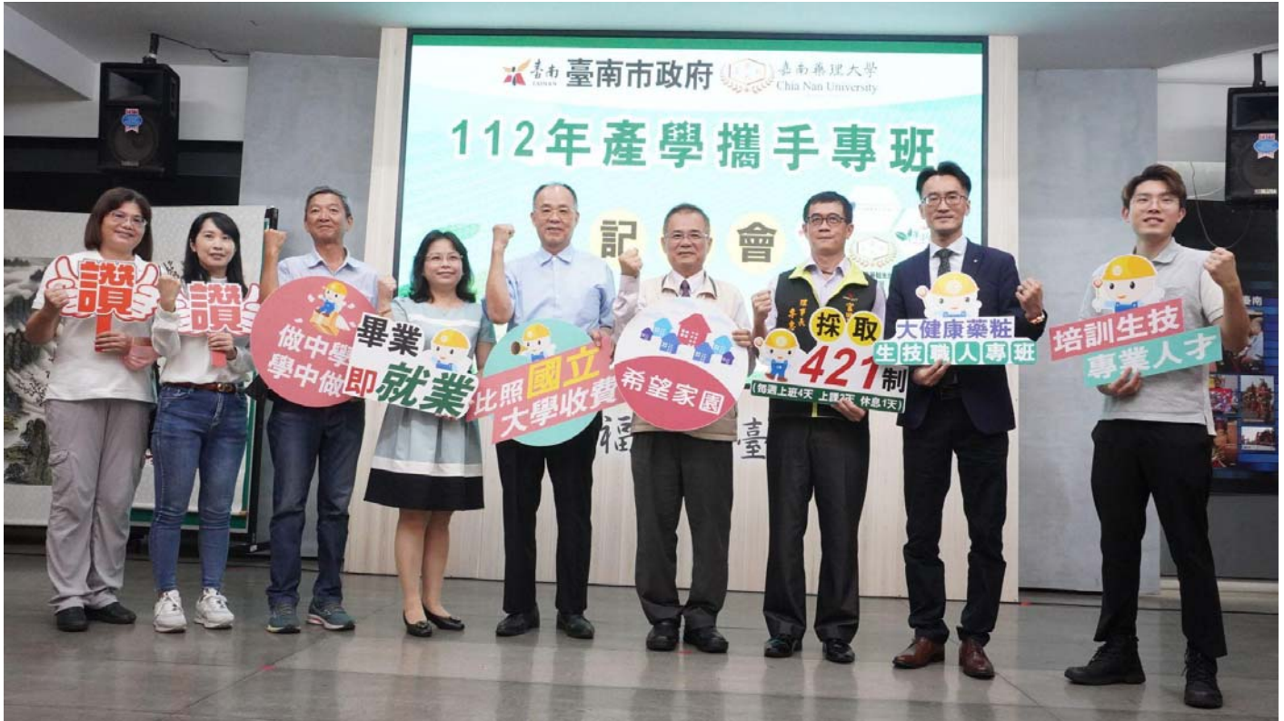
▲台南勞工局促進產官學攜手培育人才 嘉大首推「大健康藥粧生技職人專班」。

用，提升學生就讀與就業意願，培育學生職能，將「人手」提升為「人才」，在企業上擔任「職場達人」，進而擴散成為「人物」。