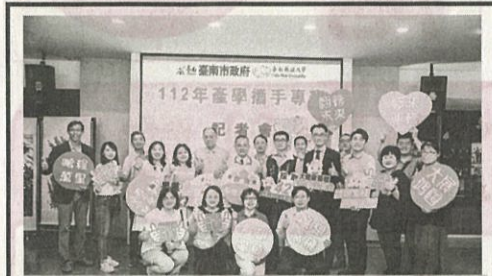
嘉藥攜手臺南市勞工局在市府民治市政中心辦理「產學攜手專班記者會」。

【記者孫宜秋／南市報導】嘉南藥理大學攜手臺南市勞工局（今）9日在市府民治市政中心辦理「產學攜手專班記者會」，藉由產官學攜手合作育才平台，學校端發揮技職教育的優勢，除了協助學生在校取得專業知識與學歷，更連結企業職場實務經驗與留才機制，讓就學與就業無縫結合，不僅藉此降低學用落差，縮短學生進入職場後的適應磨合期，更可契合產業對於人才在質與量上的需求。