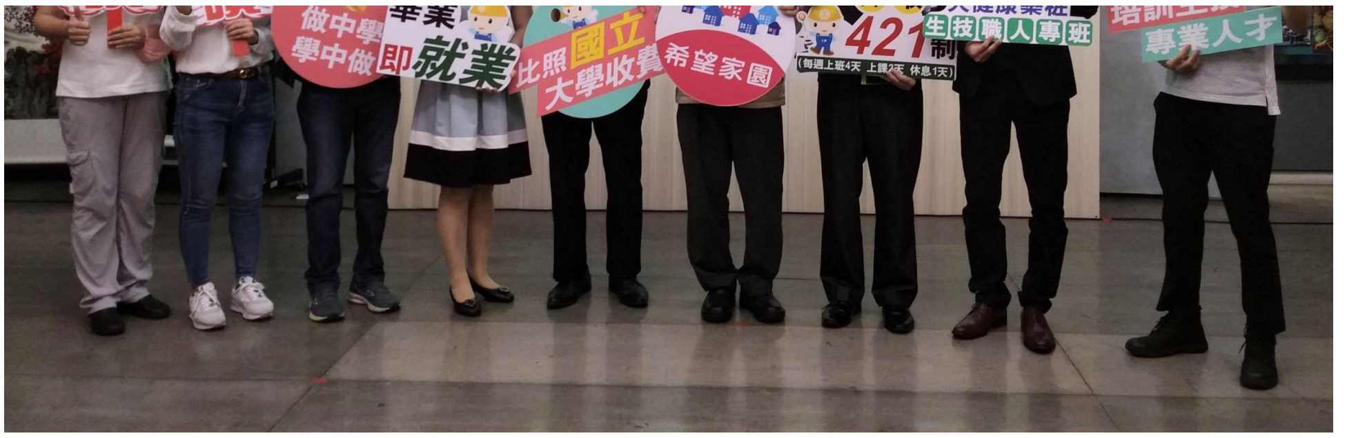
台南市政府勞工局促成產官學攜手推動「產學攜手專班」。