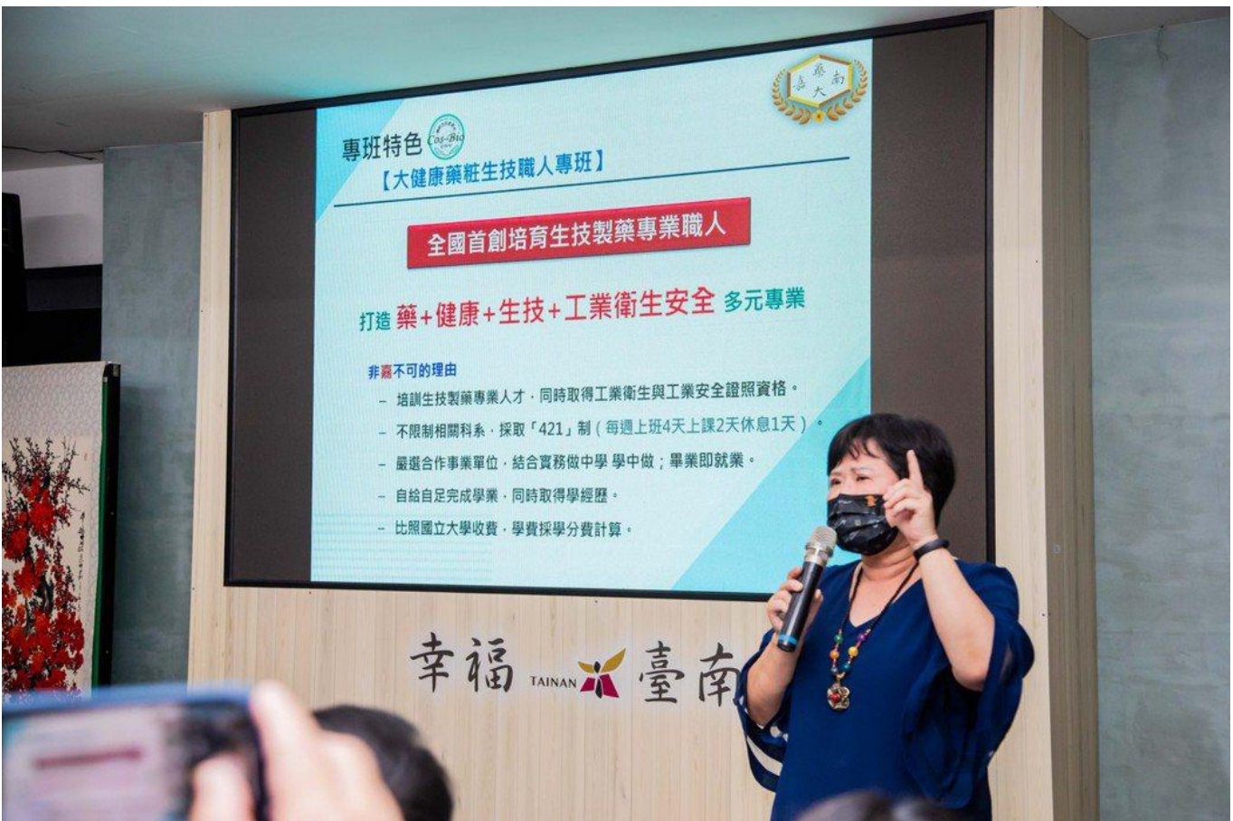
嘉藥王四切院長介紹產攜專班421制(4天上班2天上課1天休息)的學習，讓未來的人才能提前與職場接軌。