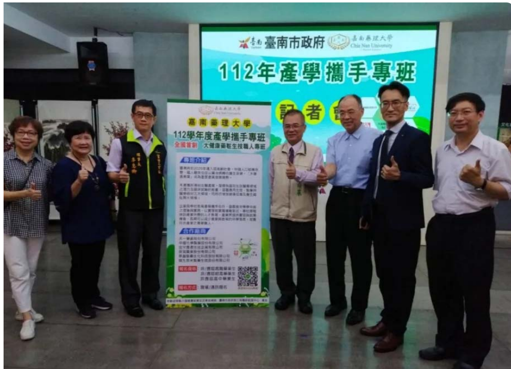
勞工局作媒促成產學攜手培育人才，嘉南藥理大學率先推大健康藥粧生技職人專班。