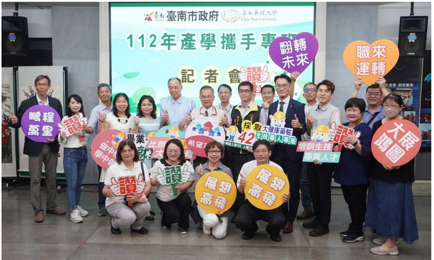
圖：台南市政府勞工局促成產官學攜手推動「大健康藥粧生技職人專班」。