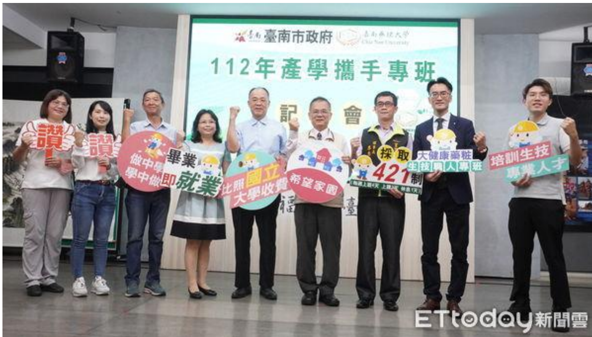
▲嘉南藥理大學攜手台南市勞工局，6日在民治市政中心辦理「產學攜手專班記者會」，藉由產官學攜手合作育才。