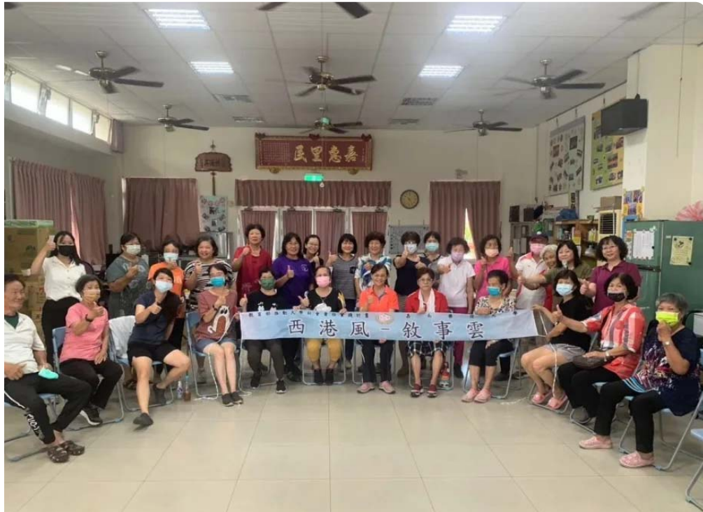
嘉藥USR計畫團隊培訓西港區港東里音樂照顧志工。