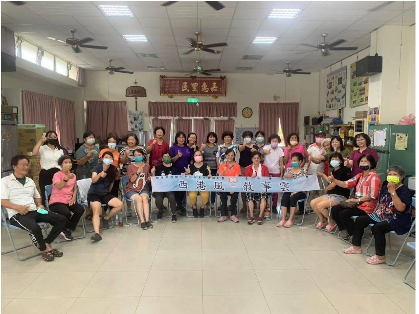
嘉藥USR計畫團隊培訓西港區港東里音樂照顧志工。