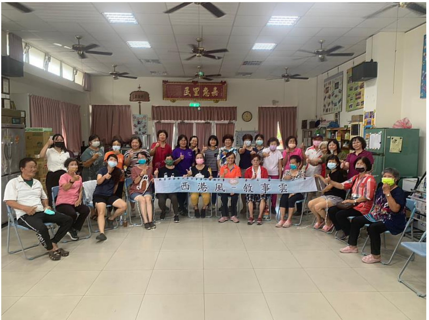
嘉藥USR計畫融合在地水族陣 培訓社區音樂照顧志工

(中央社訊息服務20230821 11:11:30)嘉南藥理大學「西港風·敘事雲」USR計畫團隊，日前至台南市西港區港東里舉辦「音樂照顧促進社區長者實務應用」志工訓練課程，吸引在地30位志工報名參加，共同學習新的長者照顧技能，課程更是融合在地文化-水族陣，讓報名的志工們更加有在地共鳴感。