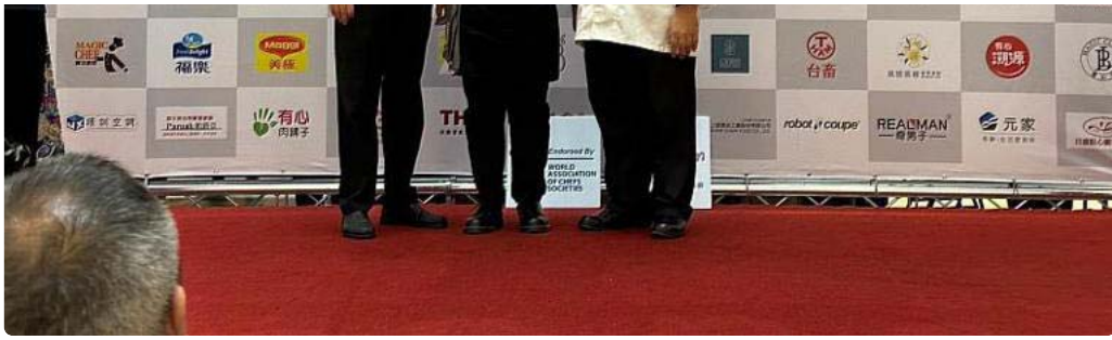
嘉藥餐旅賴建君是比賽的常勝軍

擁有中餐、西餐、烘焙、中式麵食及飲調5張證照的陳星昊同學，初次參賽便獲得2銅牌1佳作的好成績，不枉他在暑假留在學校進行集訓，其中牛肉類的「嫩煎菲力佐紅酒sauce莫札瑞拉牛肉卷襯約克夏布丁」，讓他印象最深刻，做了牛肉三吃，其中的約克夏布丁及炙烤肉卷的部份比較做工繁複，因主菜盤裡規定有澱粉類項目，將澱粉類以約克夏布丁的方式加上牛油烤製香氣撲鼻，肉卷部份則用烙紋方式，香氣的不同讓整盤菜更具豐富的層次感，這次能獲得得評審青睞，讓他對於自己的廚藝更加有自信，也立下未來要往餐飲界邁進的決心。