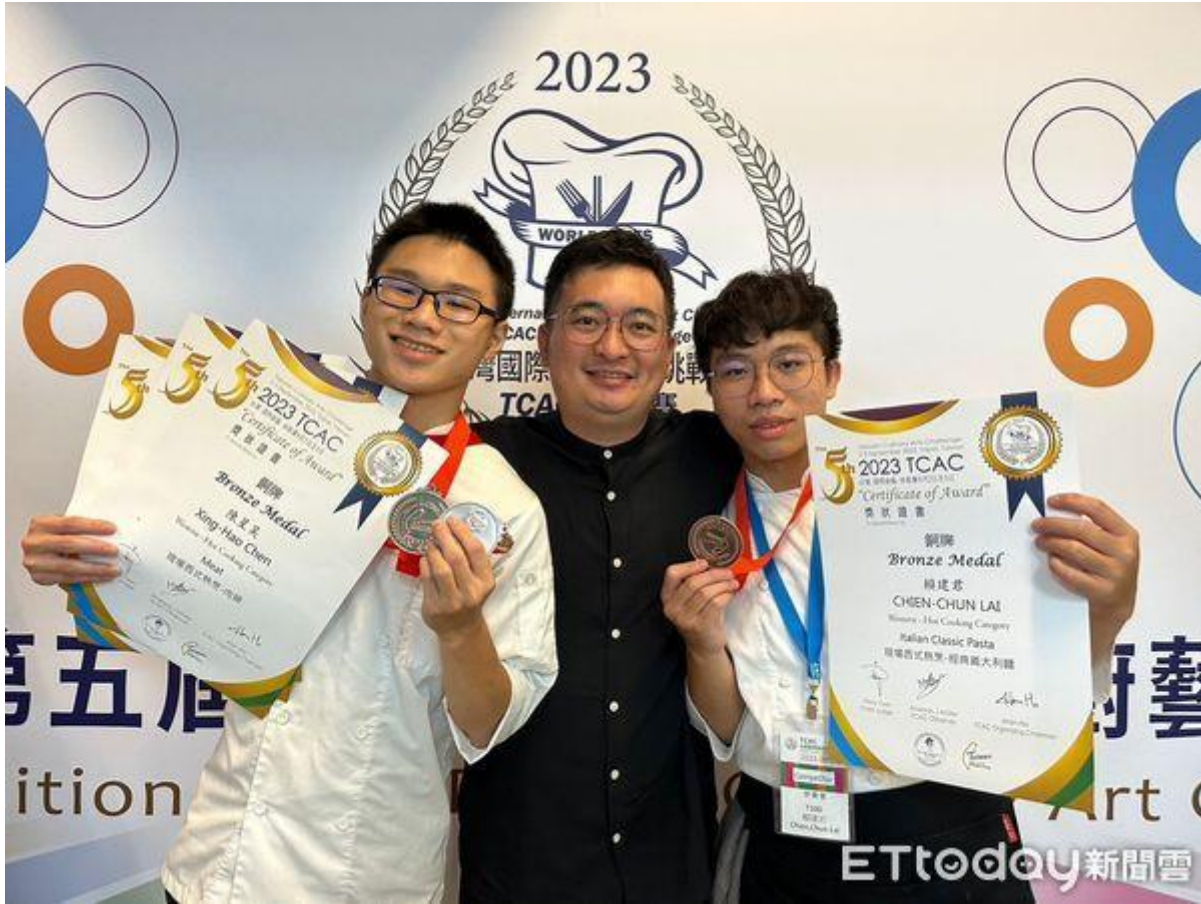
▲嘉南藥理大學餐旅管理系西廚培訓隊，在2023年TCAC台灣國際廚藝美食挑戰賽又有表現傑出，奪得3銅牌1佳作。