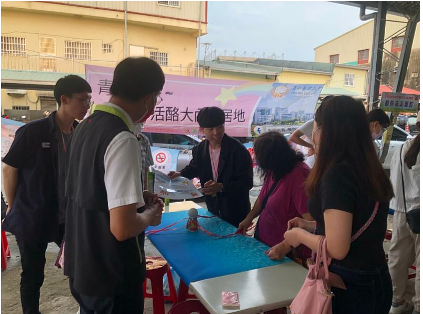
嘉藥學生設計多款防失智闖關趣味遊戲

照顧及社工系的長照關懷等等，讓學生能將所學運用在實務上，並從中找到熱情並適時回饋社會，發揮大學系所的專業功能，實踐了大學社會責任。