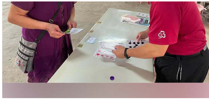
嘉藥藥學系師生帶領長輩一同體驗預防失智症遊戲

嘉南藥理大學錢紀銘校長表示，嘉藥長期關注環境永續、地方創生及深化在地鏈結，近年積極推動「藥食粧安」、「智慧健康」及「資源永續」為學校發展特色及目標，今年度更是通過5件教育部第三期大學社會責任實踐(USR)計畫，從初期以「在地關懷」為議題拓展至「健康促進與食品安全推動」，未來學校也將投入更多專業資源為社區提供專業服務，尤其是本校藥營精神介入社區照護，藉由藥學系與保營系的社區用藥諮詢及營養衛教與居家用藥整合及營養照護、藥粧系健康照顧、高福系的銀髮族照顧及社工系的長照關懷等等，讓學生能將所學運用在實務上，並從中找到熱情並適時回饋社會，發揮大學系所的專業功能，實踐了大學社會責任。