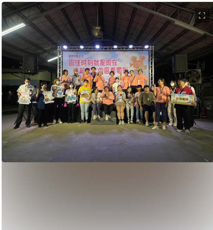
響應國際失智症月，嘉藥攜手衛生局在大內區舉辦憶起來看電影活動

(中央社訊息服務20230918 09:31:30)嘉南藥理大學藥理學院響應國際失智症月與臺南市政府衛生局於15日在南市大內區辦理「最佳時刻就是現在～憶起來大內區看電影」，並設計一系列闖關活動提升社區民眾對失智症的認識，期盼能盡早預防失智發生，並打造充滿希望的失智友善社會。