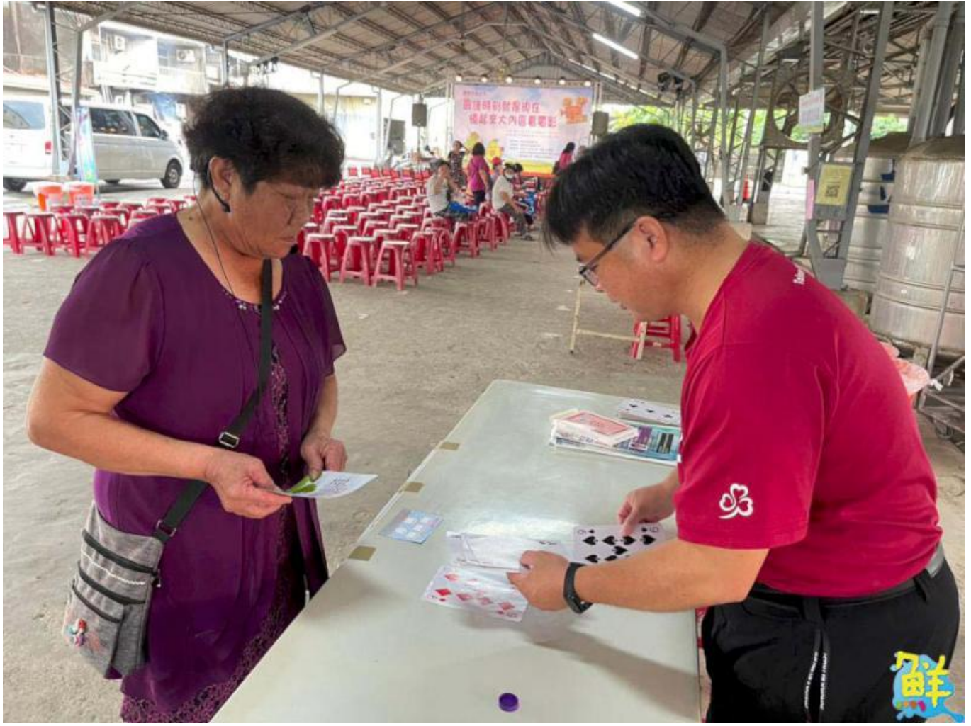
▲ 嘉藥藥學系師生帶領長輩一同體驗預防失智症遊戲