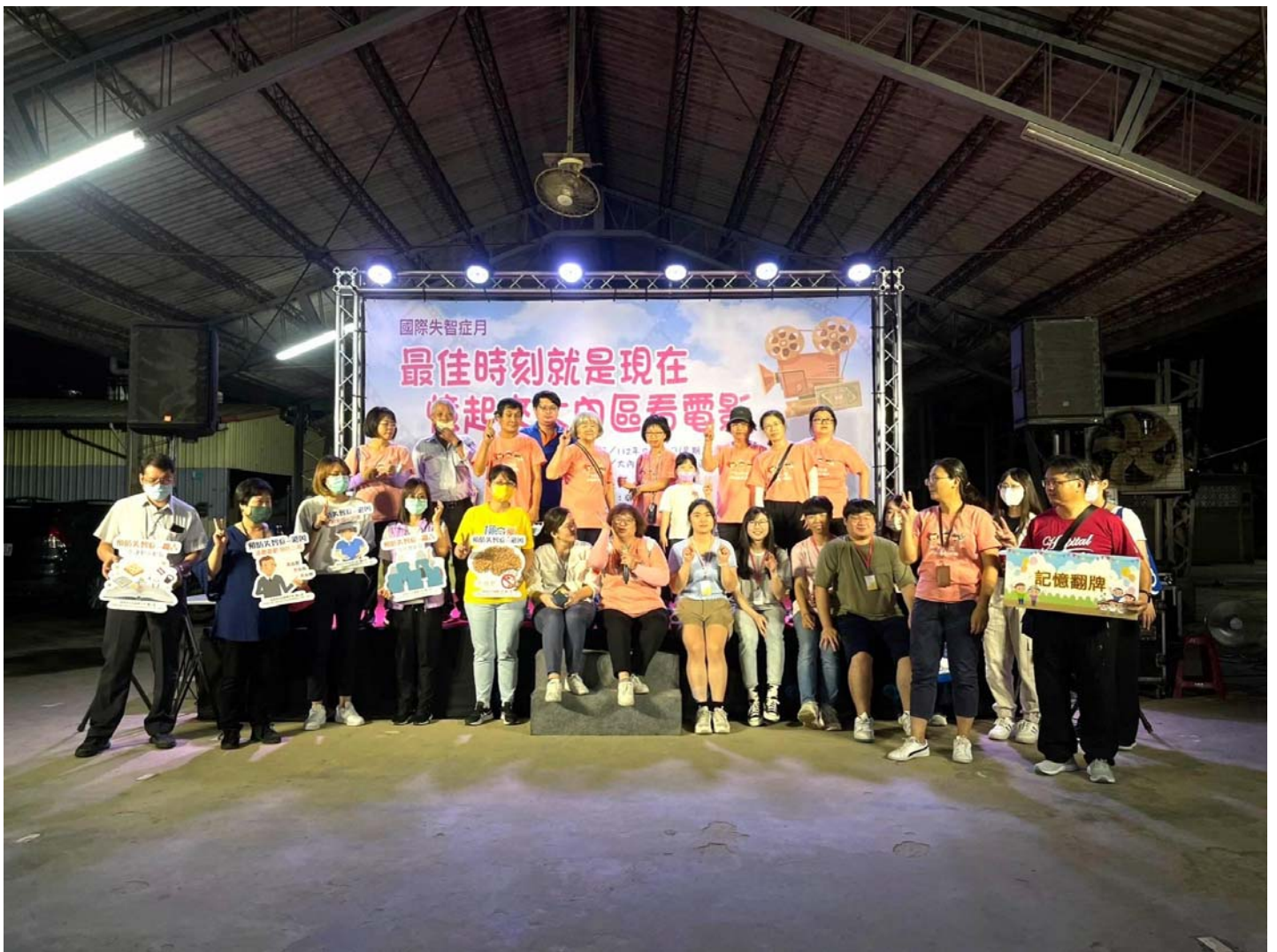
圖：響應國際失智症月，嘉藥攜手衛生局在大內區舉辦憶起來看電影活動。

【記者黃鐘毅 / 台南報導】響應國際失智症月，南市府衛生局與嘉南藥理大學合作，在大內區舉辦「最佳時刻就是現在～憶起來大內區看電影」，並