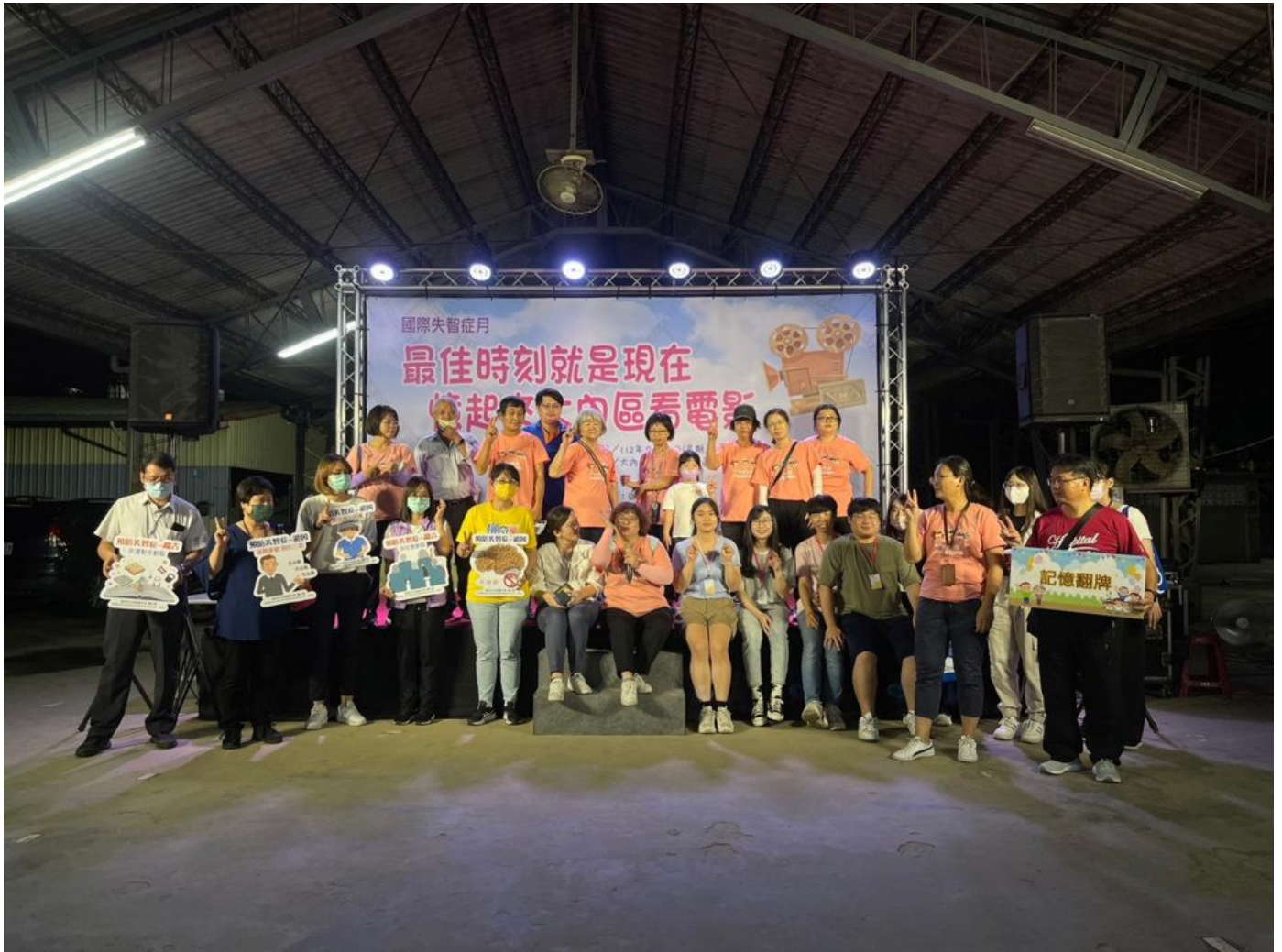
嘉南藥理大學藥理學院與臺南市政府衛生局辦理「最佳時刻就是現在～憶起來大內區看電影」活動

嘉南藥理大學藥理學院響應國際失智症月與臺南市政府衛生局於近日在南市大內區辦理「最佳時刻就是現在～憶起來大內區看電影」。嘉藥藥理學院師生成立食藥粧嘉團隊，設計一系列闖關活動提升社區民眾對失智症的認識，期盼能盡早預防失智發生，打造充滿希望的失智友善社會。