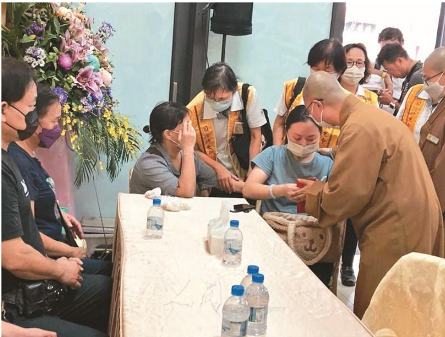
佛光山屏東講堂住持永嚴法師，前往靈前上香及安慰家屬。