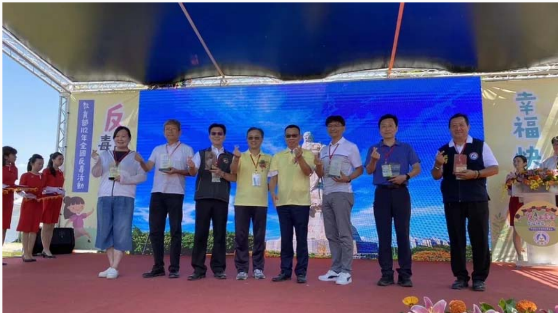
嘉南藥理大學今再獲教育部頒校園反毒績優學校。