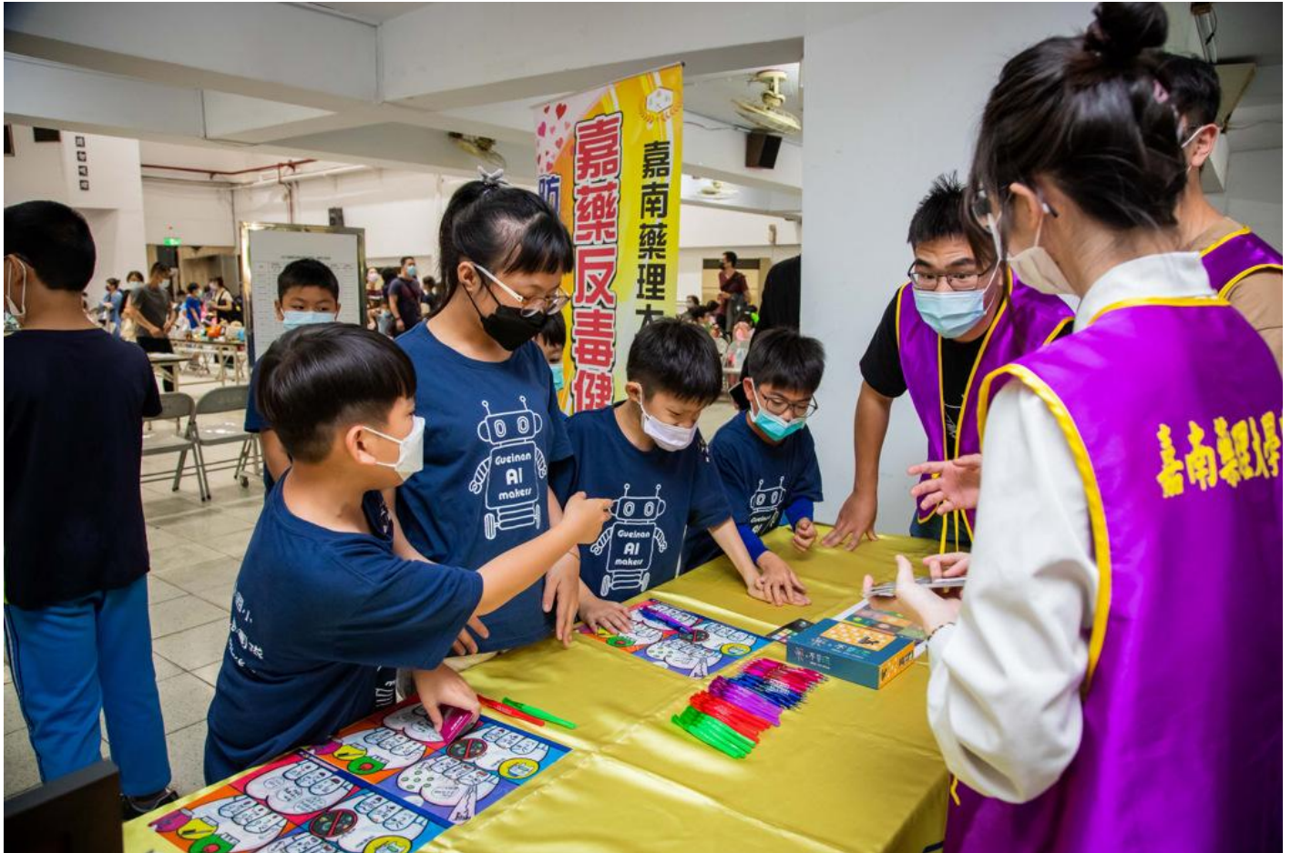
嘉南藥理大學再獲教育部頒校園反毒績優學校。

嘉南藥理大學推動「防制學生藥物濫用」工作不遺餘力，透過桌遊、反毒九宮格及反毒AI機器人競賽等寓教於樂的方式，將防制藥物濫用的意識深化校園，今年再度獲得教育部評鑑為全國大專院校「防制學生藥物濫用」績優學校，這已經是嘉藥連續7年獲教育部評鑑為全國大專院校績優學校，更是累積第13度獲獎，全校師生倍感振奮，彰顯嘉藥在防制學生藥物濫用上的深耕與效果。