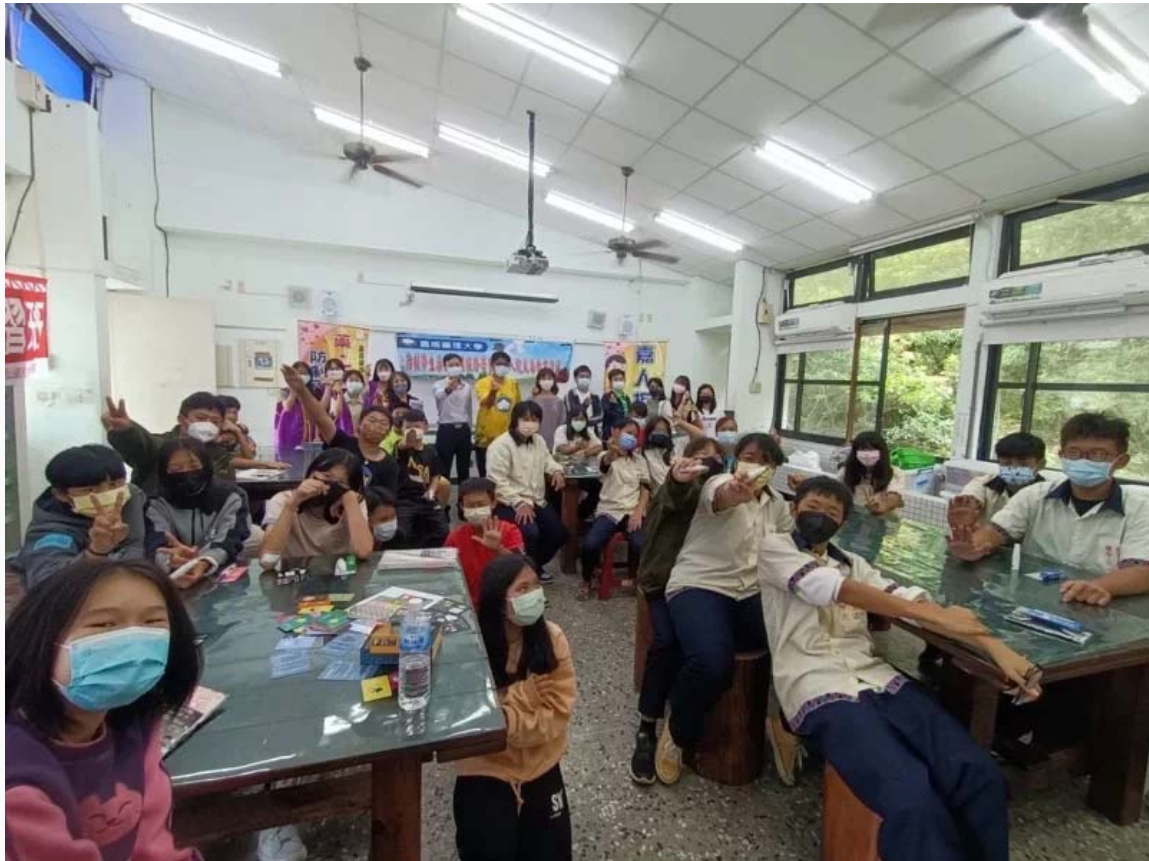
嘉南藥理大學今再獲教育部頒校園反毒績優學校。記者周宗禎 / 翻攝