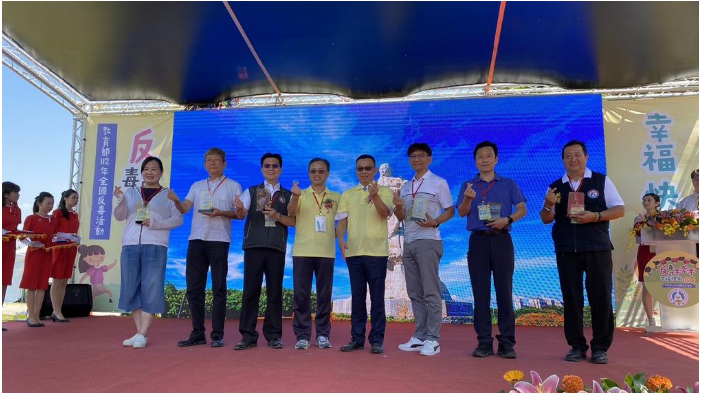
嘉南藥理大學再獲教育部頒校園反毒績優學校。