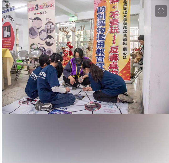
嘉藥每年舉辦反毒AI機器人競賽以寓教於樂方式宣導防治藥物濫用

毒品藥物濫用對學生傷害巨大，一旦沾染上可能要賠上大半輩子前途，毒品傳播管道推陳出新，漸漸向年幼學子伸出魔爪，讓人膽戰心驚，嘉藥紫錐花反毒社結合校內資源，與教育部、衛福部、南市衛生局和警察局等政府機構攜手合作，舉辦多元教育宣導活動，如：反毒AI機器人競賽、拒毒萌芽反毒桌遊、校外反毒宣導等活動，吸引近6仟人次參與，其中反毒宣導品除搭配新冠防疫製作乾洗手，另還有擴香石及串珠等療癒宣導品，讓反毒不只寓教於樂也更生活化。