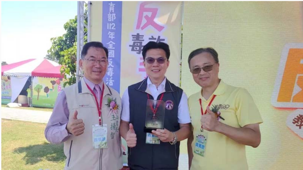
嘉南藥理大學今再獲教育部頒校園反毒績優學校。