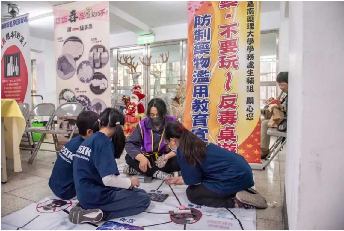
嘉南藥理大學今再獲教育部頒校園反毒績優學校。