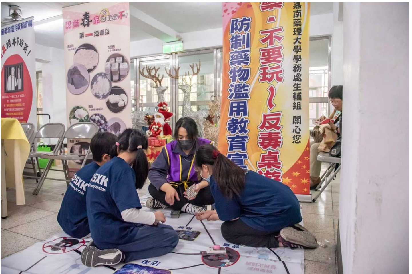
圖：嘉藥每年舉辦反毒AI機器人競賽以寓教於樂方式宣導防治藥物濫用。