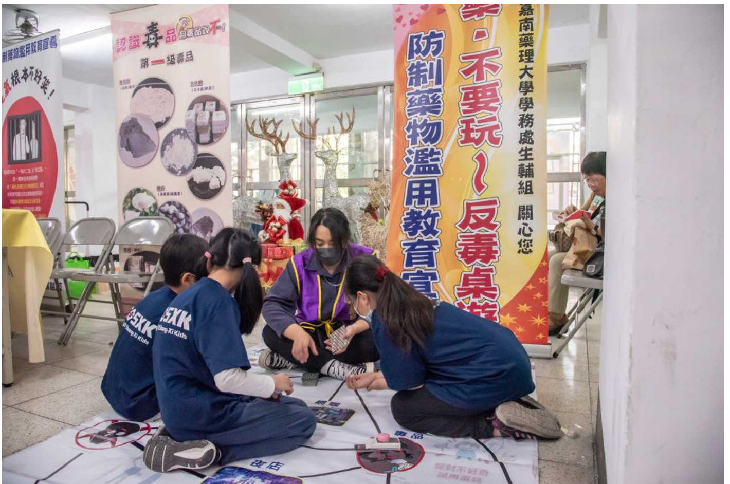
嘉南藥理大學再獲教育部頒校園反毒績優學校。