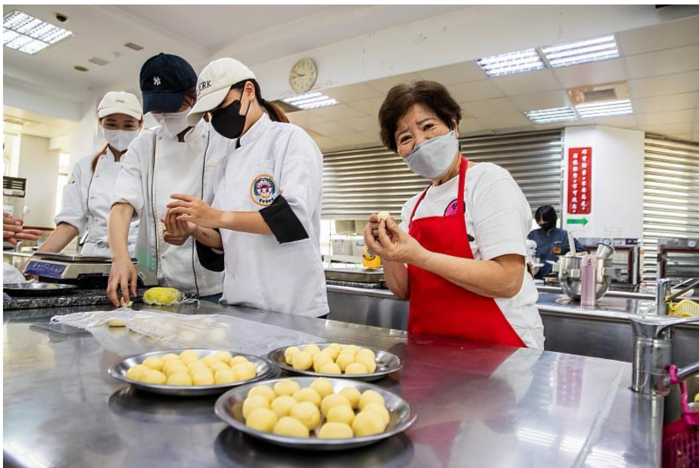
高齡85歲的小蘋果阿嬤也參與酪鬆餅的製作

參與「青銀一起來 手作烘焙營」高齡85歲的小蘋果阿嬤分享到，平常在家很常吃酪梨，但第一次嘗試酪梨做成點心，感覺很新奇，在大學生的帶領下完成的酪鬆餅，讓他成就感十足，還可以外帶回去跟自己的家人分享。負責帶領長輩製作酥餅的烘焙團隊學生說到，這是他們第一次帶領阿公阿嬤製作中式點心，每位長輩們雖都有幾十年的烹煮經驗，但桿捲、包餡都是第一次嘗試，過程中每位長輩在學習新事物時都十分用心及專注，讓他們深受感動也期許自己未來也可以像樂齡長輩一樣有著活到老學到老的精神。