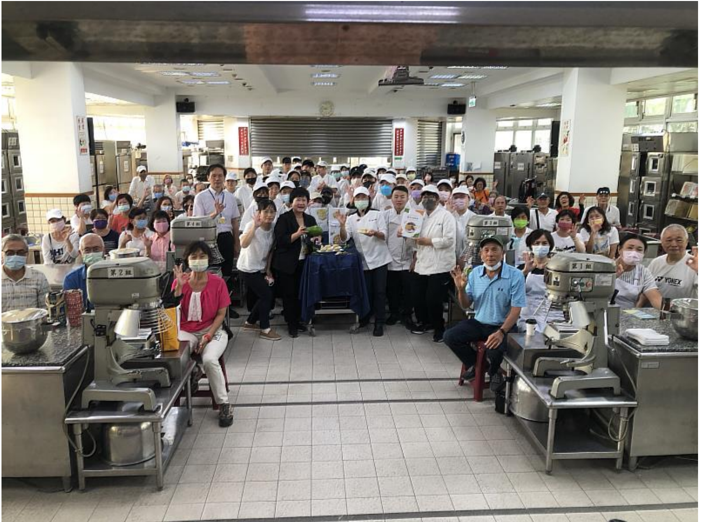
嘉藥USR計畫 青銀一起來研發酪梨新吃法

(中央社訊息服務20231016 09:38:38)嘉南藥理大學為推廣食農教育體驗，將農特產增值產品推廣給更多人知道，10月13日在校內烘焙教室舉辦「青銀一起來 手作烘焙營」活動，由餐旅系48位烘焙模組同學帶領著40位樂齡大學的長輩，利用臺南大內區農產品 - 酪梨，製作出嘉藥獨創的「酪鬆餅」，推廣酪梨新吃法，讓不敢嘗試酪梨的人有更多的選擇。