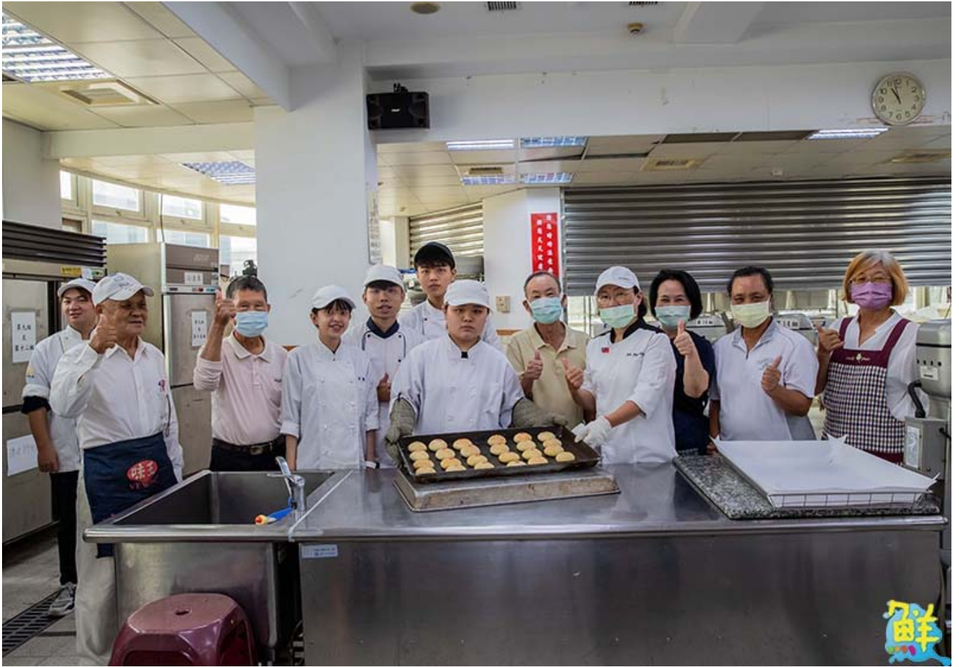
▲嘉藥USR計畫 青銀一起來做出嘉藥牌酪鬆餅