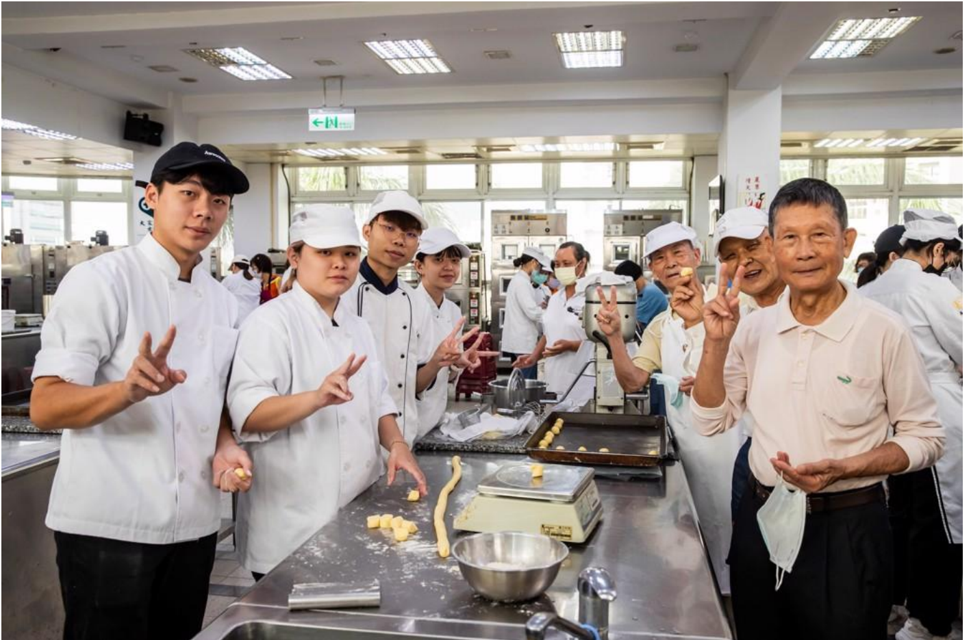
「青銀一起來 手作烘焙營」於嘉藥餐旅大樓辦理

嘉南藥理大學為推廣食農教育體驗，將農特產加值產品推廣給更多人知道，今日在校內烘焙教室舉辦「青銀一起來 手作烘焙營」活動，由餐旅系烘焙模組同學帶領著40位樂齡大學的長輩，利用臺南大內區農產品 - 酪梨，製作出嘉藥獨創的「酪鬆餅」，推廣酪梨新吃法，讓不敢嘗試酪梨的人有更多的選擇。