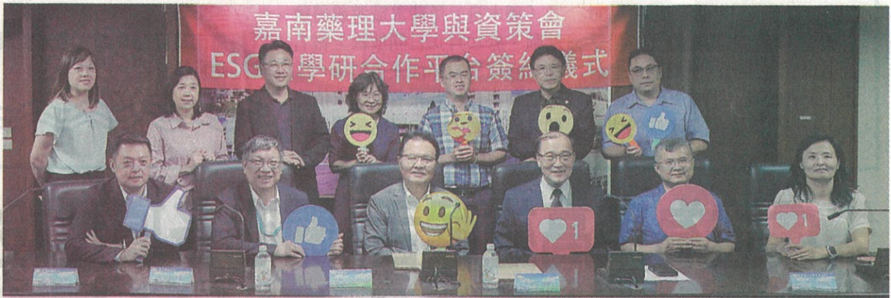
嘉藥與資策會共創ESG永續發展新里程為台灣永續發展培育關鍵人才。