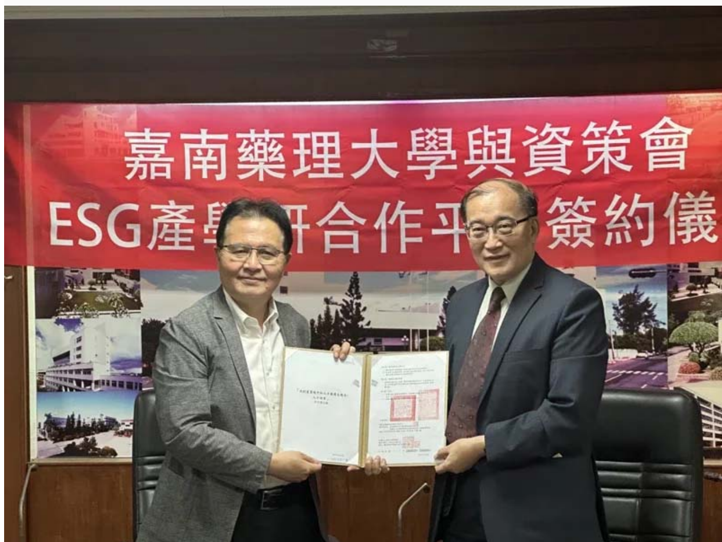
嘉南大學資策會簽訂策略合作備忘錄，培育ESG關鍵人才。