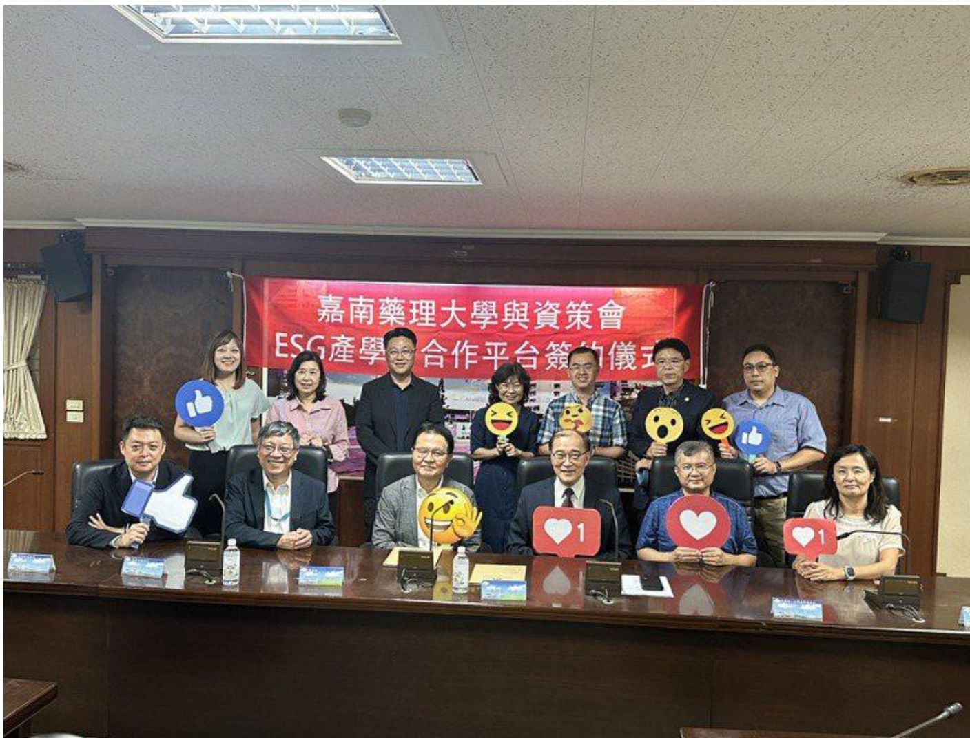
嘉南大學資策會簽訂策略合作備忘錄，培育ESG關鍵人才。