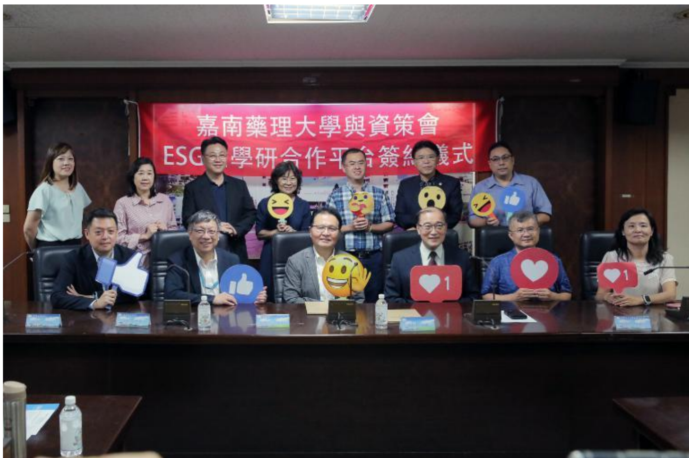
▲嘉藥與資策會共創ESG永續發展新里程。