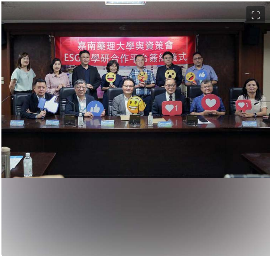
嘉藥與資策會共創ESG永續發展新里程

資策會數位教育研究所將利用多年深耕人才培訓的經驗，為「ESG永續發展產學研合作平台」提供人才認證、專業指引及媒合服務，確保台灣的永續發展人才在接受實務訓練後，能得到資策會的認證與指引，並在國際舞台上展現卓越表現。