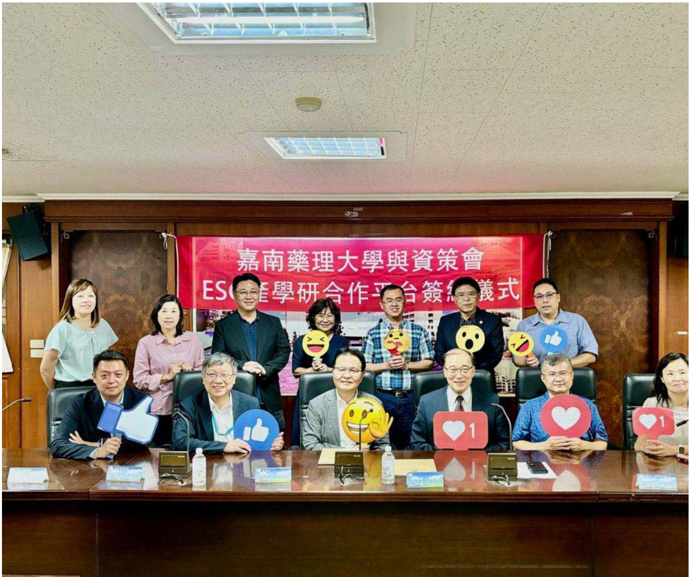
嘉南藥理大學與資策會簽署「ESG永續發展產學研合作平台」的策略合作備參與儀式貴賓合影。