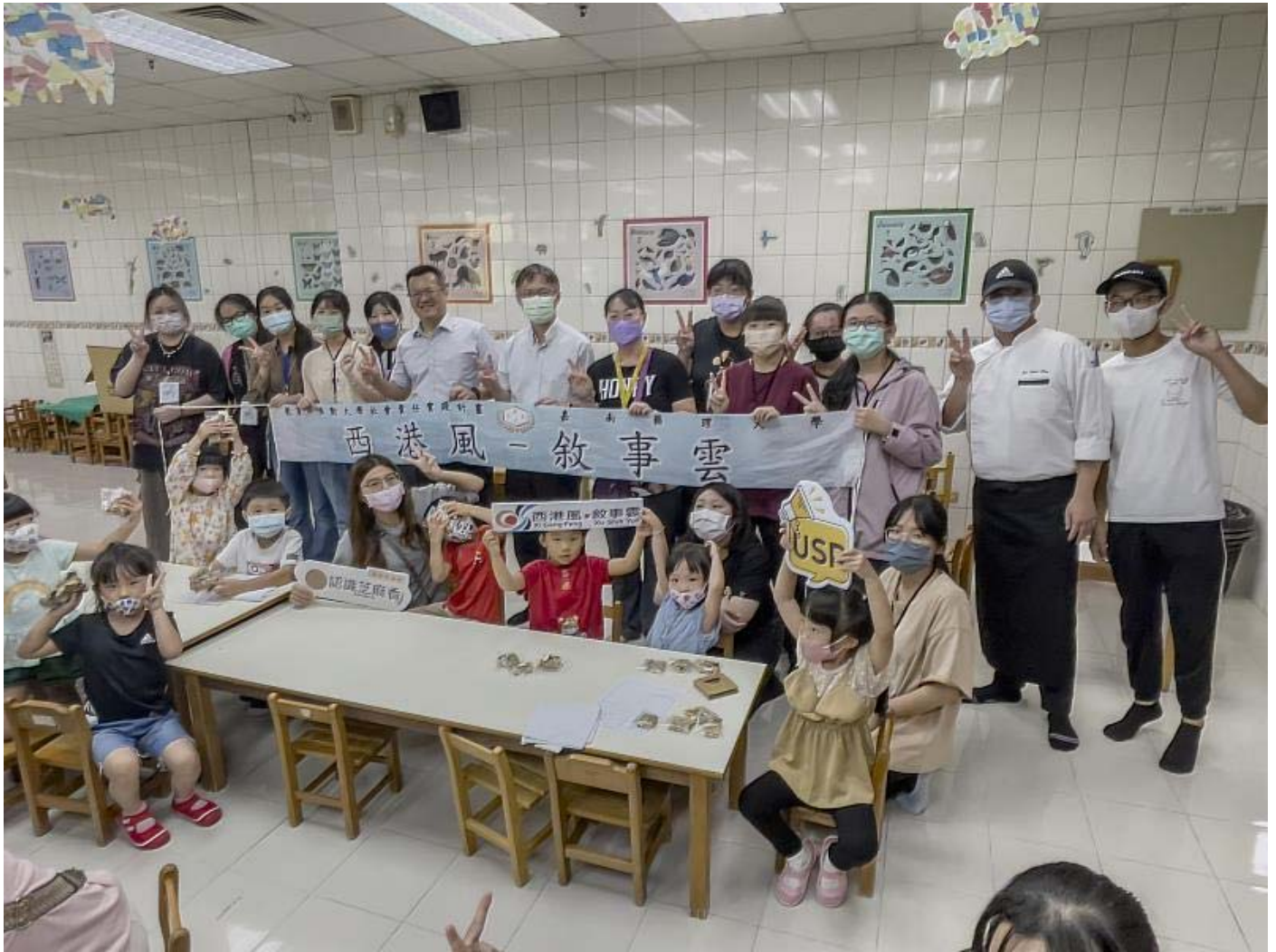
嘉藥USR團隊舉辦認識芝麻香 - 食農教育體驗營