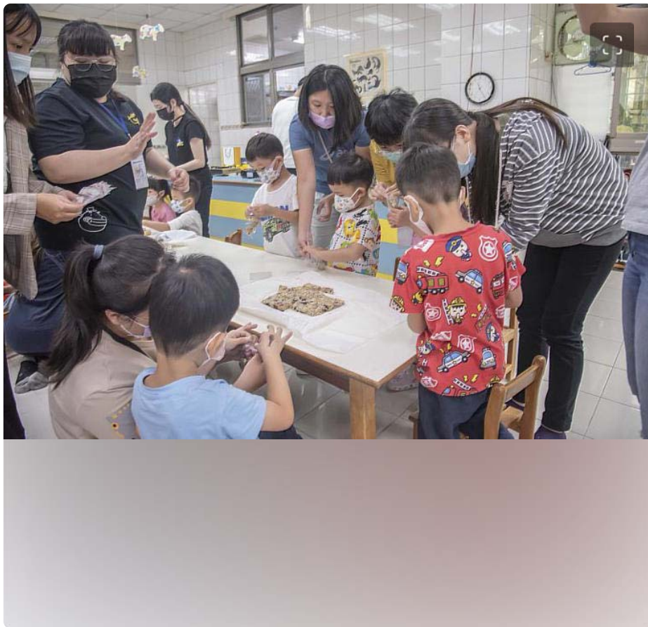
小朋友開心動手製作芝麻雪Q餅

智慧生活學院薛雅明院長表示，認識芝麻香 - 食農教育體驗活動除了結合大學生課程所學外，也增進同學們的實作能力，更彰顯了嘉藥學生將所學的知識技術連結食農教育活動並做創意應用的具體表現，而本次教材也將保留做為西港學校的特色教材，讓同學們共同參與社區營造及創新實踐，善盡大學社會責任，永續當地的文化。