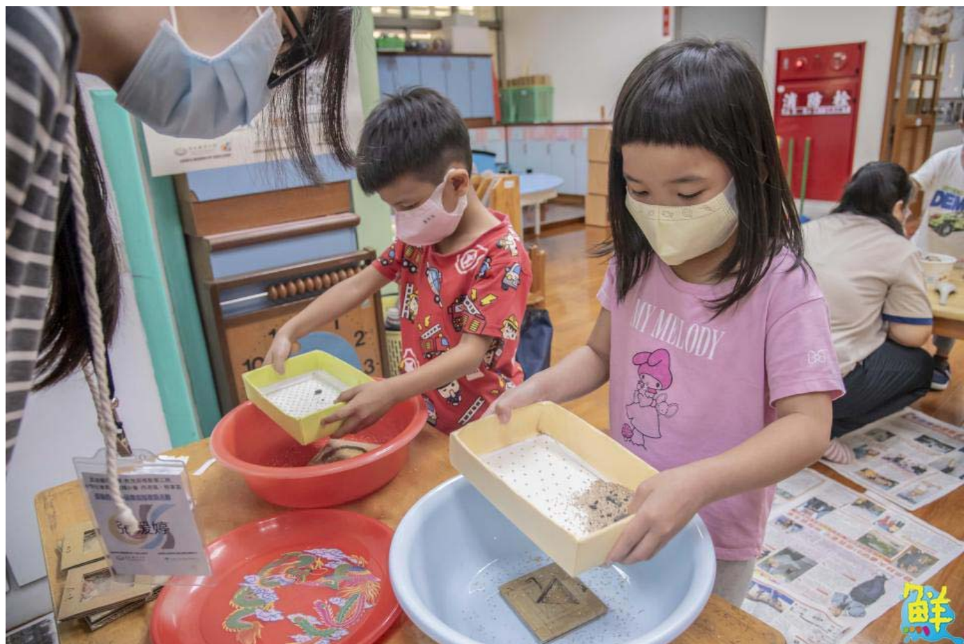
▲芝麻搬運工遊戲幫助訓練小朋友手部肌力