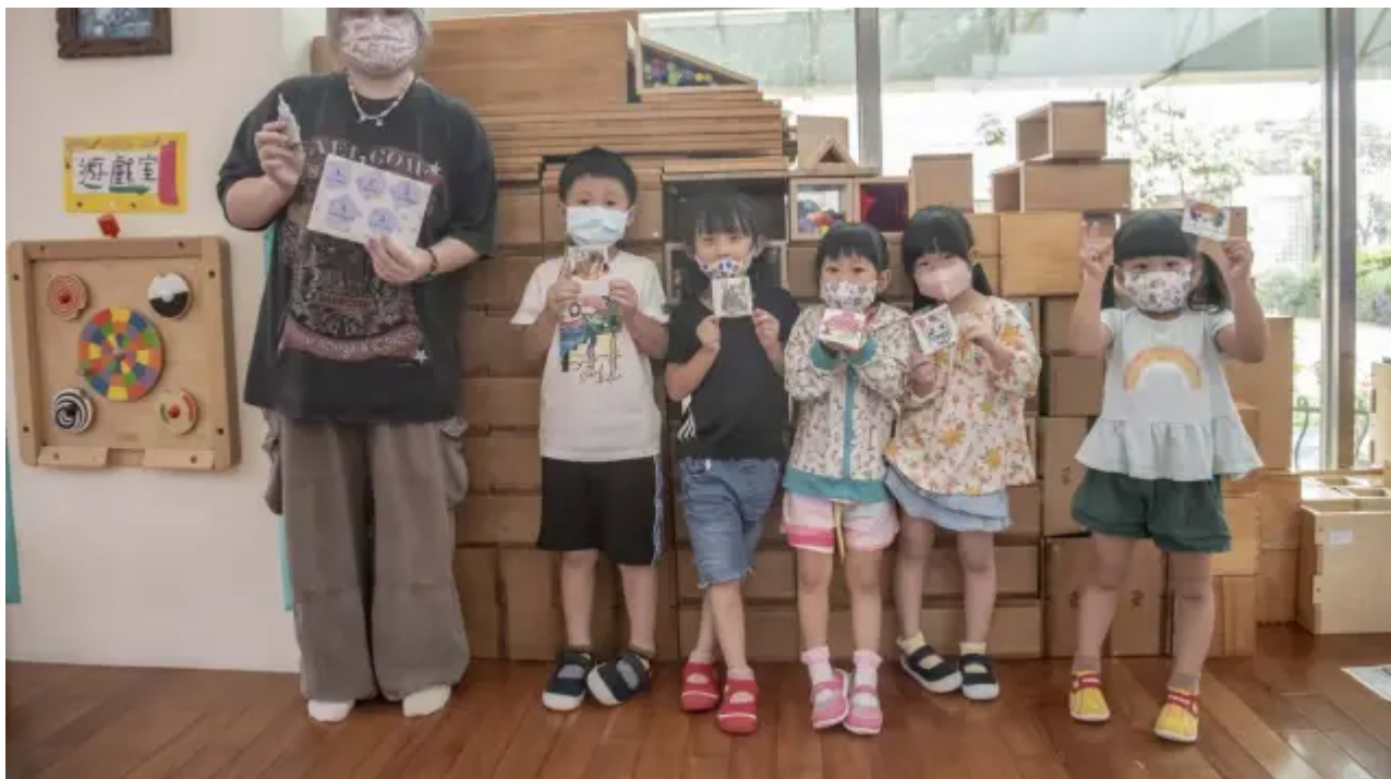
（圖說）小朋友開心拿著成品與大姊姊合照。（記者鄭德政攝）

智慧生活學院薛雅明院長表示，認識芝麻香－食農教育體驗活動除結合大學生課程所學外，也增進同學們的實作能力，更彰顯嘉藥學生將所學的知識技術連結食農教育活動並做創意應用的具體表現，而本次教材將保留做為西港學校的特色教材，讓同學們共同參與社區營造及創新實踐，善盡大學社會責任，永續當地的文化。