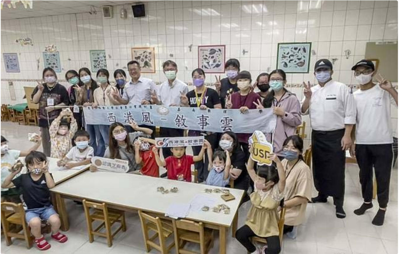
嘉藥USR團隊舉辦認識芝麻香 - 食農教育體驗營。