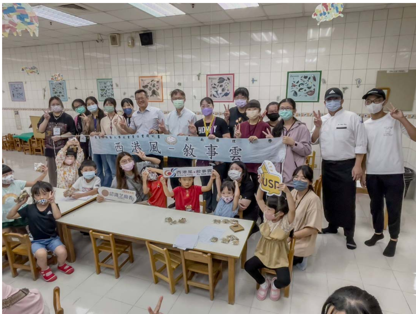
圖：嘉南藥理大學舉辦「食農教育體驗營」，透過遊戲教材及闖關遊戲，帶領小朋友認識芝麻產業。