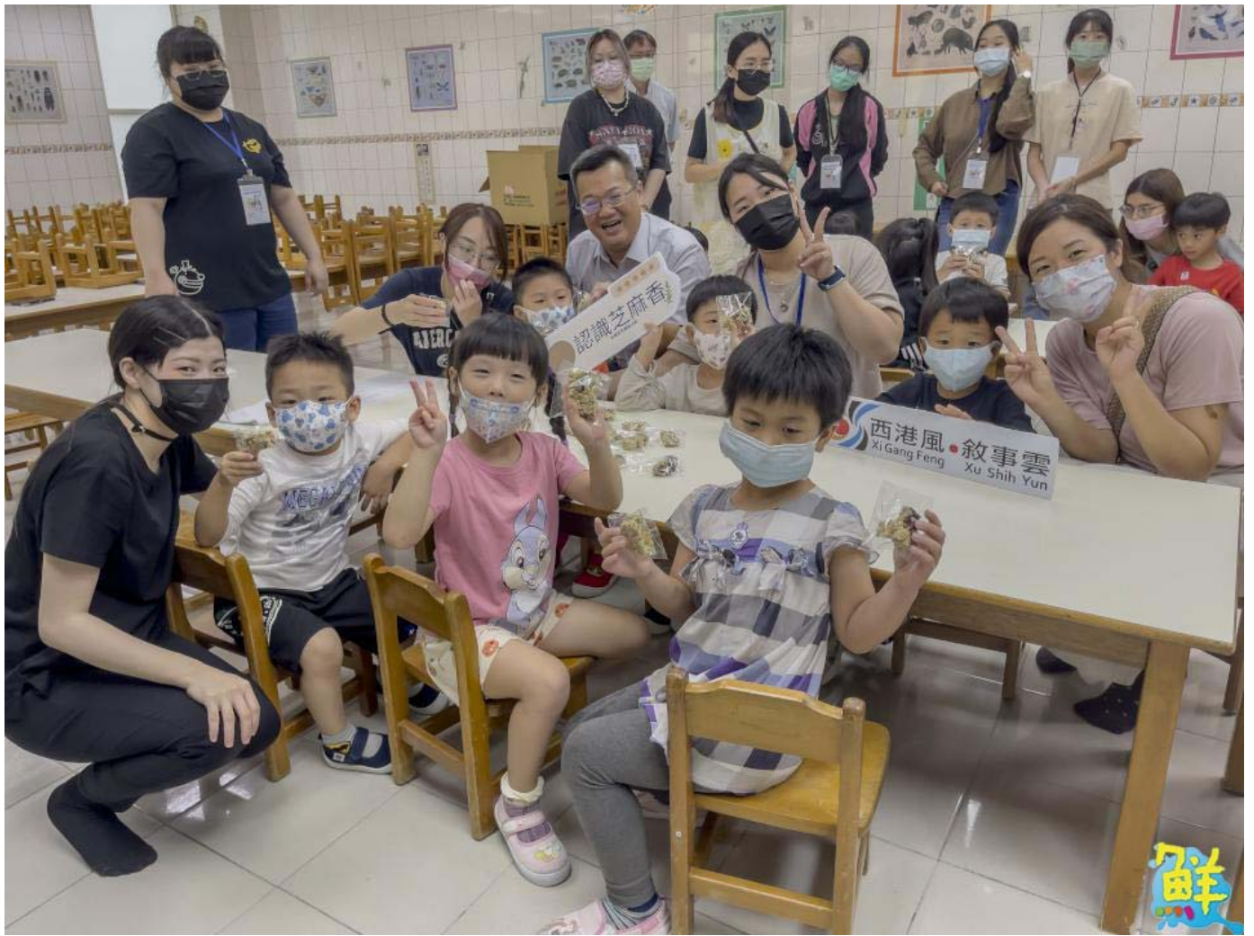
▲活動結束後小朋友各個知識滿分且收穫滿載