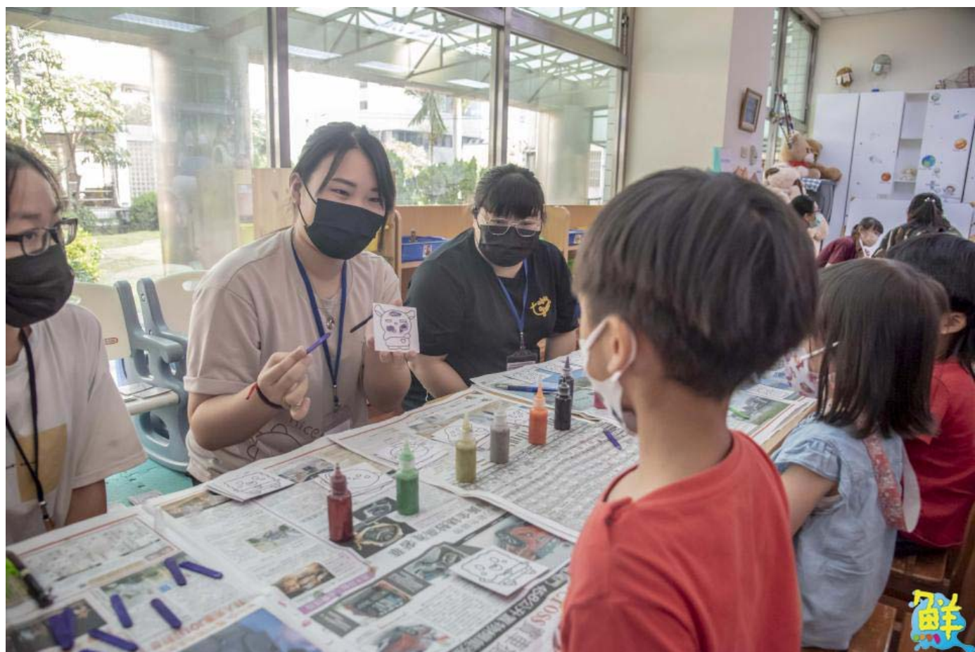
▲嘉藥幼保系學生用心解說闖關內容