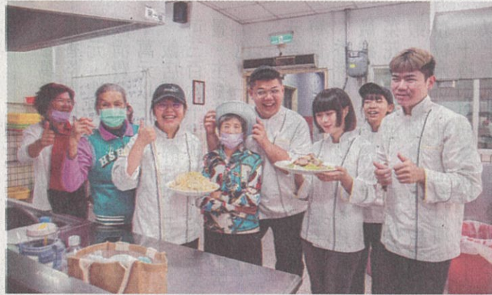
↑青銀共享麻油好料理。