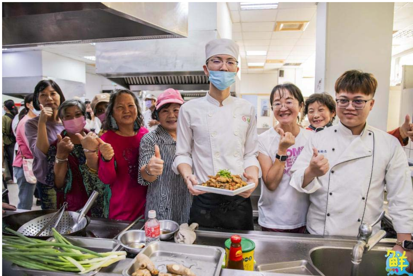
▲長輩們對於嘉藥餐旅生手藝讚不絕口