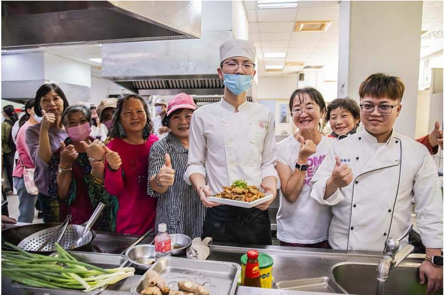
長輩們對於嘉藥餐旅生手藝讚不絕口