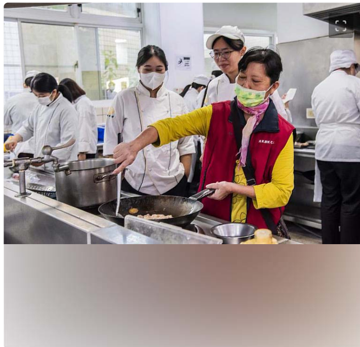
西港區長輩忍不住技癢一同下廚與嘉藥餐旅生「尬廚藝」

餐旅系陶同學表示，平常在家練習只有一位阿嬤給予指導，今天現場有著這麼多位阿嬤在「監督指導」，雖然讓他備感壓力，但每位阿嬤的熱心教導並展現自己幾十年甚為老練的廚藝技巧，讓他獲益良多。