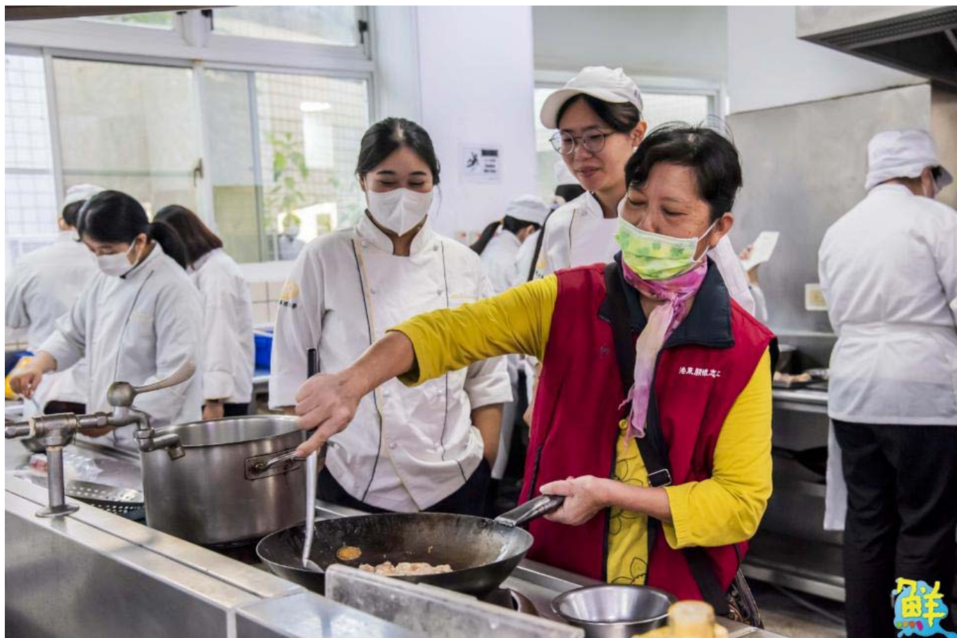
▲西港區長輩忍不住技癢一同下廚與嘉藥餐旅生「尬廚藝」