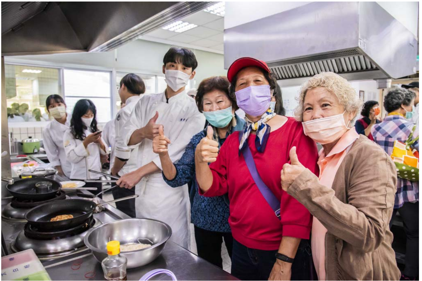
「古早味麻油料理宴」邀請社區長輩一同品嘗。