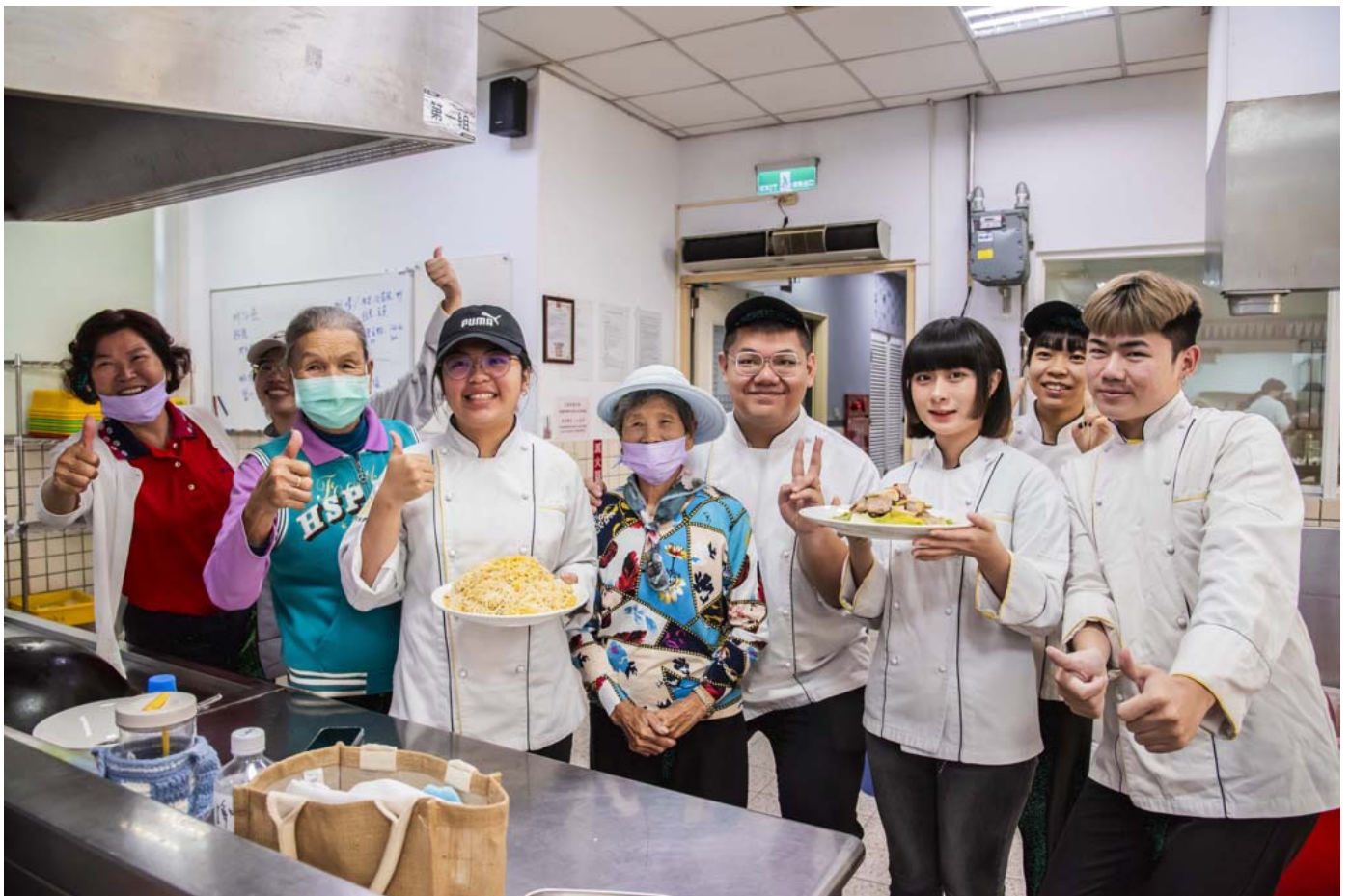
「古早味麻油料理宴」邀請社區長輩一同品嘗。