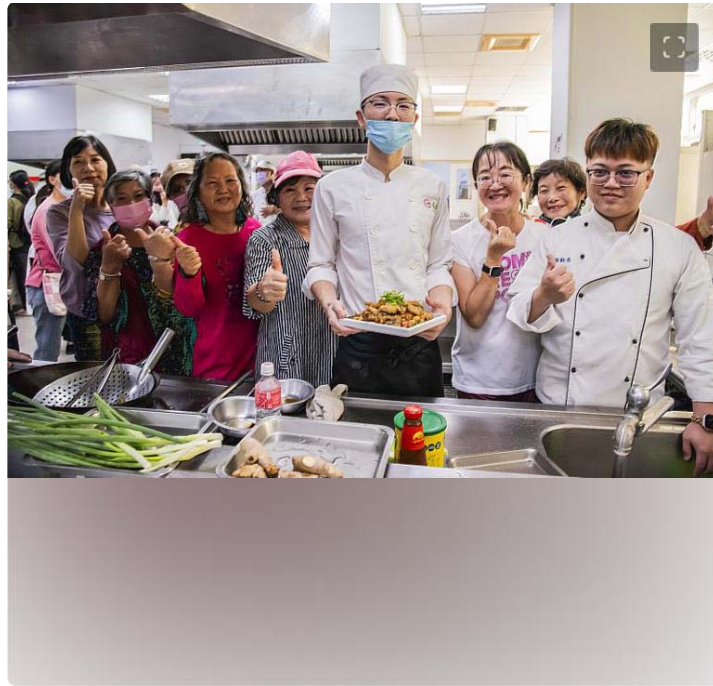
長輩們對於嘉藥餐旅生手藝讚不絕口