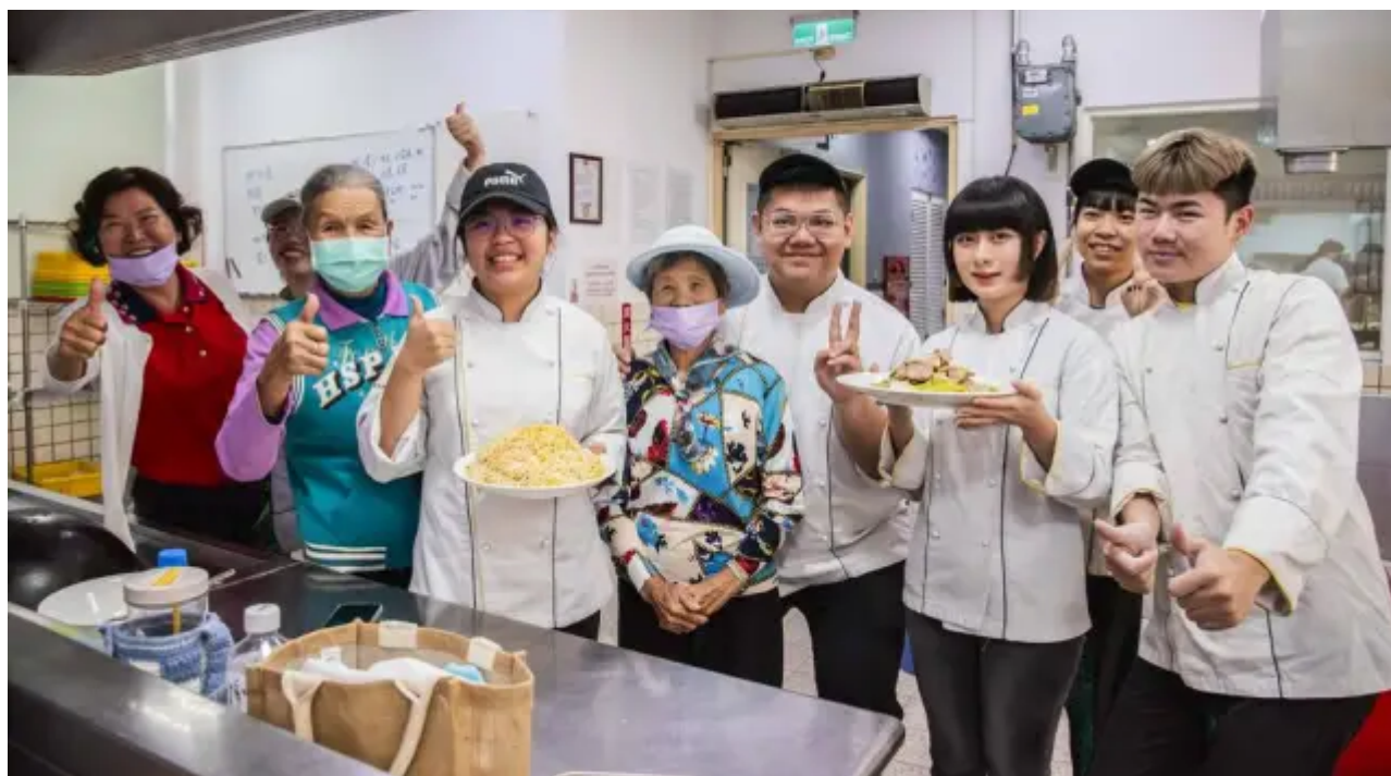
（圖說）嘉南藥理大學「西港風·敘事雲」USR計畫團隊攜手餐旅系學生，22日在校內辦理一場「古早味麻油料理宴」，邀請西港區30幾位廚藝志工與社區長輩一同料理品嘗。