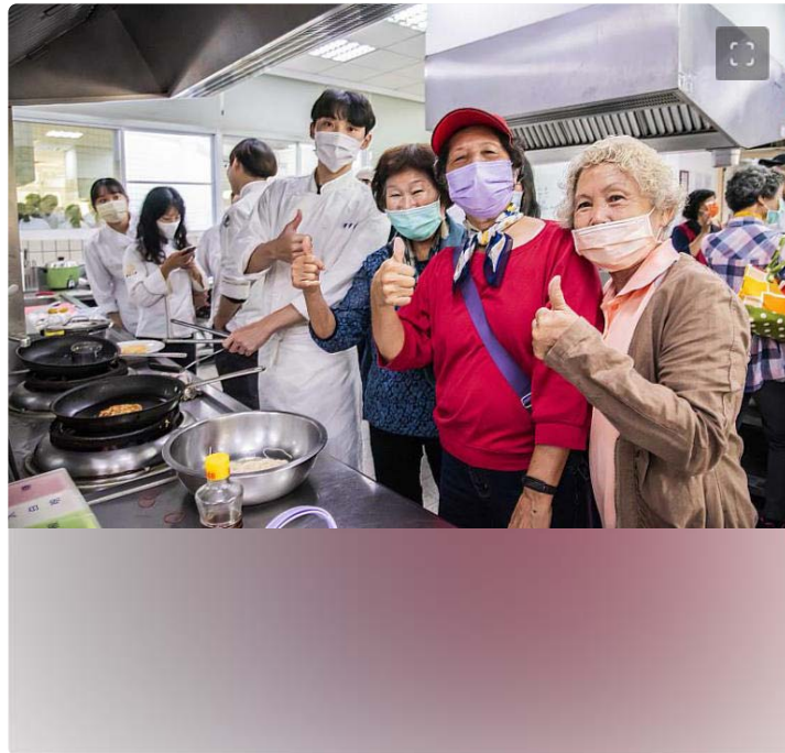
西港長輩們表示到大學中餐教室體驗同學上課過程感到新鮮有趣

(中央社訊息服務20231127 09:26:13)嘉南藥理大學「西港風·敘事雲」USR計畫團隊攜手餐旅系學生22日在校內辦理一場「古早味麻油料理宴」，邀請西港區30幾位廚藝志工與社區長輩一同品嚐，長輩看著餐旅系學生大展身手之際，也忍不住技癢一同下廚「尬廚藝」，青銀世代分享著烹煮麻油料理的技巧，在天氣逐漸變冷的季節裡，吃著熱騰騰的料理不僅暖胃也暖心。