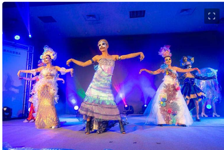
「塑淨」以環保議題為主採歌舞劇方式呈現

靜態展精彩細膩，涵蓋了粧品領域的三大要素：研發、行銷、與整體造型設計。整場展覽共展出88件令人驚艷的作品，包括師生攜手打造的創新化粧品技術、原料與產品，精心呈現的靜態彩妝圖紙、對消費者行為深入探討的研究成果，具前瞻性的化粧品創意行銷策略，另外，靜態展示的一大亮點便是動態展演舞台上獨特設計與製作的服裝造型及頭飾道具，展現不同風格的時尚設計與手工藝的精湛工藝。