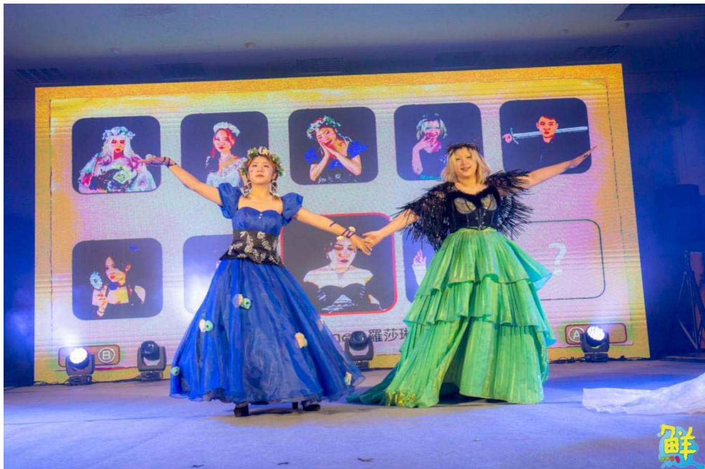
▲「時空幻境」以童話故事為主軸打造時空幻境的視覺饗宴