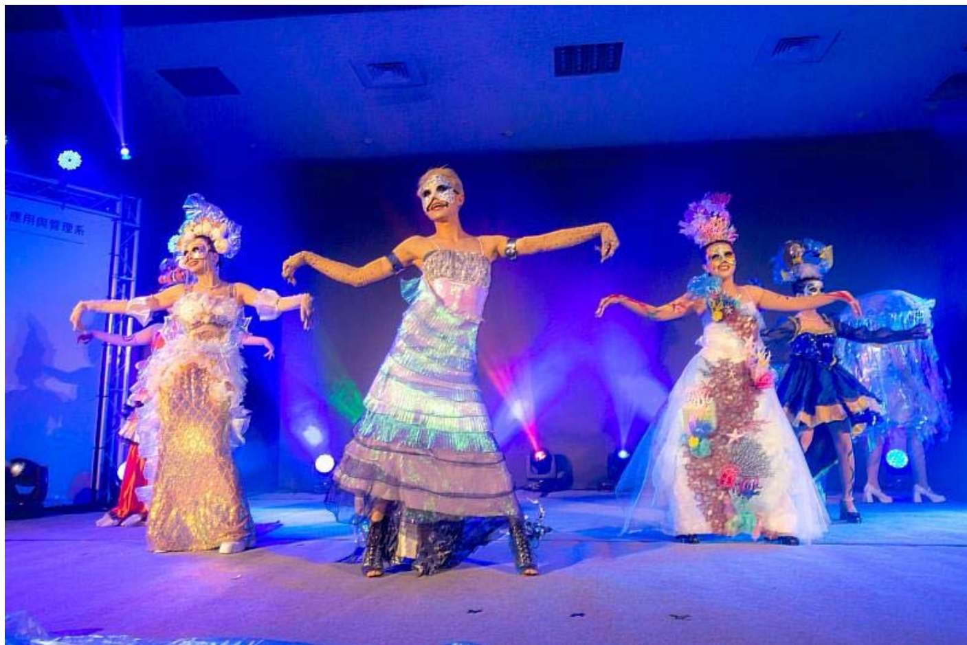
「塑淨」以環保議題為主採歌舞劇方式呈現

靜態展精彩細膩，涵蓋了粧品領域的三大要素：研發、行銷、與整體造型設計。整場展覽共展出88件令人驚艷的作品，包括師生攜手打造的創新化粧品技術、原料與產品，精心呈現的靜態彩妝圖紙、對消費者行為深入探討的研究成果，具前瞻性的化粧品創意行銷策略，另外，靜態展示的一大亮點便是動態展演舞台上獨特設計與製作的服裝造型及頭飾道具。現場更呈現了精油香水調香獲獎14件作品，為整場展覽增色不少。參觀民眾將在這次動靜態展覽中體驗到化粧品領域的多元魅力，不僅是科技創新的展現，更是對於藝術與時尚的完美結合，讓人留連忘返，深刻感受到化妝藝術的無窮可能。