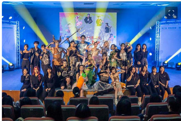
「憶古傳說」為十二生肖重新賦予現代感的生動造型

參觀民眾將在這次動靜態展覽中體驗到化粧品領域的多元魅力，不僅是科技創新的展現，更是對於藝術與時尚的完美結合，讓人留連忘返，深刻感受到化妝藝術的無窮可能。