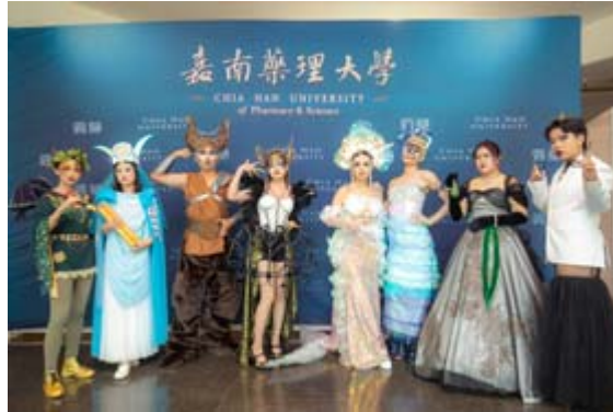
嘉藥粧品系舉辦「謎粧·迷境」畢業成果發表會。

【記者孫宜秋 / 南市報導】嘉南藥理大學化粧品應用與管理系第27屆畢業成果展，於本月15、16日在校內演藝廳，隆重登場，以「謎粧·迷境」為主題，透過謎樣妝容帶您進入迷失的境界，現場除了動態展外，也陳設同學靜態的成果，成果展作品豐富，充分展現學生多元的創作能量。