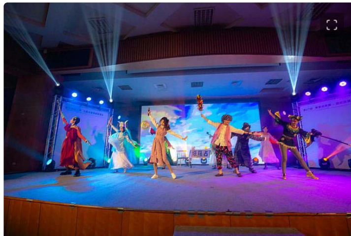
「心鏡」用塔羅牌做為發想以舞台劇方式呈現

境的視覺饗宴。「心鏡」以塔羅牌裡面的各個元素、符號以及象徵意義為發想，顛覆以往動態展走秀模式，改以舞台劇方式呈現，透過問與答的方式及肢體表演呈現生命階段的成長過程。「塑淨」則以環保議題為主軸，以歌舞劇方式呈現，敘述一位男孩的海洋冒險故事，期望喚起人們對環境議題的關注，劇中歌曲及舞蹈都由組員李悅齊剪接編曲。以十二生肖為主題的「憶古傳說」，則融合傳統文化與現代思維，為十二生肖重新賦予現代感的生動造型。