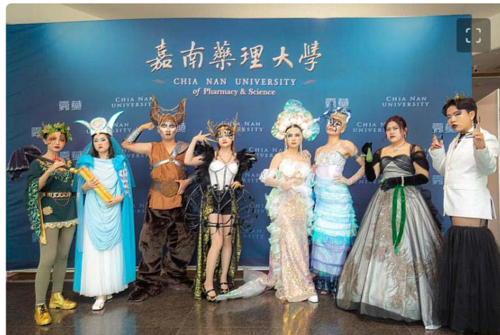
嘉藥粧品系今舉辦「謎粧·迷境」畢業成果發表會

(中央社訊息服務20231218 09:54:48)嘉南藥理大學化粧品應用與管理系第27屆畢業成果展，於本(12)月15、16日在校內演藝廳，隆重登場，以「謎粧·迷境」為主題，透過謎樣妝容帶您進入迷失的境界，現場除了動態展外，也陳設同學靜態的成果，成果展作品豐富，充分展現學生多元的創作能量。