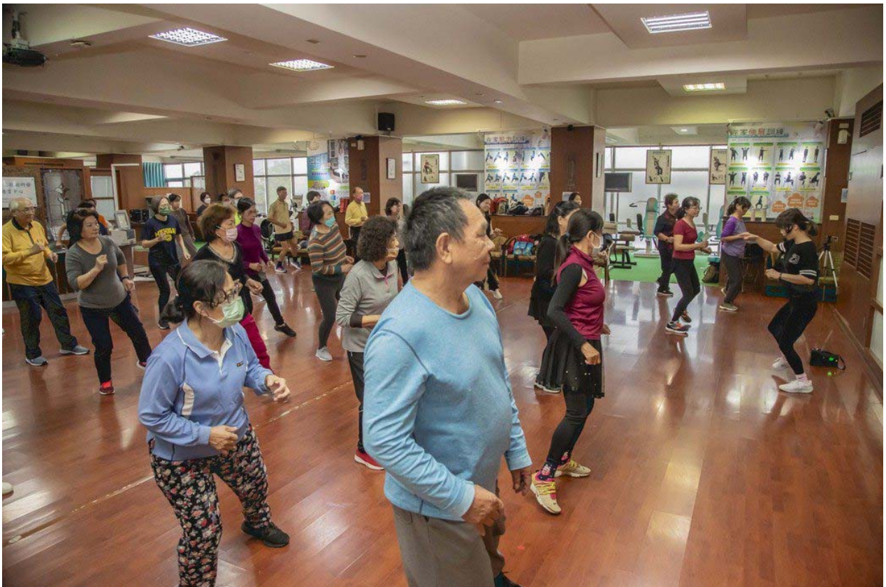
嘉藥聘請專業老師教導銀髮長輩做中高強度的有氧運動。