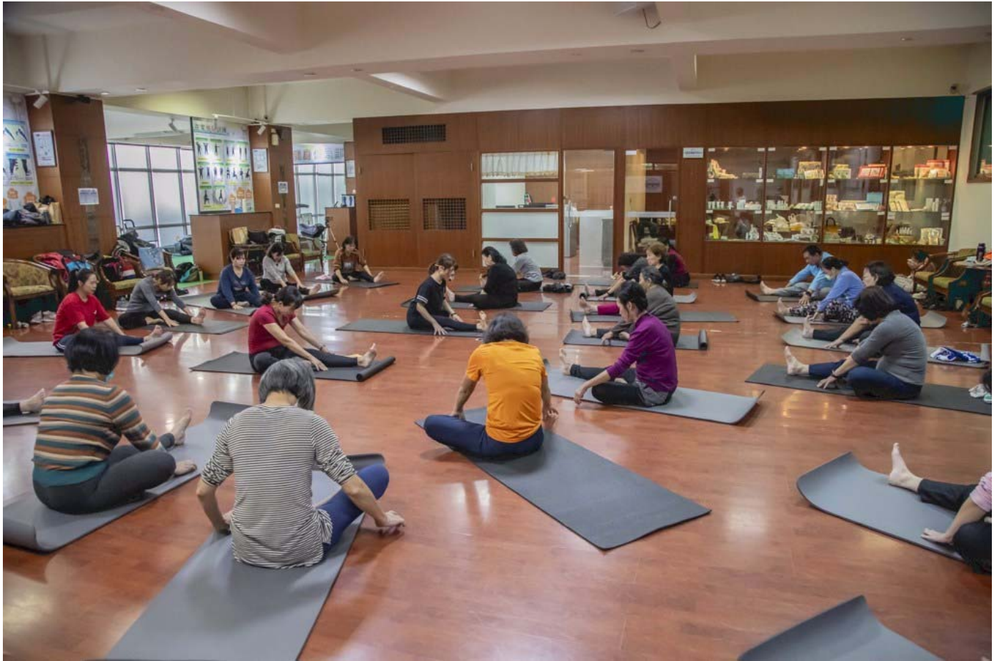
嘉藥銀髮健身俱樂部場地進行相關肌耐力訓練。

嘉南藥理大學「賦能偏鄉社區X築夢幸福家園」USR計畫，日前於校內辦理「銀髮健康促進方案」分享會。會中不僅分享高福系「銀髮俱樂部計畫」執行成果，並提出規劃培訓學生成為健康促進種子人才的願景，未來將進入社區提供為期12周的系列運動指導，為偏鄉社區銀髮長輩帶來全面的健康與福祉提升。