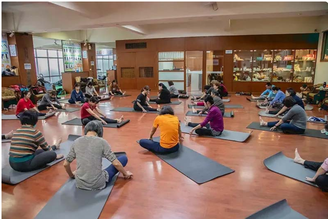
▲嘉藥銀髮健身俱樂部為輔導基地，提供中高強度的有氧、肌力及肌耐力訓練

嘉藥副校長張翊峰表示，此計畫不僅為偏鄉社區的長輩帶來健康福祉，同時也為參與的學生提供了寶貴的實踐經驗與專業技能。這是一個多方受益、共同進步的倡議，展現了大學在服務社區與培育專業人才方面的重大作用。