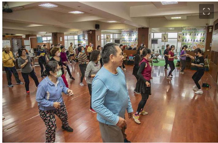
嘉藥聘請專業老師教導銀髮長輩做中高強度的有氧運動