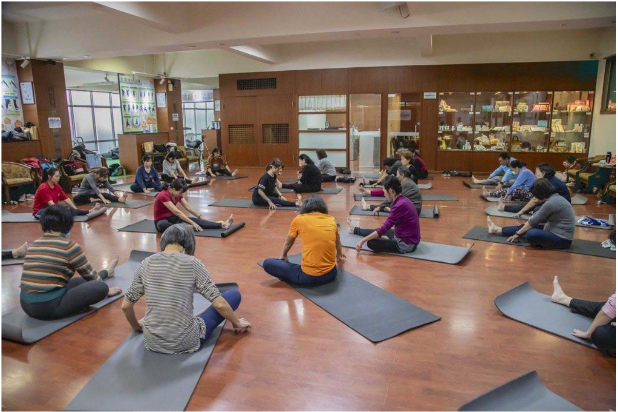
嘉藥銀髮健身俱樂部場地進行相關肌耐力訓練。