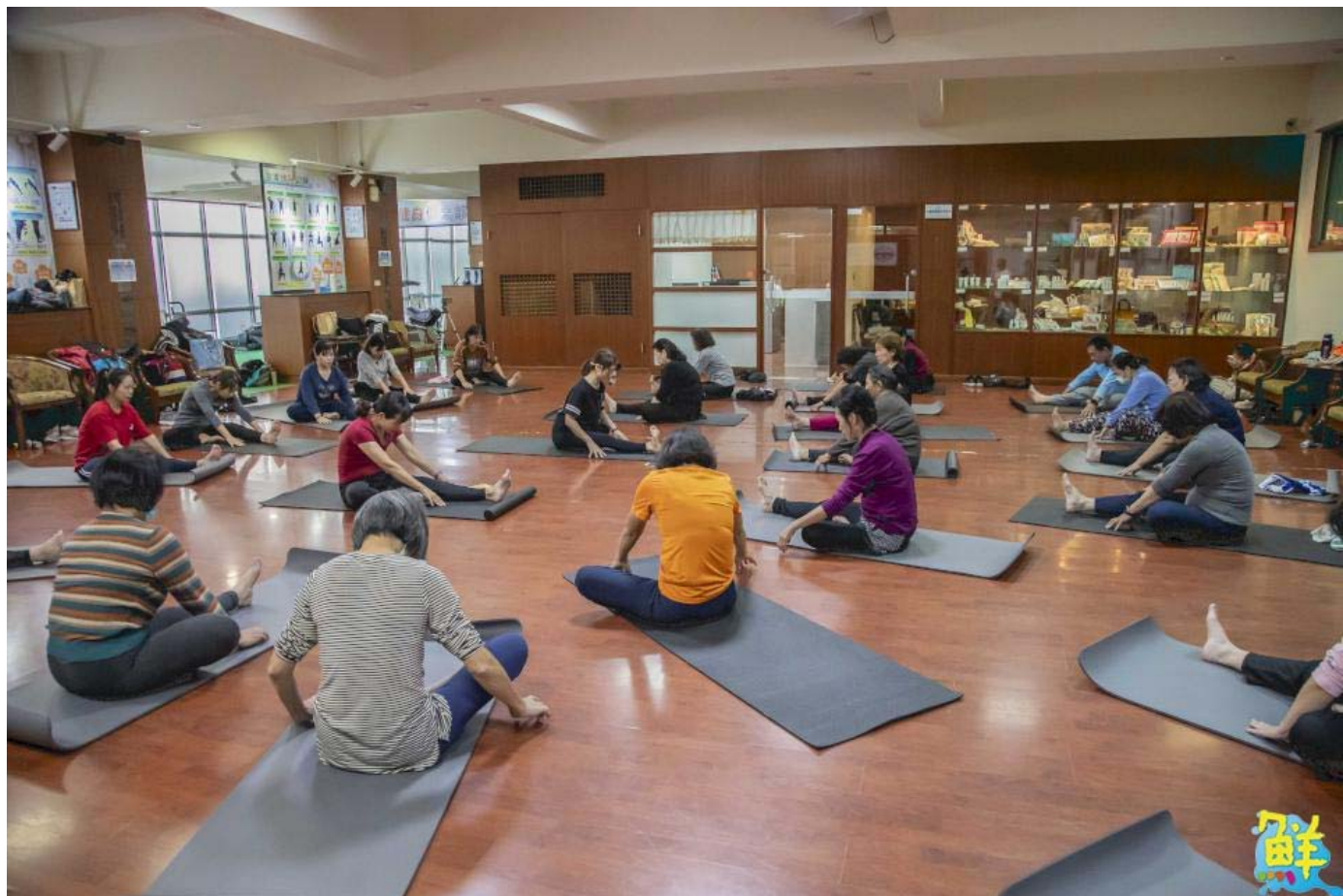
▲嘉藥銀髮健身俱樂部場地進行相關肌耐力訓練