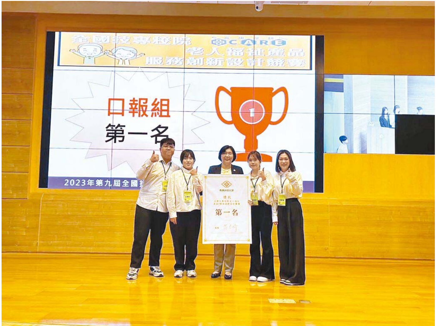
嘉藥創設「沒大沒小來尋寶」遊戲，勇奪全國第一。

嘉南藥理大學高齡福祉養生管理系日前參加全國技專校院老人福祉產品暨服務創新設計競賽，以結合幼兒與老年人共學共玩理念，創設「沒大沒小來尋寶」遊戲，打破傳統遊戲設計界限，獲得評審青睞勇奪全國第一。