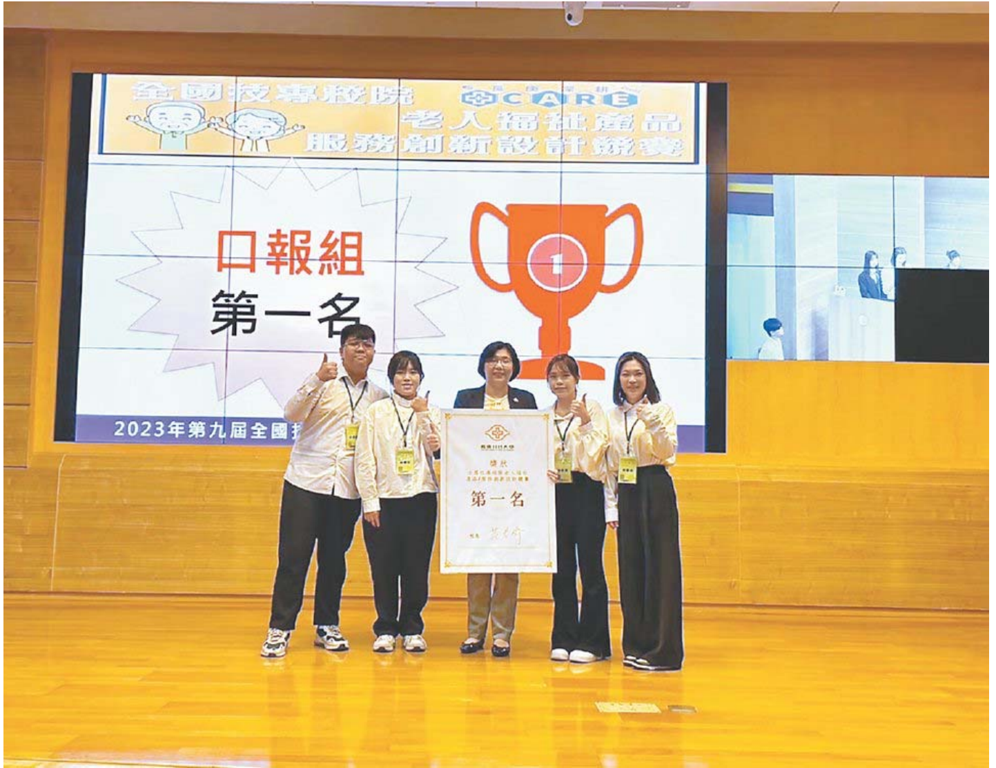
嘉藥創設「沒大沒小來尋寶」遊戲，勇奪全國第一。圖 / 周榮發

嘉南藥理大學高齡福祉養生管理系日前參加全國技專校院老人福祉產品暨服務創新設計競賽，以結合幼兒與老年人共學共玩理念，創設「沒大沒小來尋寶」遊戲，打破傳統遊戲設計界限，獲得評審青睞勇奪全國第一。