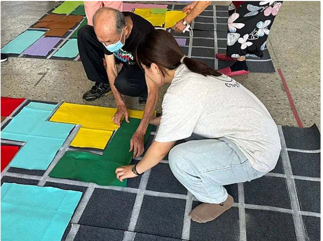
▲遊戲設計內容涵蓋認知活動、動作協調、數字邏輯、空間辨識及合作互動

要素與幼兒感覺統合要素，遊戲內容涵蓋認知活動、動作協調、數字邏輯、空間辨識及合作互動，營造一個促進跨世代互動的遊樂環境。