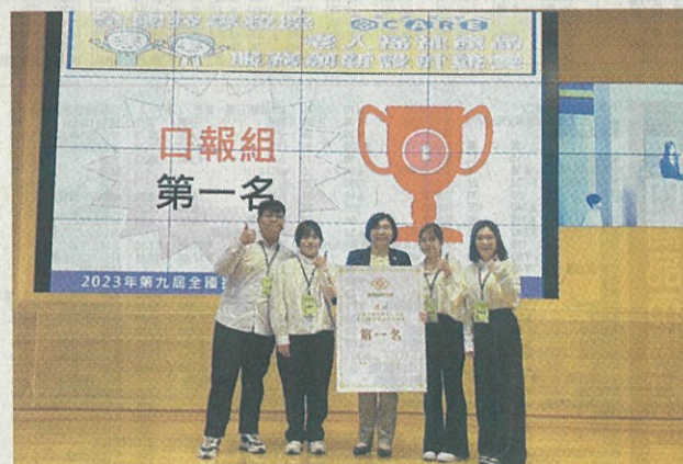
●嘉藥創設「沒大沒小來尋寶」遊戲，勇奪全國第一。

「沒大沒小來尋寶」遊戲中不僅重視娛樂性，更融入教育元素，使幼老共同享受遊戲的樂趣同時提升對於社會關懷與互助的認知；此次競賽獲得第一，也凸顯了嘉南藥理大學在推動高齡福祉相關領域的領先地位。