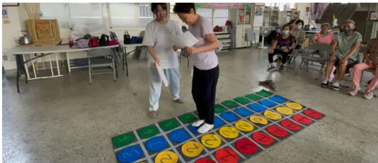
（圖說）社區長輩體驗嘉藥同學設計的大地遊戲。

參加比賽的高福系蔡同學表示，設計遊戲過程中了解到現在幼兒與長輩間缺乏互動關係，小孩多數依賴3C保母，於是便想出要提升長輩與幼兒互動為主的遊戲，製作完成後也實際到社區邀請長輩們體驗，很開心初次參加比賽就獲得好成績，讓她在高齡服務的這條路上更增信心。