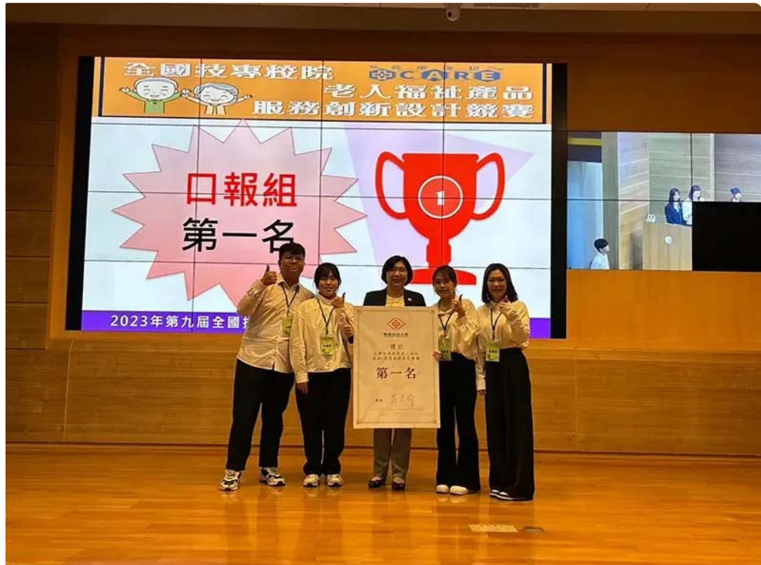
▲嘉南藥理大學高齡福祉養生管理系設計「沒大沒小來尋寶」的創意遊戲獲2023全國技專校院老人福祉產品暨服務創新設計競賽全國第一

[NOWnews今日新聞] 嘉南藥理大學高齡福祉養生管理系日前參加2023全國技專校院老人福祉產品暨服務創新設計競賽，設計「沒大沒小來尋寶」的創意遊戲，獲得評審青睞勇奪全國第一，以結合幼兒與老年人的共學共玩理念，打破傳統遊戲界限，遊戲中不僅重視娛樂性，更融入教育元素，使幼老共同享受遊戲的樂趣同時提升對於社會關懷與互助的認知。