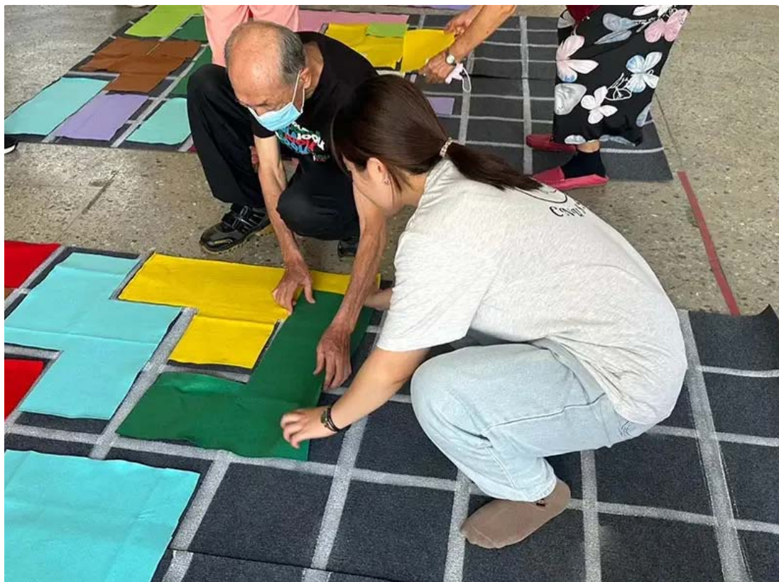
▲遊戲設計內容涵蓋認知活動、動作協調、數字邏輯、空間辨識及合作互動