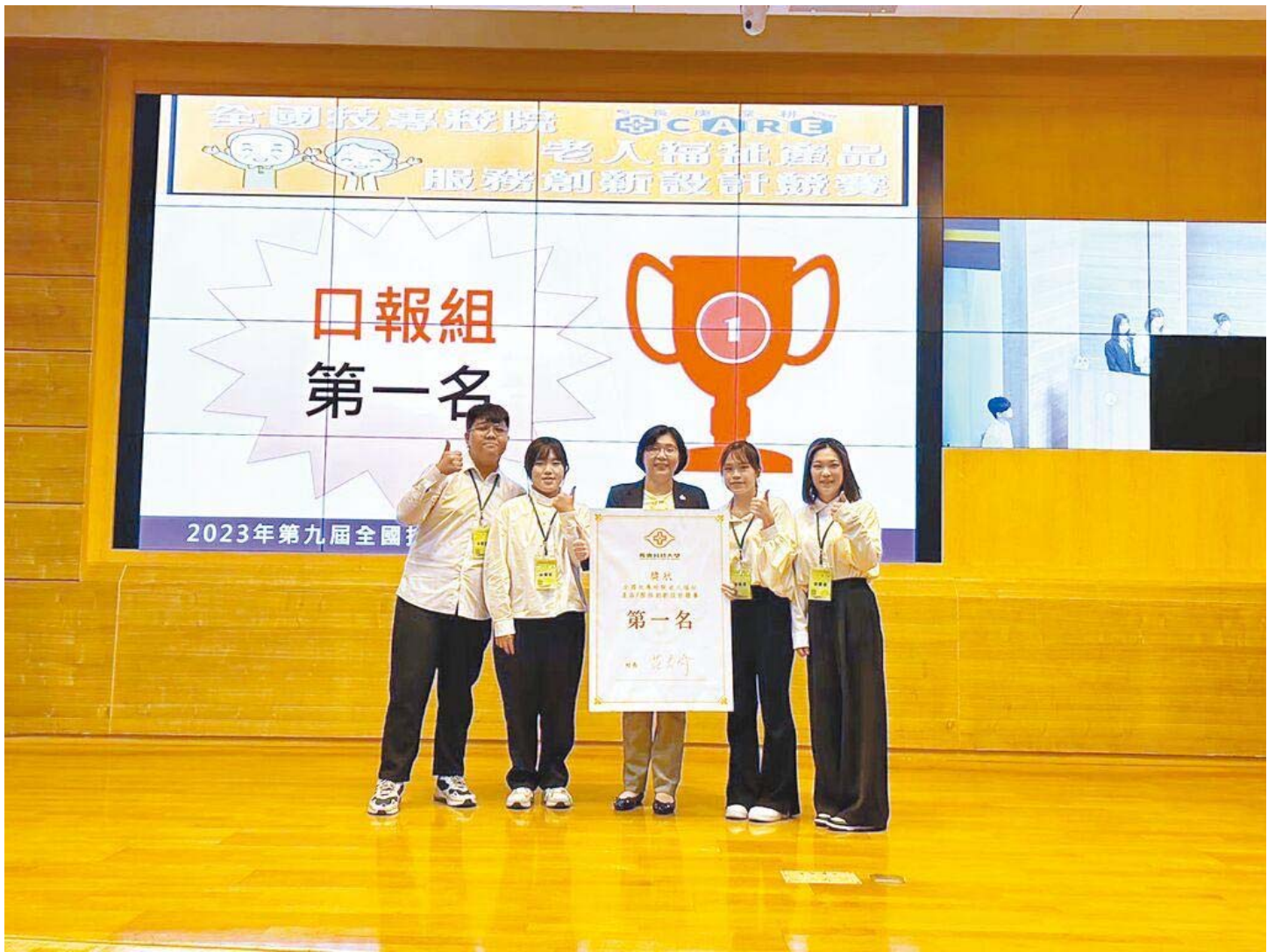
嘉藥創設「沒大沒小來尋寶」遊戲，勇奪全國第一。