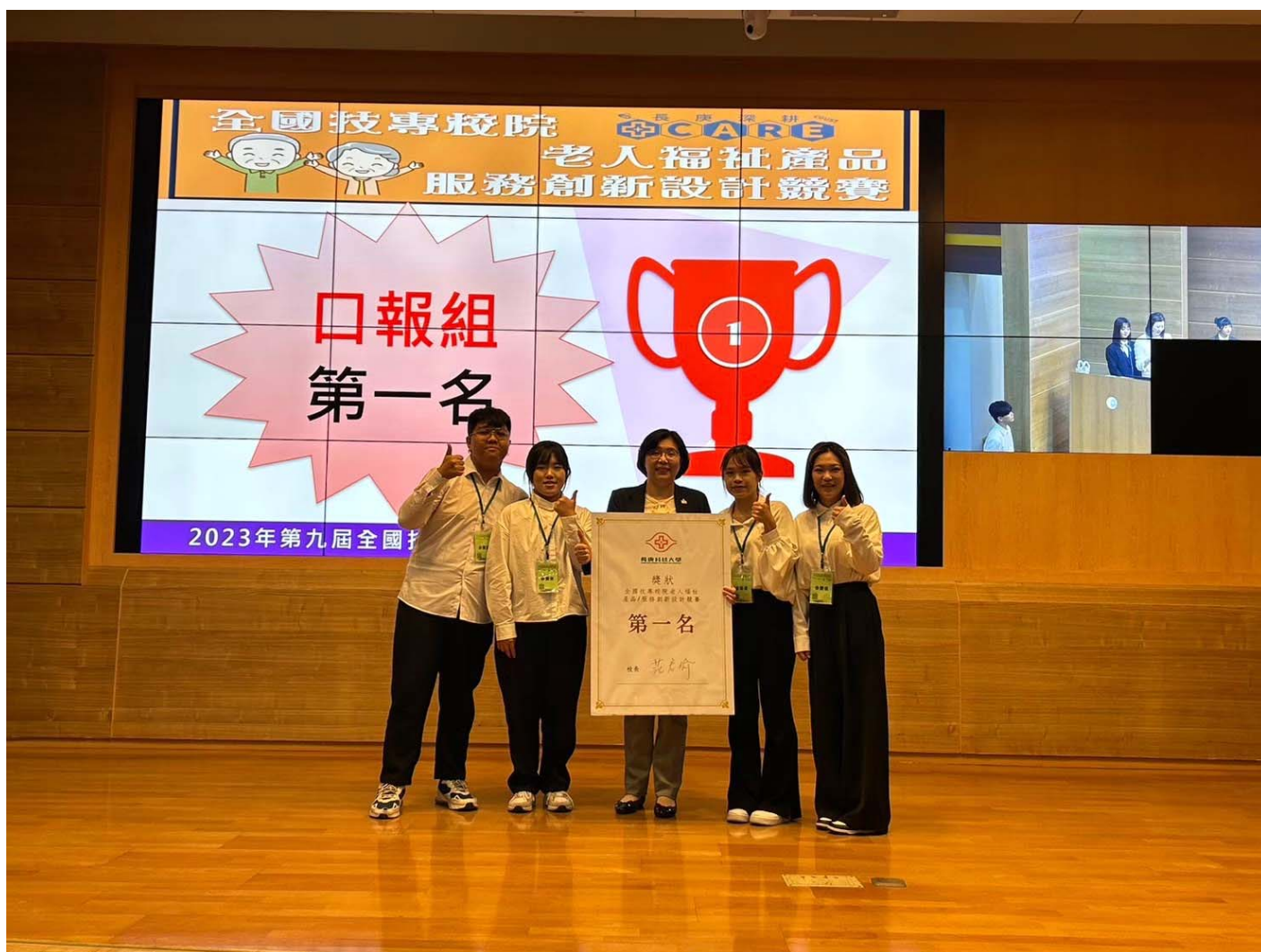
圖：嘉藥研發「沒大沒小來尋寶」遊戲奪冠。

【記者黃鐘毅 / 台南報導】嘉南藥理大學高齡福祉養生管理系參加2023全國技專校院老人福祉產品暨服務創新設計競賽，以結合幼兒與老年人的共學共玩理念，打破傳統遊戲界限，所設計出來的「沒大沒小來尋寶」的創意遊戲，獲得評審青睞，勇奪全國第一。