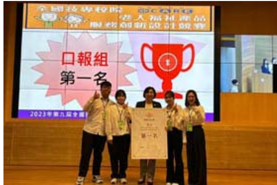
嘉藥研發「沒大沒小來尋寶」遊戲奪冠。

【記者曾淑萍 / 南市報導】嘉南藥理大學高齡福祉養生管理系日前參加2023全國技專校院老人福祉產品暨服務創新設計競賽，以結合幼兒與老年人的共學共玩理念，打破傳統遊戲界限，所設計出來的「沒大沒小來尋寶」的創意遊戲，獲得評審青睞勇奪全國第一。