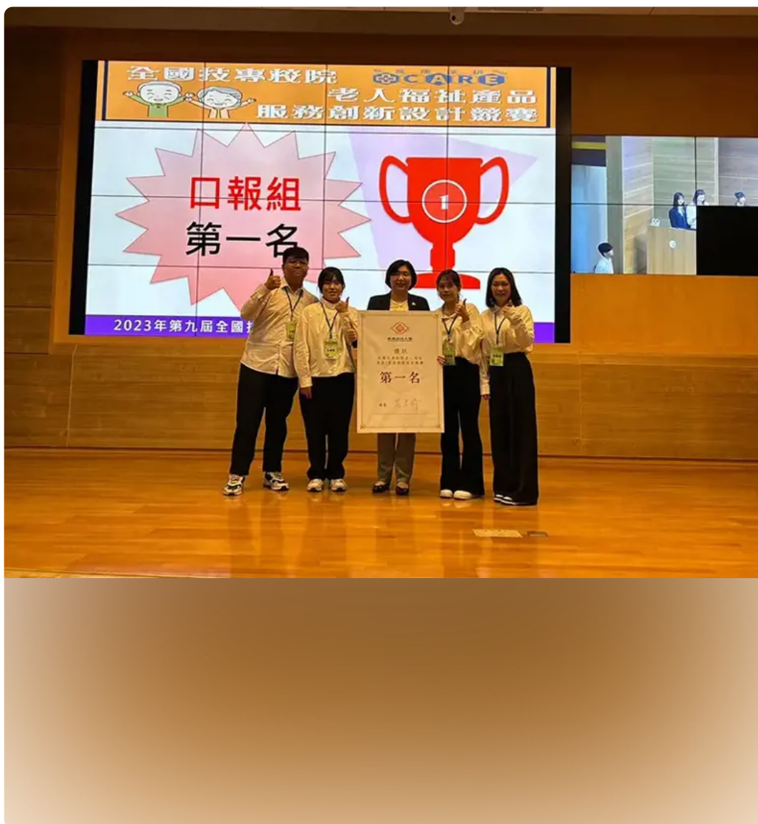
▲嘉南藥理大學高齡福祉養生管理系設計「沒大沒小來尋寶」的創意遊戲獲2023全國技專校院