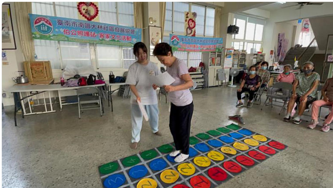
社區長輩體驗嘉藥同學設計的大地遊戲

參加比賽的高福系蔡同學表示，設計遊戲過程中了解到現在幼兒與長輩間缺乏互動關係，小孩多數依賴3C保母，於是便想出要以提升長輩與幼兒互動為主的遊戲，製作完成後也實際到社區邀請長輩們體驗，很開心初次參加比賽就獲得好成績，讓她在高齡服務的這條路上更增信心。