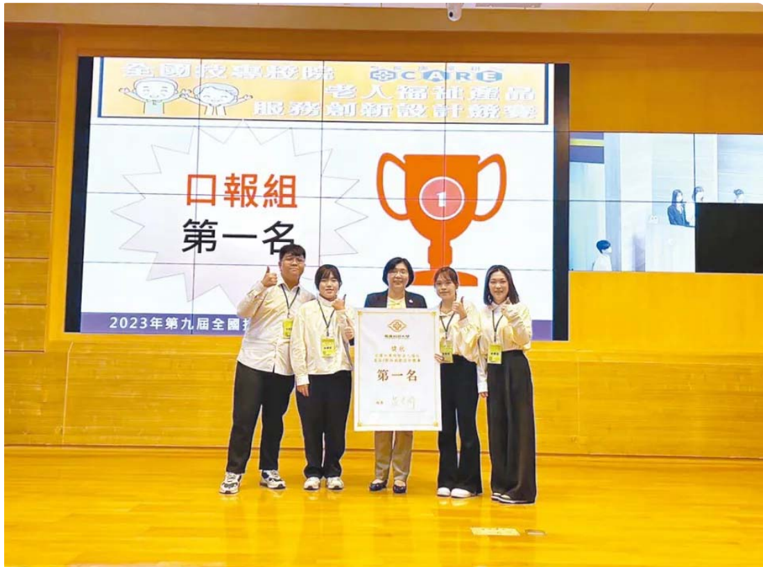
嘉藥創設「沒大沒小來尋寶」遊戲，勇奪全國第一。

嘉南藥理大學高齡福祉養生管理系日前參加全國技專校院老人福祉產品暨服務創新設計競賽，以結合幼兒與老年人共學共玩理念，創設「沒大沒小來尋寶」遊戲，打破傳統遊戲設計界限，獲得評審青睞勇奪全國第一。