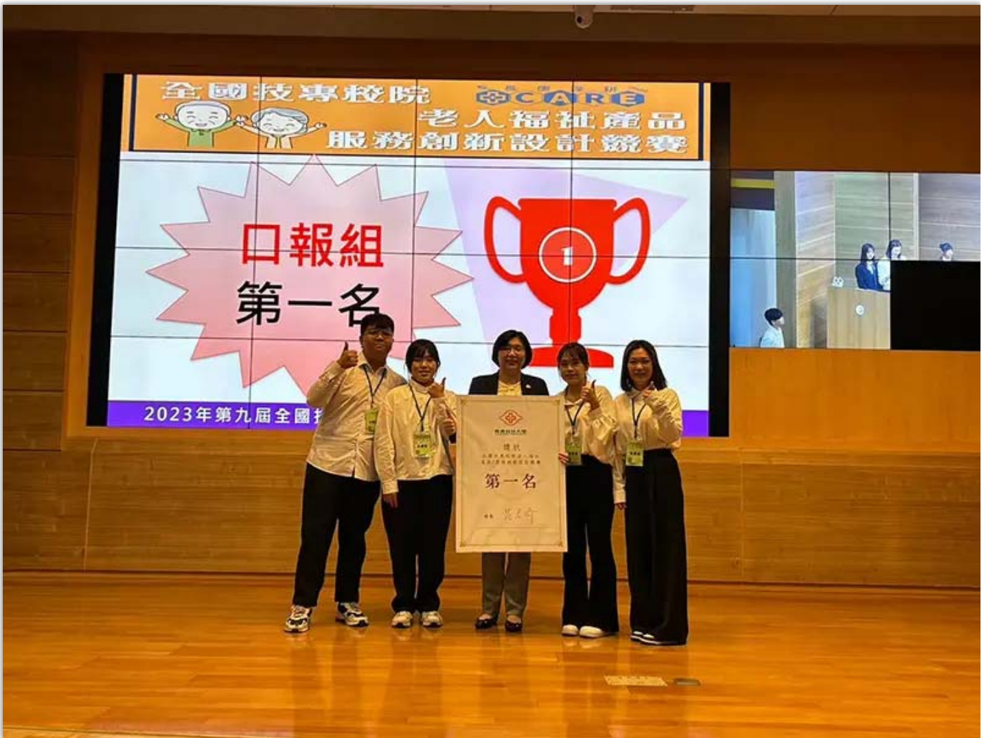
▲嘉南藥理大學高齡福祉養生管理系設計「沒大沒小來尋寶」的創意遊戲獲2023全國技專校院老人福祉產品暨服務創新設計競賽全國第一