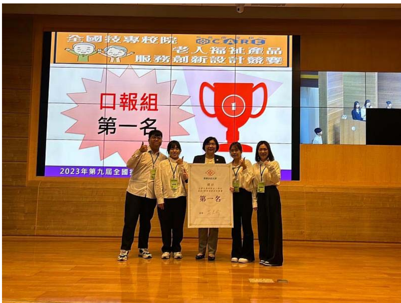
嘉藥研發「沒大沒小來尋寶」遊戲奪冠

學高齡福祉養生管理系日前參加2023全國技專校院老人福祉產品暨服務創新設計競賽，以結合幼兒與老年人的共學共玩理念，打破傳統遊戲界限，所設計出來的「沒大沒小來尋寶」的創意遊戲，獲得評審青睞勇奪全國第一。