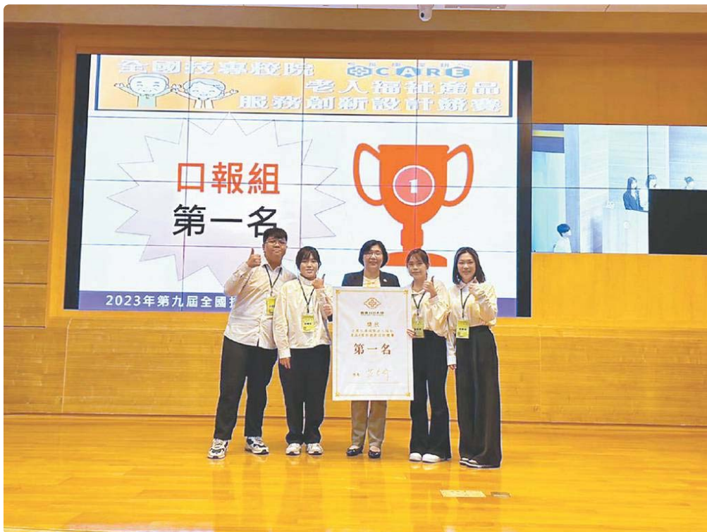
●嘉藥創設「沒大沒小來尋寶」遊戲，勇奪全國第一。

嘉南藥理大學高齡福祉養生管理系日前參加全國技專校院老人福祉產品暨服務創新設計競賽，以結合幼兒與老年人共學共玩理念，創設「沒大沒小來尋寶」遊戲，打破傳統遊戲設計界限，獲得評審青睞勇奪全國第一。