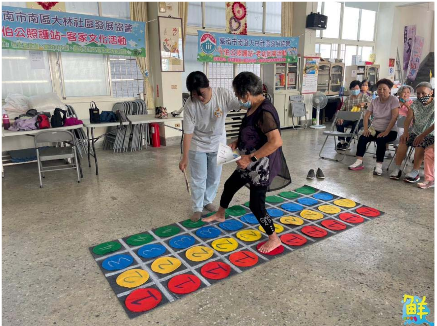
▲ 數字邏輯遊戲促長輩腦袋思考邏輯