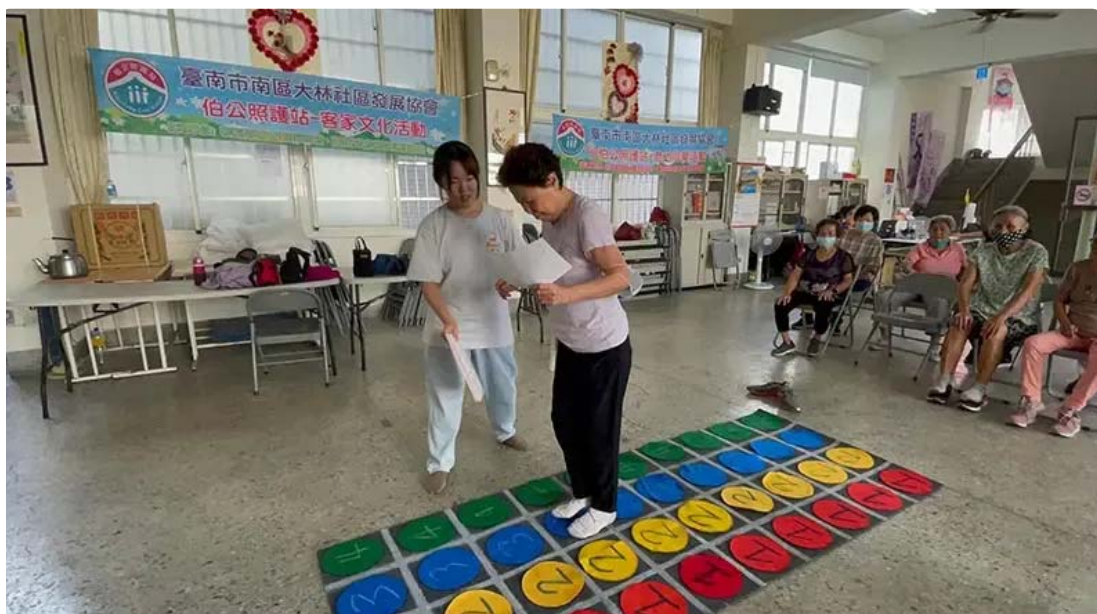
▲「沒大沒小來尋寶」打破傳統遊戲界限，遊戲中不僅重視娛樂性，更融入教育元素，營造一個促進跨世代互動的遊樂環境