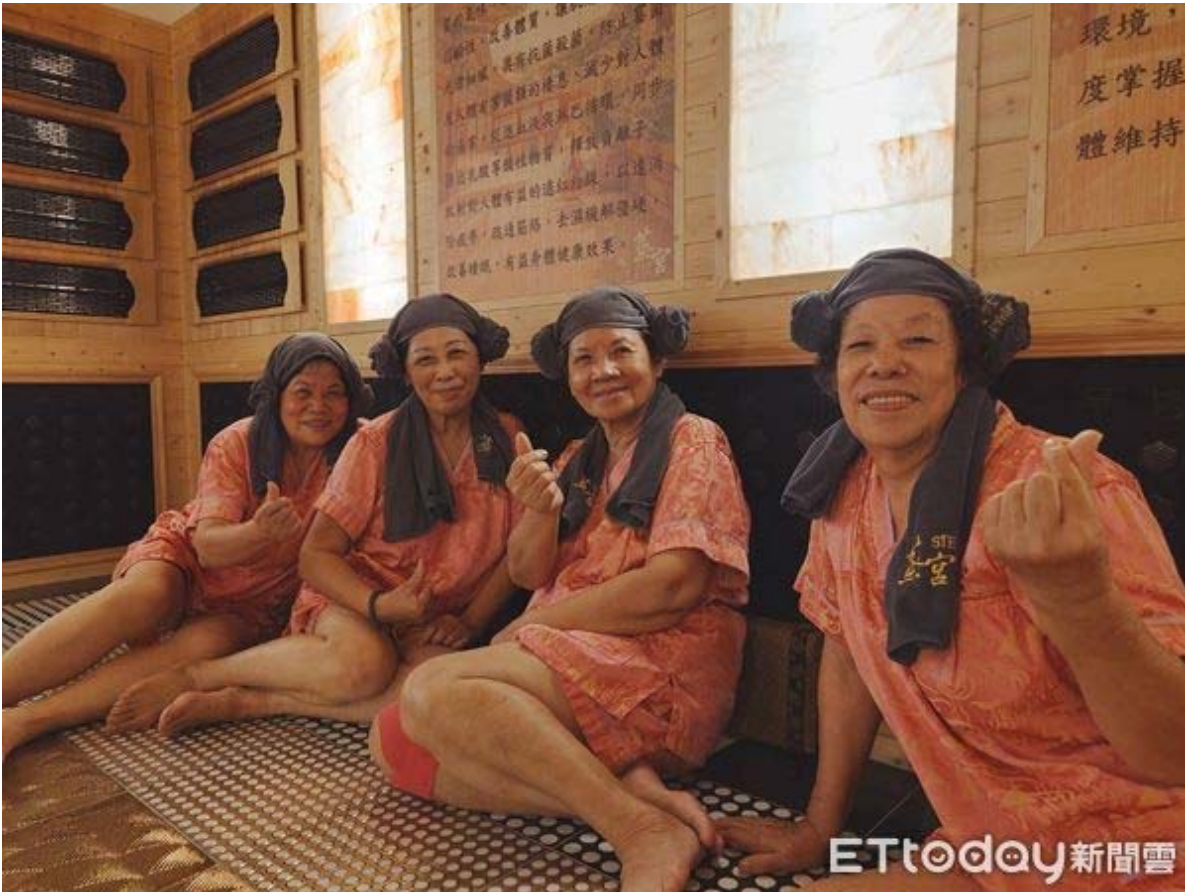
▲嘉藥USR計畫輔導的阿蓮社區40位長輩，前往蒸宮Korea Spa會館安平旗鑑店，體驗「韓式汗蒸幕」，讓長輩瞭解汗蒸對人體帶來的好處及流汗的重要。