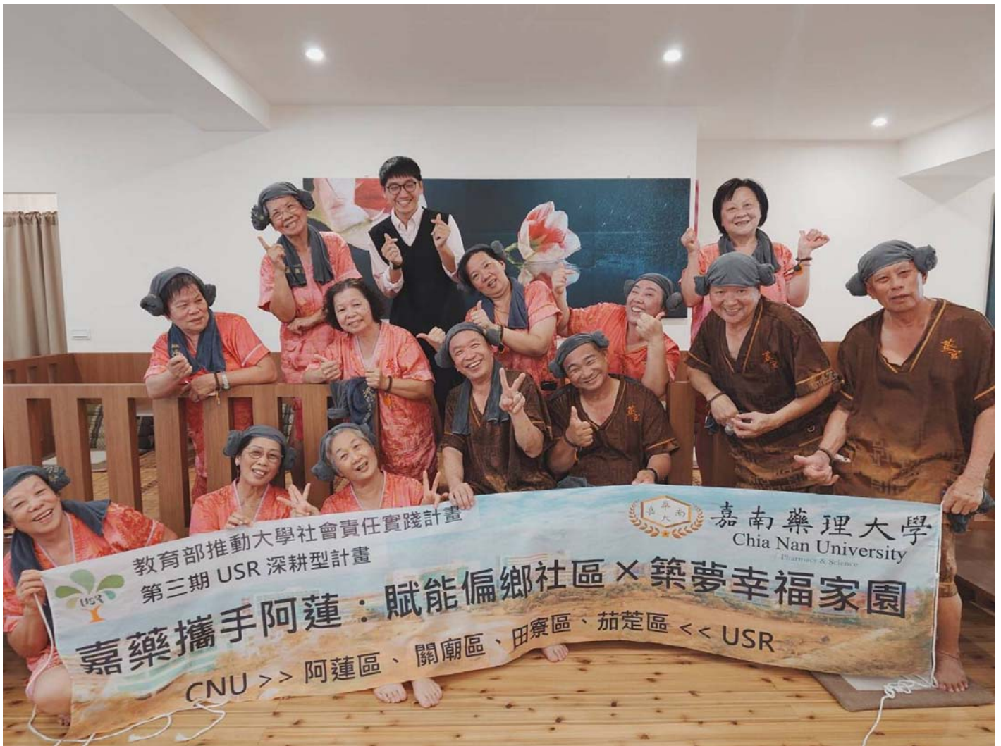
圖：嘉南藥理大舉辦「汗蒸健康促進活動」，帶領阿蓮長輩體驗韓式汗蒸幕。

【記者黃鐘毅 / 台南報導】冷空氣來襲，除了泡溫泉外，現在還有個溫暖新選擇！嘉南藥理大學攜手阿蓮社區發展協會及楷爾集團舉辦「汗蒸健康促進活動」，4日下午帶領嘉藥USR計畫輔導的阿蓮社區40位長輩前往楷爾集團旗下安平旗鑑店體驗「韓式汗蒸幕」，讓長輩瞭解汗蒸對人體所帶來的好