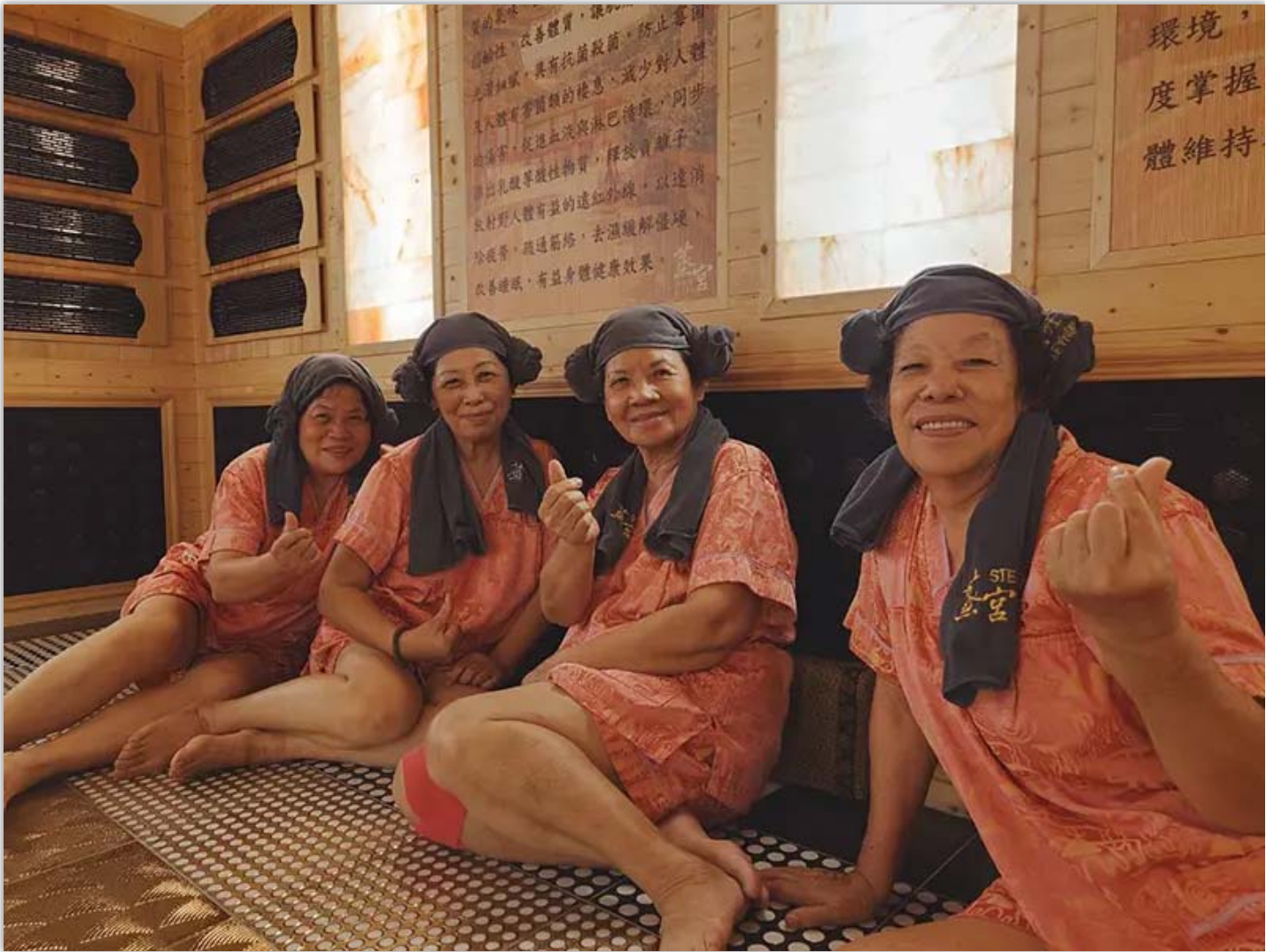
▲嘉南藥理大學創新育成中心攜手阿蓮社區發展協會及楷爾集團邀請阿蓮長輩初體驗韓式汗蒸幕