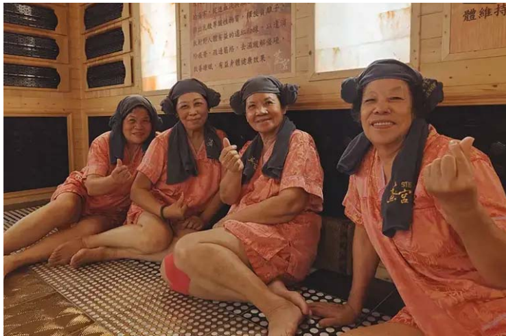
▲嘉南藥理大學創新育成中心攜手阿蓮社區發展協會及楷爾集團邀請阿蓮長輩初體驗韓式汗蒸幕

[NOWnews今日新聞] 嘉南藥理大學創新育成中心攜手阿蓮社區發展協會及楷爾集團舉辦「汗蒸健康促進活動」，於4日下午帶領嘉藥USR計畫輔導的阿蓮社區40位長輩前往體驗「韓式汗蒸幕」，以溫和的方式幫助身體緩慢排汗，同時讓長輩瞭解汗蒸對人體所帶來的好處及身體流汗的重要性。