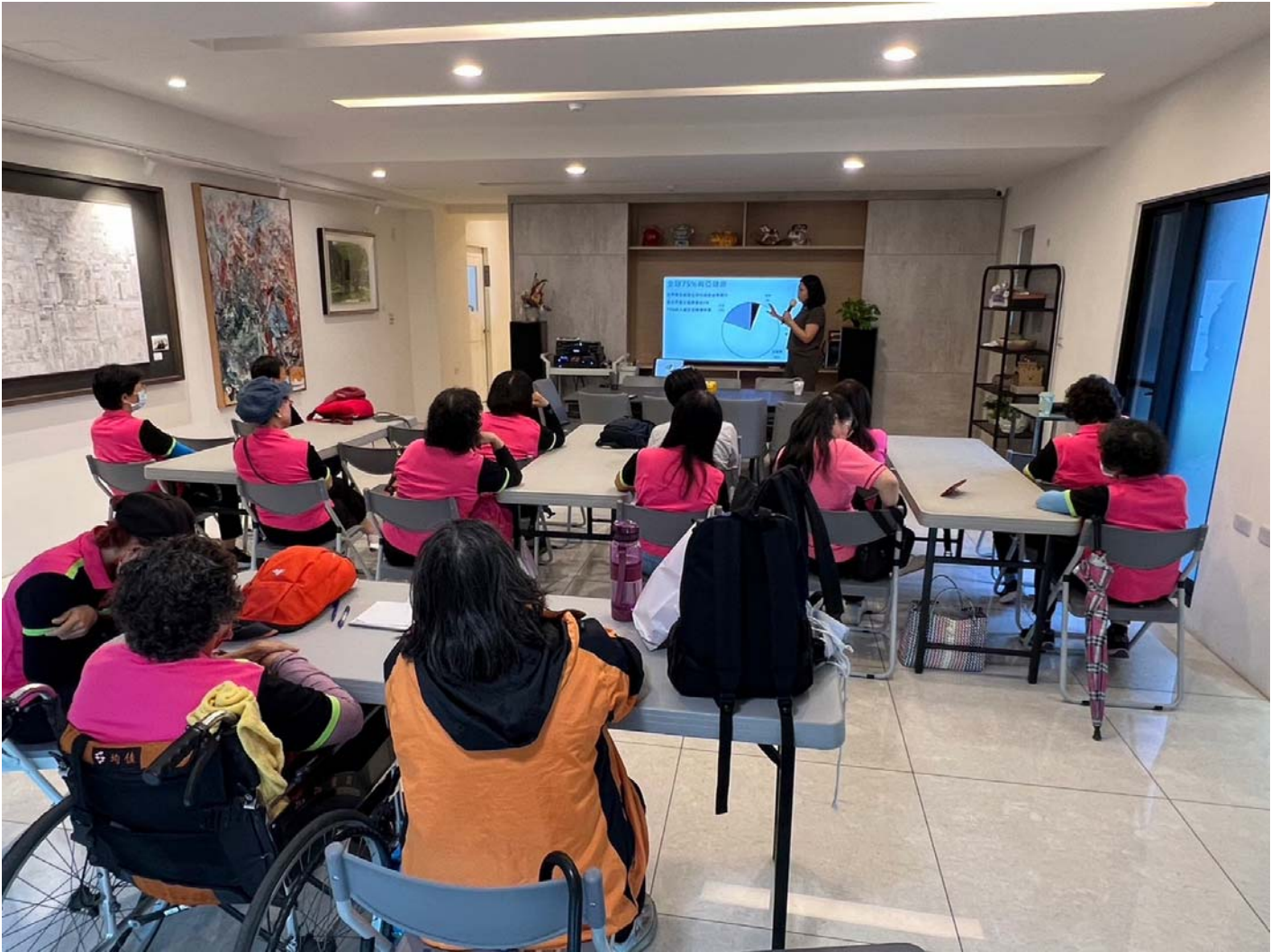
圖：體驗前先安排講座讓長輩了解汗蒸幕優點。

楷爾集團旗下蒸宮Korea Spa會館安平旗鑑店為嘉藥創新育成中心輔導及簽約廠商，在育成中心引薦下舉辦「汗蒸健康促進活動」，體驗活動前為使長輩更瞭解汗蒸幕，特別先安排宣導講座，和三溫暖最大不同之處，三溫暖是靠瞬間高溫加熱，而汗蒸幕則是透過遠紅外線、電氣石、喜瑪拉雅玫瑰鹽磚及硅藻泥等熱效應，以溫和的方式幫助身體緩慢排汗，做一個有效被動式運動，促進新陳代謝。