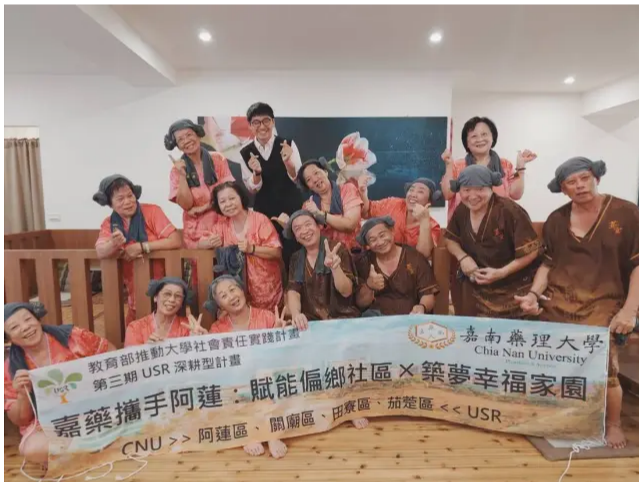
(圖說) 嘉藥帶領阿蓮長輩體驗超夯韓式汗蒸幕。

首次體驗韓式汗蒸幕的長輩說到，感覺很舒服沒有夏天的炙熱但又像冬天在太陽下溫暖的感覺，從裡到外溫暖了起來，身體也因為排汗感到通體舒暢，體驗結束後享用特製的離心蛋及養生飲，讓每位長輩在寒冷冬天得到營養滿滿的補充。