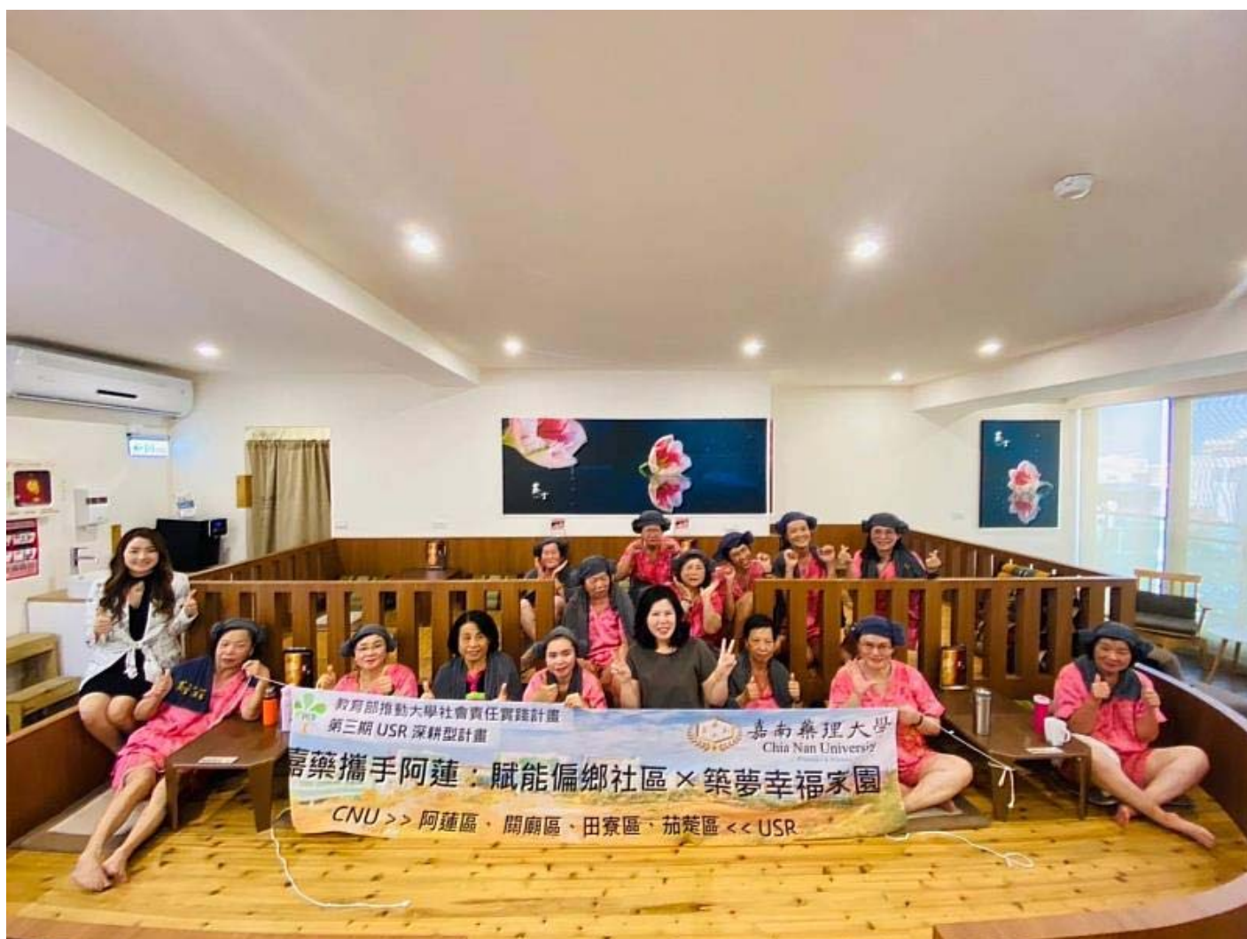
嘉藥帶領阿蓮長輩體驗超夯韓式汗蒸幕

襲，除了泡溫泉外，現在還有個溫暖新選擇！嘉南藥理大學創新育成中心攜手阿蓮社區發展協會及楷爾集團舉辦「汗蒸健康促進活動」，於4日下午帶領嘉藥USR計畫輔導的阿蓮社區40位長輩前往楷爾集團旗下-蒸宮Korea Spa會館安平旗鑑店體驗「韓式汗蒸幕」，讓長輩瞭解汗蒸對人體所帶來的好處及身體流汗的重要性。