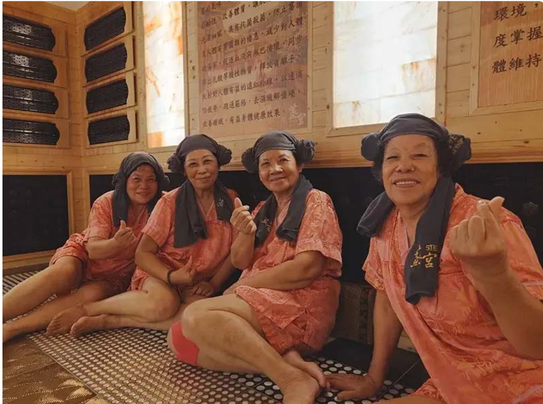
▲嘉南藥理大學創新育成中心攜手阿蓮社區發展協會及楷爾集團邀請阿蓮長輩初體驗韓式汗蒸幕

[NOWnews今日新聞] 嘉南藥理大學創新育成中心攜手阿蓮社區發展協會及楷爾集團舉辦「汗蒸健康促進活動」，於4日下午帶領嘉藥USR計畫輔導的阿蓮社區40位長輩前往體驗「韓式汗蒸幕」，以溫和的方式幫助身體緩慢排汗，同時讓長輩瞭解汗蒸對人體所帶來的好處及身體流汗的重要性。