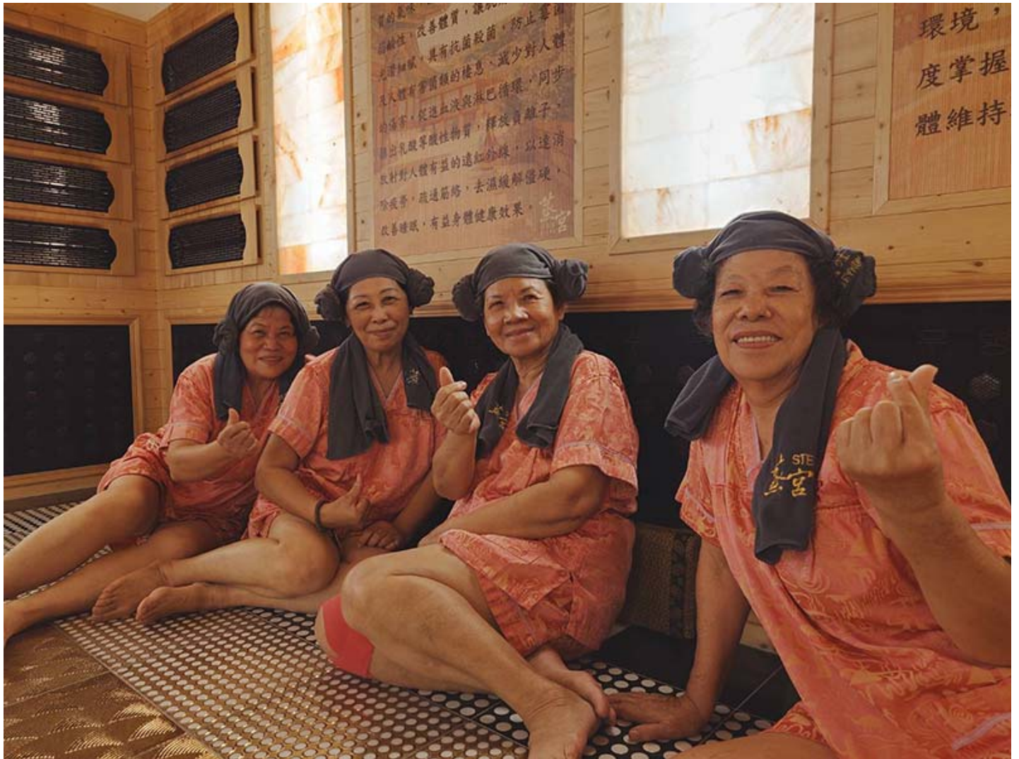
▲ 嘉南藥理大學創新育成中心攜手阿蓮社區發展協會及楷爾集團邀請阿蓮長輩初體驗韓式汗蒸幕

嘉南藥理大學創新育成中心攜手阿蓮社區發展協會及楷爾集團舉辦「汗蒸健康促進活動」，於4日下午帶領嘉藥USR計畫輔導的阿蓮社區40位長輩前往體驗「韓式汗蒸幕」，以溫和的方式幫助身體緩慢排汗，同時讓長輩瞭解汗蒸對人體所帶來的好處及身體流汗的重要性。