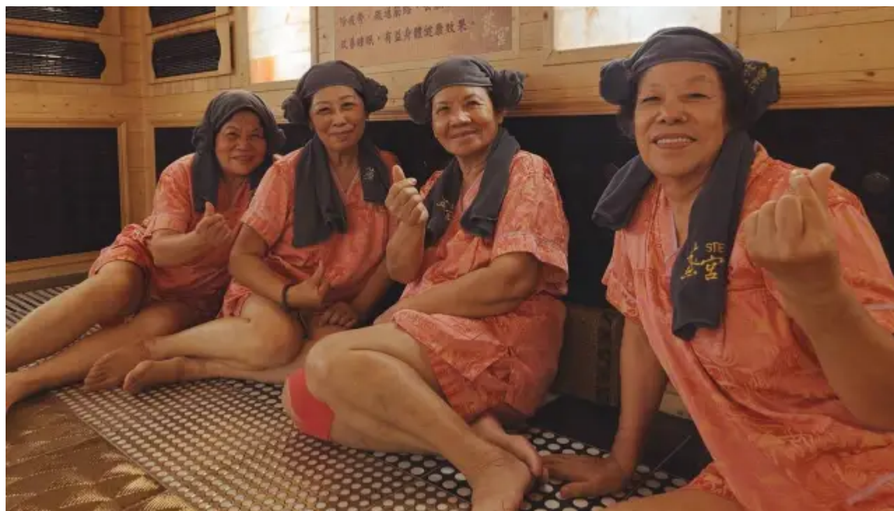
(圖說) 每位長輩帶上羊角帽彷彿來到韓國。

首次體驗韓式汗蒸幕的長輩說到，感覺很舒服沒有夏天的炙熱但又像冬天在太陽下溫暖的感覺，從裡到外溫暖了起來，身體也因為排汗感到通體舒暢，體驗結束後享用特製的離心蛋及養生飲，讓每位長輩在寒冷冬天得到營養滿滿的補充。