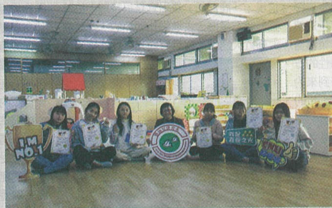
●嘉藥嬰幼兒保育系勇奪4金2銀。

比賽能獲得如此佳績，對學生來說就是最好的鼓勵，未來也將持續鼓勵學生持續強化專業知能，接軌國際為幼教產業做出貢獻。