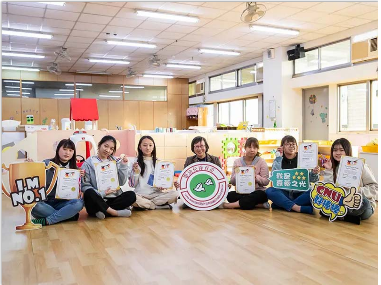
▲嘉藥幼保系學生在德國線上觀光烹飪賽獲4金2銀，成績相當亮眼