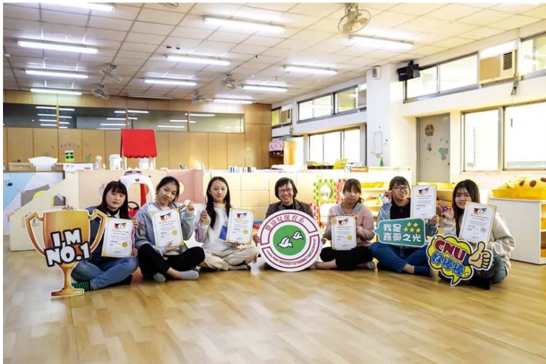
嘉藥嬰幼兒保育系勇奪4金2銀。

嘉南藥理大學嬰幼兒保育系，日前參加德國線上觀光烹飪賽（GTCIC），在「創意兒童餐展示」項目獲得滿堂彩，勇奪4金2銀，亮眼成績讓全校師生與有榮焉。