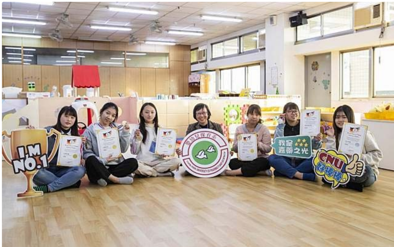
嘉藥幼保系參加德國線上觀光烹飪賽獲四金、二銀。