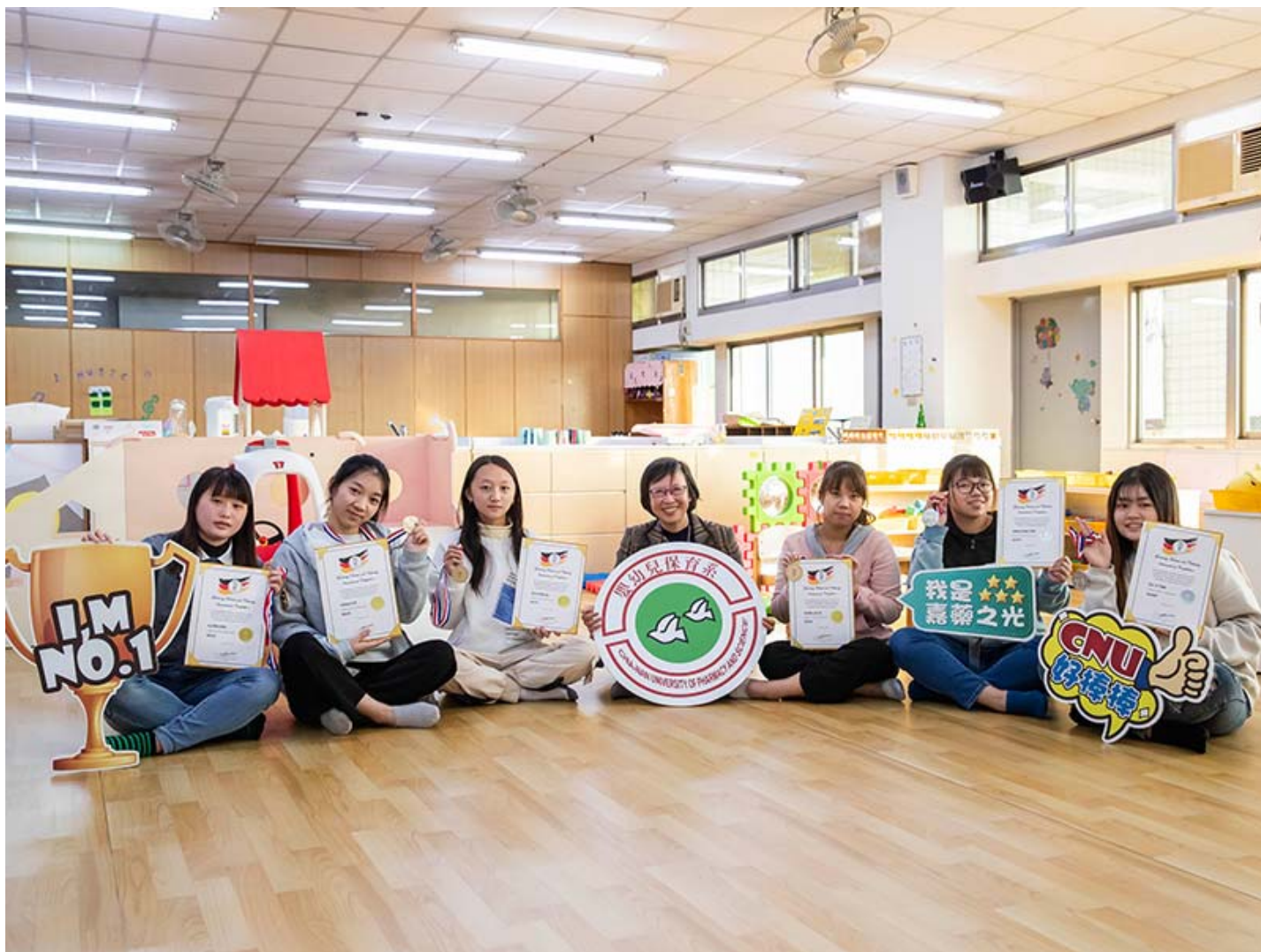
▲ 嘉藥幼保系學生在德國線上觀光烹飪賽獲4金2銀，成績相當亮眼

嘉南藥理大學嬰幼兒保育系學生參加德國線上觀光烹飪賽 (GTCIC) 勇奪4金2銀，該賽程吸引來自韓國、印尼、土耳其、印度、日本、新加坡、馬來西亞、越南、緬甸及台灣等10個國家704名選手一同競技，嘉藥幼保系的學生在「創意兒童餐展示」項目大獲全勝，卯足全力運用課堂所學，在眾多好手中脫穎而出奪得金牌，亮眼成績讓全校師生與有榮焉。