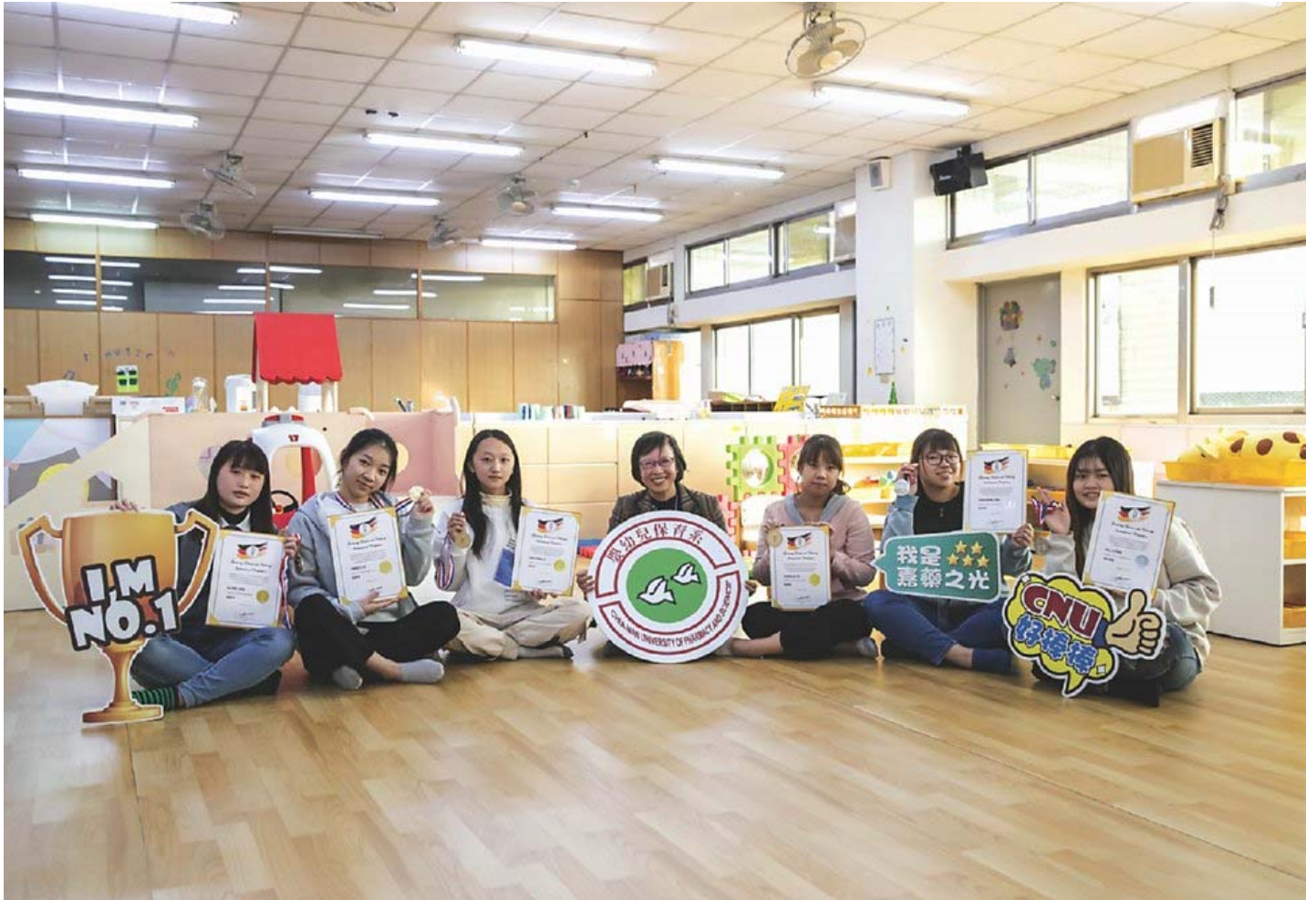
嘉藥嬰幼兒保育系勇奪4金2銀。

嘉藥理大學嬰幼兒保育系，日前參加德國線上觀光烹飪賽（GTCIC），在「創意兒童餐展示」項目獲得滿堂彩，勇奪4金2銀，亮眼成績讓全主與有榮焉。