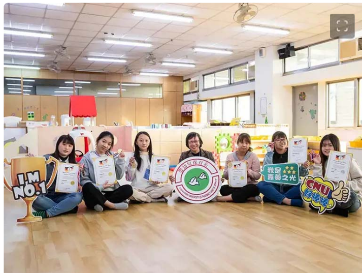
▲嘉藥幼保系學生在德國線上觀光烹飪賽獲4金2銀，成績相當亮眼

[NOWnews今日新聞] 嘉南藥理大學嬰幼兒保育系學生參加德國線上觀光烹飪賽 (GTCIC) 勇奪4金2銀，該賽程吸引來自韓國、印尼、土耳其、印度、日本、新加坡、馬來西亞、越南、菲律賓、泰國、美國、