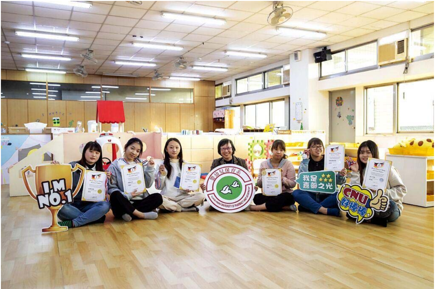
嘉藥嬰幼兒保育系勇奪4金2銀。