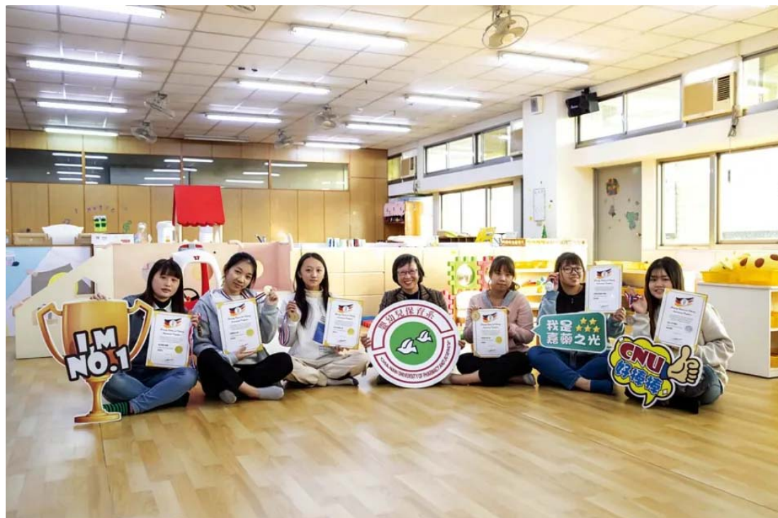
嘉藥嬰幼兒保育系勇奪4金2銀。

嘉南藥理大學嬰幼兒保育系，日前參加德國線上觀光烹飪賽（GTCIC），在「創意兒童餐展示」項目獲得滿堂彩，勇奪4金2銀，亮眼成績讓全校師生與有榮焉。