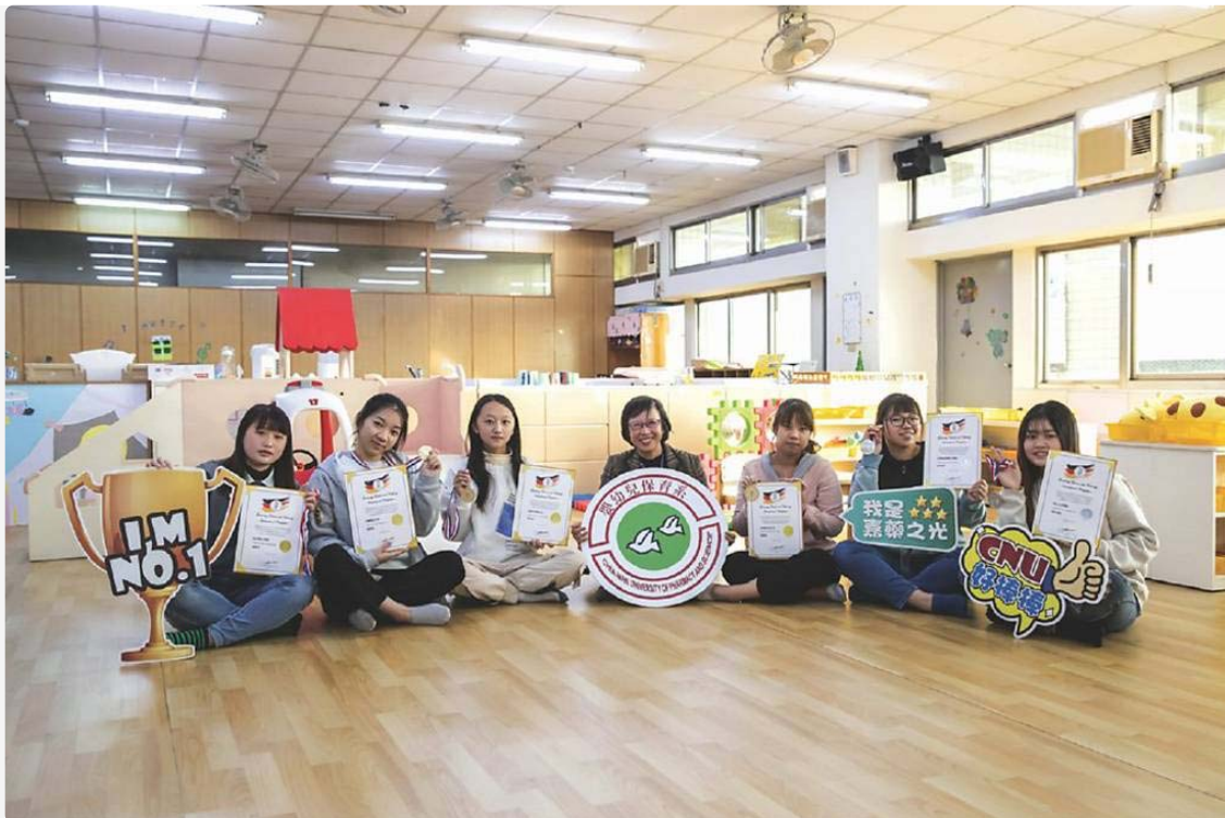
●嘉藥嬰幼兒保育系勇奪4金2銀。

嘉南藥理大學嬰幼兒保育系，日前參加德國線上觀光烹飪賽（GTCIC），在「創意兒童餐展示」項目獲得滿堂彩，勇奪4金2銀，亮眼成績讓全校師生與有榮焉。