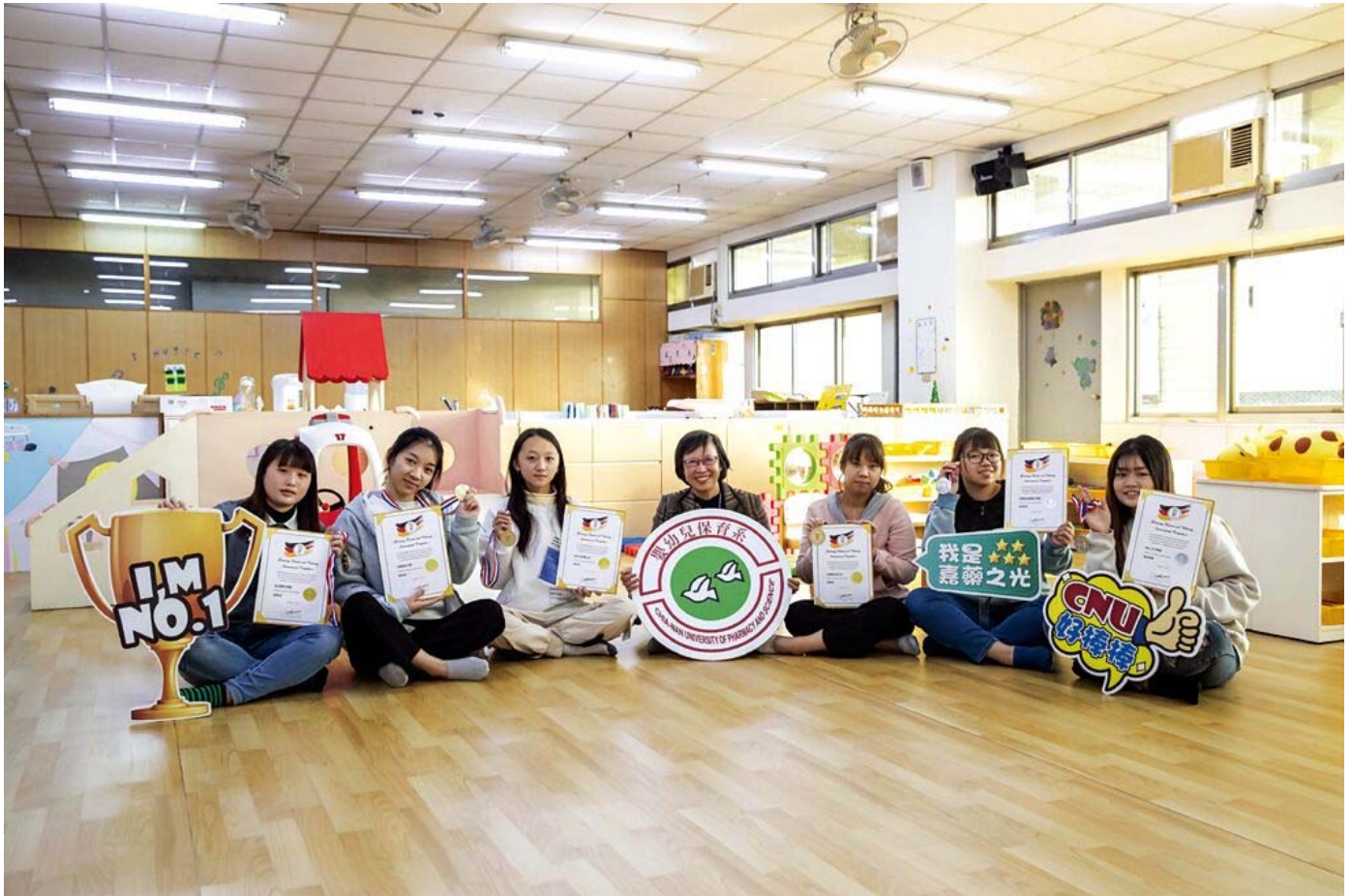
嘉藥嬰幼兒保育系勇奪4金2銀。

嘉南藥理大學嬰幼兒保育系，日前參加德國線上觀光烹飪賽（GTCIC），在「創意兒童餐展示」項目獲得滿堂彩，勇奪4金2銀，亮眼成績讓全校師生與有榮焉。