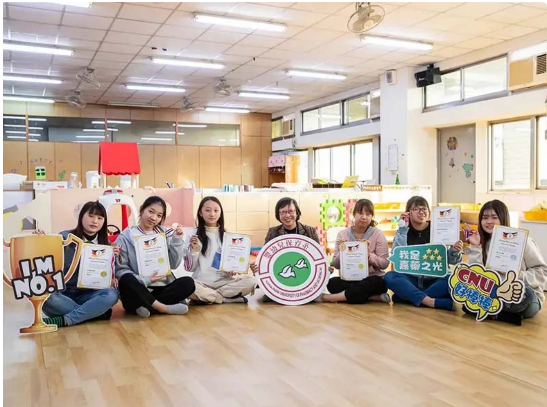
▲嘉藥幼保系學生在德國線上觀光烹飪賽獲4金2銀，成績相當亮眼

[NOWnews今日新聞] 嘉南藥理大學嬰幼兒保育系學生參加德國線上觀光烹飪賽（GTCIC）勇奪4金2銀，該賽程吸引來自韓國、印尼、土耳其、印度、日本、新加坡、馬來西亞、越南、緬甸及台灣等10個國家704名選手一同競技，嘉藥幼保系的學生在「創意兒童餐展示」項目大獲全勝，卯足全力運用課堂所學，在眾多好手中脫穎而出奪得金牌，亮眼成績讓全校師生與有榮焉。