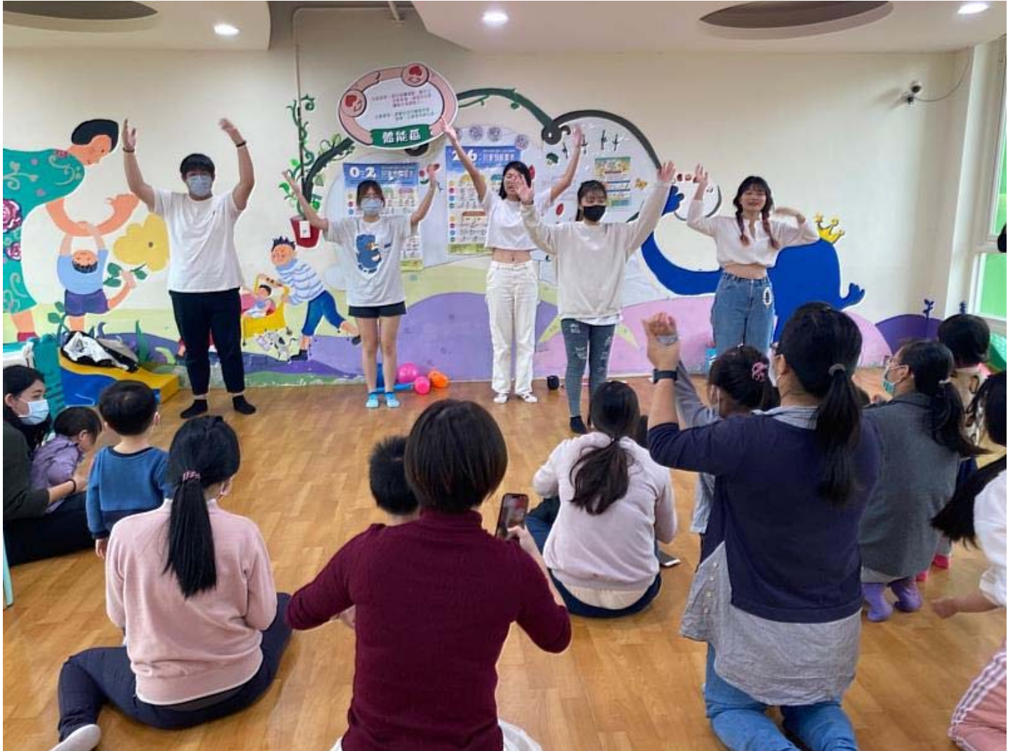
幼保系學生展現活力與精神，帶動新年歌律動

彙，加上舞蹈帶動唱一同歡唱新年歌曲，讓孩子從玩樂中輕鬆學美語，也能鍛鍊身體協調性和注意力。最受小朋友歡迎的「跳跳打地鼠遊戲」，則是透過夾球跳躍前進及玩具槌的打擊方式，訓練孩童手腳並用並訓練大肌肉的發展，活動最後帶領親子親手DIY製作簡易鞭炮，體驗傳統過年文化。