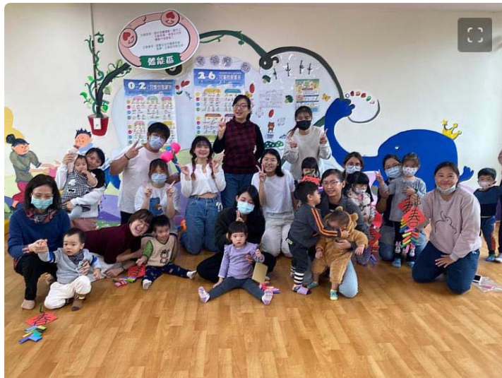
嘉藥幼保系攜手高雄市路竹親子館舉辦歡慶新年華語活動

(中央社訊息服務20240116 09:49:18)距離不到一個月即將迎來農曆過年，嘉南藥理大學嬰幼兒保育系日前特別選在路竹親子館舉辦一場「美語律動營嗨翻迎新」活動，將美語教學加入歡快舞蹈律動及豐富有趣味的遊戲當中，希望透過遊戲方式從玩樂中輕鬆學美語，讓孩子們提前感受年節歡樂氣氛，與孩童一起攜手迎向充滿健康有活力新的一年。