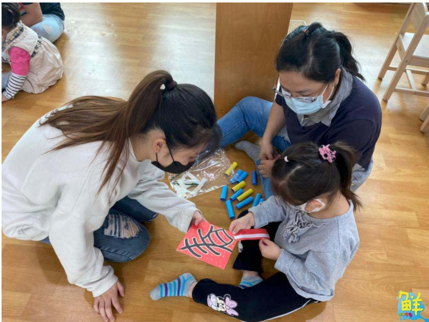
▲ 幼保系同學用心指導小朋友春聯的製作步驟與方法