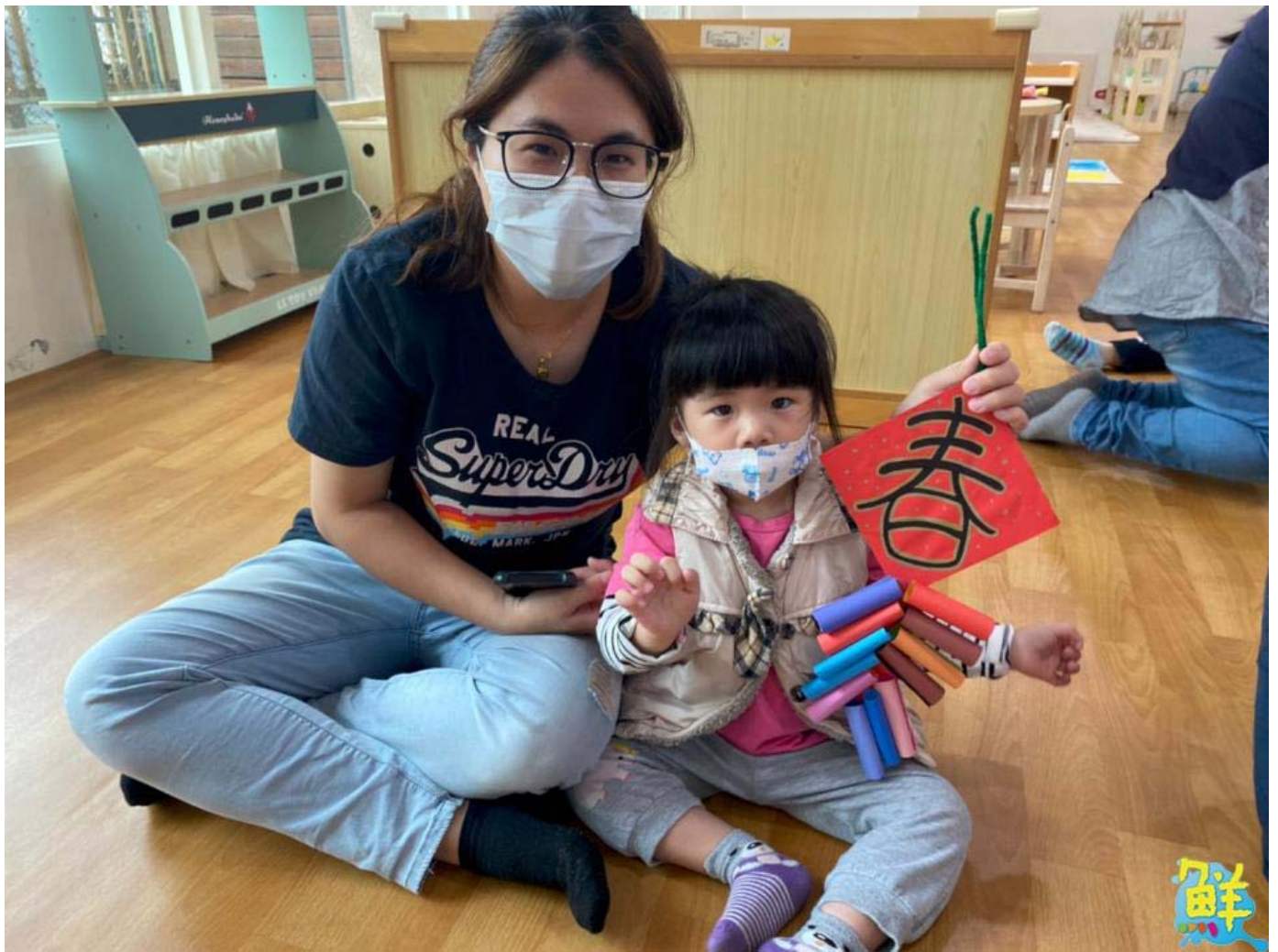
▲媽媽與小朋友合力完成手作春聯，充滿喜悅與成就感