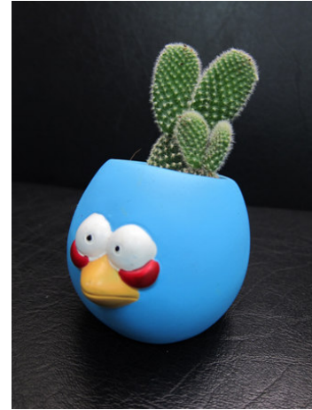
說明：生活系教學成果作品-園產加工作品