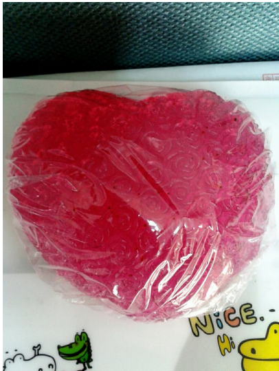
說明：生活系教學成果作品：芳香與生活照顧作品-手工香皂