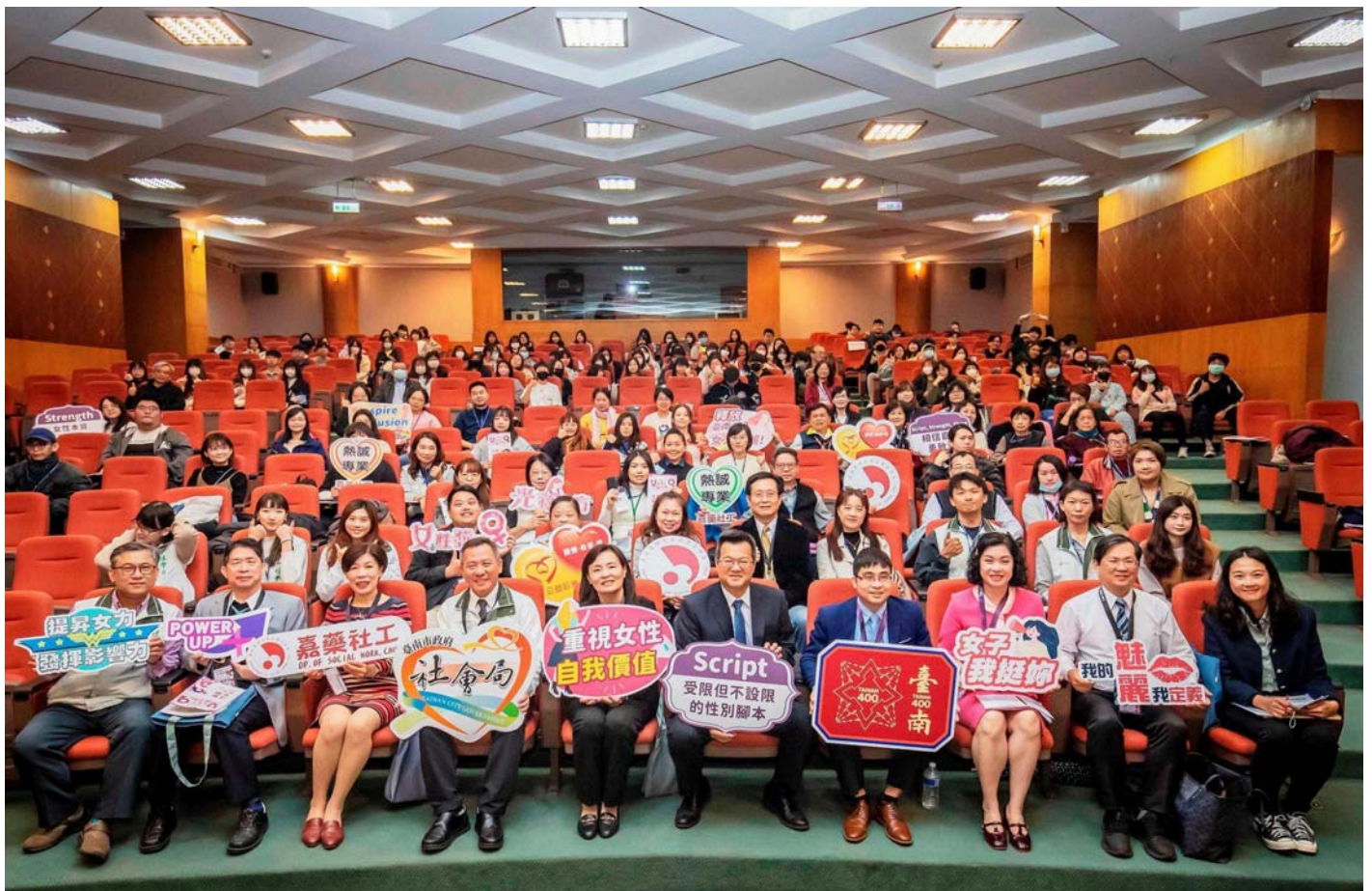
圖：南市府社會局舉辦「婦女議題國際論壇」活動，來自各地產官學界齊聚一堂。

【記者黃鐘毅 / 台南報導】38婦女節，南市府社會局攜手嘉南藥理大學舉辦「2024年翻轉女力與影響力-婦女議題國際論壇」活動，吸引來自各地產官學界前來共襄盛舉，現場還邀請女性主義專業書店(女書店)合作設攤，將暢銷或重要女性議題書籍或物品致贈參與者，期望藉以喚醒女性對自身權益的重視，激勵其勇敢突破性別框架，好好展現自我。