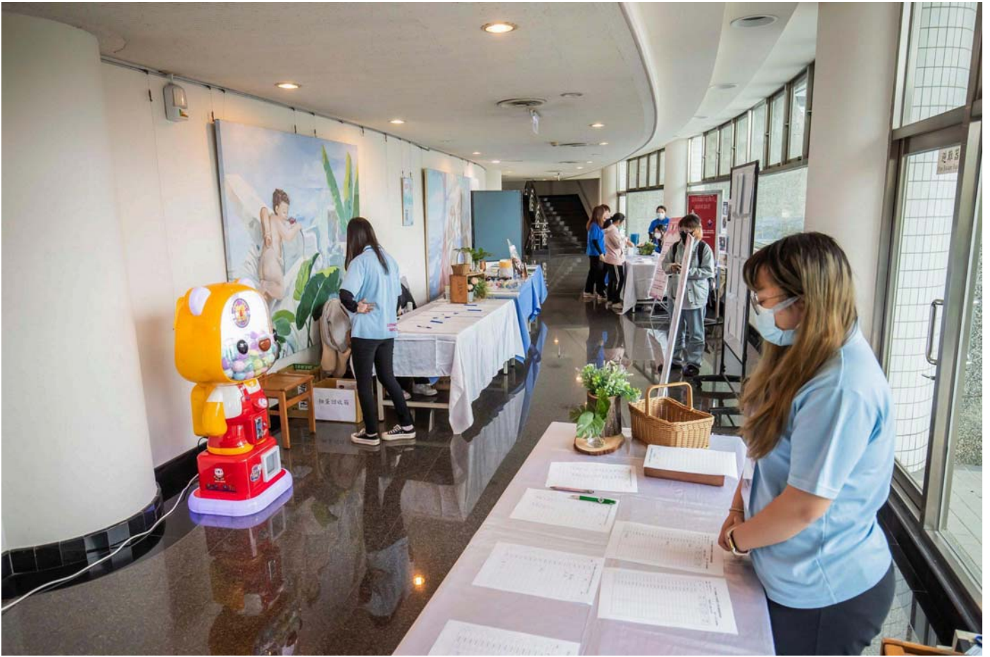
圖：論壇場邀請女性主義專業書店合作設攤。