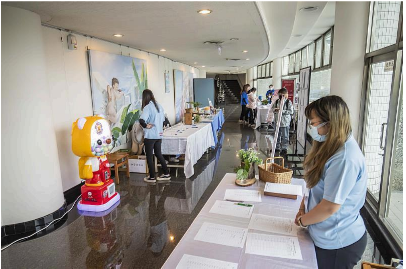
現場邀請女性主義專業書店合作設攤炒熱氣氛

本次活動中，為帶給與會者更為溫馨的感受，現場特別準備扭蛋機，讓每位參與者可以扭到一份禮物。禮物內容包括書籍、筆記本、耳機等，帶給參與者不少驚喜，同時社工系系友會的同學也在場特別倡導「月經不驚」的概念，希冀能破除同學或與會者對月經的錯誤迷思。