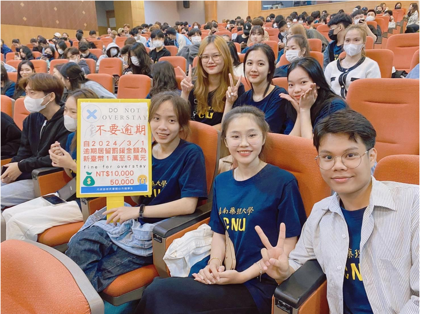
圖：越南籍外籍新生認真參與政令宣導