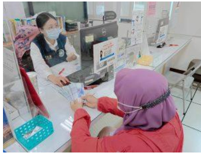
(圖外籍學生心痛繳納新臺幣4萬元逾期居留罰鍰)

臺南市目前共有十幾所大專院校，共計超過2千名外籍學生在府城求學，本次修法提高逾期居(停)留裁罰基準後，最令人擔心的對象就是這群經濟基礎還不穩定的外籍學子，對他們而言，最高新臺幣5萬元的罰鍰除了是筆龐大費用，若是在臺逾期居留超過29日，還得面臨先購買機票離開臺灣，之後再重新申請簽證來臺的窘境，嚴重影響個人求學規劃，得不償失。