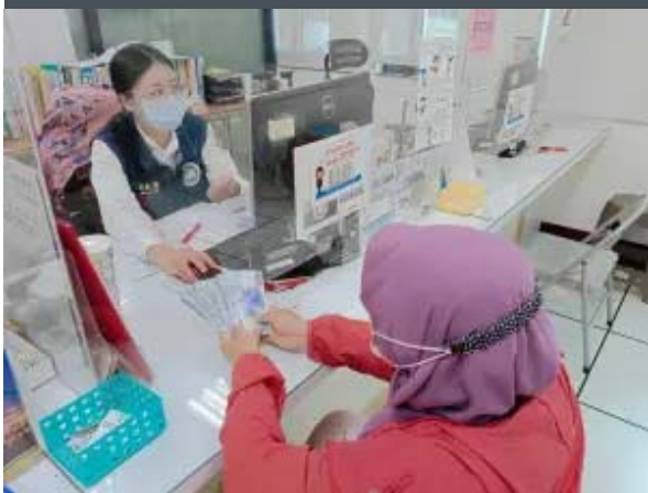
(圖外籍學生心痛繳納新臺幣4萬元逾期居留罰鍰/記者章三元翻攝)

【南北傳媒新聞網記者章三元 /臺南報導】新修正入出國及移民法自113年3月1日起提高外國人在臺逾期居(停)留罰鍰金額後，移民署南區事務大隊臺南市第一服務站統計，半個月以來已有3名外籍學生因逾期居留遭裁處新臺幣1萬元至5萬元不等罰鍰，雖然學生著急落淚，籌錢繳納罰鍰的無助神情讓人不捨，但違法仍須付出沉痛代價，移民署呼籲外籍學生：「務必留意個人居留證件效期！」