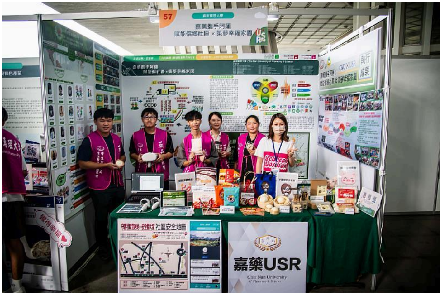
嘉藥以阿蓮地區當作示範場域發揮所長落實USR在地化