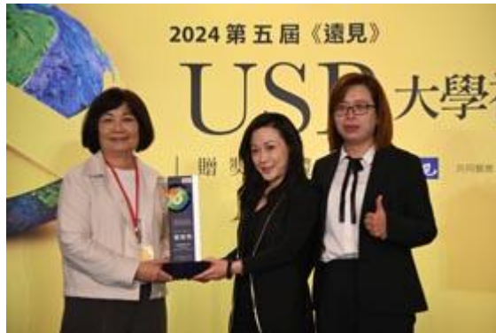
嘉南藥理大學在遠見雜誌USR大學社會責任獎獲得「福祉共生組」楷模獎。

【記者孫宜秋 / 南市報導】2024第五屆遠見雜誌USR大學社會責任獎於4月9日下午舉辦頒獎典禮，嘉南藥理大學首次參賽就在54所學校脫穎而出，以「嘉藥攜手阿蓮：賦能偏鄉社區×築夢幸福家園」計畫獲得「福祉共生組」楷模獎殊榮。