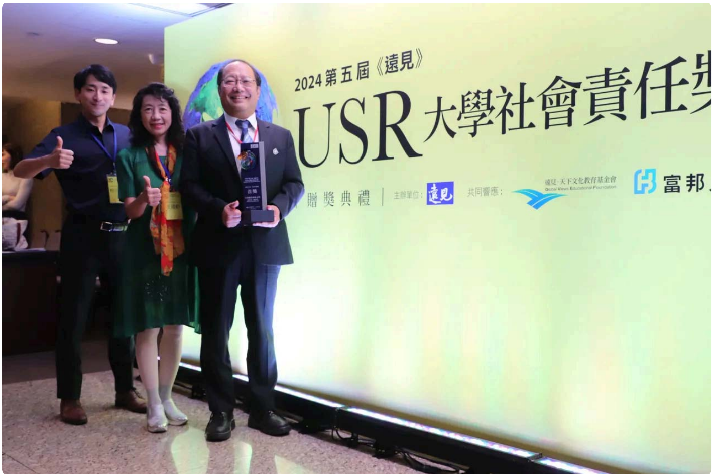
中華醫大獲「在地共融組」首獎。