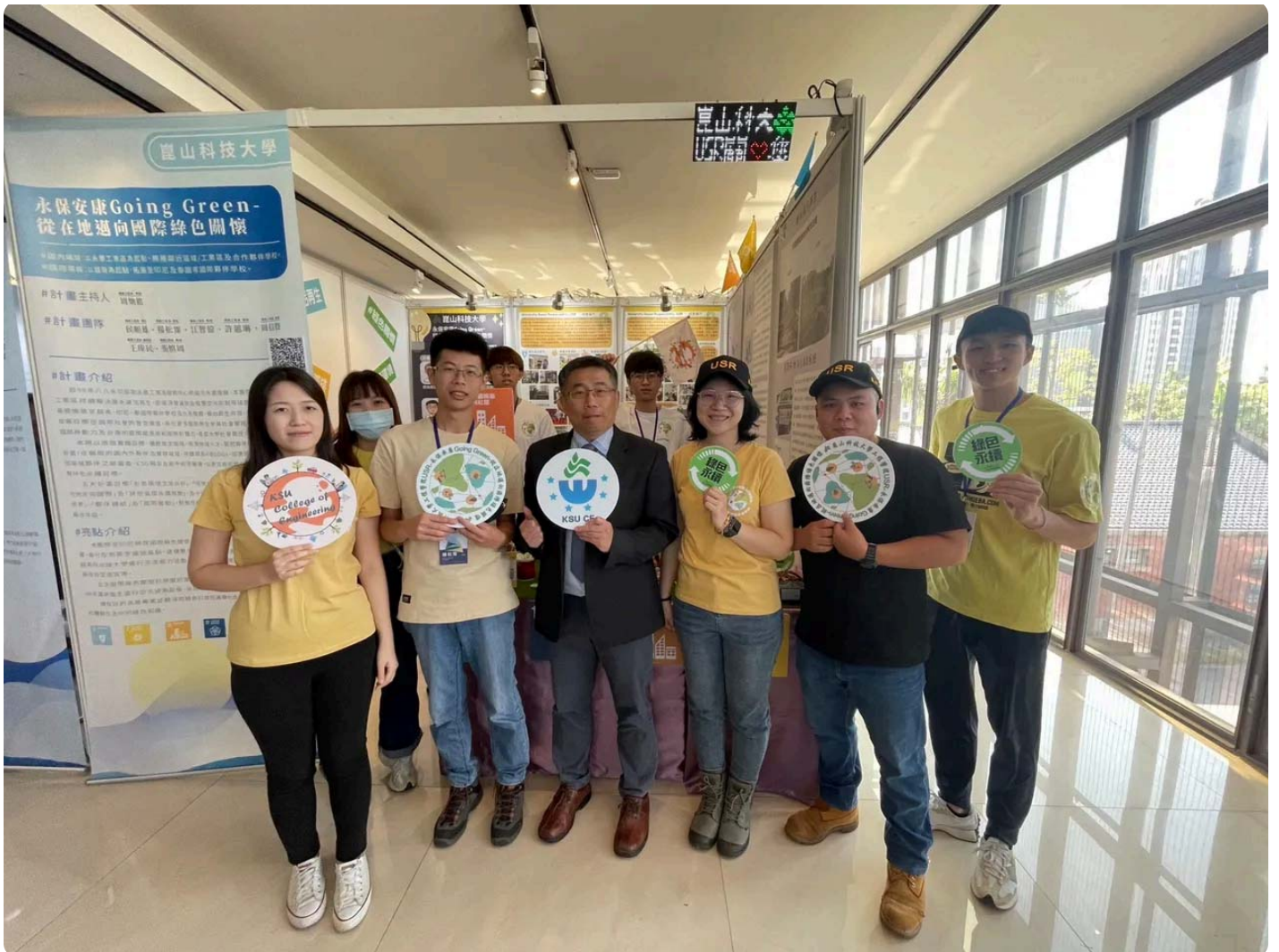
崑山USR團隊。校方提供

崑山科技大學以「永保安康Going Green-從在地邁向國際綠色關懷」計畫獲「生態共好組」楷模獎，不僅連續三年榮獲佳績，更是該組唯一獲獎的私立科大。