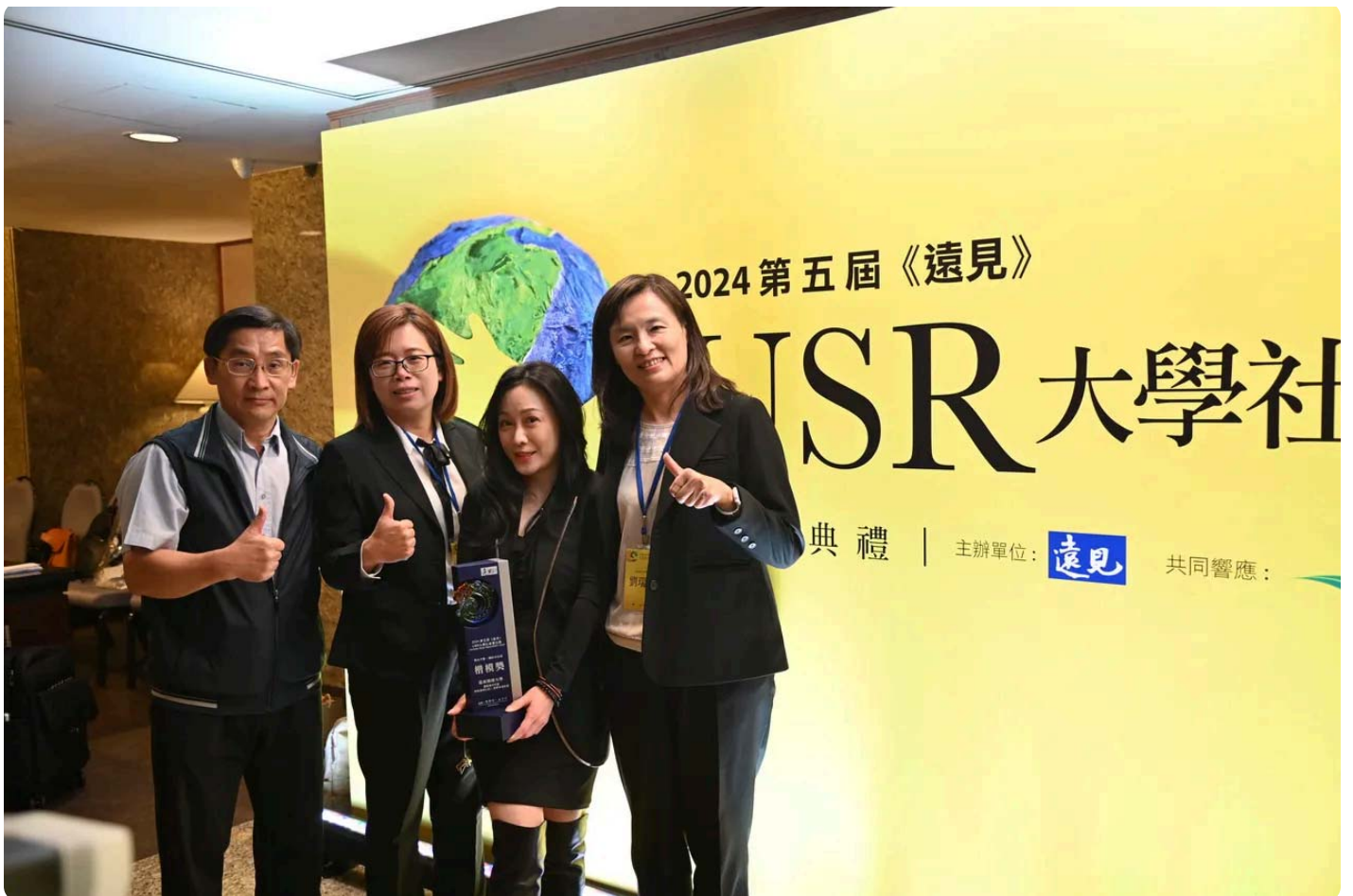
嘉南藥理大學獲得「福祉共生組」楷模獎。