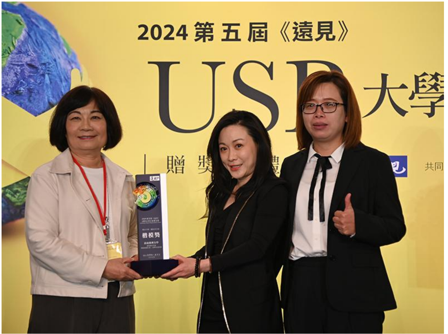
▲ 嘉南藥理大學在遠見雜誌USR大學社會責任獎獲得「福祉共生組」楷模獎