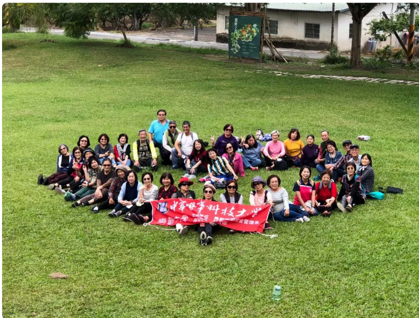
中華醫大USR團隊駐點楠西密枝社區，協助社造開發特色。

【記者王志弘 / 台南報導】遠見雜誌USR大學社會責任獎今天(9日)在台北舉辦頒獎典禮，台南市有三所大學表現優秀，中華醫事科技大學勇奪「在地共融組」首獎；嘉南藥理大學首次參賽就獲得「福祉共生組」楷模獎；崑山科大則三度蟬聯「生態共好組」楷模獎。