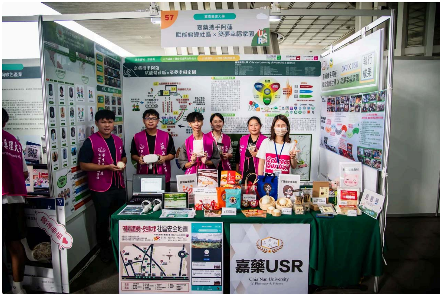
嘉藥以阿蓮地區當作示範場域，落實USR在地化。

嘉南藥理大學首次參賽就在54所學校脫穎而出，以「嘉藥攜手阿蓮：賦能偏鄉社區x築夢幸福家園」計畫獲得「福祉共生組」楷模獎。副校長張翊峰指出，嘉藥結合夥伴學校、醫療院所及合作企業提供專業服務與技術支援，鏈結社福資源、營造智慧社區及促進在地樂活，促使偏鄉朝幸福家園的方向推進。