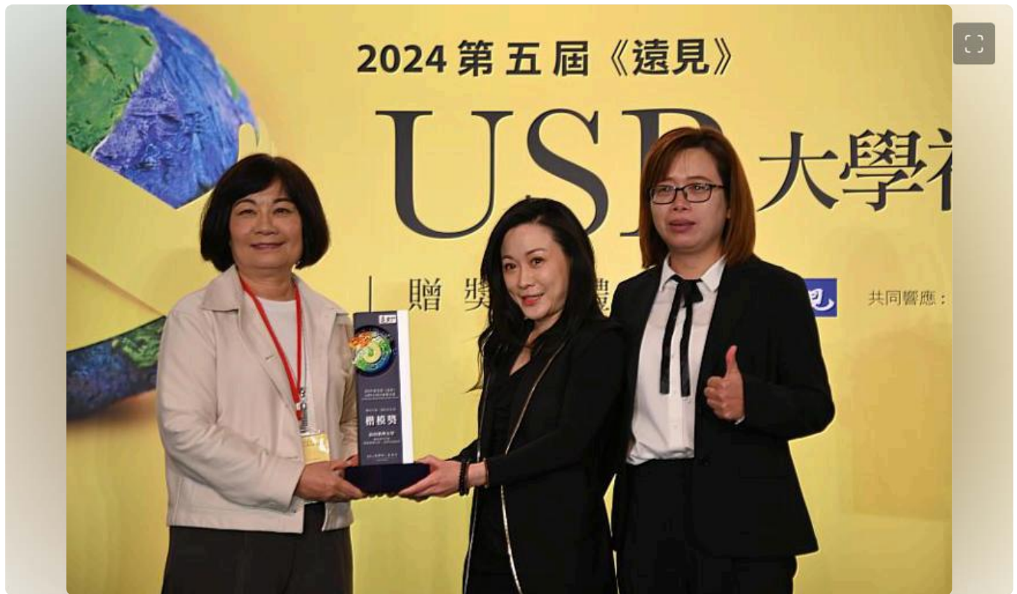
嘉南藥理大學在遠見雜誌USR大學社會責任獎獲得「福祉共生組」楷模獎

(中央社訊息服務20240410 09:36:35)2024第五屆遠見雜誌USR大學社會責任獎於4月9日下午舉辦頒獎典禮，嘉南藥理大學首次參賽就在54所學校脫穎而出，以「嘉藥攜手阿蓮：賦能偏鄉社區×築夢幸福家園」計畫獲得「福祉共生組」楷模獎殊榮。