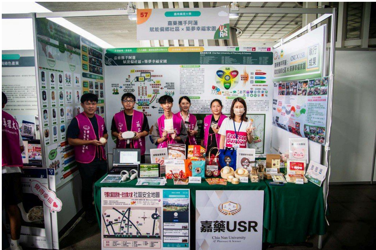
嘉藥以阿蓮地區當作示範場域發揮所長落實USR在地化。