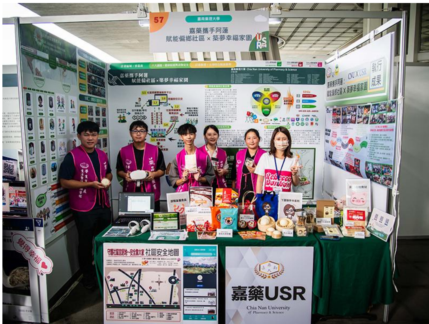
▲ 嘉藥以阿蓮地區當作示範場域發揮所長落實USR在地化

全」為主軸，涵蓋SDGs中多種項目，擘劃「優化偏鄉照顧資源」、「銀髮多元健康促進」與「友善食品營養加持」三個分項計畫，鏈結社福資源、營造智慧社區及促進在地樂活，藉由阿蓮社區示範場域擴散至鄰近偏鄉，促使偏鄉社區獲得最基本的生活支援、養生保健與休閒育樂。