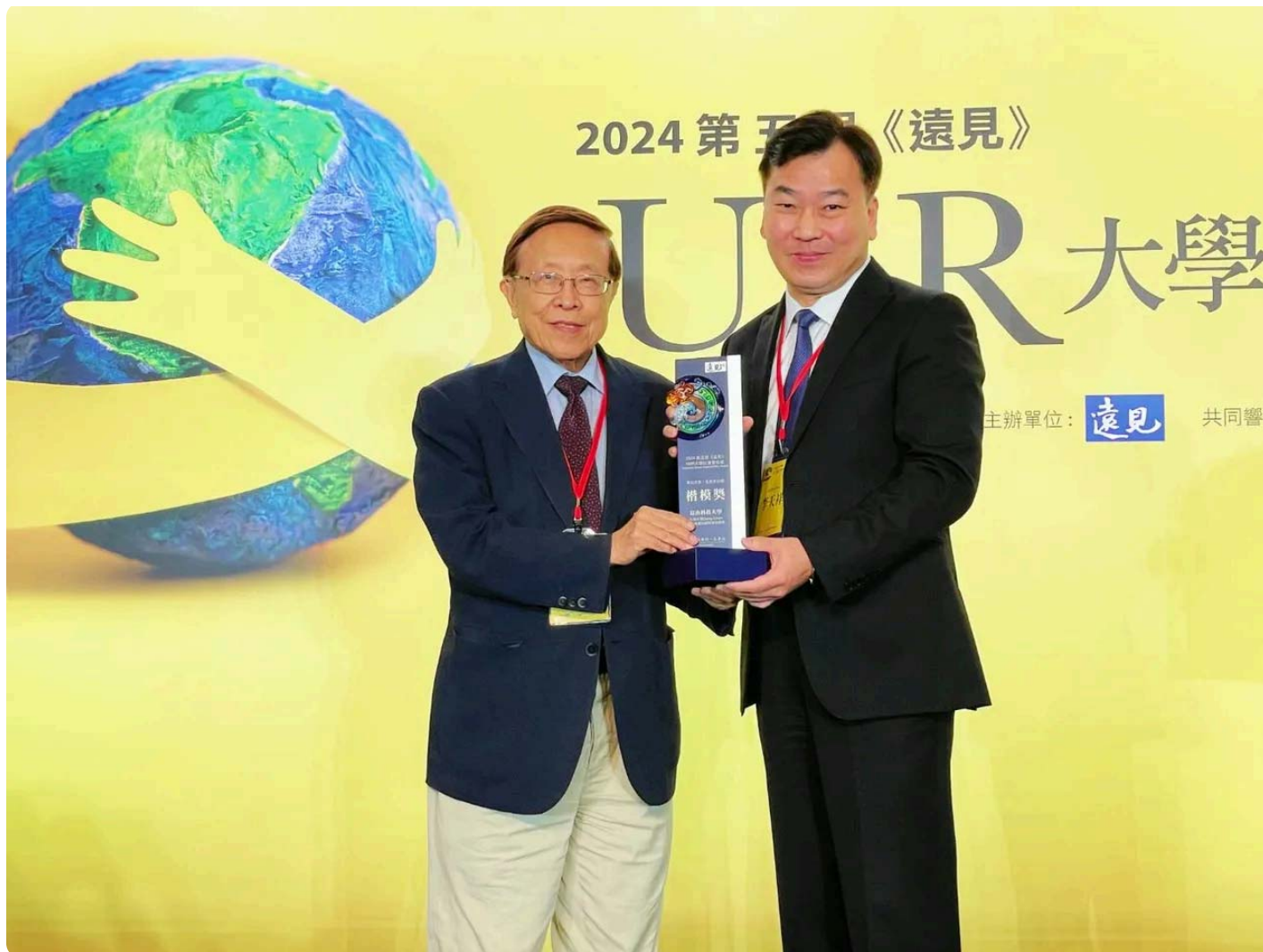
崑山科大三度蟬聯「生態共好組」楷模獎。