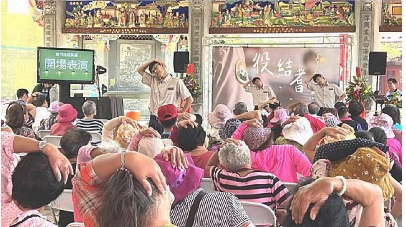
北門區公所長照替代役帶領現場長輩一起運動、活動筋骨，為成果展揭開序幕。