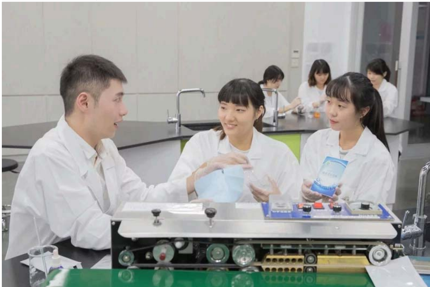
嘉南藥理學院6系扣緊大健康產業培養跨域人才。圖 / 嘉南藥理大學提供

2026年台灣將進入超高齡社會，老年人口突破480萬，銀色經濟也因此帶動大健康產業的蓬勃發展。因應產業發展，具專業且跨領域的大量人力需求也引起關注，包括第一線醫療照護人員，智慧醫療、生技研發等高階人才，也都是未來炙手可熱的行業。嘉南藥理大學，以「藥學」創校迄今超過半個世紀，其中藥理學院6學系更是緊扣大健康產業，攜手培養跨領域人才。