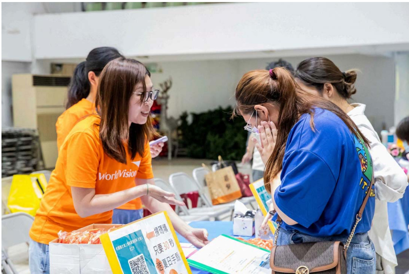
圖：嘉藥社福長照同學們至攤位了解目前職缺需求。