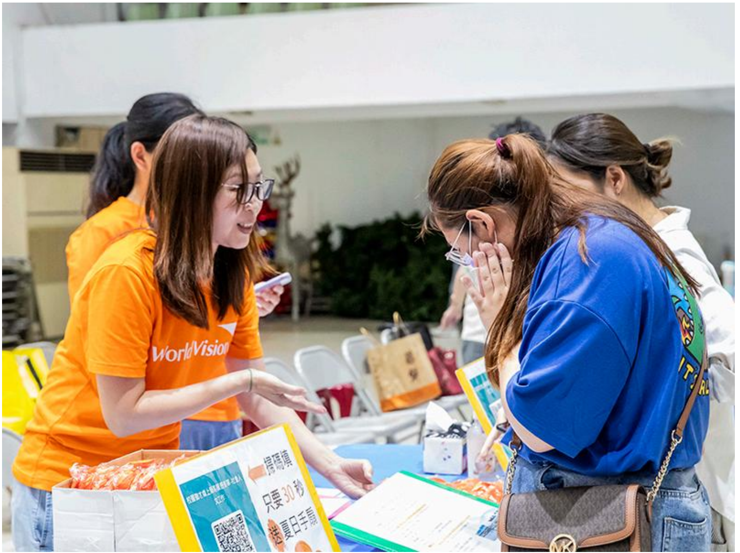
▲ 同學們至攤位了解目前職缺需求。