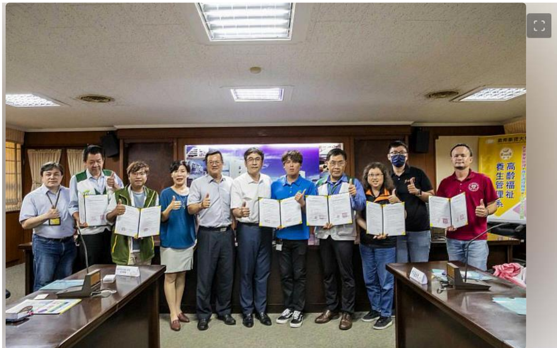
與國內31家社福長照機構簽署屬合作備忘錄

除了徵才博覽會外，嘉藥社會工作系與高齡福祉養生管理系也與31家社福及長照機構合作備忘錄，期望透過雙方的合作，能培育出所需的專業人才，以解決目前的社工及人力短缺問題。學生在就學期間也可至相關機構實習打工，提早為踏入社會做好準備並在畢業後能在職場上發揮專才服務社會。