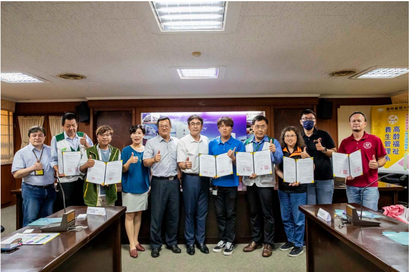
圖：嘉南藥理大學與國內31家社福長照機構簽屬合作備忘錄。(記者黃鐘毅 / 翻攝)

【記者黃鐘毅 / 台南報導】隨著2025年進入老年人口占比超過20%的超高齡社會，在少子化、高齡化社會趨勢下，社工及長照人才需求大幅提升。嘉南藥理大學社會工作系、高齡福祉養生管理系及餐旅管理系攜手國內31家知名社福及長照機構辦理徵才活動，提供破百個工作機會。