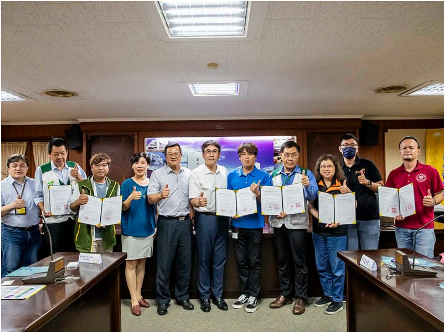
▲ 嘉藥與國內31家社福長照機構簽署合作備忘錄。

嘉南藥理大學指出，此次參與徵才的單位涵蓋3個公部門體系，臺南市政府社會局、臺南市政府家庭暴力暨性侵害防治中心、嘉義縣政府社會局及雲林縣政府社會局；15家相關長照單位機構；5家相關兒少單位；3家身障相關單位；綜合類業務類4家及1家飯店類，共計31家機構企業。