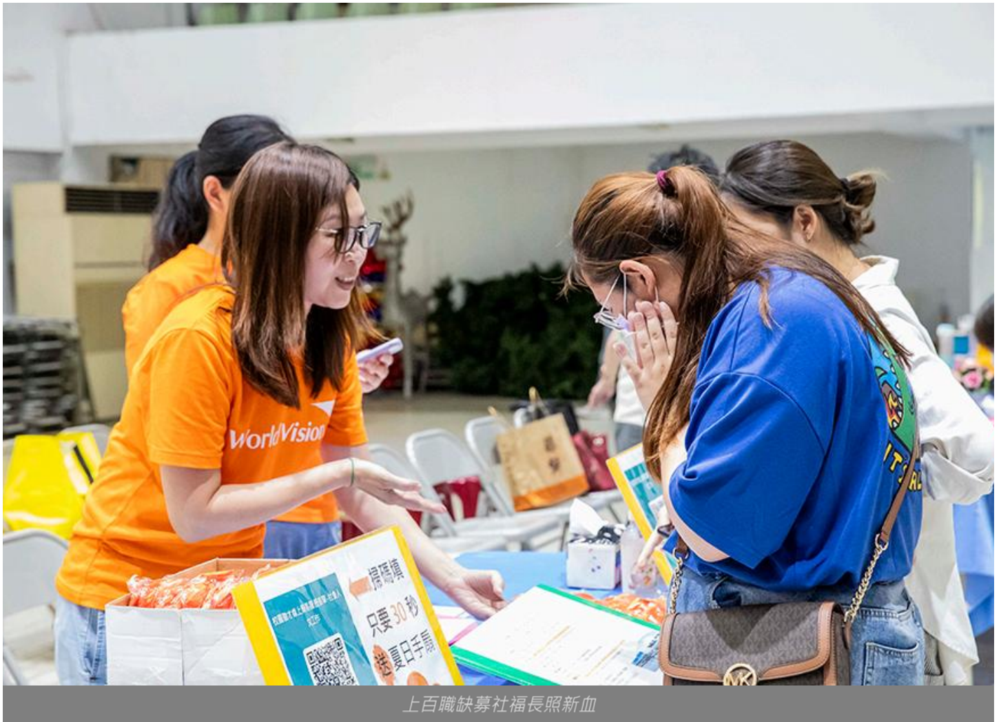
上百職缺募社福長照新血