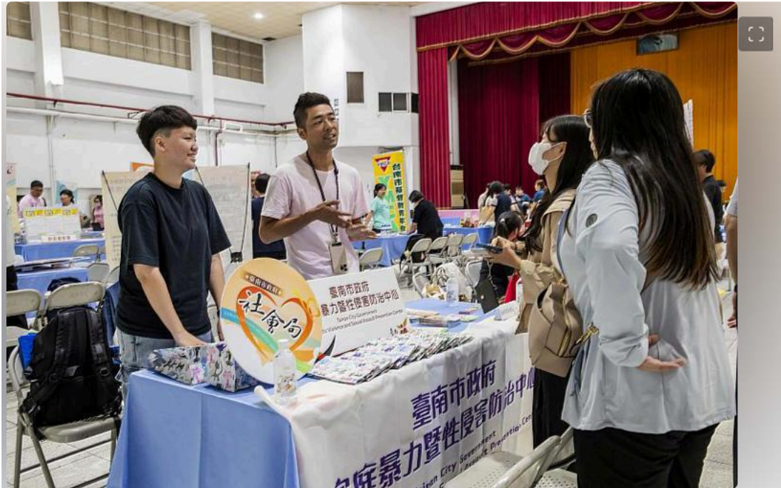
臺南市政府看上嘉藥社工系專業度特地前來設攤徵才

【本報訊】(2024年5月16日 09:32:11)隨著2025年進入老年人口占比超過20%的超高齡社在少子化、高齡化社會趨勢下，社工及長照人才需求大幅提升。嘉南藥理大學社會工、高齡福祉養生管理系及餐旅管理系攜手國內31家知名社福及長照機構辦理徵才活提供破百個工作機會。