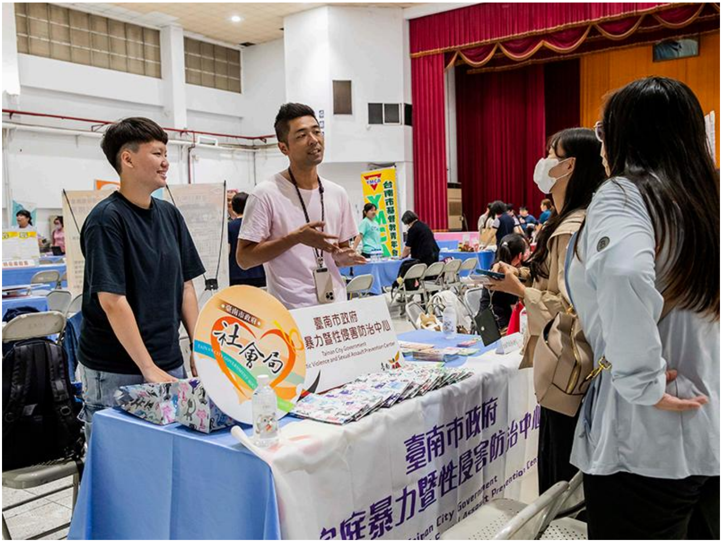
▲ 台南市政府看上嘉藥社工系專業度特地前來設攤徵才。