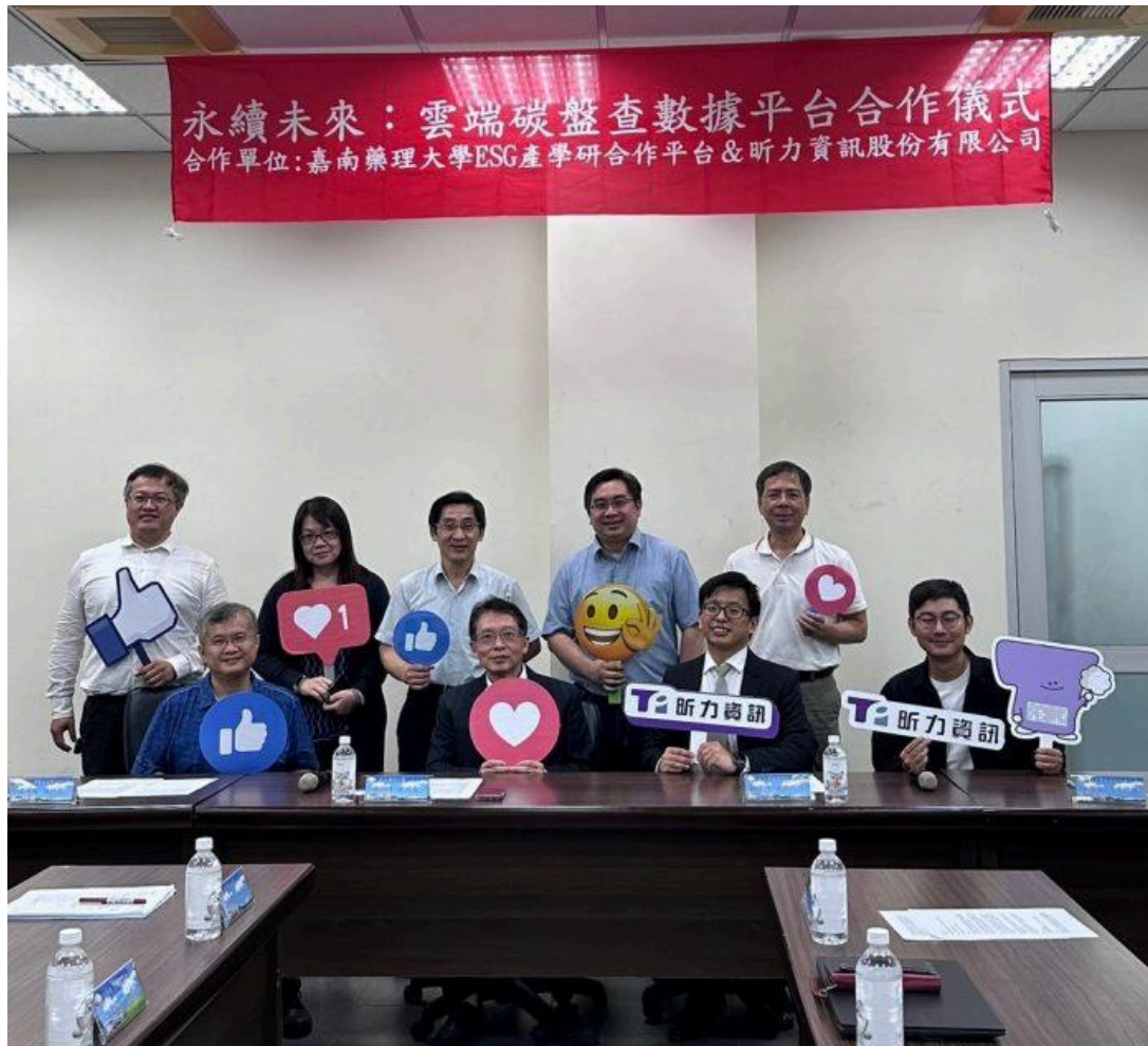
嘉南藥理大學ESG永續發展產學研合作平台與昕力資訊公司合作啟動新一代雲端碳盤查數據整合平台。