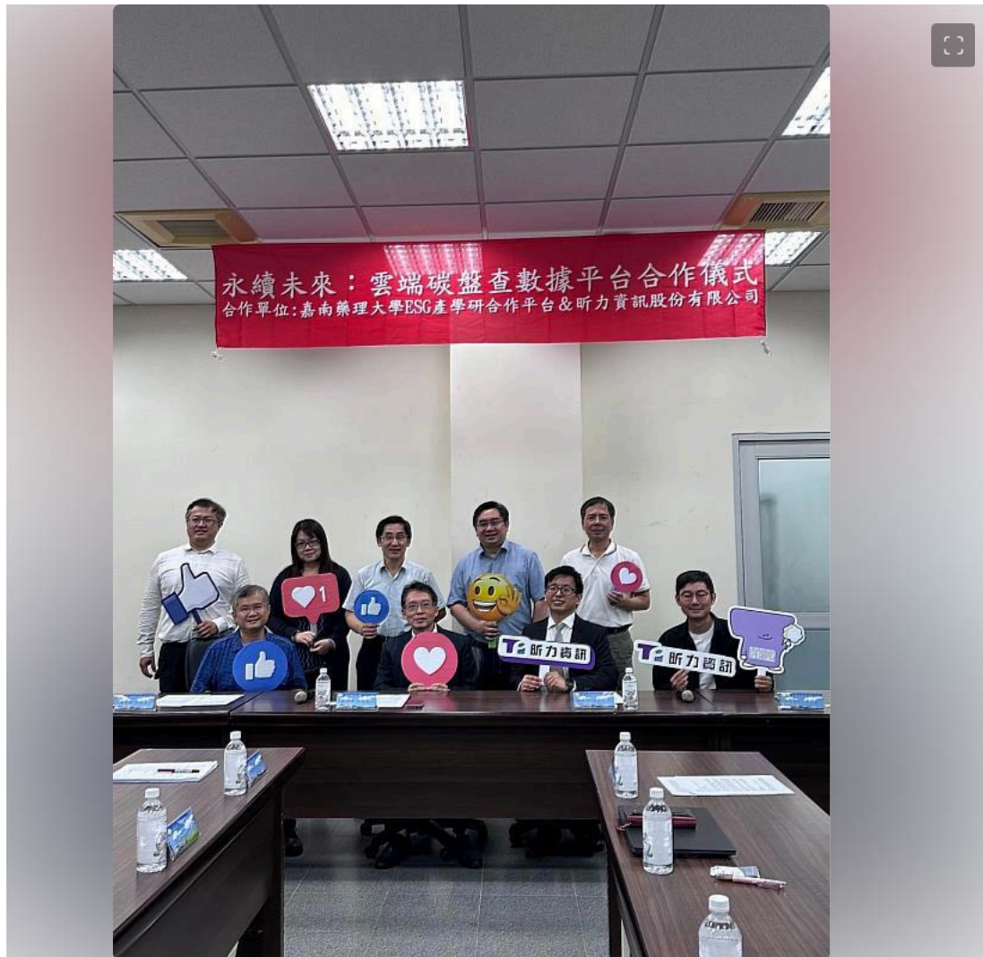
嘉南藥理大學ESG永續發展產學研合作平台與昕力資訊股份有限公司合作啟動新一代雲端碳盤查數據整合平台

社訊服務20240517 14:10:12)嘉南藥理大學ESG永續發展產學研合作平台與昕力資訊有限公司合作啟動新一代雲端碳盤查數據整合平台。