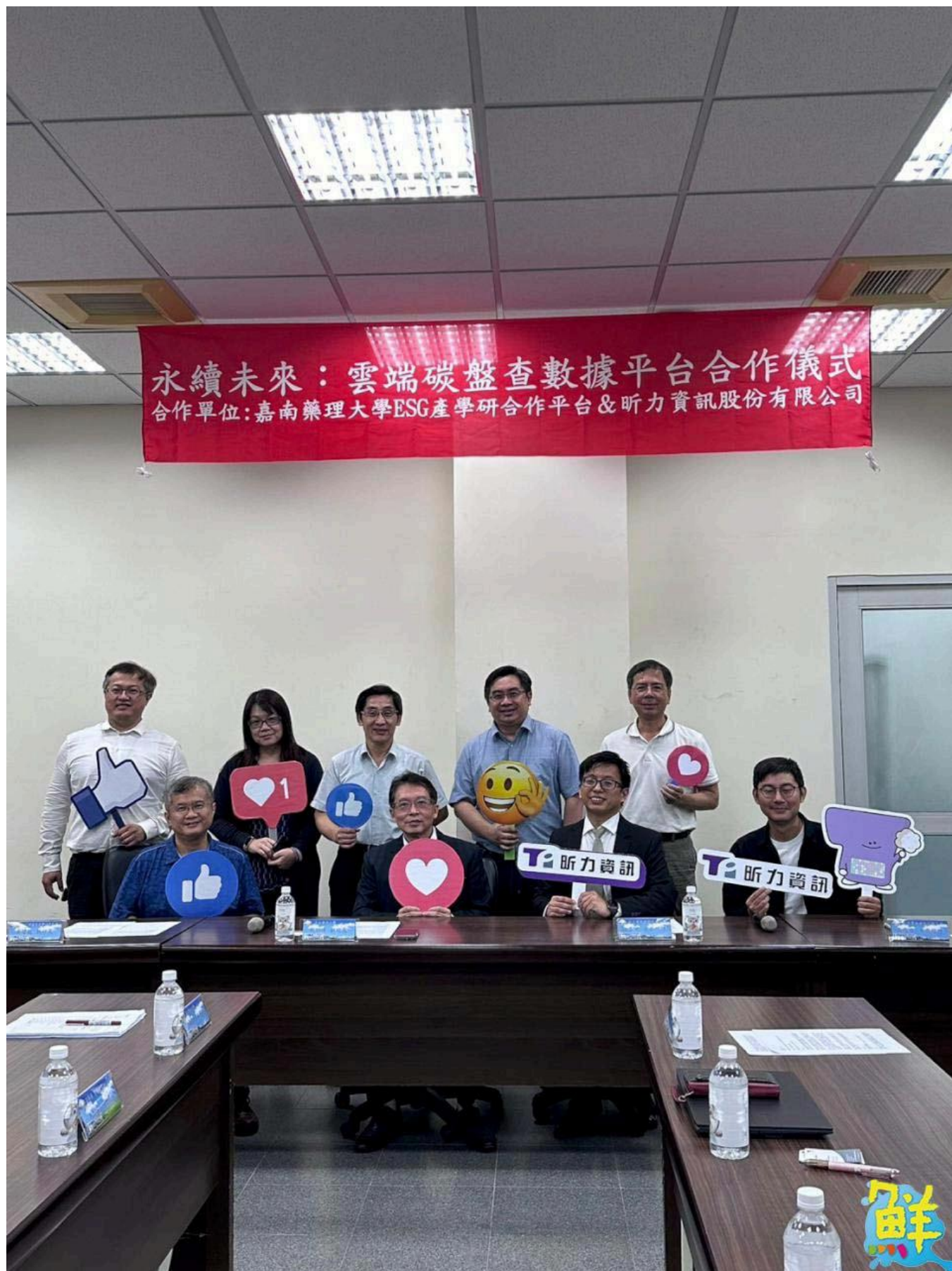
▲嘉南藥理大學ESG永續發展產學研合作平台與昕力資訊股份有限公司合作啟動新一代雲端碳盤查數據整合平台