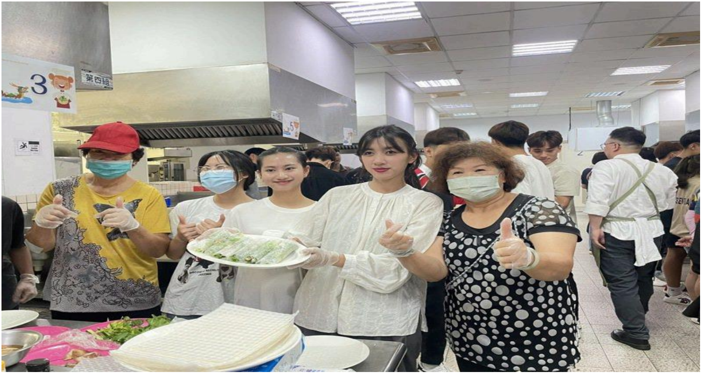
西港社区长辈教越南学生做台南粽子，越南学生也教长辈制作越南春卷。