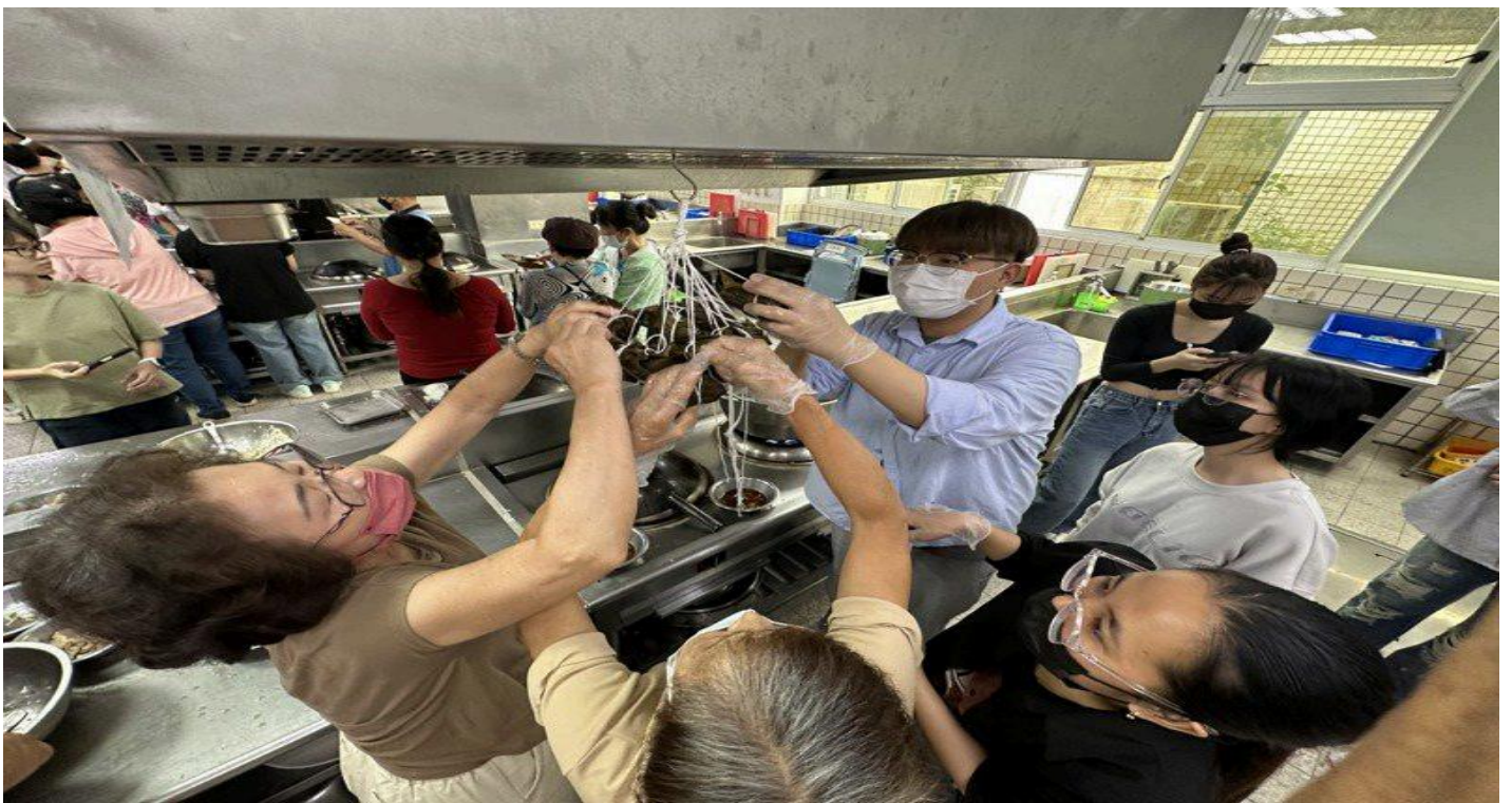
西港社區長輩教越南學生做台南粽子，越南學生也教長輩制作越南春卷。