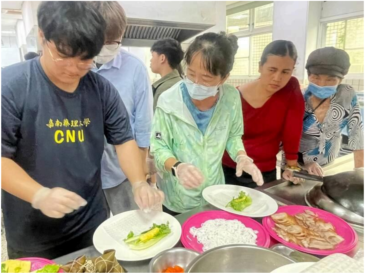
外籍生也分享道地的越南春捲，美食交流。