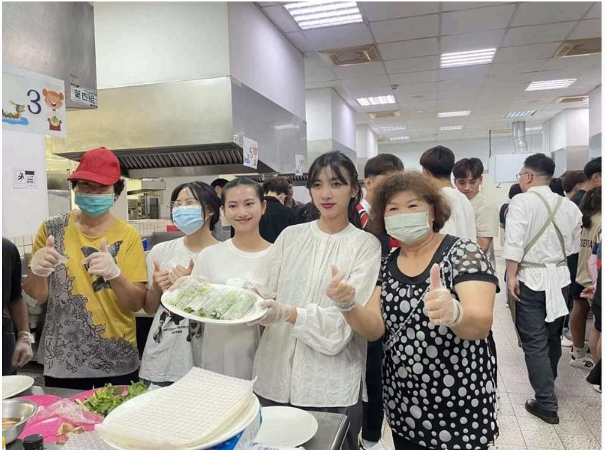
西港社區長輩教越南學生做台南粽子，越南學生也教長輩製作越南春捲。