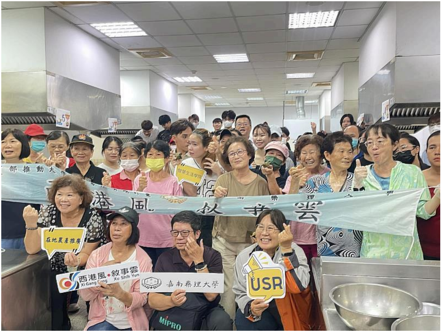
嘉藥越南生與西港長輩包粽過端午