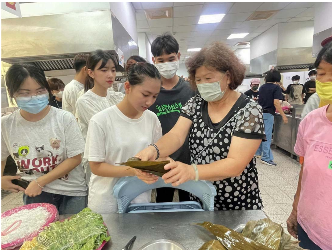
圖：嘉藥越生學習台灣傳統肉粽包法。（記者黃鐘毅 / 攝）

這場端午文化體驗活動，特別結合西港區在地的特產麻油 - 做出「麻油松阪豬粽」。由社區長輩現場示範包粽子技巧，從挑選粽葉到綁紮粽子的每個步驟，都一一詳解並展示，越南學生們在指導下，親自動手體驗，從初次接觸到逐漸熟練，現場氣氛熱烈且充滿歡笑。