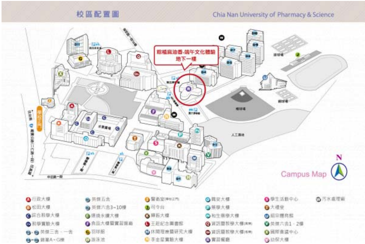
端午文化體驗活動位置圖。

為了迎接即將到來的端午節，嘉南藥理大學「西港風·敘事雲」USR計畫團隊選在6月4日於校內餐旅大樓舉辦一場「粽植麻油香:端午文化體驗」活動，邀請西港區30幾位廚藝志工、長輩及社區新住民，一同與多媒體國際專班學生體驗並了解台灣的傳統節日習俗。