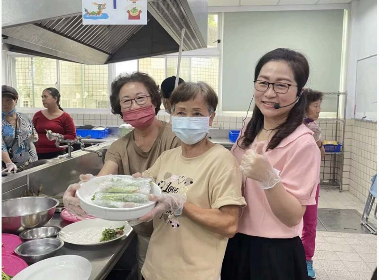
西港社區長輩教越南學生做台南粽子，越南學生也教長輩製作越南春捲。

薛雅明院長表示，西港是全台數一數二可從芝麻到麻油一條龍產區，活動透過在地食材結合台灣節慶，讓國際生對台灣飲食文化進一步了解，也多了青銀共學互動機會，讓學生及社區新住民不僅從長輩身上學到不同國家的節慶文化及習慣，也讓身處異鄉的新住民及學生感受濃濃的節慶氣氛。