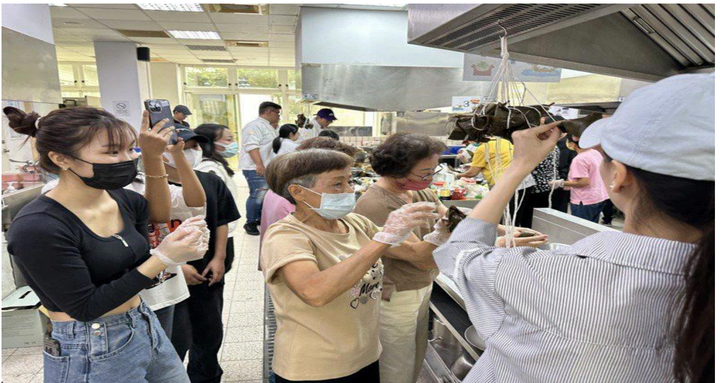
西港社區長輩教越南學生做台南粽子，越南學生也教長輩制作越南春卷。