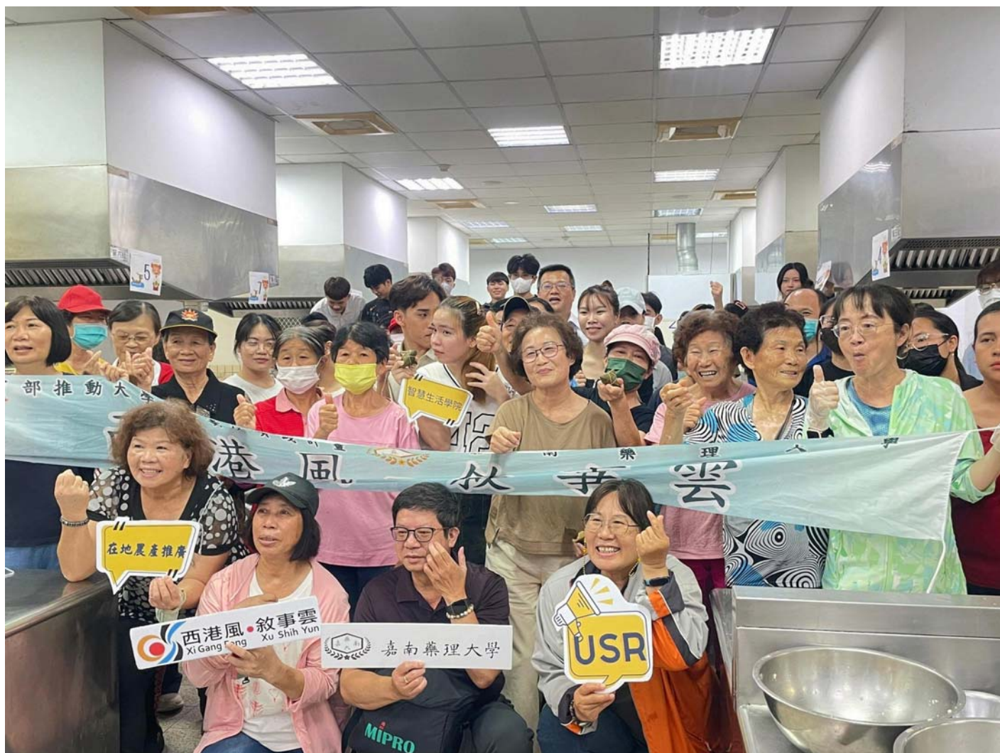
圖：嘉南藥理大學舉辦「粽植麻油香：端午文化體驗」活動，越南生與西港長輩包粽過端午。

【記者黃鐘毅 / 台南報導】端午節將屆，嘉南藥理大學4日在校內餐旅大樓舉辦「粽植麻油香：端午文化體驗」活動，邀請西港區30位廚藝志工、長輩及社區新住民，一同與37位國際專班學生包粽子，讓學生了解台灣的傳統節日習俗，學生也製作道地越南春捲分享給長輩們，場面熱絡。