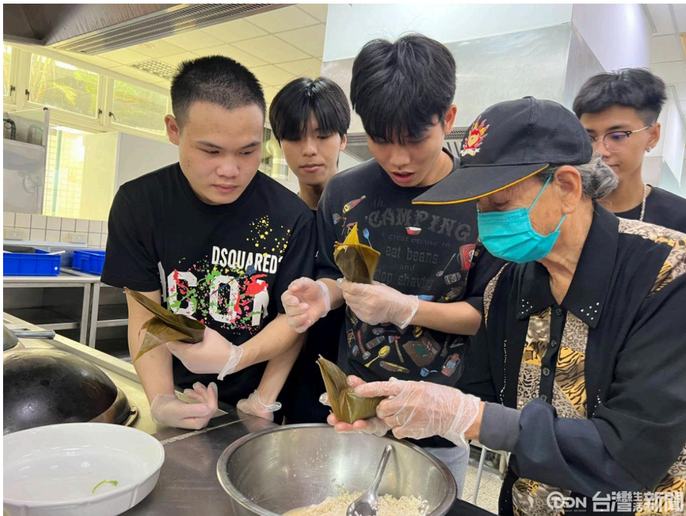
▲完成春捲後，就由長輩一步一步指導學生包粽子。