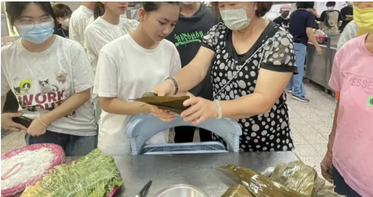
（圖說）西港社區長輩現場示範包粽子技巧，並傳授予越南學生。

現場除包粽子外，還安排端午節的歷史講解，讓越南生了解端午節的起源、歷史背景及相關的民間傳說故事，學生們在學習包粽子的同時，也增進對台灣傳統文化的了解。國際專班學生也製作道地越南春捲，分享給西港區志工及長輩們，並提到他們在越南過端午節時家家戶戶會大規模打掃清潔驅蟲，並吃甜酒釀及酸味水果。