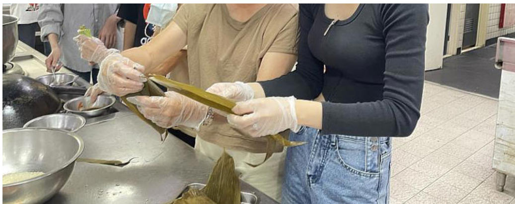
社區長輩現場示範包粽子技巧予越南學生

現場除了包粽子外，還安排了端午節的歷史講解，讓越南生了解端午節的起源、歷史背景以及相關的民間傳說故事，學生們在學習包粽子的同時，也增進了對台灣傳統文化的了解。國際專班學生也製作道地越南春捲，分享給西港區志工及長輩們，並提到他們在越南過端午節時家家戶戶會大規模打掃清潔驅蟲，並吃甜酒釀及酸味水果。