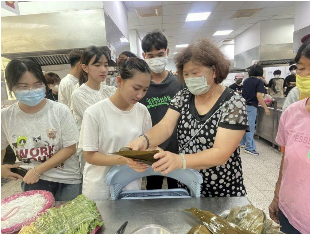
嘉藥越南籍學生學習台灣傳統肉粽包法。