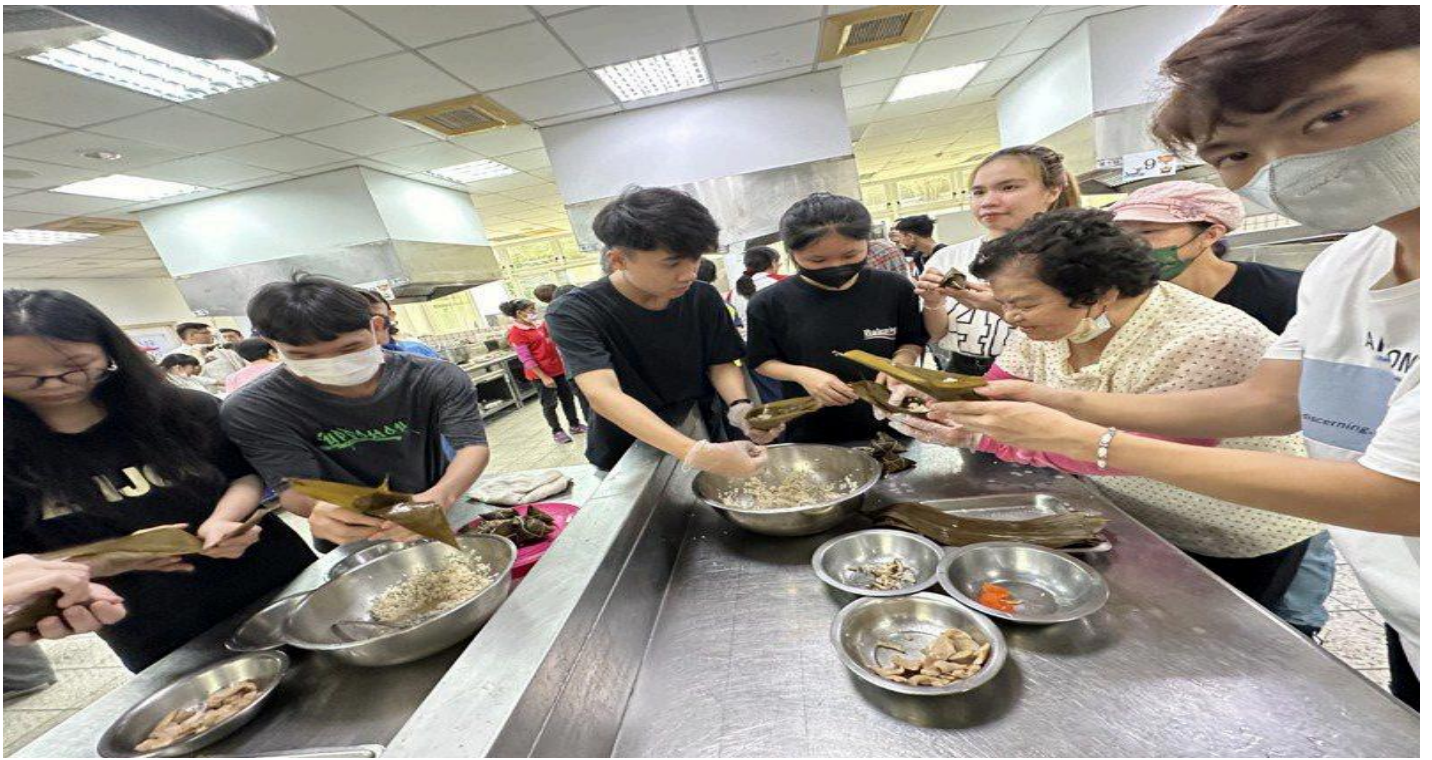
西港社區長輩教越南學生做台南粽子，越南學生也教長輩制作越南春卷。