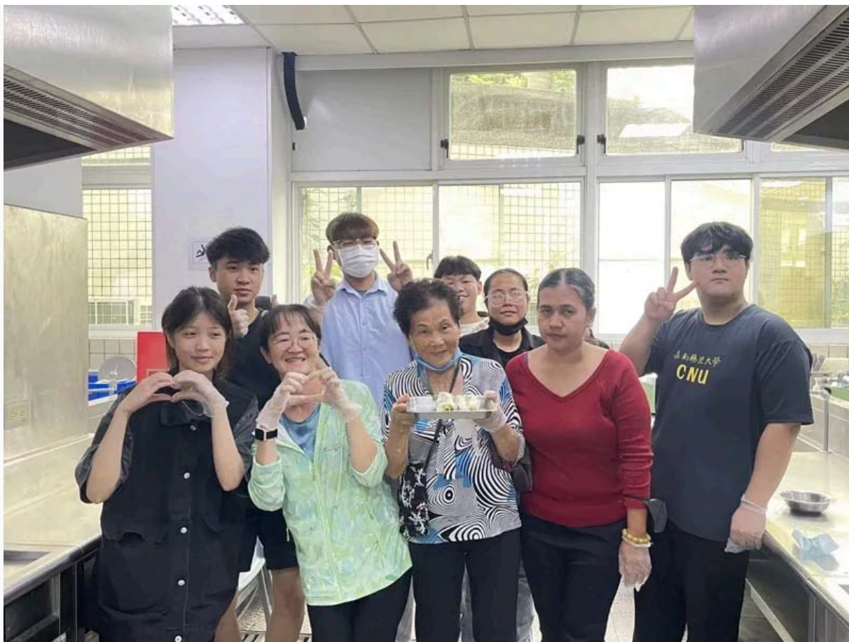
西港社區長輩教越南學生做台南粽子，越南學生也教長輩製作越南春捲。記者周宗禎 / 攝影