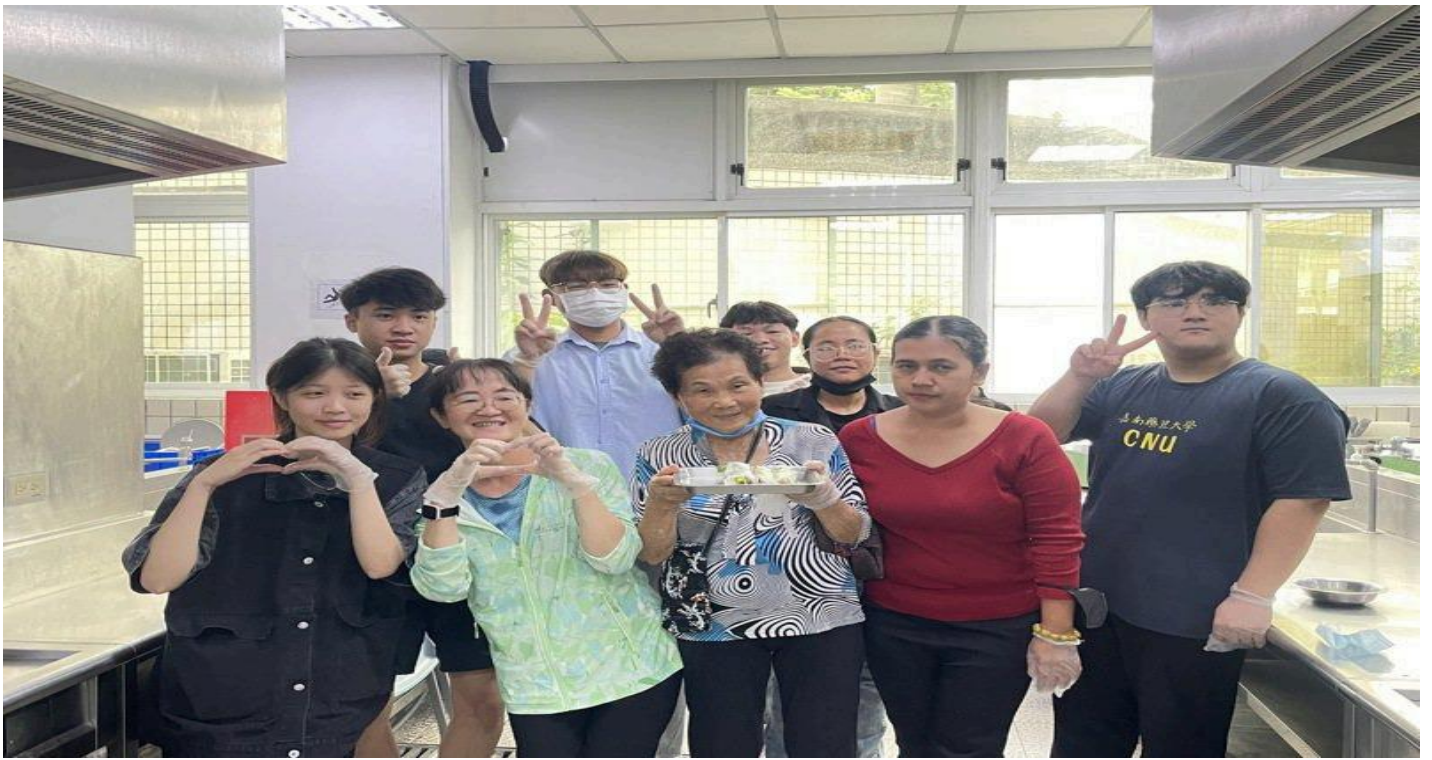
西港社區長輩教越南學生做台南粽子，越南學生也教長輩制作越南春卷。