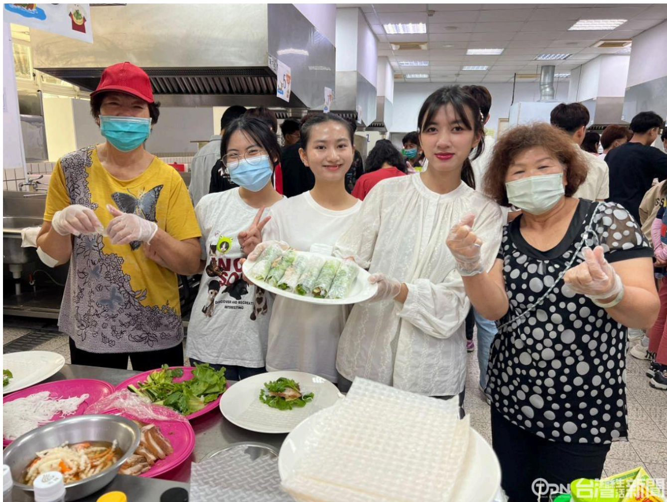
▲嘉南藥理大學舉辦了端午節活動，邀請越南籍學生跟西港社區長輩一起動手包越南春捲跟粽子。

完成春捲後，就由長輩一步一步指導學生包粽子，從折粽葉到綁粽子，都讓學生體驗到不同的經驗，大家都覺得非常好玩趣味，留下美好的回憶，長輩也鼓勵大家可以多多綁粽，會越來越熟練。