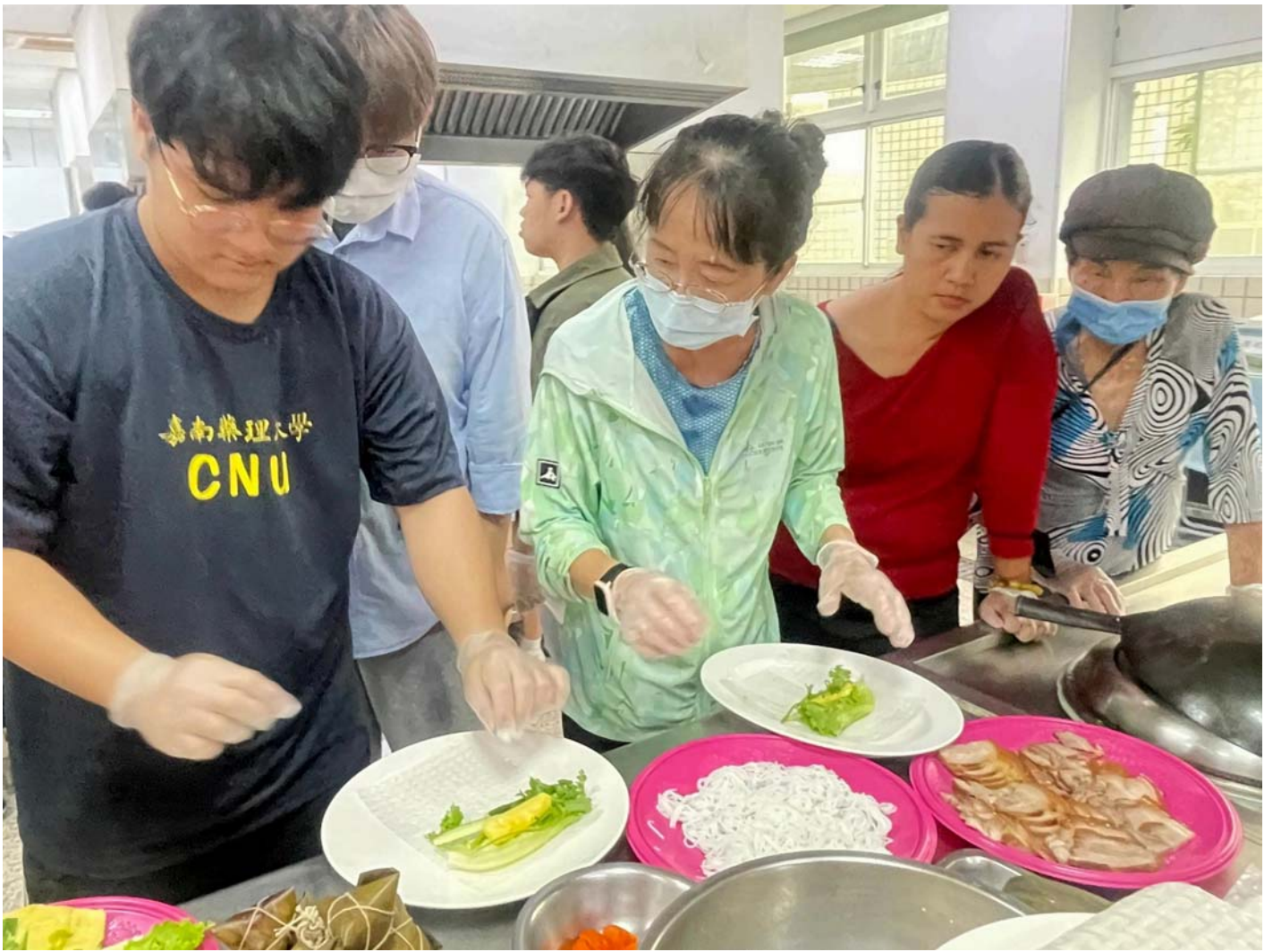
圖：越南學生教導長輩製作道地越南春捲。

國際專班學生也製作道地越南春捲，分享給西港區志工及長輩們，並提到他們在越南過端午節時家家戶戶會大規模打掃清潔驅蟲，並吃甜酒釀及酸味水果。參加活動的越南學生說，這是她第一次包粽子，雖然有些難度，但非常有趣。透過這個活動不僅學到新技能，也加深了對台灣文化的認識。