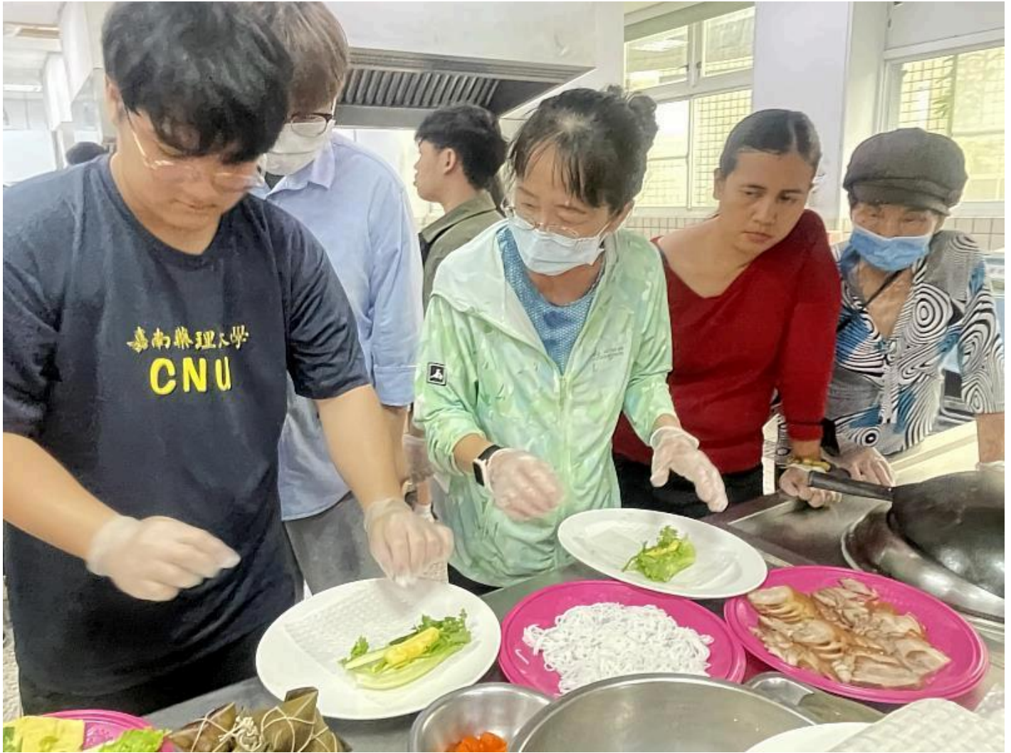
嘉藥越南學生教導長輩製作道地越南春捲

現場除了包粽子外，還安排了端午節的歷史講解，讓越南生了解端午節的起源、歷史背景以及相關的民間傳說故事，學生們在學習包粽子的同時，也增進了對台灣傳統文化的了解。國際專班學生也製作道地越南春捲，分享給西港區志工及長輩們，並提到他們在越南過端午節時家家戶戶會大規模打掃清潔驅蟲，並吃甜酒釀及酸味水果。