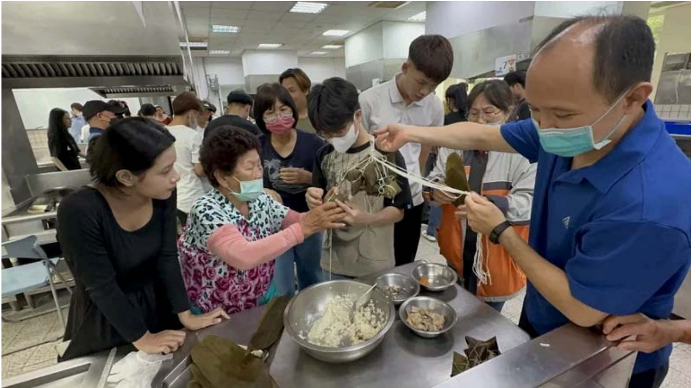
而港社區巨輩教高學生做台高粽了，越南學生也教巨輩制作越南春捲。

端午節將至，嘉南藥理大學邀請台南西港區30多位廚藝志工、長輩及社區新住民，今天到校教導多媒體國際專班37名越南新住民學生，讓他們體驗台灣的傳統節日習俗。雖然大多數人語言不通，但是比手劃腳還是能溝通，越南學生還回頭教長輩作越南春捲、一同享用，大家度過開心的一天。