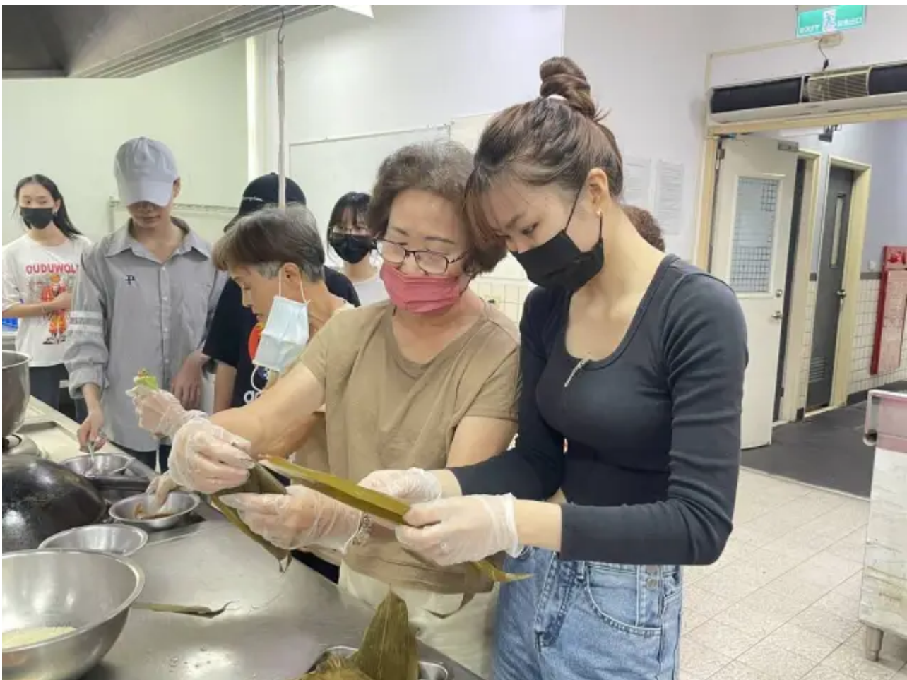
（圖說）嘉藥越生向西港社區長輩學習台灣傳統肉粽包法。

現場除包粽子外，還安排端午節的歷史講解，讓越南生了解端午節的起源、歷史背景及相關的民間傳說故事，學生們在學習包粽子的同時，也增進對台灣傳統文化的了解。國際專班學生也製作道地越南春捲，分享給西港區志工及長輩們，並提到他們在越南過端午節時家家戶戶會大規模打掃清潔驅蟲，並吃甜酒釀及酸味水果。