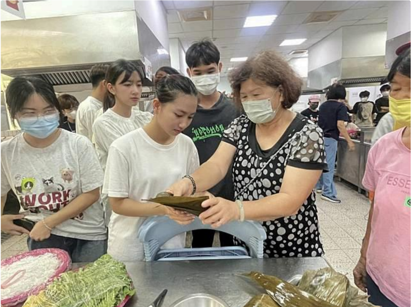
嘉藥越南籍學生學習台灣傳統肉粽包法。