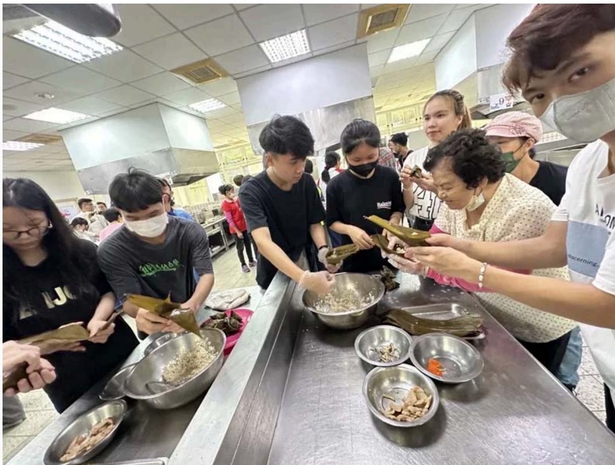
西港社區長輩教越南學生做台南粽子，越南學生也教長輩製作越南春捲。