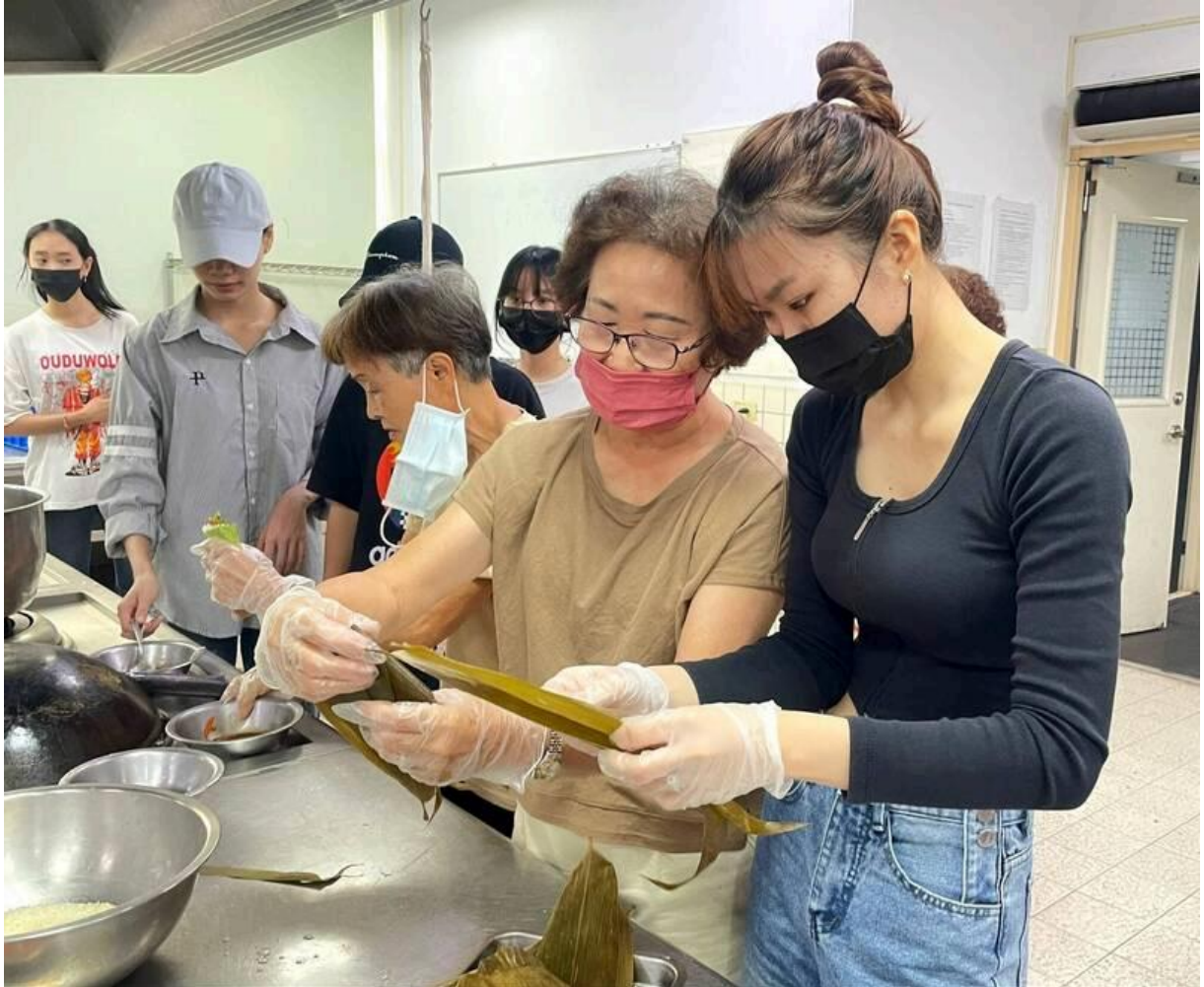
西港的社區長輩、廚藝志工，指導越南學生包裝端午應景的肉粽。