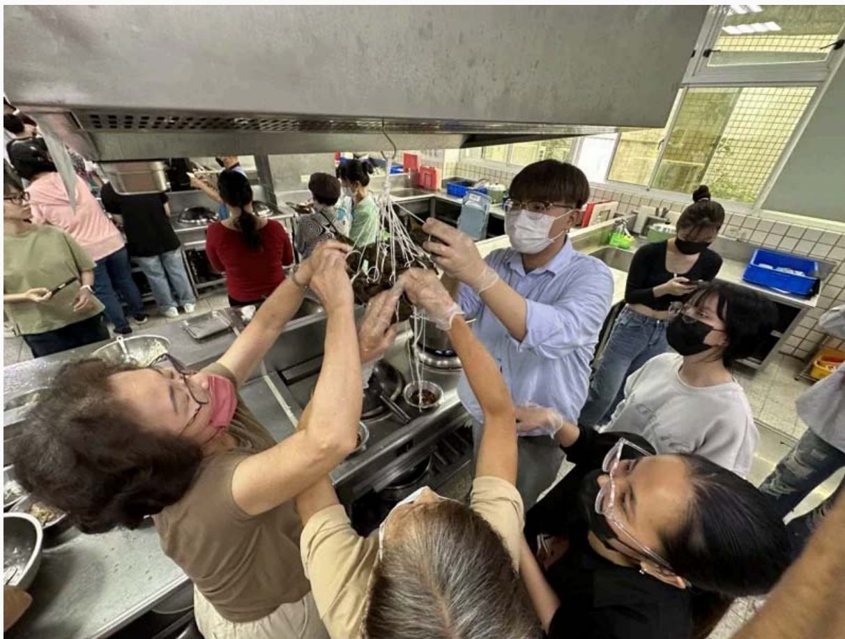
西港社區長輩教越南學生做台南粽子，越南學生也教長輩製作越南春捲。