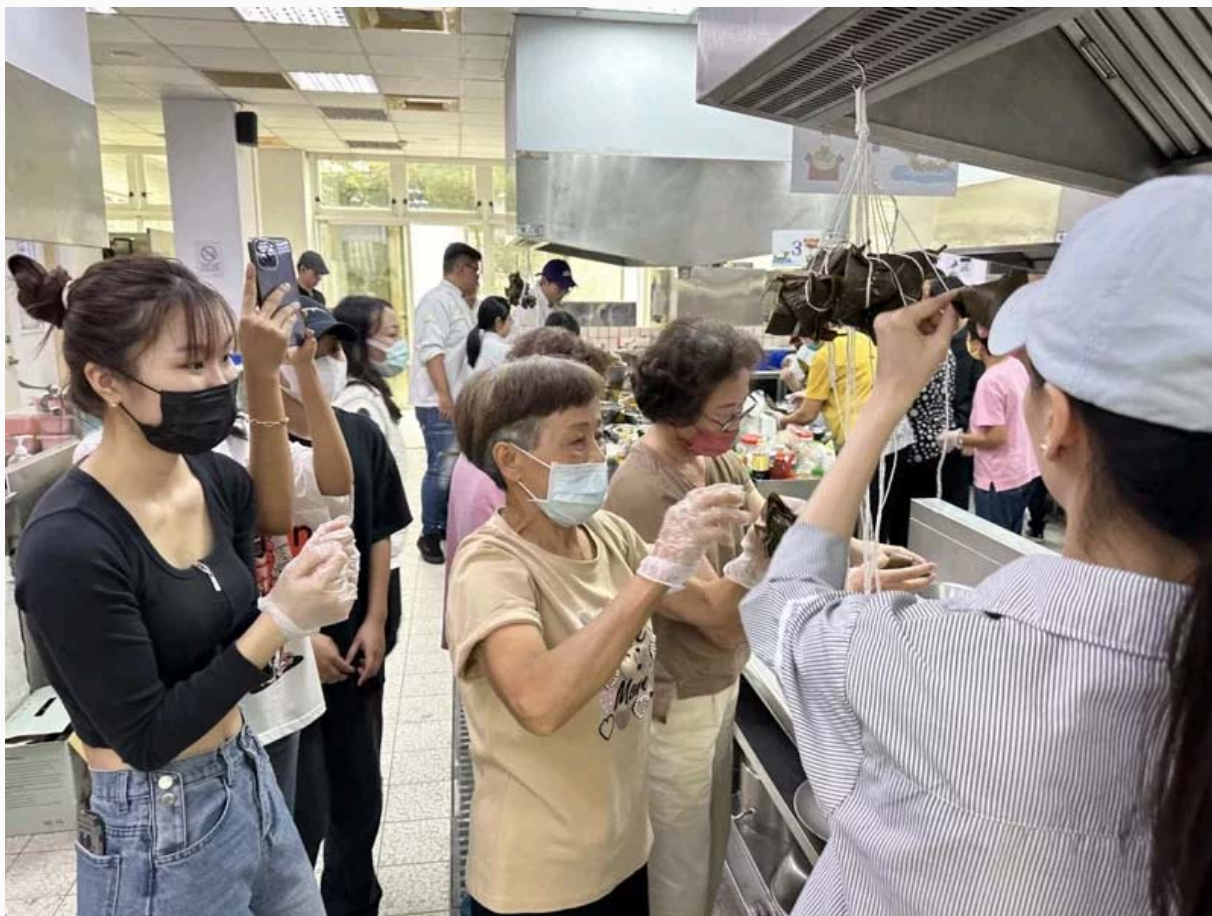
西港社區長輩教越南學生做台南粽子，越南學生也教長輩製作越南春捲。