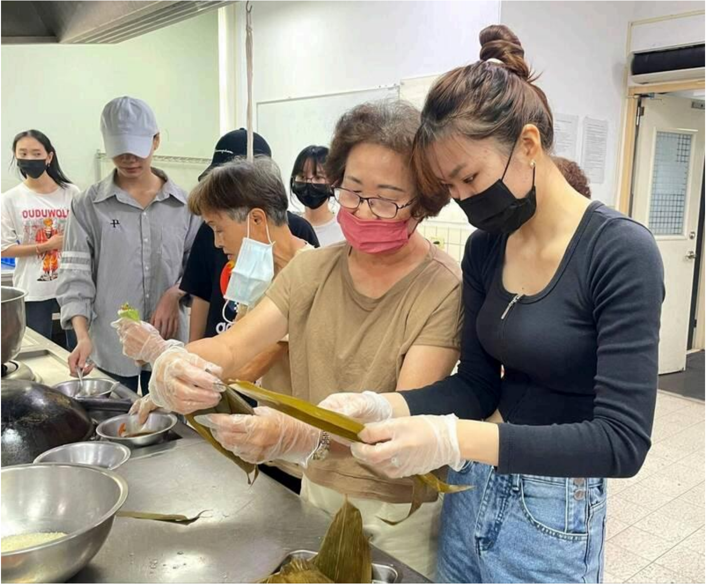
西港的社區長輩、廚藝志工，指導越南學生包裝端午應景的肉粽。