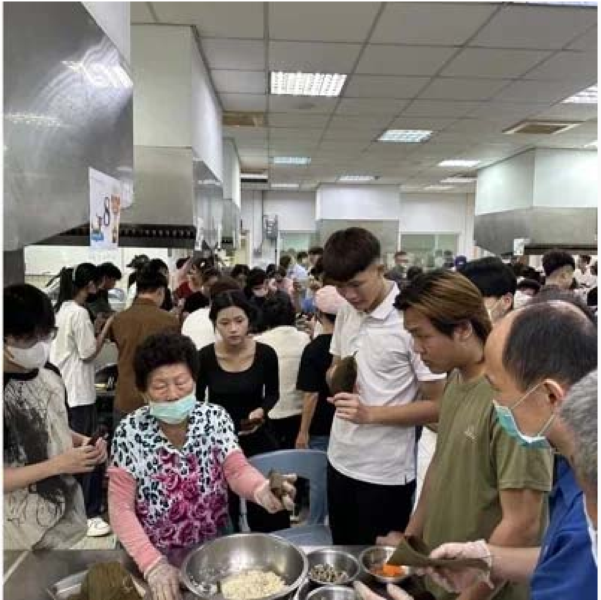
西港社區長輩教越南學生做台南粽子，越南學生也教長輩製作越南春捲。