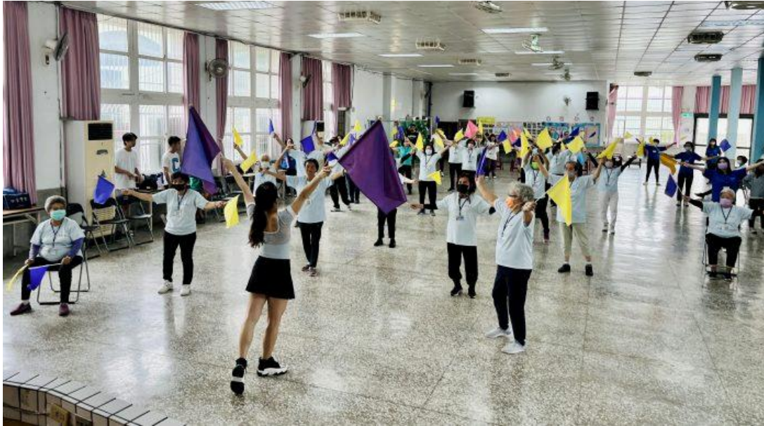
嘉藥團隊在動感音樂中帶領阿蓮長者進行旗舞律動操。