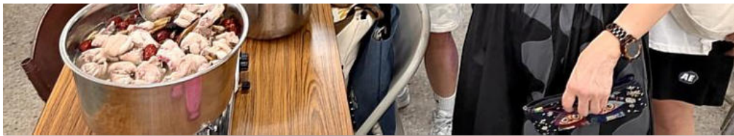
嘉藥營養系吳淑靜老師以溫補藥材做的藥膳食療湯

「銀髮多元健康促進」系列活動由嘉藥休閒系李伊鎔老師統籌規劃，內容涵蓋「中醫體質檢測諮詢、筋絡養生保健、藥膳食療養身保健、八段錦養生功及旗舞律動操、四季歌謠歌詠、創意桌遊與精油紓壓經絡保健」等，讓長者了解自身體質，學會筋絡理療按摩，在日常生活中便可自行保養，並以溫補藥材做藥膳食療，教導長輩以食療做保健。