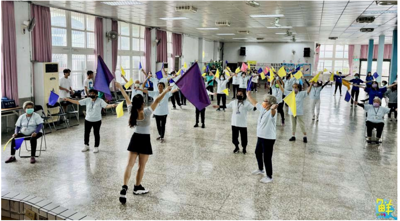
▲ 畢辰御業師在動感音樂中所帶領的旗舞律動操深受長者與學生的熱愛