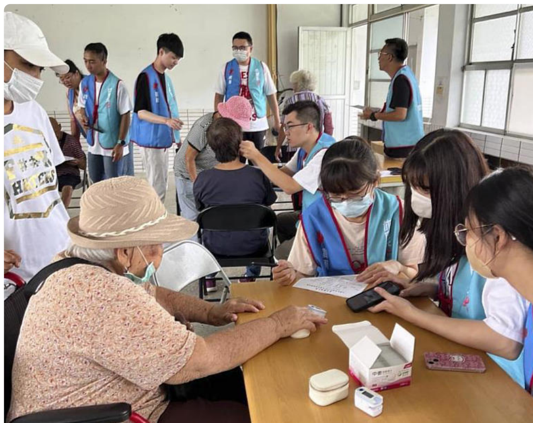
嘉藥學生團隊為長者進行體質檢測諮詢

「八段錦養生功及旗舞律動操」特別邀請義守大學中醫部蔡金川部長、王軍醫師、業界師資畢辰御及前雲門舞集舞者休閒系李宏夫老師，一起帶領長輩做養生功。有些長者從一開始生硬的伸展，逐漸游刃有餘地舞動著，在優美動感的音樂聲中展現熱情與活力，嘉藥學生從在旁守護長輩也紛紛加入，大家共舞開懷笑呵呵。嘉藥休閒系李伊鎔老師表示，規劃銀髮多元健康促進活動時，特別籌組「教師專業輔導團隊」，整合各界高手，為阿蓮地區長輩量身打造符合他們的活動，這不僅是對學生實務能力的鍛鍊，更是對社區服務精神的實踐。學生們在活動中表現出高度的熱情與專業，帶領長輩體驗不同類型的活動。參加的長輩們紛紛表示，課程不僅讓他們學到新的知識和技能，還結交許多新朋友，身心都感到愉悅和放鬆。