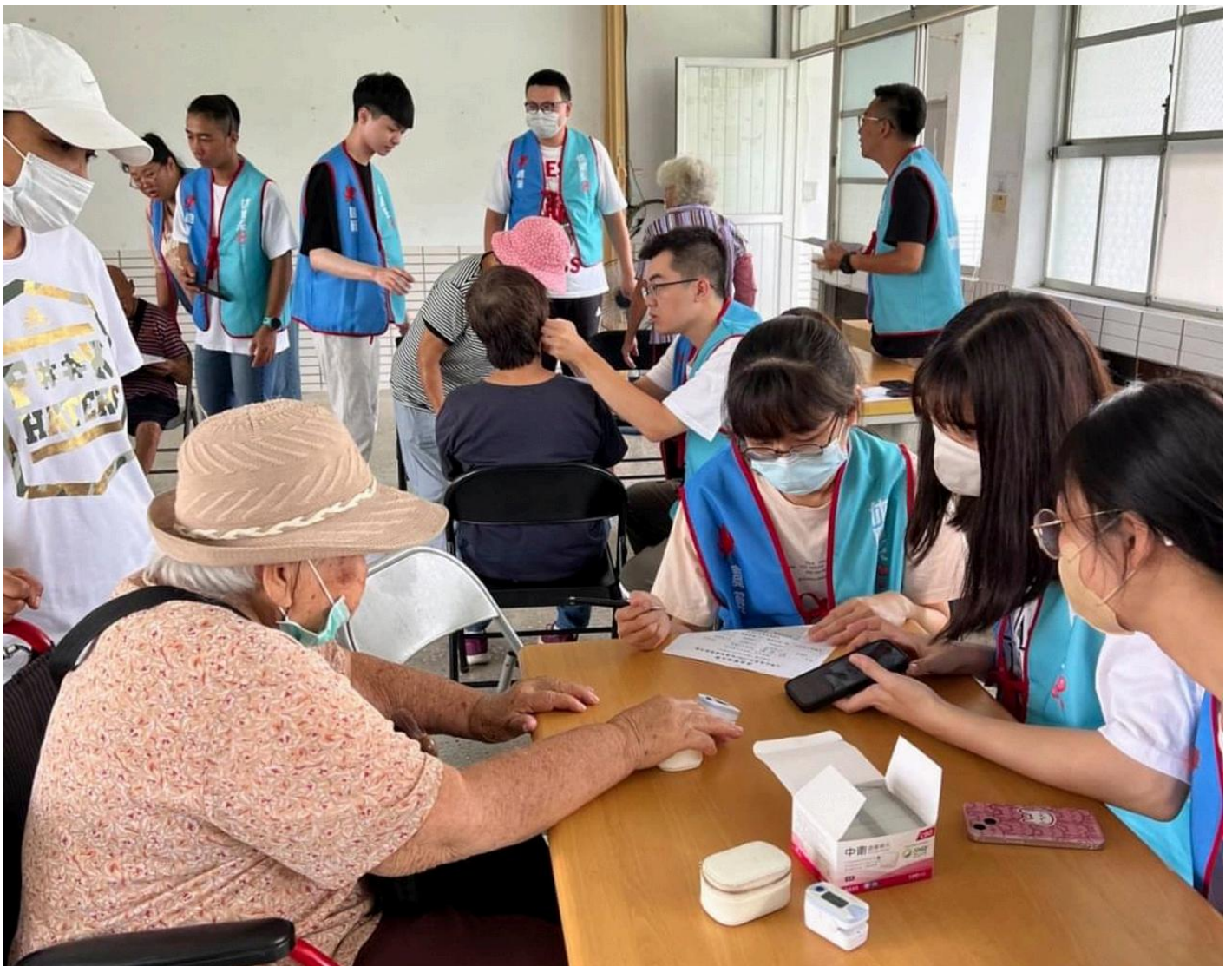
圖：嘉藥學生團隊為長者進行體質檢測諮詢。

【記者黃鐘毅 / 台南報導】嘉南藥理大學「嘉藥攜手阿蓮：賦能偏鄉社區×築夢幸福家園」USR深耕計畫，為將健康多元活動課程帶入偏鄉社區，讓「青銀共學」充滿樂趣與活力，特別規劃「銀髮多元健康促進」系列活動，期望增加銀髮族社會參與及人際關係互動，促進記憶與延緩老化，幫助長者