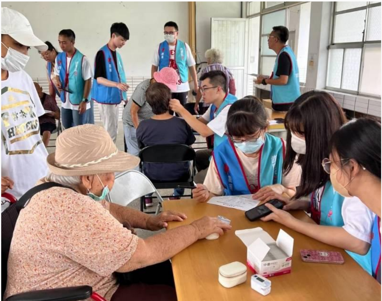
【勁報記者于郁金 / 臺南報導】嘉南藥理大學「嘉藥攜手阿蓮：賦能偏鄉社區 × 築夢幸福家