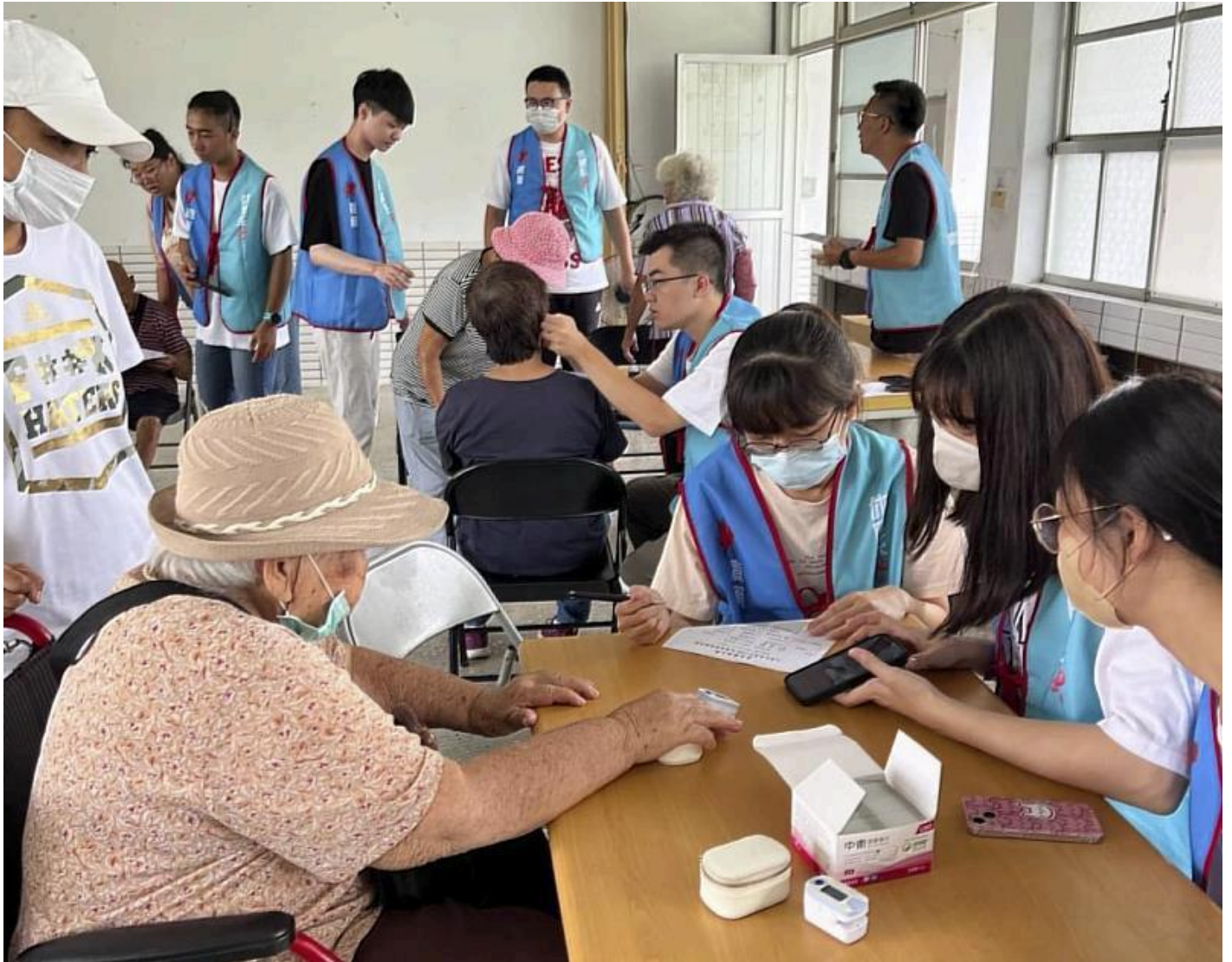
嘉藥學生團隊為長者進行體質檢測諮詢