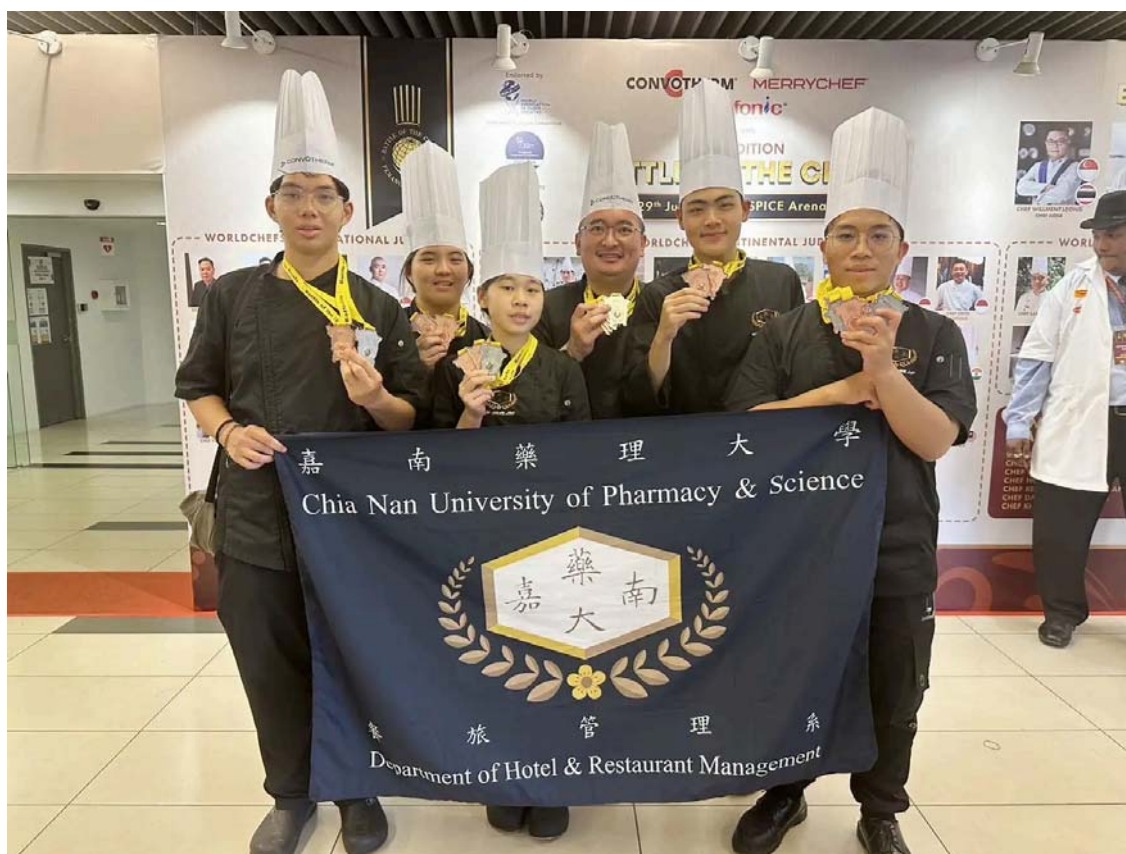
嘉藥西廚隊在檳城國際廚藝競賽奪5銀14銅10佳作。

嘉南藥理大學餐旅管理系西廚培訓隊，於6月底在2024檳城國際廚藝競賽中大放異彩，榮獲5銀14銅10佳作的卓越成績，為學校增添光彩。