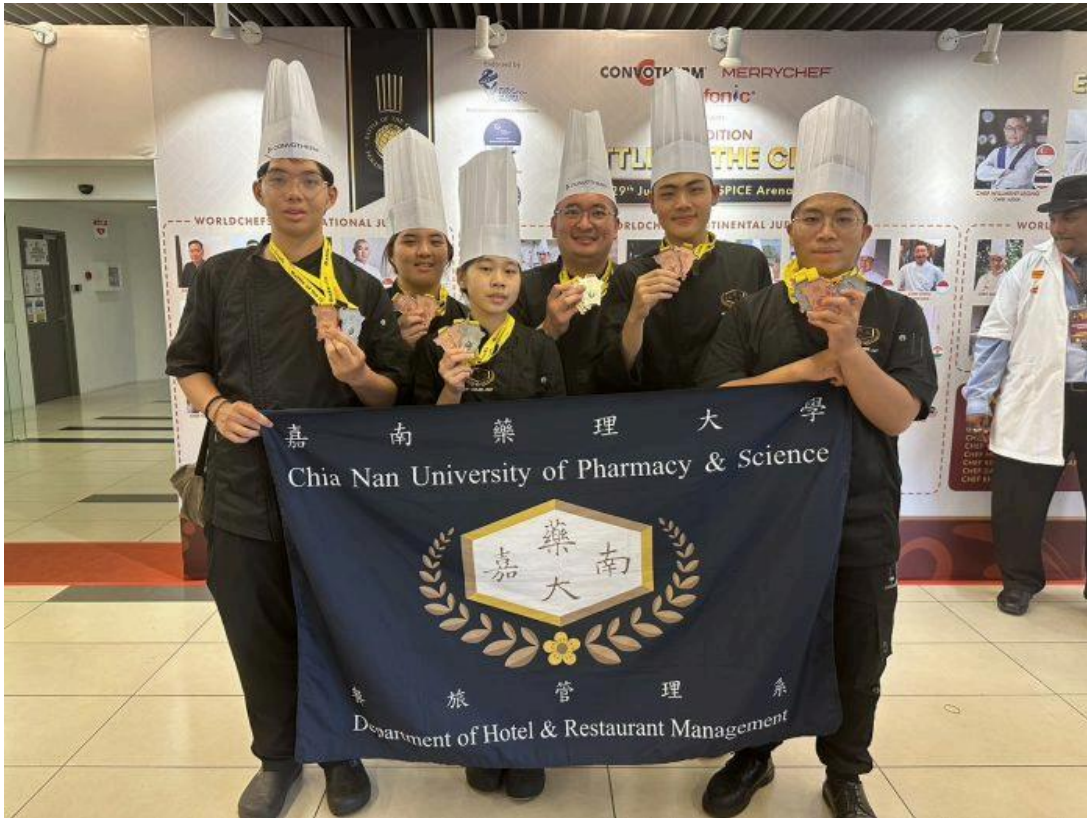
嘉藥西廚隊在檳城國際廚藝競賽奪五銀、十四銅、十佳作。