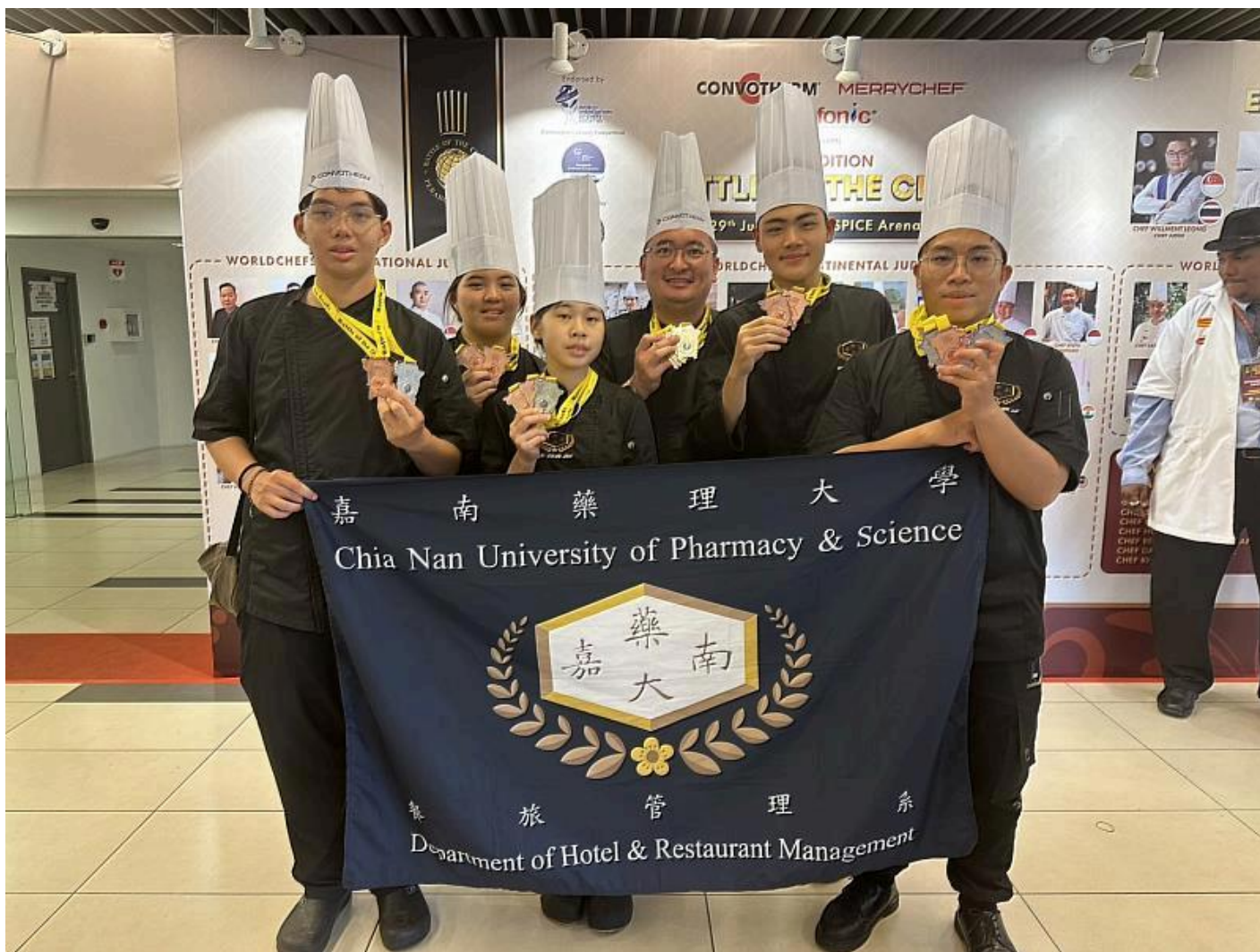
嘉藥西廚隊在檳城國際廚藝競賽奪5銀14銅10佳作

(中央社訊息服務20240702 15:06:10)嘉南藥理大學餐旅管理系西廚培訓隊，於6月底在2024檳城國際廚藝競賽中大放異彩，榮獲5銀14銅10佳作的卓越成績，為學校增添光彩。