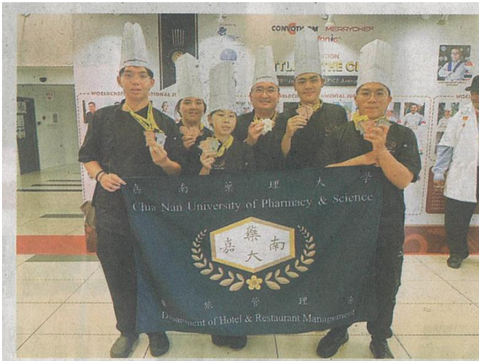
↑嘉藥西廚隊在檳城國際廚藝競賽奪五銀、十四銅、十佳作。