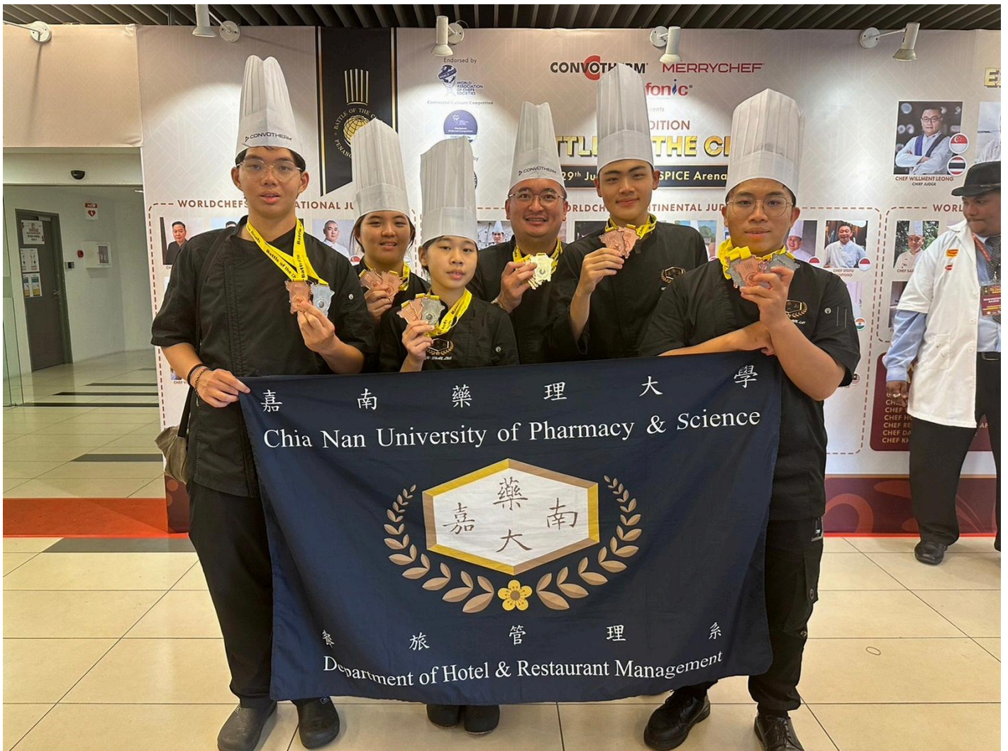
圖：嘉藥西廚隊在檳城國際廚藝競賽奪5銀14銅10佳作。

【記者黃鐘毅 / 台南報導】嘉南藥理大學餐旅管理系西廚培訓隊，於6月底在2024檳城國際廚藝競賽中大放異彩，榮獲5銀14銅10佳作的卓越成績，為學校增添光彩。