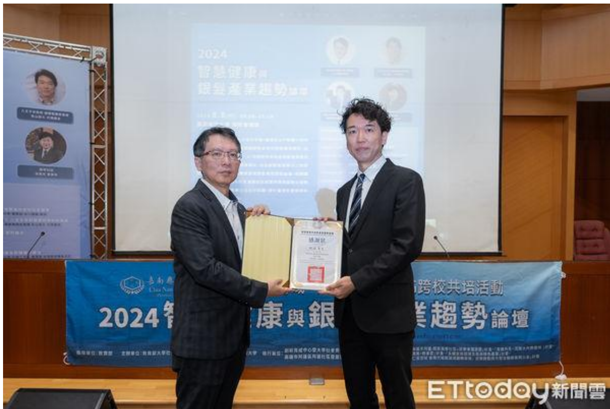
▲嘉南藥理大學「大學社會責任推動辦公室」結合USR夥伴學校，8日在校內國際會議中心舉辦「2024智慧健康與銀髮產業趨勢論壇」。