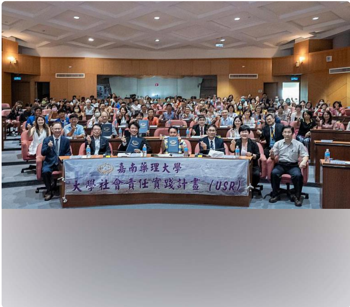
嘉藥舉辦智慧健康與銀髮產業趨勢論壇 促進產業創新與國際合作

動台灣智慧健康與銀髮產業創新發展。此論壇也邀請阿蓮區阿蓮社區發展協會、西港區港東社區發展協會、龍崎教養院、衛生福利部嘉義醫院等USR合作單位共襄盛舉。