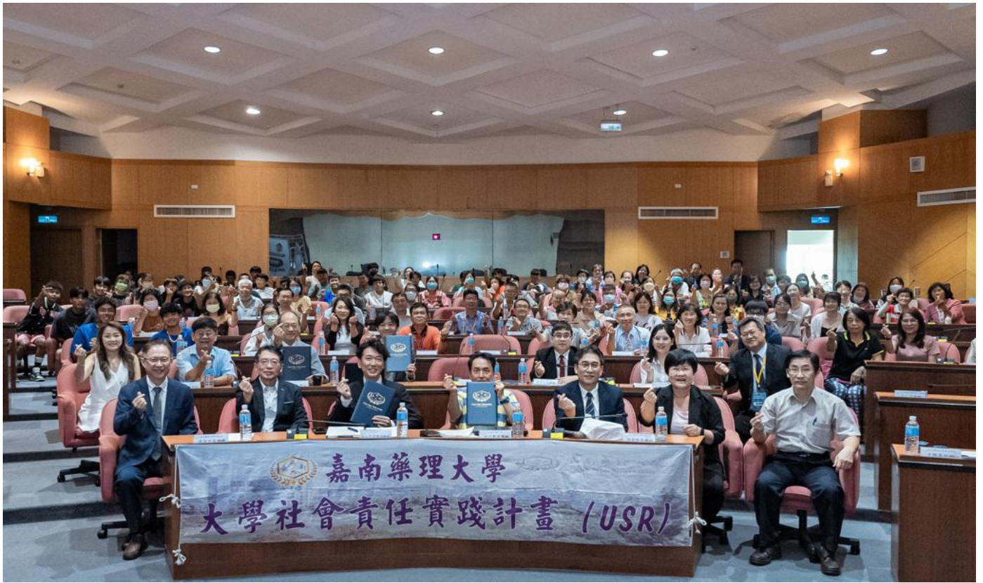
嘉藥舉辦智慧健康與銀髮產業趨勢論壇，促進產業創新與國際合作。

為因應高齡與少子女化社會趨勢所導致的醫療支出攀升與照護人力不足問題，嘉南藥理大學「大學社會責任推動辦公室」結合校內各USR團隊成員及台南應用科技大學、樹人醫護管理專業學校、台南護理專科學校、高雄科技大學等USR夥伴學校，於今(8)日在校內國際會議中心舉辦「2024智慧健康與銀髮產業趨勢論壇」。邀請來自日本、越南與台灣的學者及業界專家演講，分享資通訊技術應用與跨業整合服務推動成果，期望透過本次論壇，提升產業交流合作契機，將資通訊技術、IOT及AI等技術應用於推動台灣智慧健康與銀髮產業創新發展。