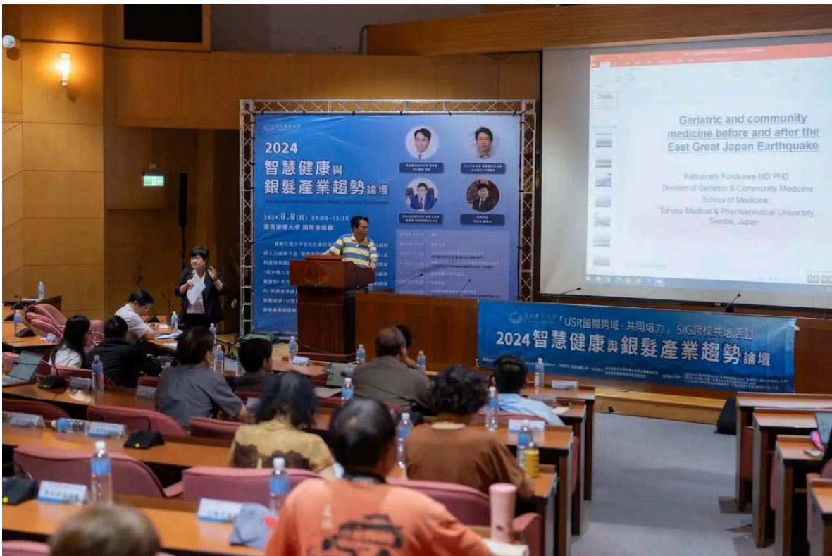
(圖說) 日本東北醫科藥科大學醫學部教授古川勝敏分享「日本大地震後的老年社區醫學」。(記者鄭德政攝) 嘉藥副校長張翊峰表示，此次論壇匯集國際智慧和經驗，共同推動產業創新，期盼提升台灣智慧健