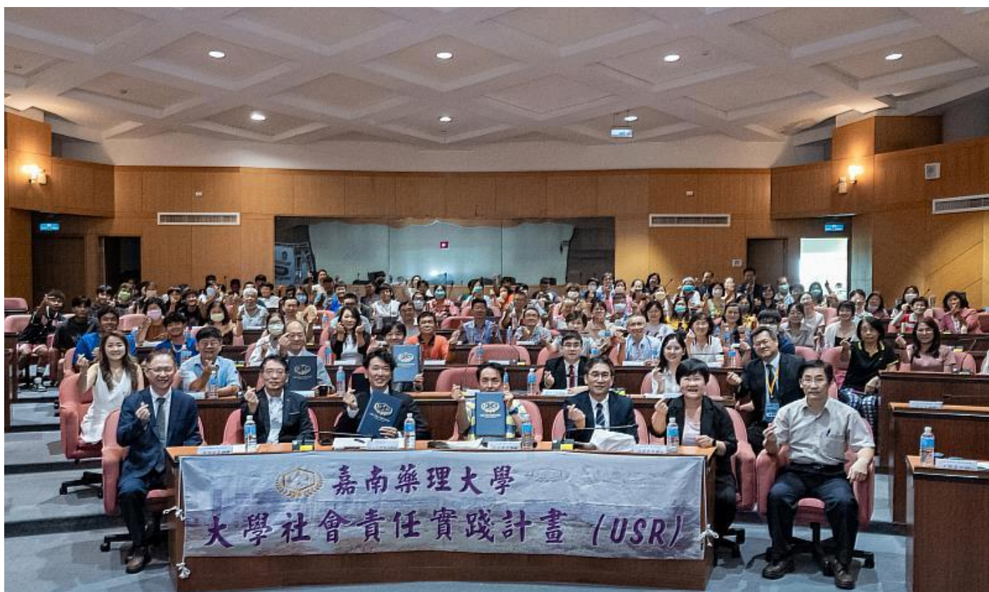
嘉藥舉辦智慧健康與銀髮產業趨勢論壇 促進產業創新與國際合作

(中央社訊息服務20240809 10:22:20)為因應高齡與少子女化社會趨勢所導致的醫療支出攀升與照護人力不足問題，嘉南藥理大學「大學社會責任推動辦公室」結合校內各USR團隊成員及台南應用科技大學、樹人醫護管理專業學校、台南護理專科學校、高雄科技大學等USR夥伴學校，特別於8月8日在校內國際會議中心舉辦「2024智慧健康與銀髮產業趨勢論壇」。邀請來自日本、越南與台灣的學者及業界專家演講，分享資通訊技術應用與跨業整合服務推動成果。期望透過本次論壇，提升產業交流合作契機，將資通訊技術、IOT及AI等技術應用於推動台灣智慧健康與銀髮產業創新發展。此論壇也邀請阿蓮區阿蓮社區發展協會、西港區港東社區發展協會、龍崎教養院、衛生福利部嘉義醫院等USR合作單位共襄盛舉。