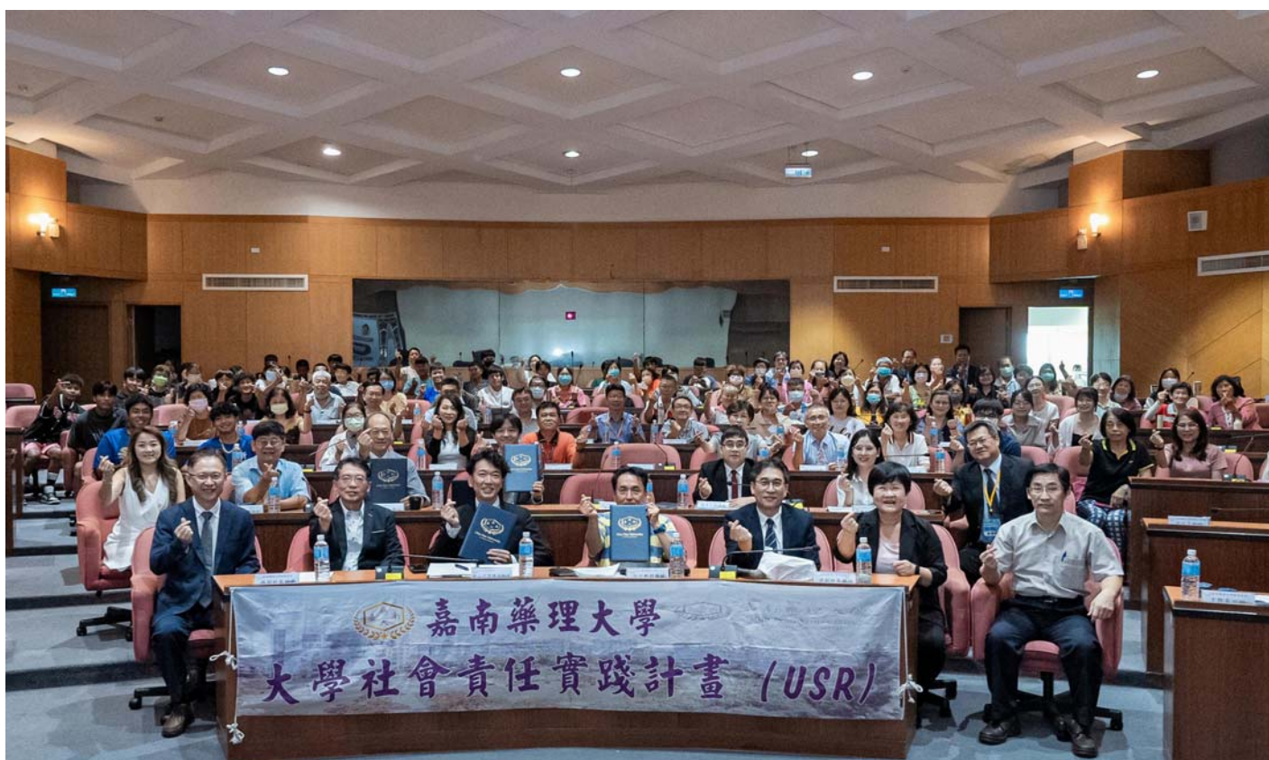
圖：嘉南藥理大學舉辦智慧健康與銀髮產業趨勢論壇，來自各界學者專齊聚一堂。

【記者黃鐘毅 / 台南報導】為因應高齡與少子女化社會所導致醫療支出攀升與照護人力不足問題，嘉南藥理大學8日舉辦「2024智慧健康與銀髮產業趨勢論壇」。邀請日本、越南與台灣的學者及業界專家演講，分享資通訊技術應用與跨業整合服務推動成果。期望透過論壇，提升產業交流合作契機，將資通訊技術、IOT及AI等技術應用於推動台灣智慧健康與銀髮產業創新發展。