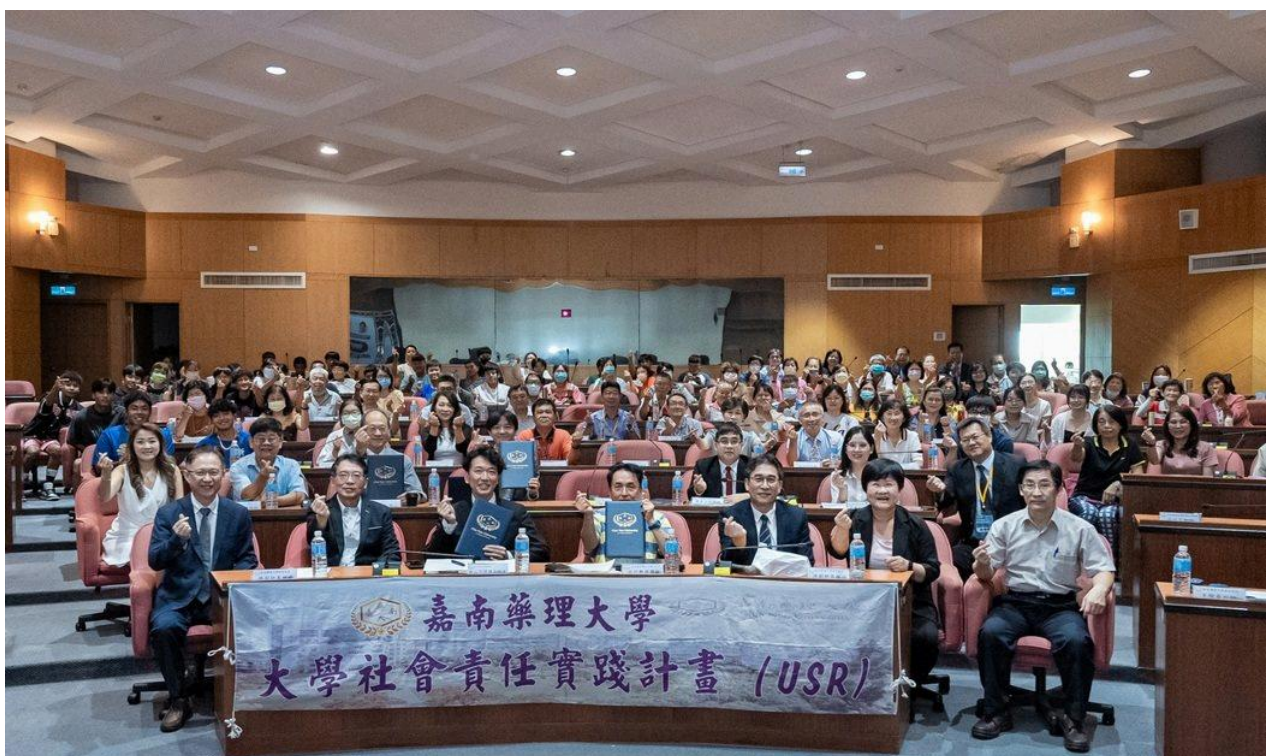
嘉藥舉辦智慧健康與銀髮產業趨勢論壇 促進產業創新與國際合作。