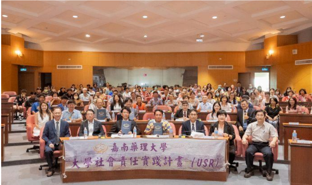
嘉南藥理大學因應高齡，舉辦「二〇二四智慧健康與銀髮產業趨勢論壇」。(記者張淑娟攝)