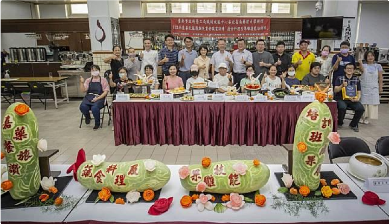
嘉藥餐旅蔬食料理及果雕培訓班結訓，學員展示成果。