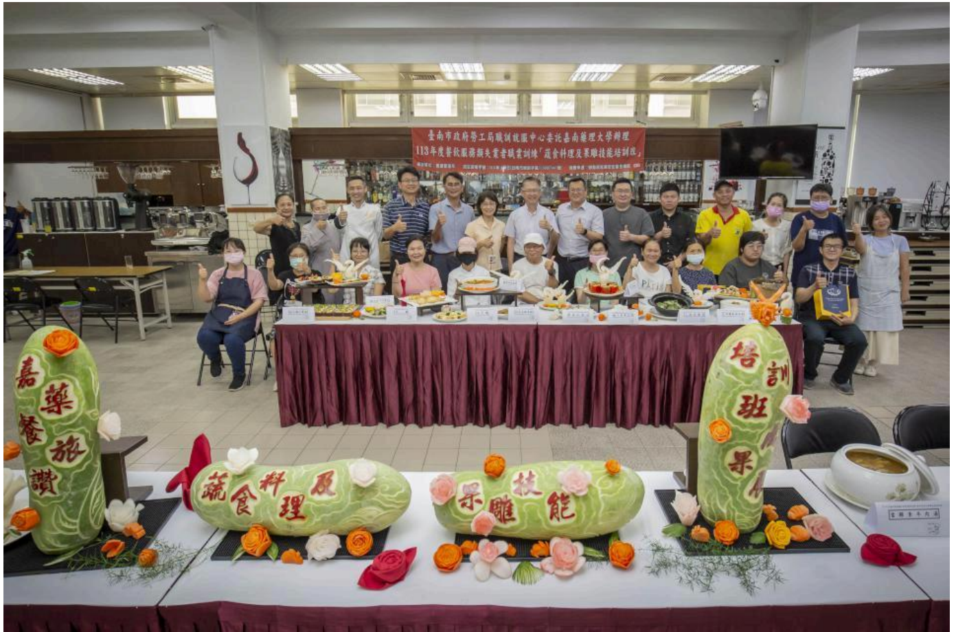
▲嘉藥餐旅蔬食料理及果雕培訓班結訓 助學員開拓新職涯

能、找到新的職涯方向，未來餐旅系也會持續推動職業培訓課程，協助更多人提升專業能力，開創不同的職涯未來。