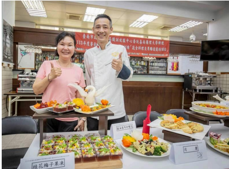
南市勞工局開辦蔬食料理及果雕技訓班，學員展現成果。

勞工局也肯定嘉藥近年來在辦理失業者技訓班的成效，無論是異國料理烹飪、咖啡烘焙實務，或者坐月子照護等，都幫助很多人培養第2專長，協助他們重新進入職場。