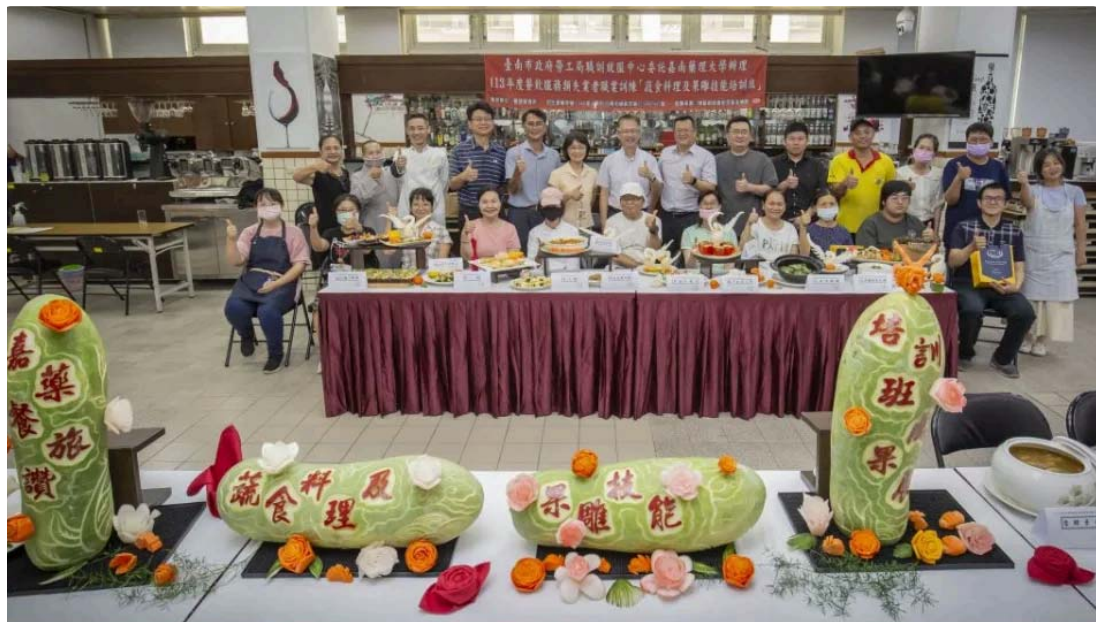
嘉藥餐旅蔬食料理及果雕培訓班結訓，學員展示成果。(記者黃文記攝)