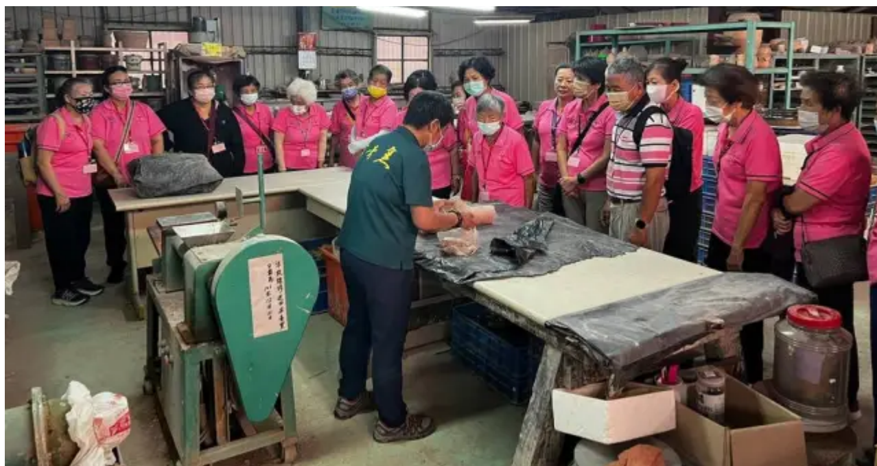
（圖說）陶藝老師講解練土過程。

其中一位參與活動的長輩表示，這是他首次接觸陶土創作，原本以為這是年輕人的活動，沒想到在老師的指導下，他也能一步步摸索並捏塑出屬於自己的陶碗。他特別感謝嘉南藥理大學的師生帶領他們走出戶外，體驗不同的活動。