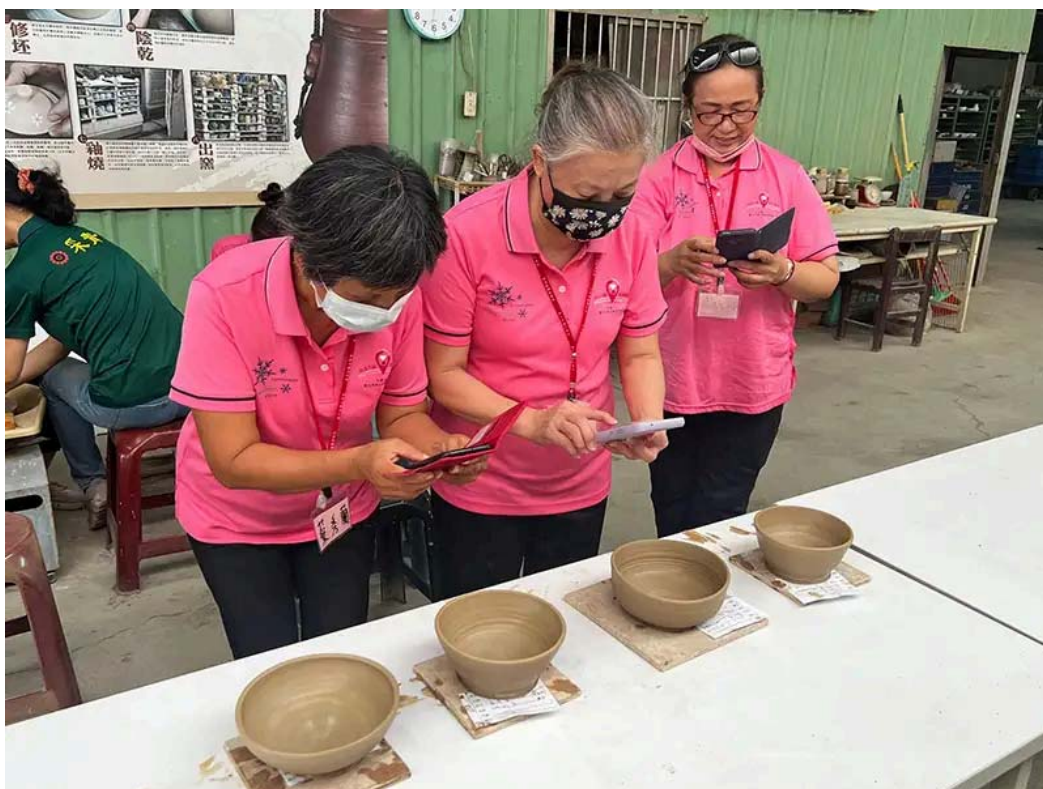
社區長輩開心欣賞自己的作品並拍照留念。

其中一位參與活動的長輩表示，這是他首次接觸陶土創作，原本以為這是年輕人的活動，沒想到在老師的指導下，他也能一步步摸索並捏塑出屬於自己的陶碗。他特別感謝嘉南藥理大學的師生帶領他們走出戶外，體驗不同的活動。