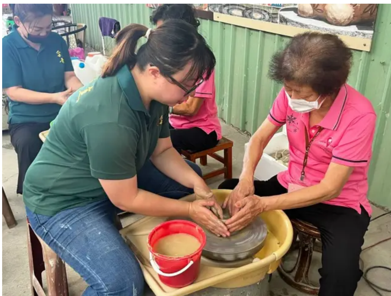
（圖說）老師協助長輩操作手拉坯製作過程。

其中一位參與活動的長輩表示，這是他首次接觸陶土創作，原本以為這是年輕人的活動，沒想到在老師的指導下，他也能一步步摸索並捏塑出屬於自己的陶碗。他特別感謝嘉南藥理大學的師生帶領他們走出戶外，體驗不同的活動。