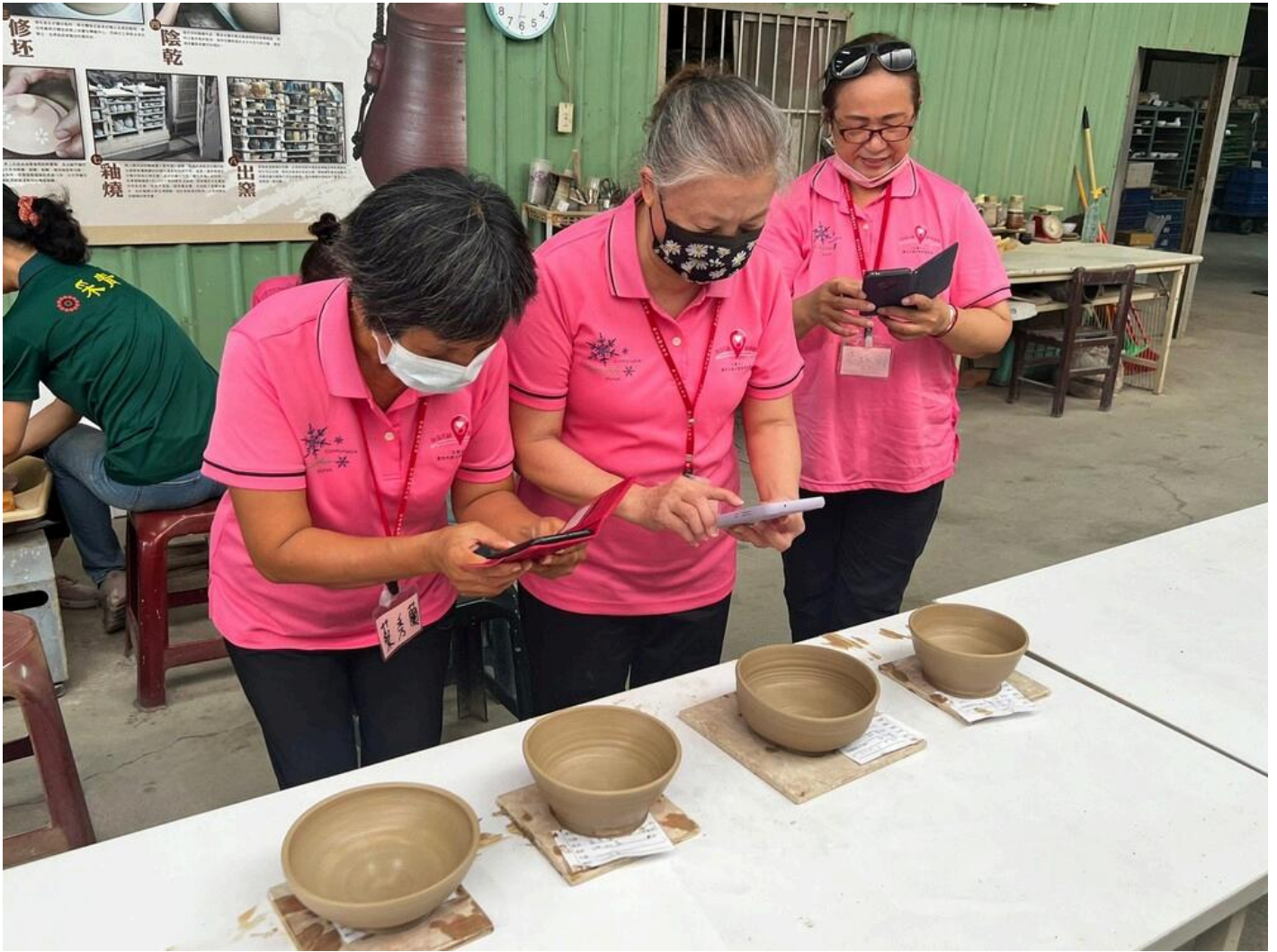
陶土傳遞溫暖 嘉藥師生伴長輩手拉坯