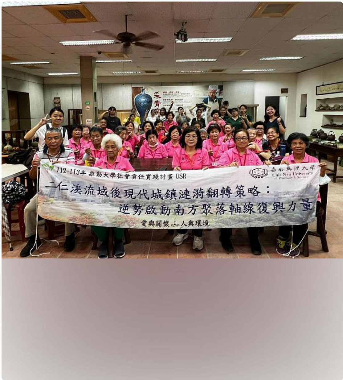
嘉藥USR計畫師生伴長輩體驗手拉坯藝術

手拉坯藝術具獨特的療癒效果，由專業陶藝老師講解陶藝製作的步驟及操作方式，從基本操作到完成品的呈現，讓長輩們享受創作過程。當每位長輩完成屬於自己的作品時，能展現自我肯定與自我實現的成就感，進而帶來心靈上的滿足。這不僅是一場藝術體驗，更是師生與長者之間建立情感交流的橋樑。