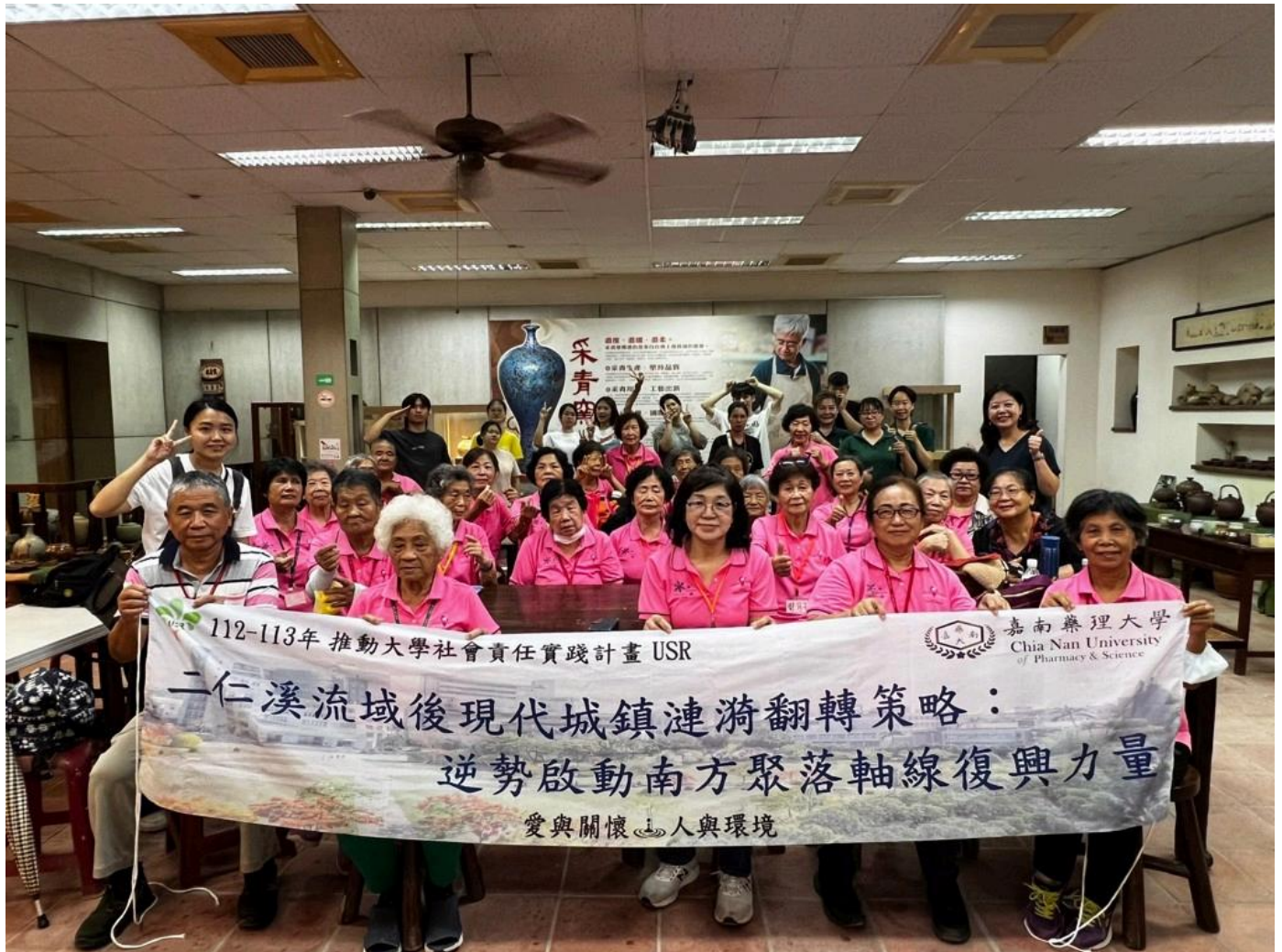
嘉藥USR計畫師生伴長輩體驗手拉坯藝術。

嘉南藥理大學高齡福祉養生管理系的師生近日與台南市車仔寮關懷協會攜手，帶領社區長輩們前往采青窯，展開一場以手拉坯藝術為主題的輔療活動。希望透過陶土創作的過程，促進長者的認知能力，減少憂鬱情緒，延緩失智與失能現象，同時藉由雙手與陶土的接觸，傳遞溫暖與關懷。