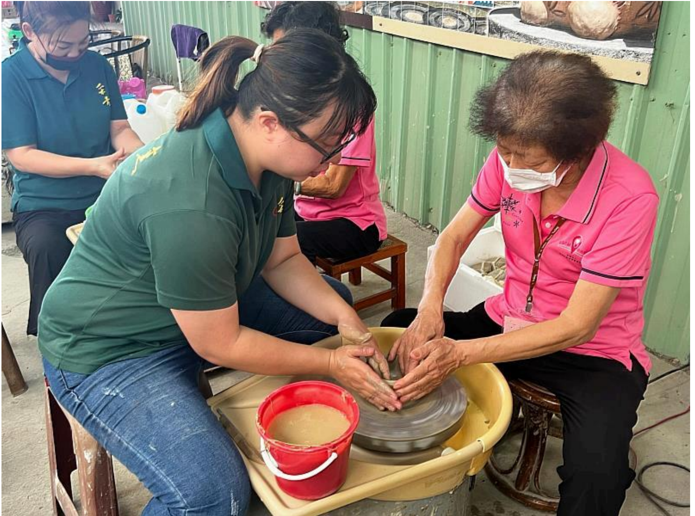
老師協助長輩操作手拉坯製作過程

能展現自我肯定與自我實現的成就感，進而帶來心靈上的滿足。這不僅是一場藝術體驗，更是師生與長者之間建立情感交流的橋樑。