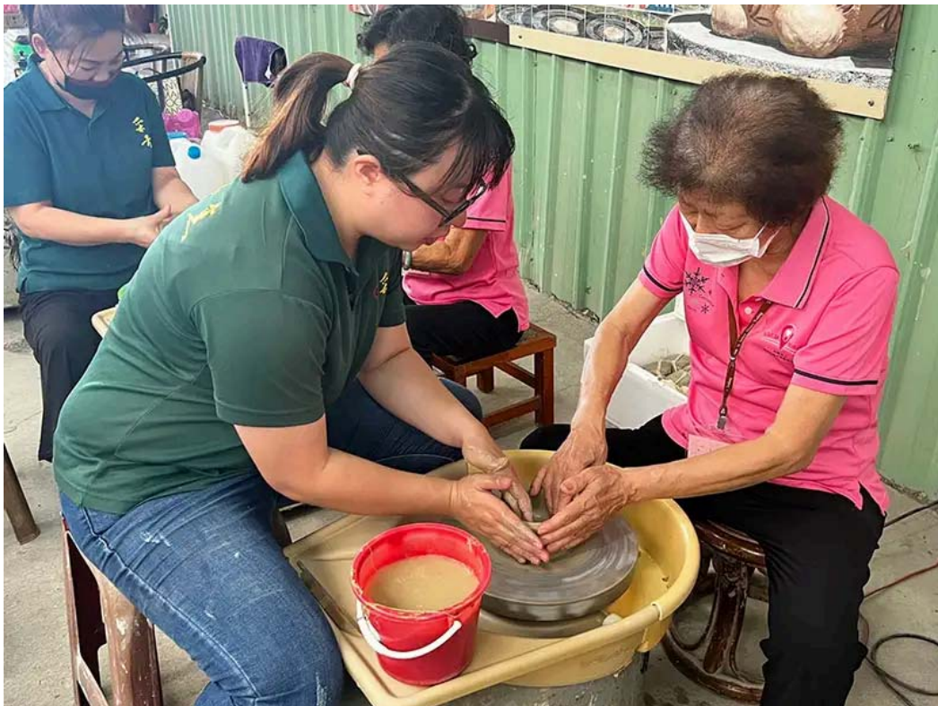
老師協助長輩操作手拉坯製作過程。

嘉南藥理大學高齡福祉養生管理系的師生近日與台南市車仔寮關懷協會攜手，帶領社區長輩們前往采青窯，展開一場以手拉坯藝術為主題的輔療活動。希望透過陶土創作的過程，促進長者的認知能力，減少憂鬱情緒，延緩失智與失能現象，同時藉由雙手與陶土的接觸，傳遞溫暖與關懷。