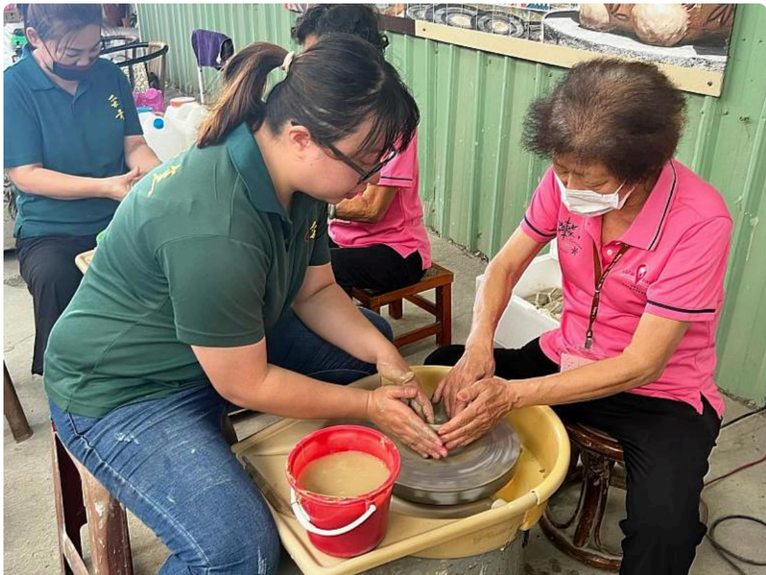
老師協助長輩操作手拉坯製作過程

其中一位參與活動的長輩表示，這是他首次接觸陶土創作，原本以為這是年輕人的活動，沒想到在老師的指導下，他也能一步步摸索並捏塑出屬於自己的陶碗。他特別感謝嘉南藥理大學的師生帶領他們走出戶外，體驗不同的活動。