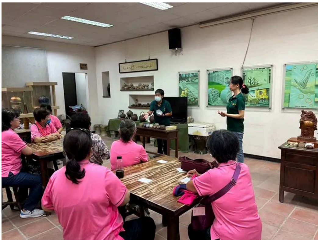
采青窯陶藝老師介紹燒製後成品的樣子。

其中一位參與活動的長輩表示，這是他首次接觸陶土創作，原本以為這是年輕人的活動，沒想到在老師的指導下，他也能一步步摸索並捏塑出屬於自己的陶碗。他特別感謝嘉南藥理大學的師生帶領他們走出戶外，體驗不同的活動。