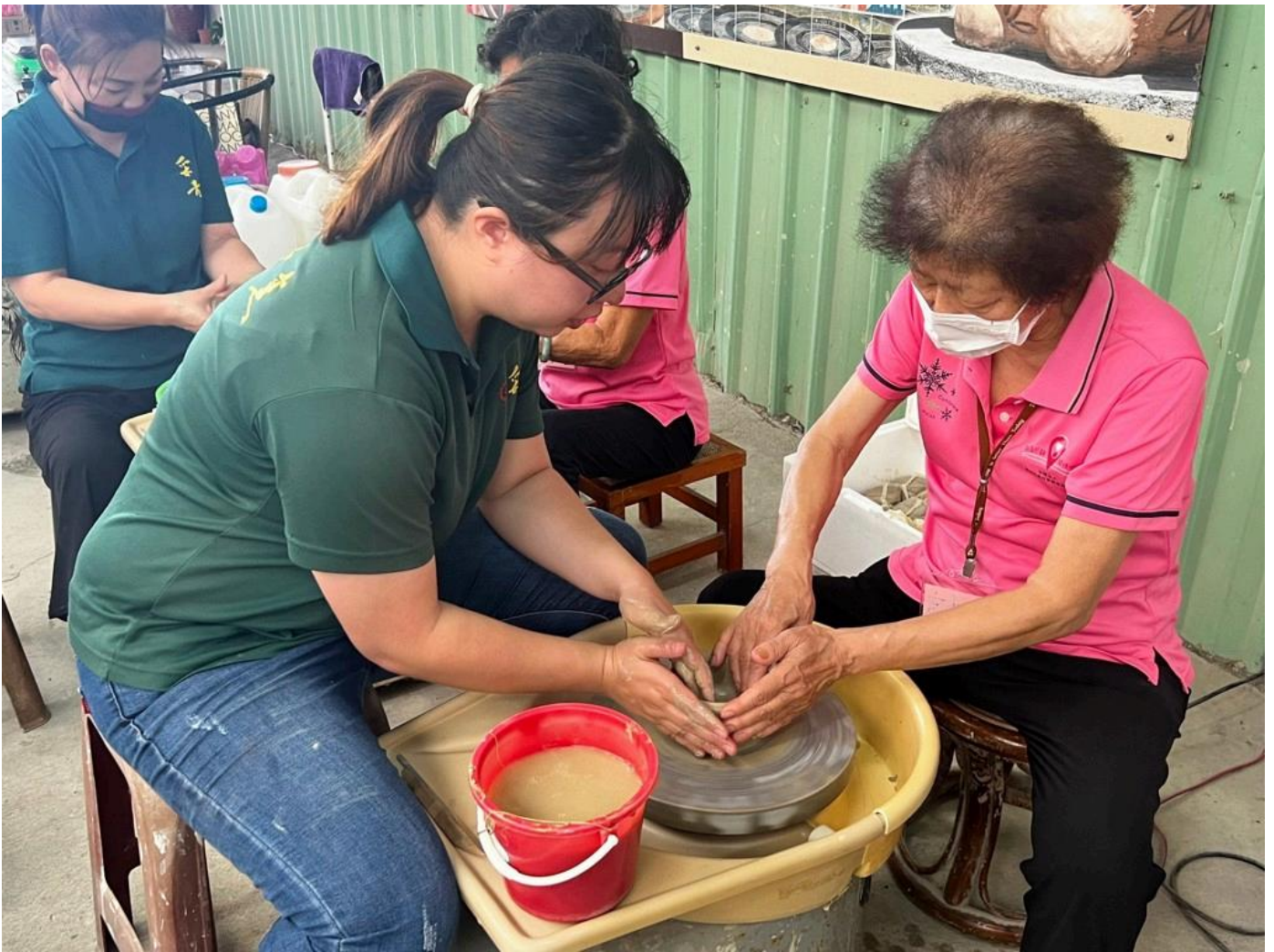
老師協助長輩操作手拉坯製作過程。

USR計畫主持人許桂樹教授指出，能藉由「二仁溪流域後現代城鎮漣漪翻轉策略：逆勢啟動南方聚落軸線復興力量」USR計畫，帶領偏鄉長輩參加多元活動，未來嘉藥也將持續舉辦更促進認知的活動，讓長輩們感受到學校師生的關懷、陪伴與支持。