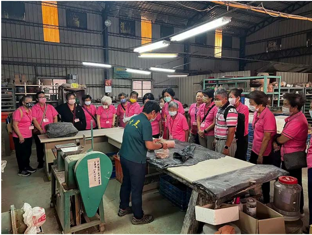
陶藝老師講解練土過程。

USR計畫主持人許桂樹教授指出，能藉由「二仁溪流域後現代城鎮漣漪翻轉策略：逆勢啟動南方聚落軸線復興力量」USR計畫，帶領偏鄉長輩參加多元活動，未來嘉藥也將持續舉辦更促進認知的活動，讓長輩們感受到學校師生的關懷、陪伴與支持，進一步促進社區與學校的連結，善盡大學社會責任。