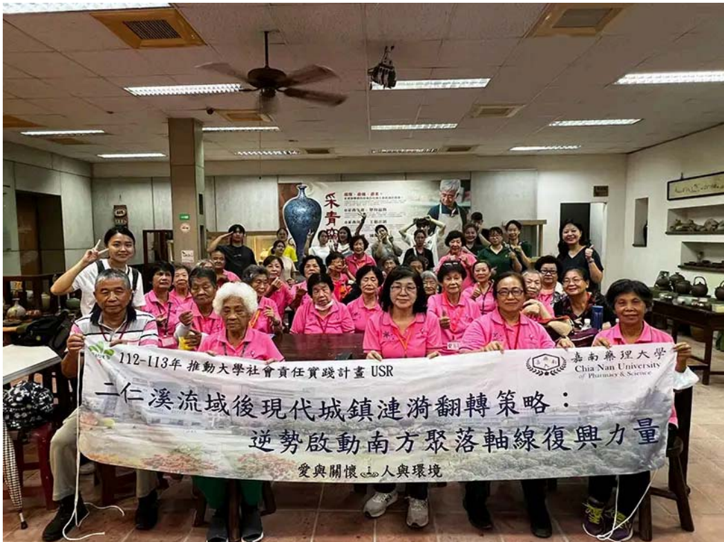
嘉藥USR計畫師生伴長輩體驗手拉坯藝術。

USR計畫主持人許桂樹教授指出，能藉由「二仁溪流域後現代城鎮漣漪翻轉策略：逆勢啟動南方聚落軸線復興力量」USR計畫，帶領偏鄉長輩參加多元活動，未來嘉藥也將持續舉辦更促進認知的活動，讓長輩們感受到學校師生的關懷、陪伴與支持，進一步促進社區與學校的連結，善盡大學社會責任。