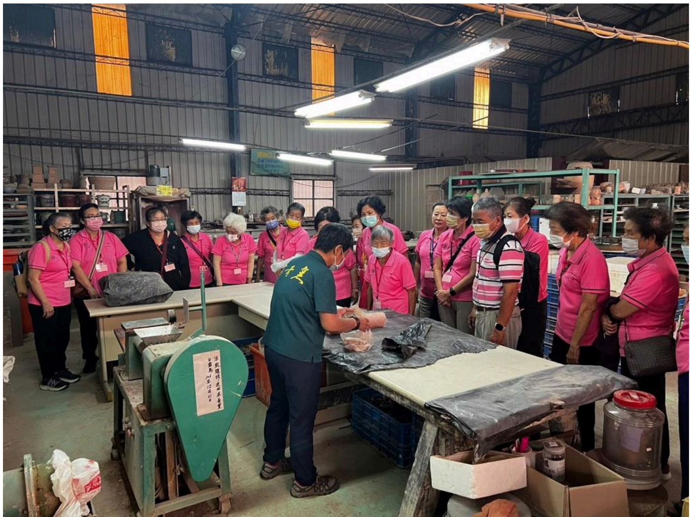
陶藝老師講解練土過程。

其中一位參與活動的長輩表示，這是他首次接觸陶土創作，原本以為這是年輕人的活動，沒想到在老師的指導下，他也能一步步摸索並捏塑出屬於自己的陶碗。他特別感謝嘉南藥理大學的師生帶領他們走出戶外，體驗不同的活動。