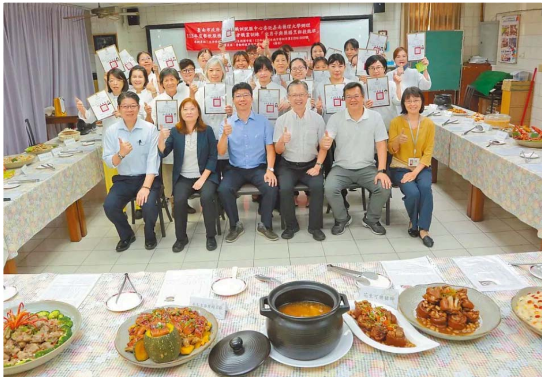
嘉藥坐月子與藥膳烹飪技能班結業，成果豐碩。

隨著時代轉變，能幫助新手媽媽坐月子的「到宅坐月子」、「坐月子餐宅配」服務，成為現代女性的熱門選擇，嘉南藥理大學生活保健科技系受台南市政府勞工局委託辦理「坐月子與藥膳烹飪技能班」職業訓練，14日舉辦結訓典禮。