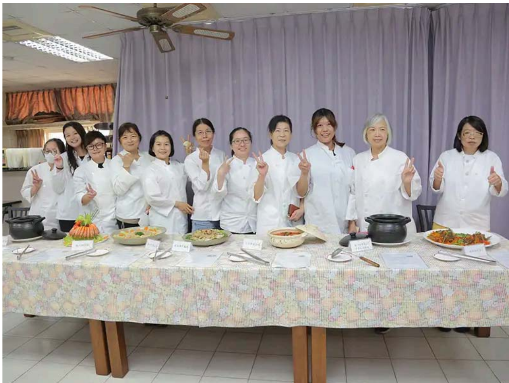
參與學員各個秀出所學端出屬於自己的特色料理。

隨著時代轉變，能幫助新手媽媽坐月子的「到宅坐月子」、「坐月子餐宅配」服務，成為現代女性的熱門選擇。嘉南藥理大學生活保健科技系配合系特色發展，接受台南市政府勞工局委託辦理「坐月子與藥膳烹飪技能班」職業訓練。為期2個月緊鑼密鼓的培訓，於10月14日舉辦結訓典禮，20位學員成功完成360小時的精實訓練，並獲頒結業證書。該課程不僅為學員提供學科及術科全方位的專業訓練，更讓每位學員帶著一技之長及自信滿載而歸。