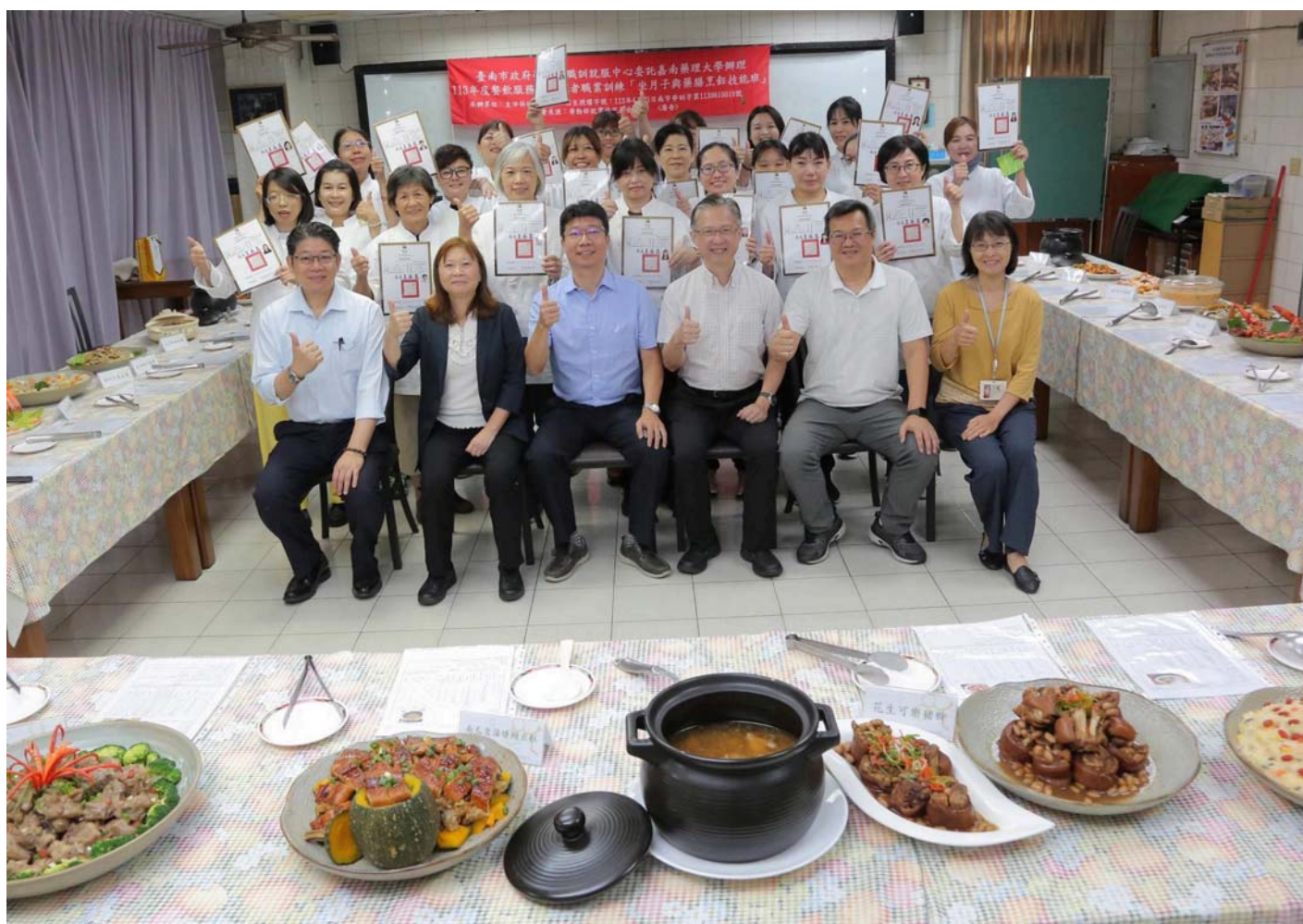
圖：嘉南藥理大學舉辦「坐月子與藥膳烹飪技能班」職業訓練，20位學員經過360小時培訓取得結業證書。

【記者黃鐘毅 / 台南報導】台南市政府勞工局委託嘉南藥理大學辦理「坐月子與藥膳烹飪技能班」職業訓練，20位學員經過2個月360小時的精實訓練，14日舉辦結訓典禮，並獲頒結業證書。該課程不僅為學員提供學科及術科全方位的專業訓練，更讓每位學員帶著一技之長及自信滿載而歸。