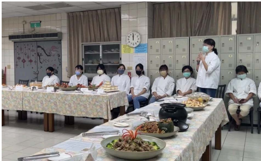
嘉藥辦理「坐月子與藥膳烹飪技能班」職訓，廿名學員獲結業證書。