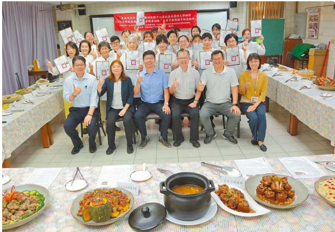
嘉藥坐月子與藥膳烹飪技能班結業，成果豐碩。

隨著時代轉變，能幫助新手媽媽坐月子的「到宅坐月子」、「坐月子餐宅配」服務，成為現代女性的熱門選擇，嘉南藥理大學生活保健科技系受台南市政府勞工局委託辦理「坐月子與藥膳烹飪技能班」職業訓練，14日舉辦結訓典禮。