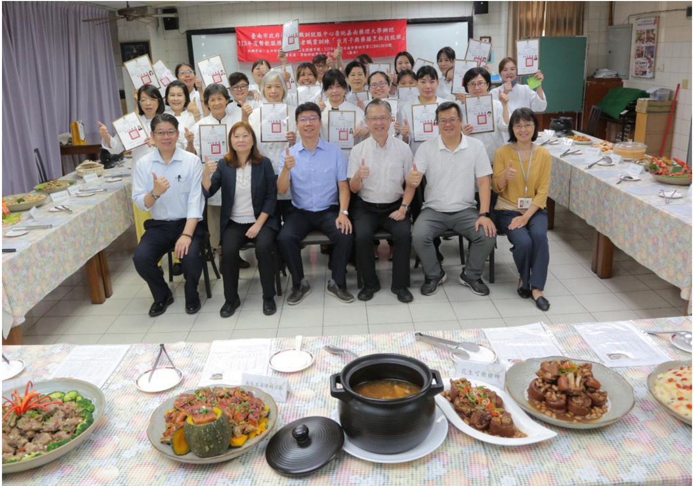
嘉藥舉辦坐月子與藥膳達人訓練班結業成果豐碩。

隨著時代轉變，能幫助新手媽媽坐月子的「到宅坐月子」、「坐月子餐宅配」服務，成為現代女性的熱門選擇。嘉南藥理大學生活保健科技系配合系特色發展，接受台南市政府勞工局委託辦理「坐月子與藥膳烹飪技能班」職業訓練，為期2個月緊鑼密鼓的培訓，於10月14日舉辦結訓典禮，20位學員成功完成360小時的精實訓練，並獲頒結業證書。該課程不僅為學員提供學科及術科全方位的專業訓練，更讓每位學員帶著一技之長及自信滿載而歸。