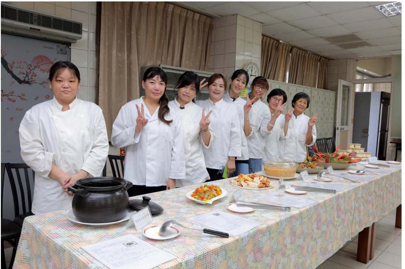
圖：參與學員各個秀出所學端出屬於自己的特色料理。