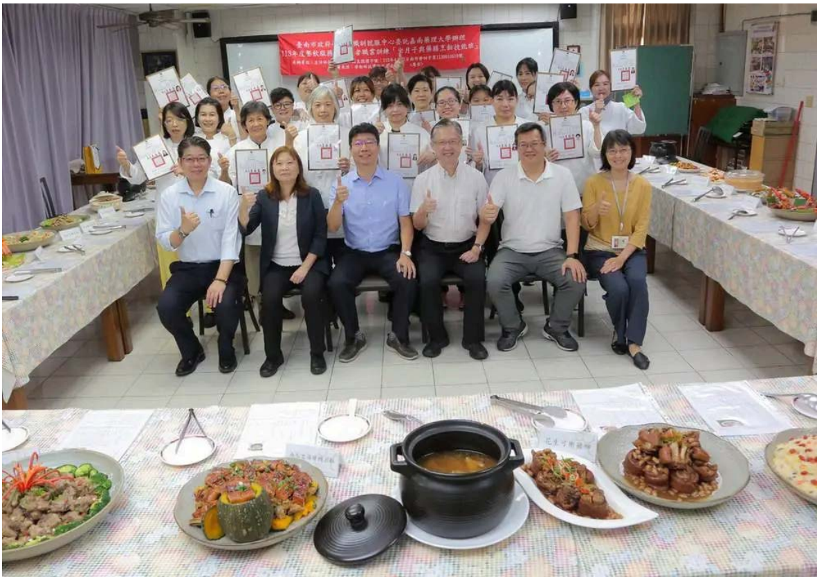
(圖說) 嘉藥舉辦坐月子與藥膳達人訓練班結業，成果豐碩，師生大合照。 嘉南藥理大學生活保健科技系多年來透過失業者職訓班，成功輔導近300多人轉職就業，其中「坐月子技能」與「藥膳技能」更是廣受歡迎。課程涵蓋東方坐月子概念、養生藥膳烹飪以及母嬰照護等專業技能，也融入食安與營養保健的元素，深受學員與社會大眾的好評。今年更加入健康素食藥膳及坐月子餐製作，符合現在多元飲食需求，也可以照顧茹素的產婦，達到坐月子以素食月子餐及藥膳調養產後的身體，讓「坐好月子、健康一輩子」能真正實現，深獲學員好評。