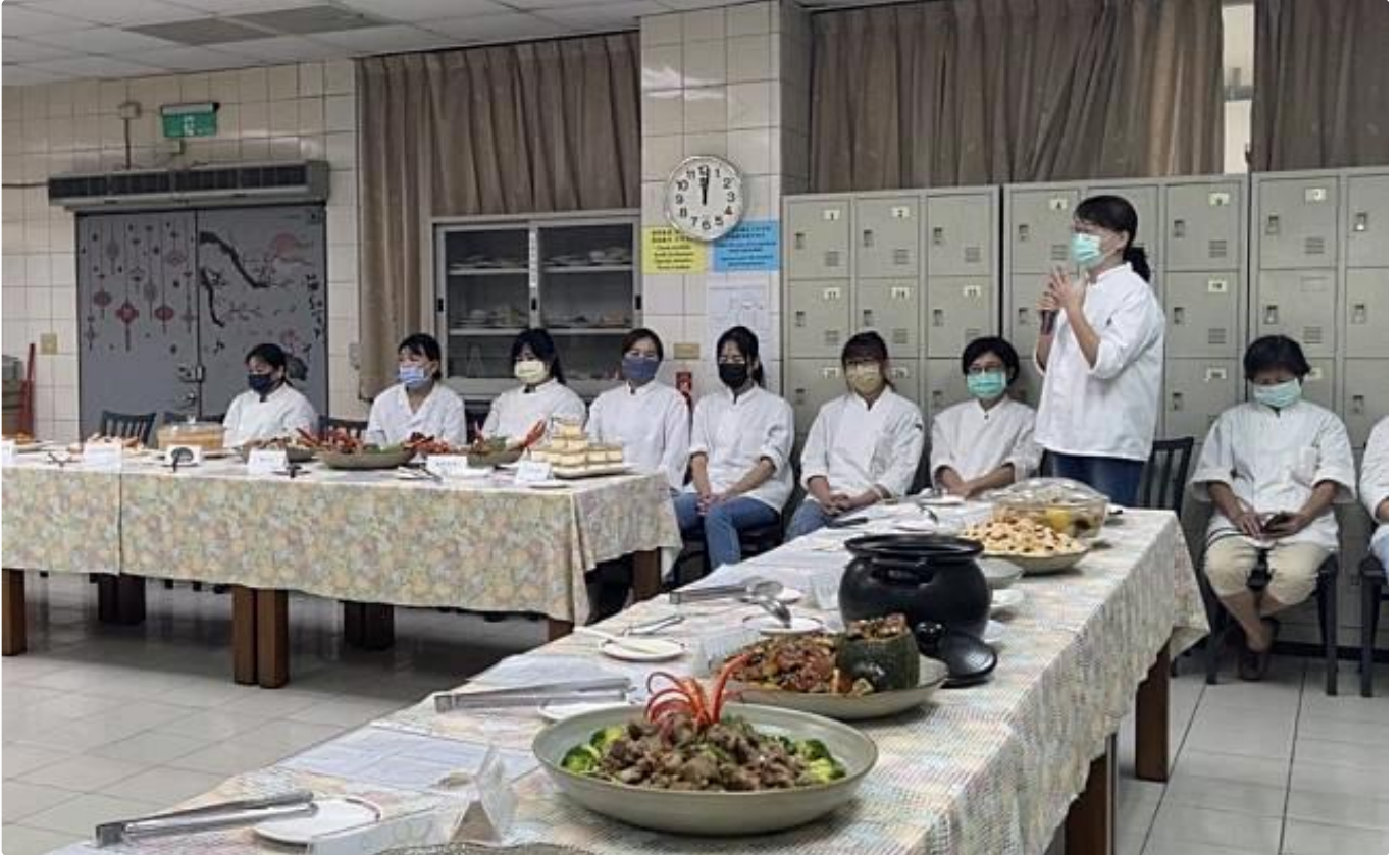
嘉藥辦理「坐月子與藥膳烹飪技能班」職訓，廿名學員獲結業證書。