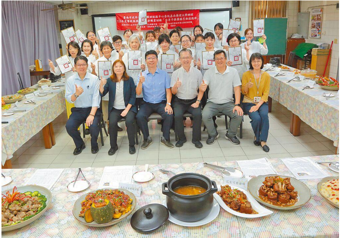
嘉藥坐月子與藥膳烹飪技能班結業，成果豐碩。

隨著時代轉變，能幫助新手媽媽坐月子的「到宅坐月子」、「坐月子餐宅配」服務，成為現代女性的熱門選擇，嘉南藥理大學生活保健科技系受台南市政府勞工局委託辦理「坐月子與藥膳烹飪技能班」職業訓練，14日舉辦結訓典禮。