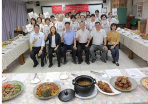
嘉藥舉辦坐月子與藥膳達人訓練班結業成果豐碩。

【記者孫宜秋 / 南市報導】隨著時代轉變，能幫助新手媽媽坐月子的「到宅坐月子」、「坐月子餐宅配」服務，成為現代女性的熱門選擇。嘉南藥理大學生活保健科技系配合系特色發展，接受台南市政府勞工局委託辦理「坐月子與藥膳烹飪技能班」職業訓練。為期2個月緊鑼密鼓的培訓，於10月14日舉辦結訓典禮，20位學員成功完成360小時的精實訓練，並獲頒結業證書。該課程不僅為學員提供學科及術科全方位的專業訓練，更讓每位學員帶著一技之長及自信滿載而歸。