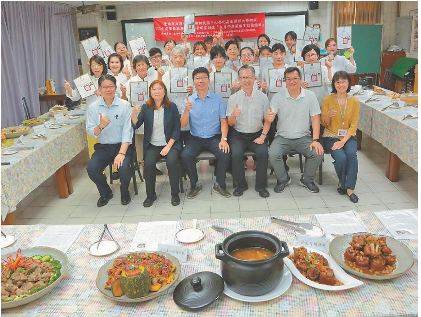
● 嘉藥坐月子與藥膳烹飪技能班結業，成果豐碩。圖 / 周榮發

隨著時代轉變，能幫助新手媽媽坐月子的「到宅坐月子」、「坐月子餐宅配」服務，成為現代女性的熱門選擇，嘉南藥理大學生活保健系與台南市政府勞工局委託辦理「坐月子與藥膳烹飪技能班」職業訓練，14日舉辦結訓典禮。