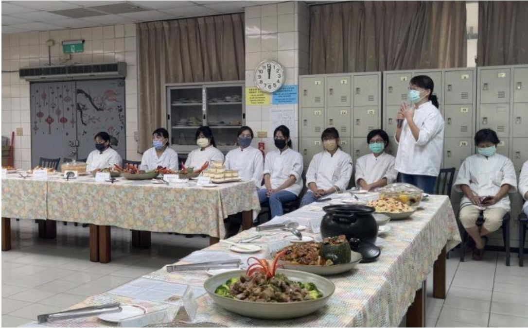
嘉藥辦理「坐月子與藥膳烹飪技能班」職訓，廿名學員獲結業證書。(記者張淑娟攝)