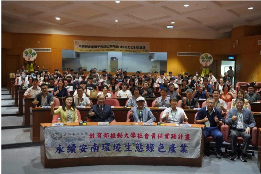
嘉南藥理大學舉辦的「大學攜手企業實踐社會責任論壇」，吸引一百多名各界代表參與，藉此實踐社會與環境的永續發展。