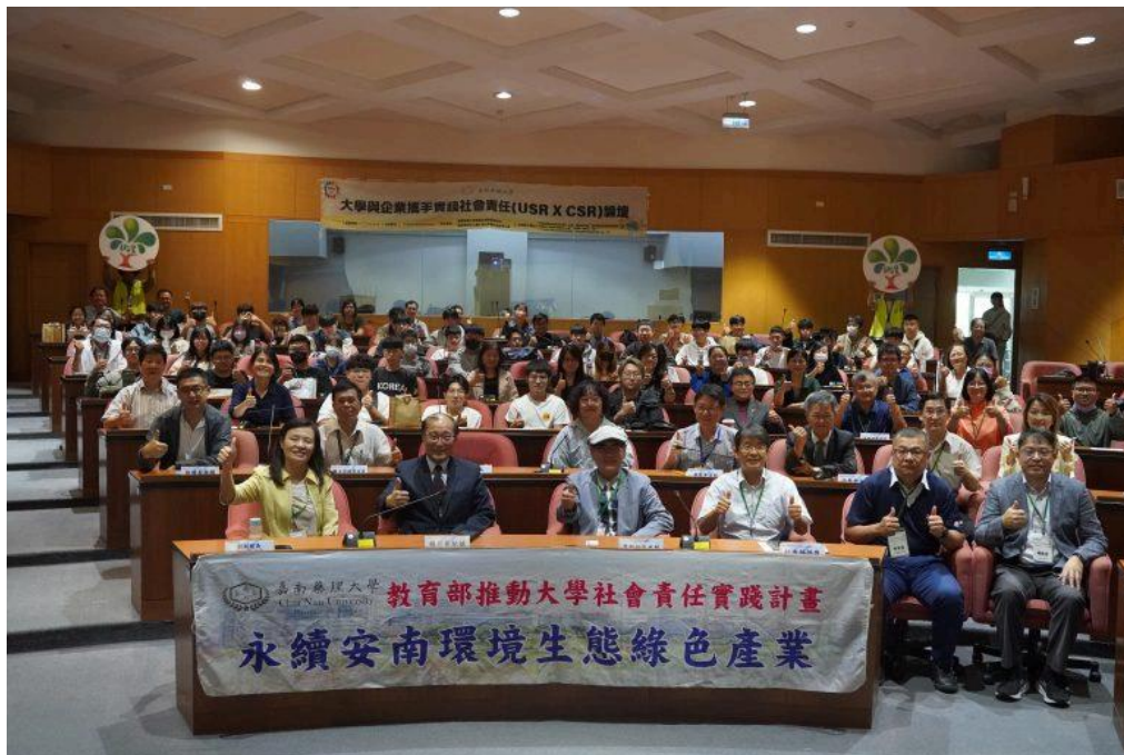
嘉南藥理大學舉辦的「大學攜手企業實踐社會責任論壇」，吸引一百多名各界代表參與，藉此實踐社會與環境的永續發展。