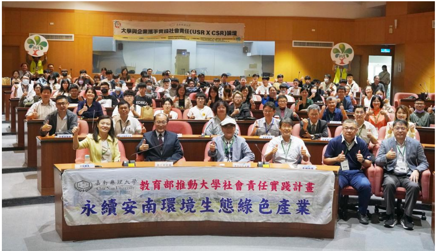
嘉藥攜手產業舉辦企業實踐社會責任論壇共創永續新動力。

嘉南藥理大學於11月1日舉辦2024年「大學攜手企業實踐社會責任 (USRxCSR) 論壇」，聚焦於推動大學社會責任 (USR) 與企業社會責任 (CSR) 的結合，實踐社會與環境的永續發展。此次論壇在教育部指導下進行，吸引了超過120位來自學界、產業界及社會各界的代表踴躍參與。