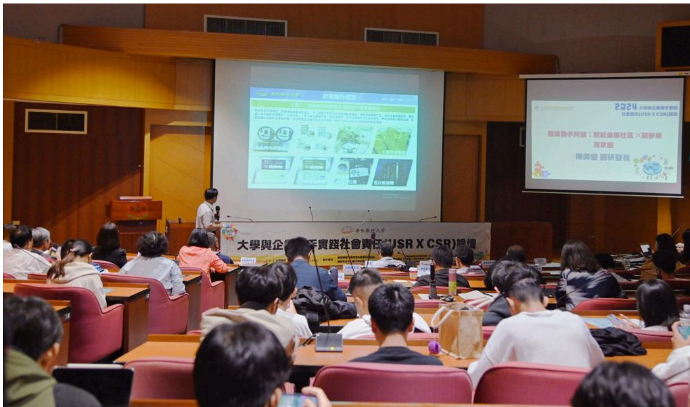
嘉南藥理大學舉辦USR x CSR論壇超過百位學界、產業界及社會各界的代表參與。

論壇匯集了多所致力於USR的合作大學，包括台南應用科技大學、高雄科技大學和樹德科技大學，並邀請了台南企業文化藝術基金會、光洋應用材料公司、綠膜科技公司及台灣糖業公司等企業代表，分享他們在循環經濟、環保及社會影響力上的具體成果。