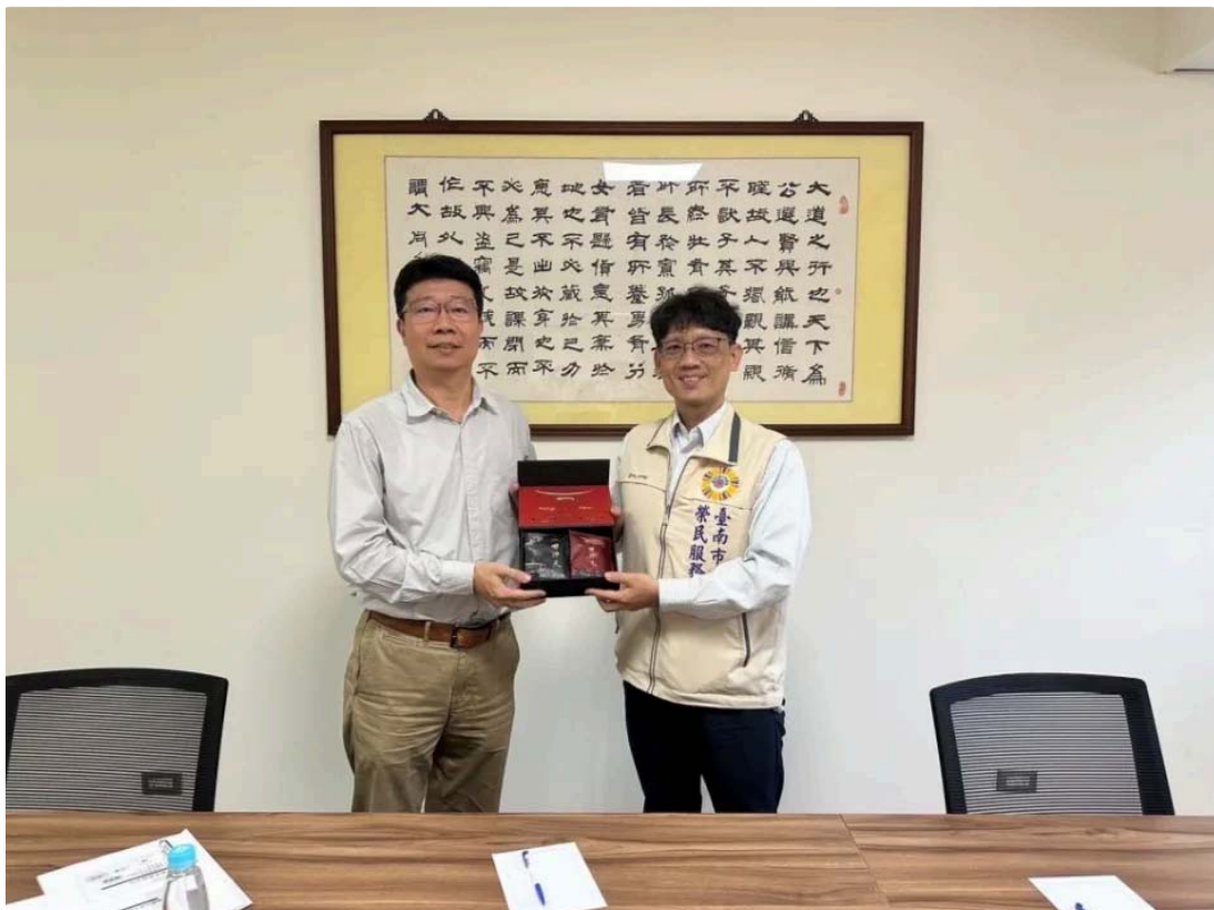
台南市榮服處攜手嘉南藥理大學，提供退除役官兵進修管道。