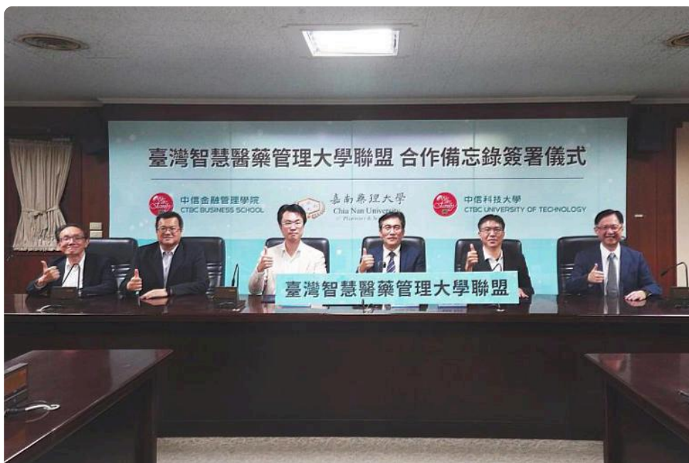
「臺灣智慧醫藥管理大學聯盟」未來將由三校合作開設醫療產業管理、醫療數據分析、長照資源整合及人工智慧四大關鍵領域課程。圖為簽約儀式與會人員合影。