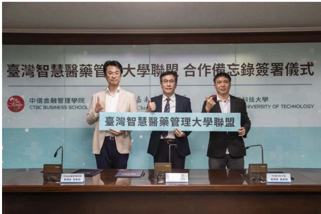
嘉南藥理大學攜手中信科技大學、中信金融管理學院成立「台灣智慧醫藥管理大學聯盟」。(記者張淑娟攝)