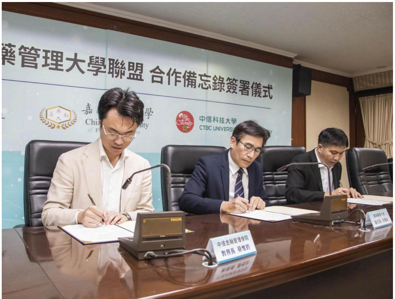
#嘉南藥理大學 #中信金融管理學院 #中信科技大學