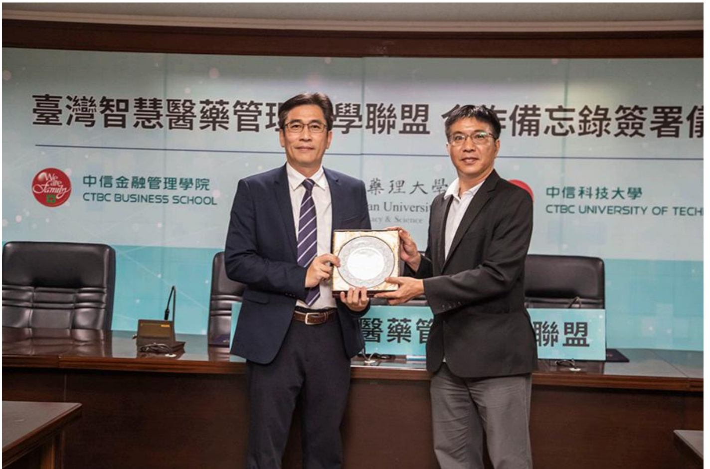
嘉藥攜中信雙校成立臺灣智慧醫藥管理大學聯盟