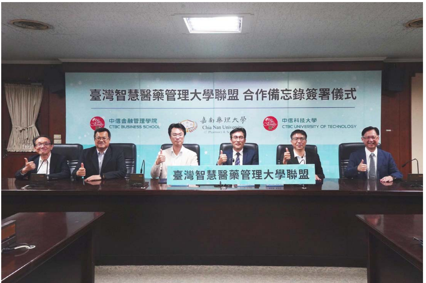
「臺灣智慧醫藥管理大學聯盟」未來將由三校合作開設醫療產業管理、醫療數據分析、長照資源整合及人工智慧四大關鍵領域課程。圖為簽約儀式與會人員合影。