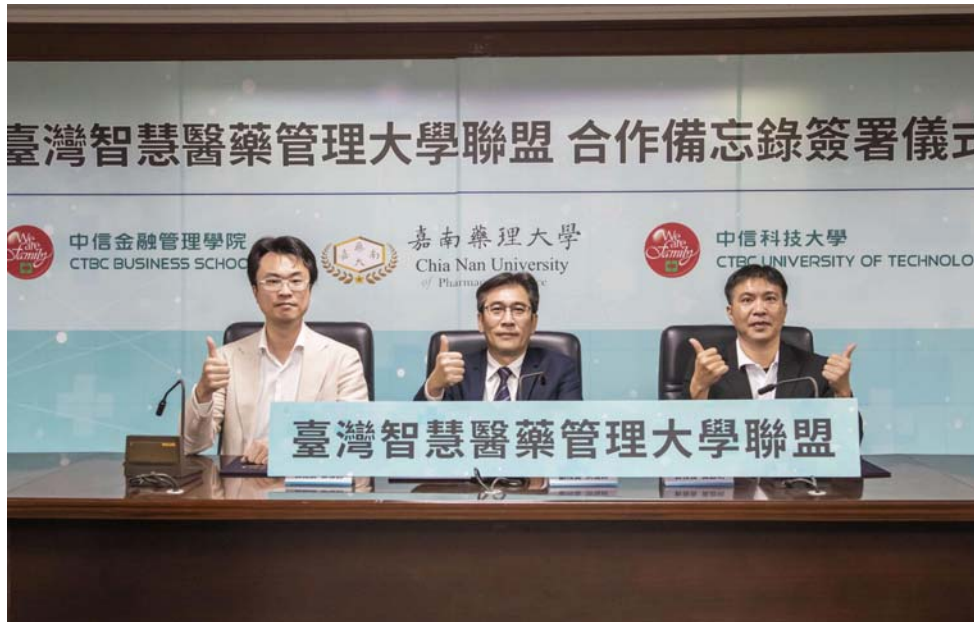
嘉藥大學、中信金融學院及中信科大攜手成立臺灣智慧醫藥管理大學聯盟