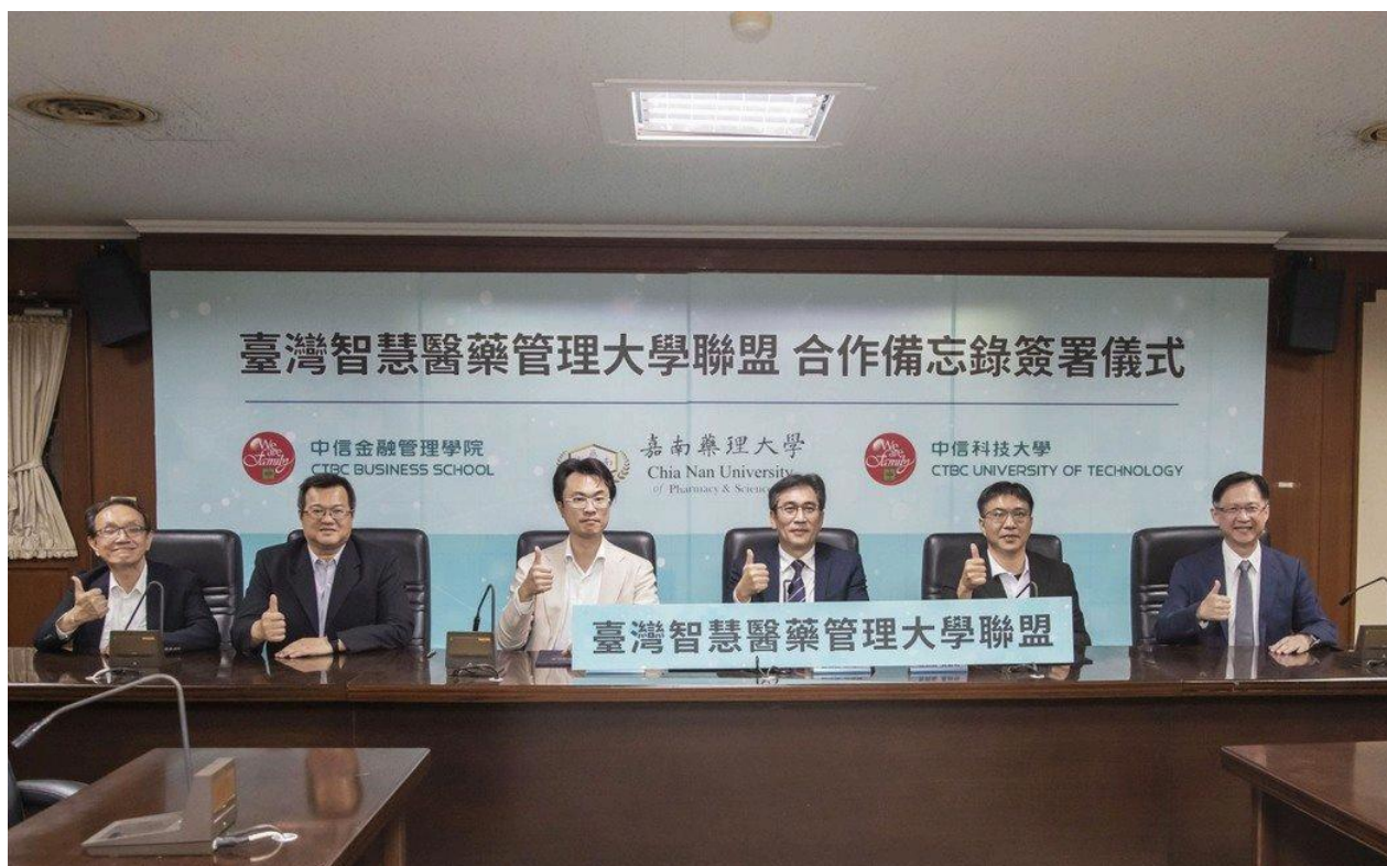
嘉藥大學、中信金融學院及中信科大成立臺灣智慧醫藥管理大學聯盟簽屬合作備忘錄與會貴賓合影。

三校未來將匯集各自的學術與研究資源，為學生創造多元且豐富的學習環境，以提升在智慧健康照護與醫療管理方面的學習深度與廣度。透過跨校合作，將攜手培養具備智慧健康照護專業知識及全方位技能的醫療服務產業管理人才，推動智慧醫療的未來發展。