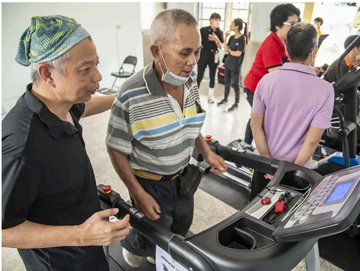
取得體適能指導員證照畢業校友於社區擔任駐點健促教師服務長輩。

嘉藥自106年度起投入USR計畫，至今已邁入第9個年頭。多年來，學校持續運用大學端專業知識與技術資源，深化地方社區營造與環境永續推動模式，本次通過的深耕型計畫包括「嘉藥攜手阿蓮：傳承共榮×永續城鄉」，聚焦健康促進與食品安全，及「永續安南：生態社區×環境教育×綠色產業的深耕發展」，專注於環境永續與生態教育。萌芽型計畫中，以「二仁溪流域後現代城鎮漣漪翻轉策略：擴散河海聚落振興力量」促進產業鏈結與經濟永續，「活酪大內健康藥營 - 推動大內智慧農業與醫療」結合在地農業產品與醫藥技術，提升地方經濟效益，及「西港風•敘事雲：智慧科技永續西港生活文化」，以智慧科技推動西港文化的永續發展。