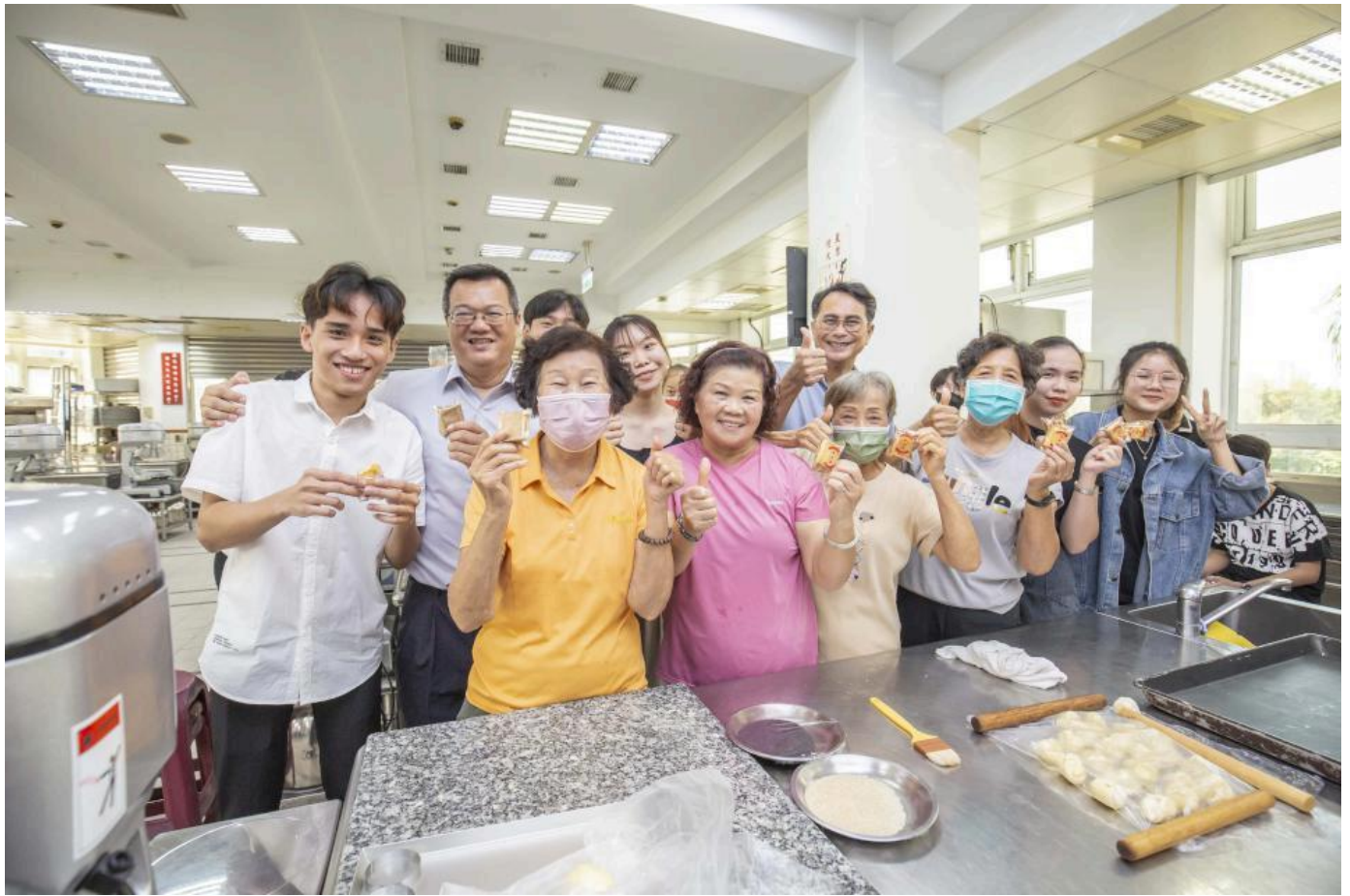
▲帶領銀髮族結合越南生促進世代交流