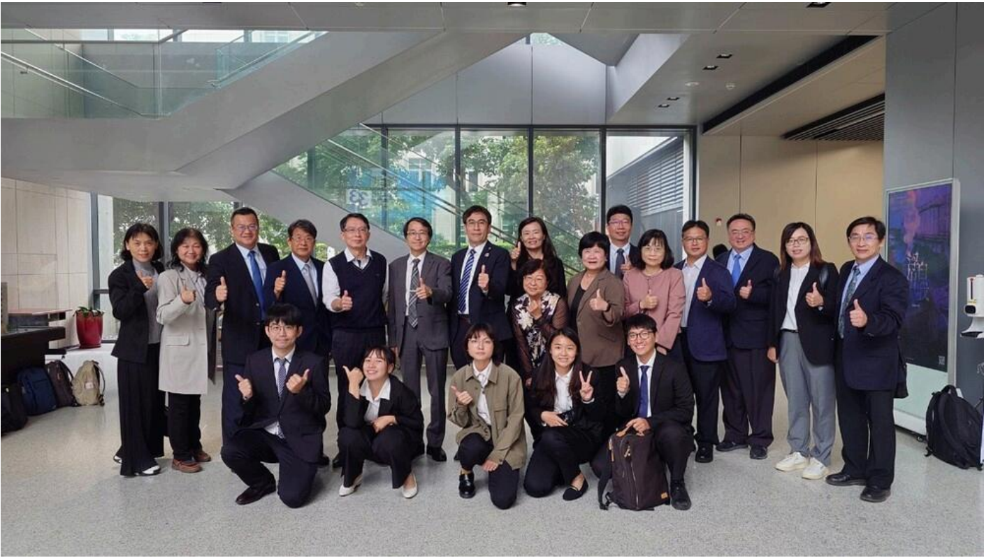
嘉藥USR計畫再創佳績 五案全數通過