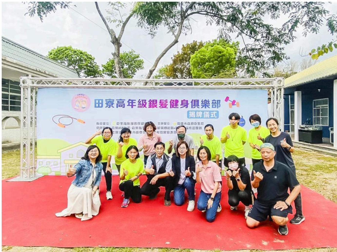
▲嘉藥USR團隊協助田寮成立銀髮健身俱樂部