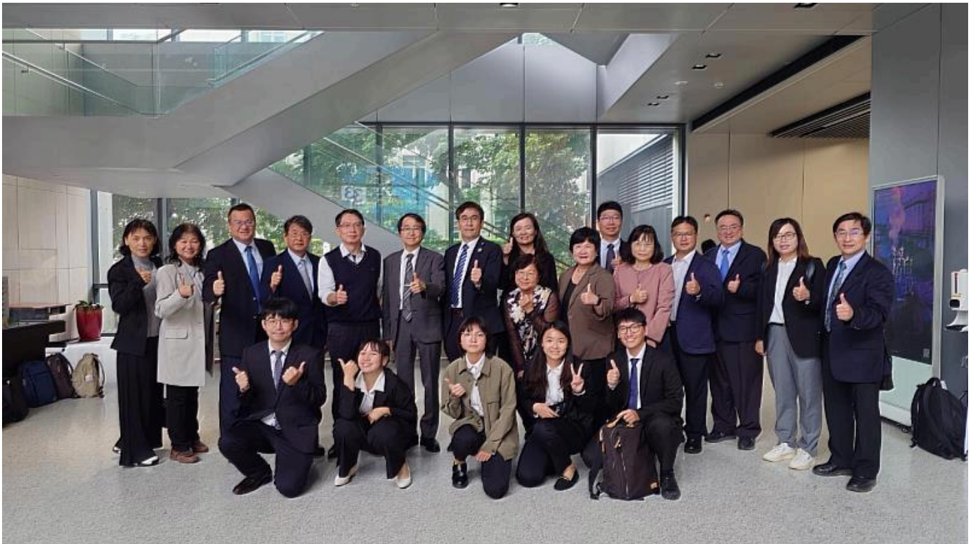
嘉藥USR計畫再創佳績 五案全數通過

(中央社訊息服務20250106 13:57:17)教育部日前公布大學社會責任實踐(USR)計畫申請案結果，嘉南藥理大學再度展現卓越實力，五件申請案全數通過，彰顯多年來深耕地方的堅持與成果。這是嘉藥繼獲得「2024遠見雜誌USR大學社會責任獎-福祉共生組楷模獎」及「2023USR社會參與跨校共學南區聯展-最佳人氣獎」後，再度獲得教育部與各界的高度肯定。