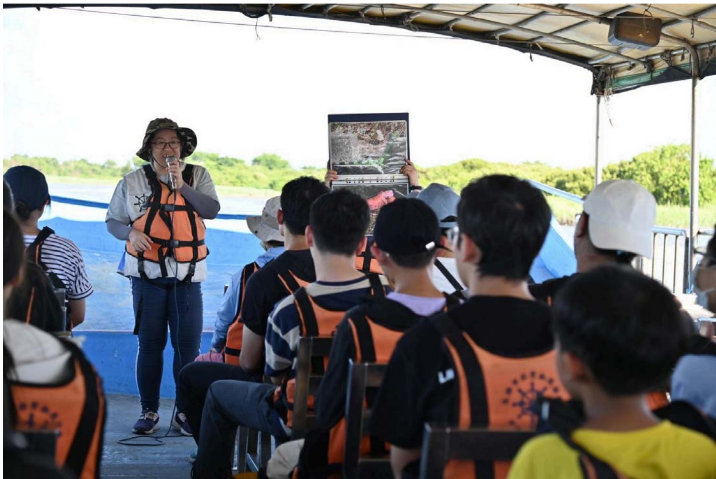
圖：嘉藥USR計畫二仁溪環境生態教育踏查。

嘉藥自106年度起投入USR計畫，至今已邁入第9個年頭。多年來，學校持續運用大學端專業知識與技術資源，深化地方社區營造與環境永續推動模式，這次通過的深耕型計畫包括「嘉藥攜手阿蓮：傳承共榮×永續城鄉」，聚焦健康促進與食品安全，及「永續安南：生態社區×環境教育×綠色產業的深耕發展」，專注於環境永續與生態教育。