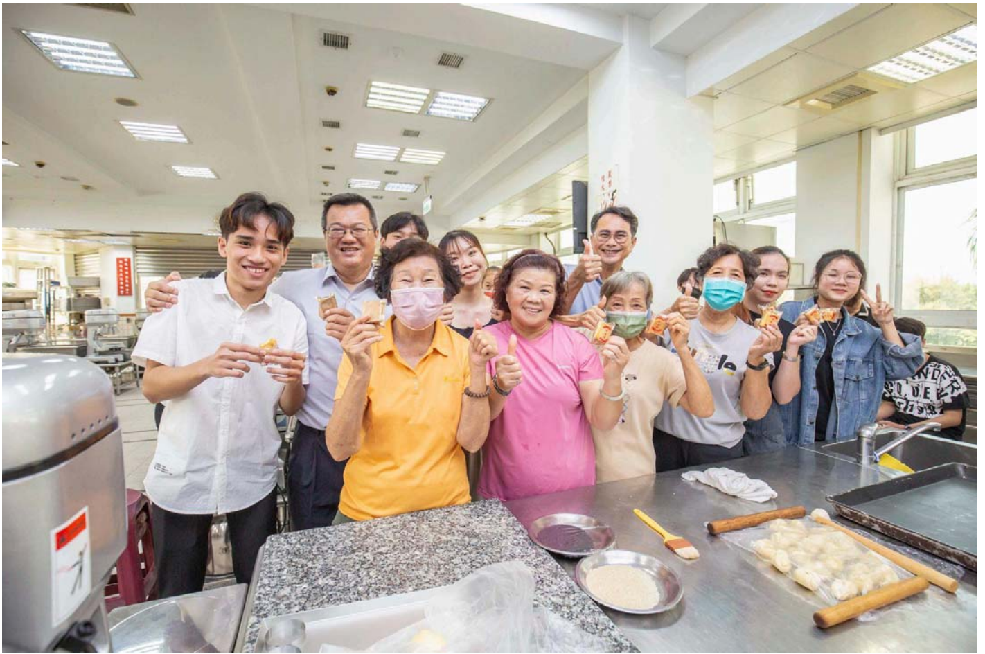
圖：嘉藥USR計畫帶領銀髮族結合越南生促進世代交流。

萌芽型計畫中，以「二仁溪流域後現代城鎮漣漪翻轉策略：擴散河海聚落振興力量」促進產業鏈結與經濟永續，「活酪大內健康藥營 - 推動大內智慧農業與醫療」結合在地農業產品與醫藥技術，提升地方經濟效益，及「西港風•敘事雲：智慧科技永續西港生活文化」，以智慧科技推動西港文化的永續發展。