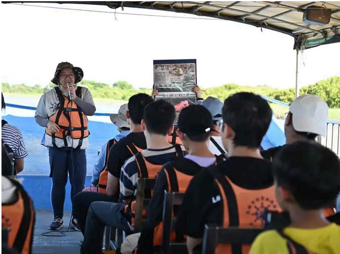
二仁溪環境生態教育踏查。

教育部日前公布大學社會責任實踐（USR）計畫申請案結果，嘉南藥理大學再度展現卓越實力，五件申請案全數通過，彰顯多年來深耕地方的堅持與成果。這是嘉藥繼獲得「2024遠見雜誌USR大學社會責任獎 - 福祉共生組楷模獎」及「2023USR社會參與跨校共學南區聯展 - 最佳人氣獎」後，再度獲得教育部與各界的高度肯定。