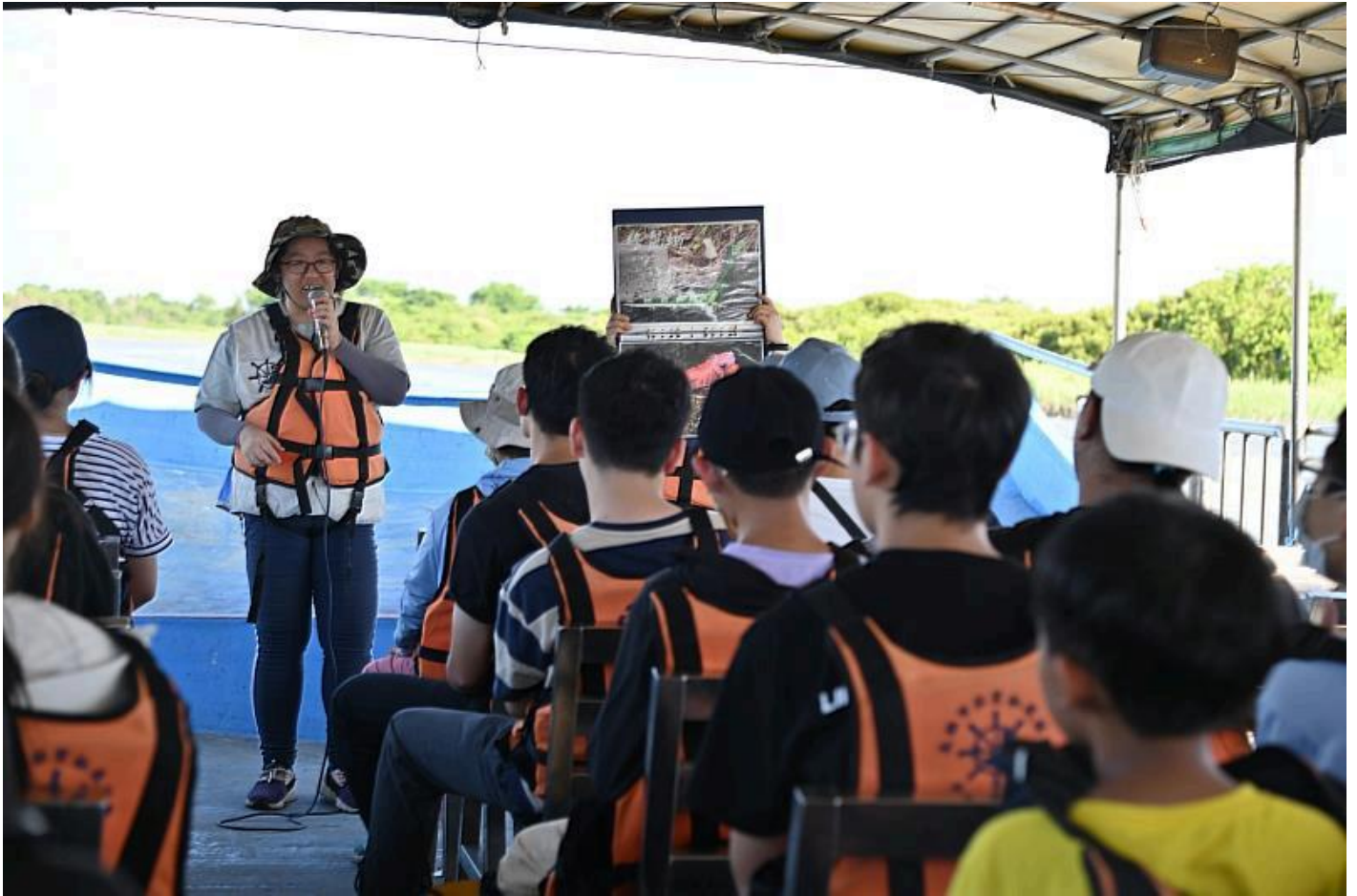
二仁溪環境生態教育踏查

嘉藥自106年度起投入USR計畫，至今已邁入第9年。多年來學校持續運用大學端專業知識與技術資源，深化地方社區營造與環境永續推動模式，本次通過的深耕型計畫包括「嘉藥攜手阿蓮：傳承共榮×永續城鄉」，聚焦健康促進與食品安全；「永續安南：生態社區×環境教育×綠色產業的深耕發展」，專注於環境永續與生態教育。萌芽型計畫中，以「二仁溪流域後現代城鎮漣漪翻轉策略：擴散河海聚落振興力量」促進產業鏈結與經濟永續；「活酪大內健康藥營 - 推動大內智慧農業與醫療」結合在地農業產品與醫藥技術，提升地方經濟效益；「西港風•敘事雲：智慧科技永續西港生活文化」，以智慧科技推動西港文化的永續發展。