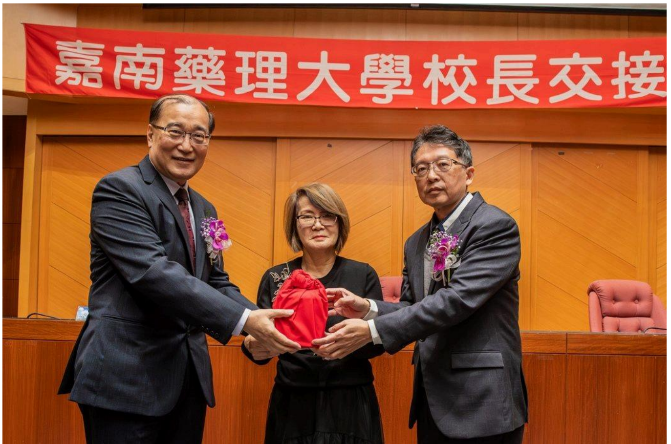
張翊峰特聘教授(右)自卸任校長錢紀銘教授手中接過校長職務。

最後，張校長強調：「嘉藥師生就是一個團隊，我們有責任共同成長，在少子化與科技變革的衝擊下，攜手迎接挑戰。」未來，嘉藥將專注於發展「健康永續與創新服務」的辦學理念，打造更符合新世代需求的學習環境，邁向全方位的卓越發展。