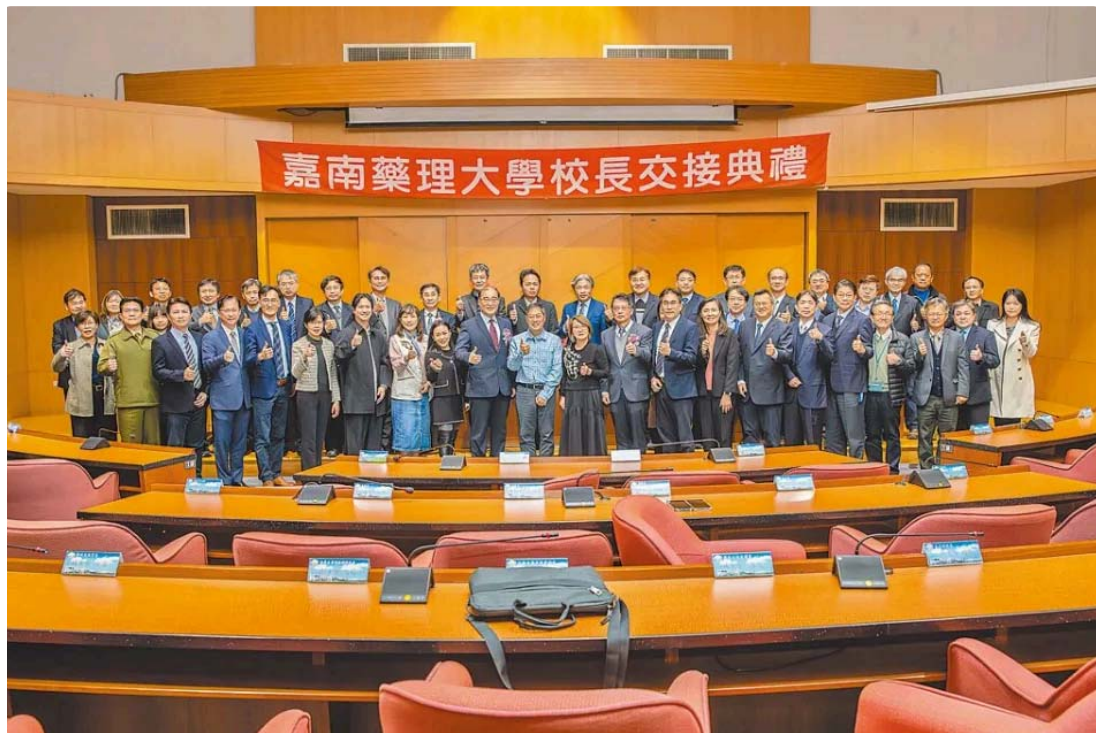
嘉藥舉行校長交接典禮。

嘉南藥理大學日前舉行代理與卸任校長交接典禮，在新任董事長薛淑惠女士的監交下，由新任校長張翊峰特聘教授自卸任校長錢紀銘教授手中接過代理校長職務，正式接下校務重任。