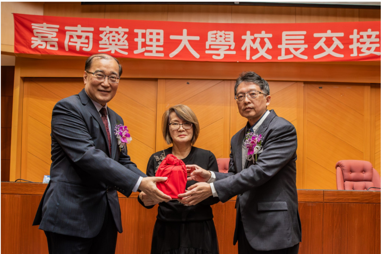
【勁報記者于郁金 / 臺南報導】嘉南藥理大學於日前在該校國際會議中心舉行代理與卸任校長