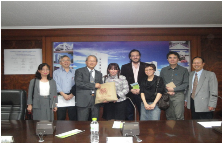
院長及各系主任與希臘學者合影