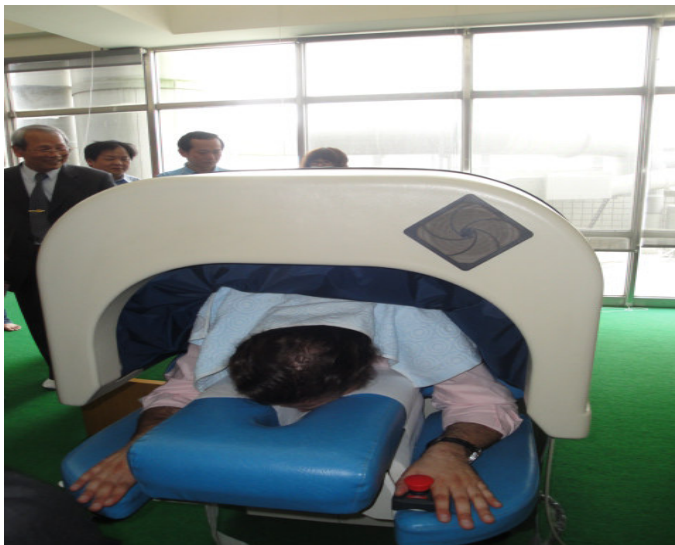
貴賓體驗乾式 SPA 太空艙