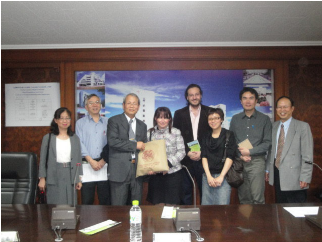
▲院長與希臘學者合照。