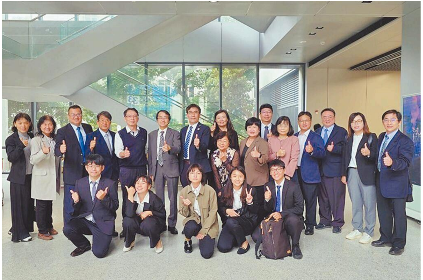
嘉南藥理大學之「教育部推動大學社會責任 (USR) 實踐計畫」申請案，5案全數通過。圖 / 嘉藥提供

嘉南藥理大學推動產學合作績效卓越，去(113)年在產學合作方面展現卓越實踐力與高度產業連結能力，並以具體績效回應教育部高教深耕計畫所強調的社會責任與創新發展目標，積極深化樂活創新與跨域人才的基礎培育。