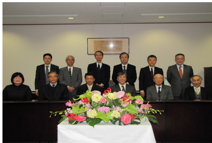
▲嘉南藥理科技大學與日本東北藥科大學於 2011 年 12 月 21 日重新簽署合作交流備忘錄。