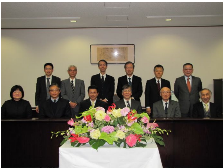
嘉南藥理科技大學校慶貴賓大合照。(記者邱仁武／攝)

嘉南藥理科技大學與日本東北藥科大學於 2011 年 12 月 21 日重新簽署合作交流備忘錄。(記者邱仁武／攝)