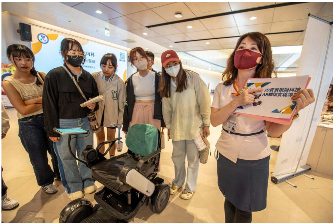
—— ▲ 醫院導入3D實景模擬與AR設備。