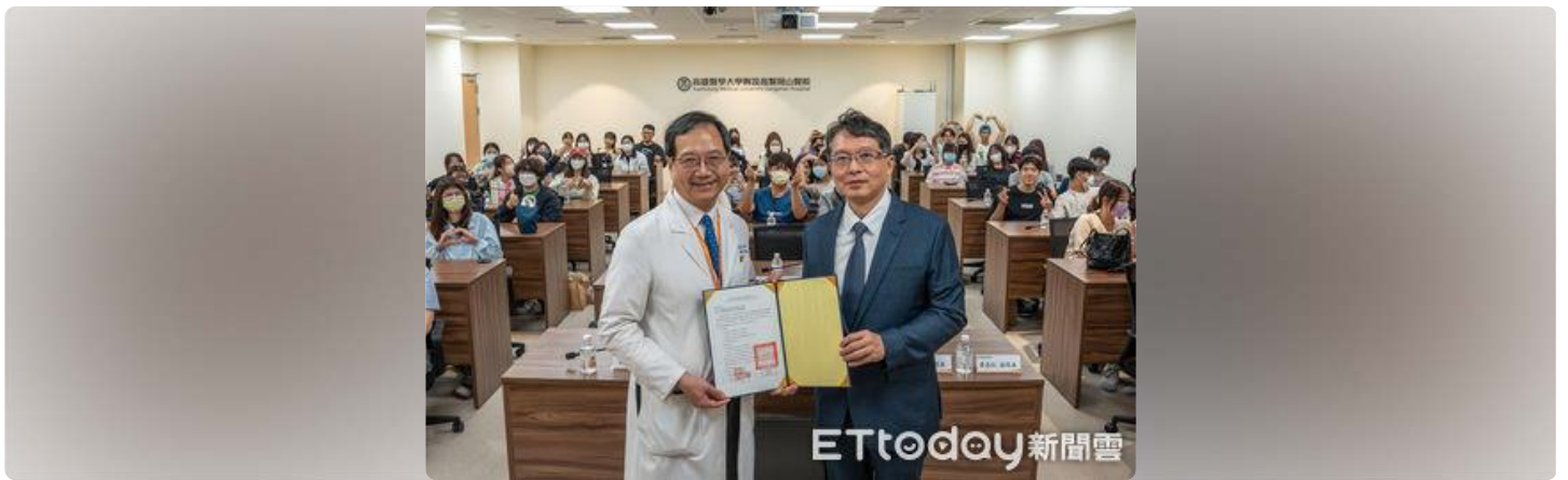
嘉藥攜手高醫岡山醫院共推智慧醫療 打造產學合作新典範