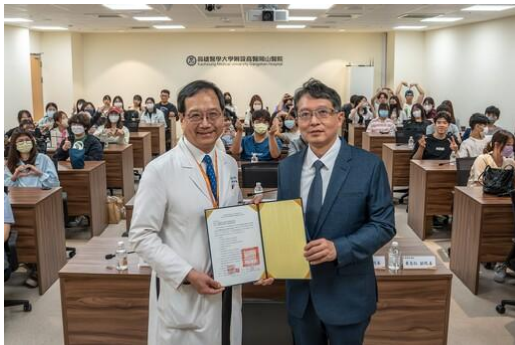
岡山醫院與嘉藥簽署合作備忘錄

嘉藥學生提供見習參訪、實習及就業機會，同時展開醫藥與醫療照護管理相關的研究與發展，並共同推動AI技術在智慧醫療領域的應用與創新。