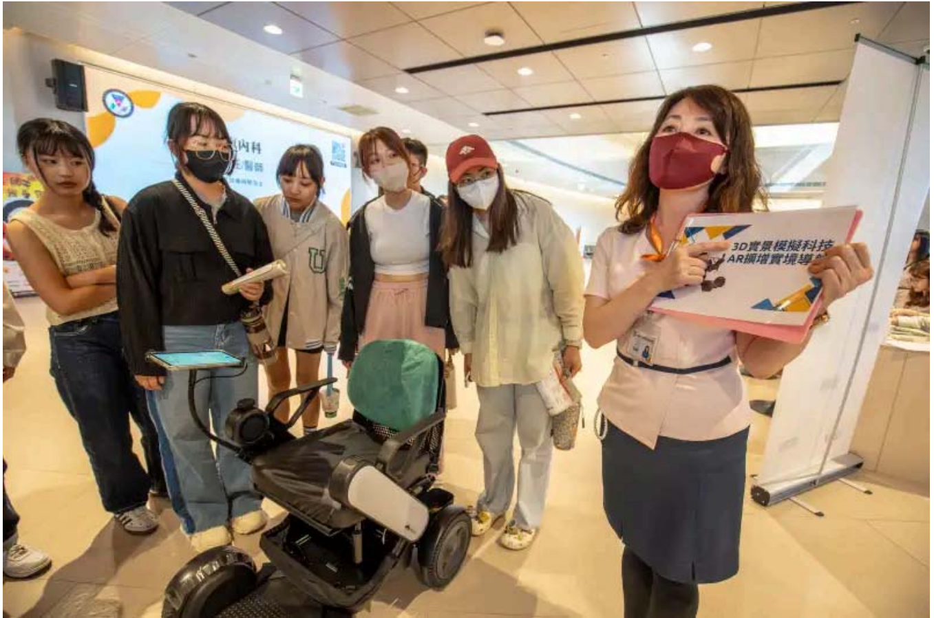
醫院導入3D實景模擬與AR設備。