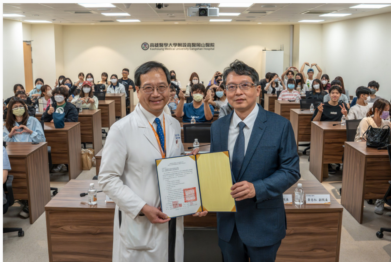
【大成報記者杜忠聰 / 臺南報導】高醫附設岡山醫院即將設立滿一周年之際，嘉南藥理大學與