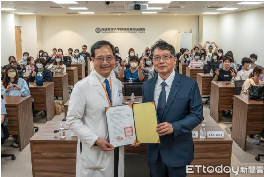
▲嘉南藥理大學與高醫岡山醫院簽署合作備忘錄，強化產學合作與智慧醫療應用。（記者林東良翻攝，下同）