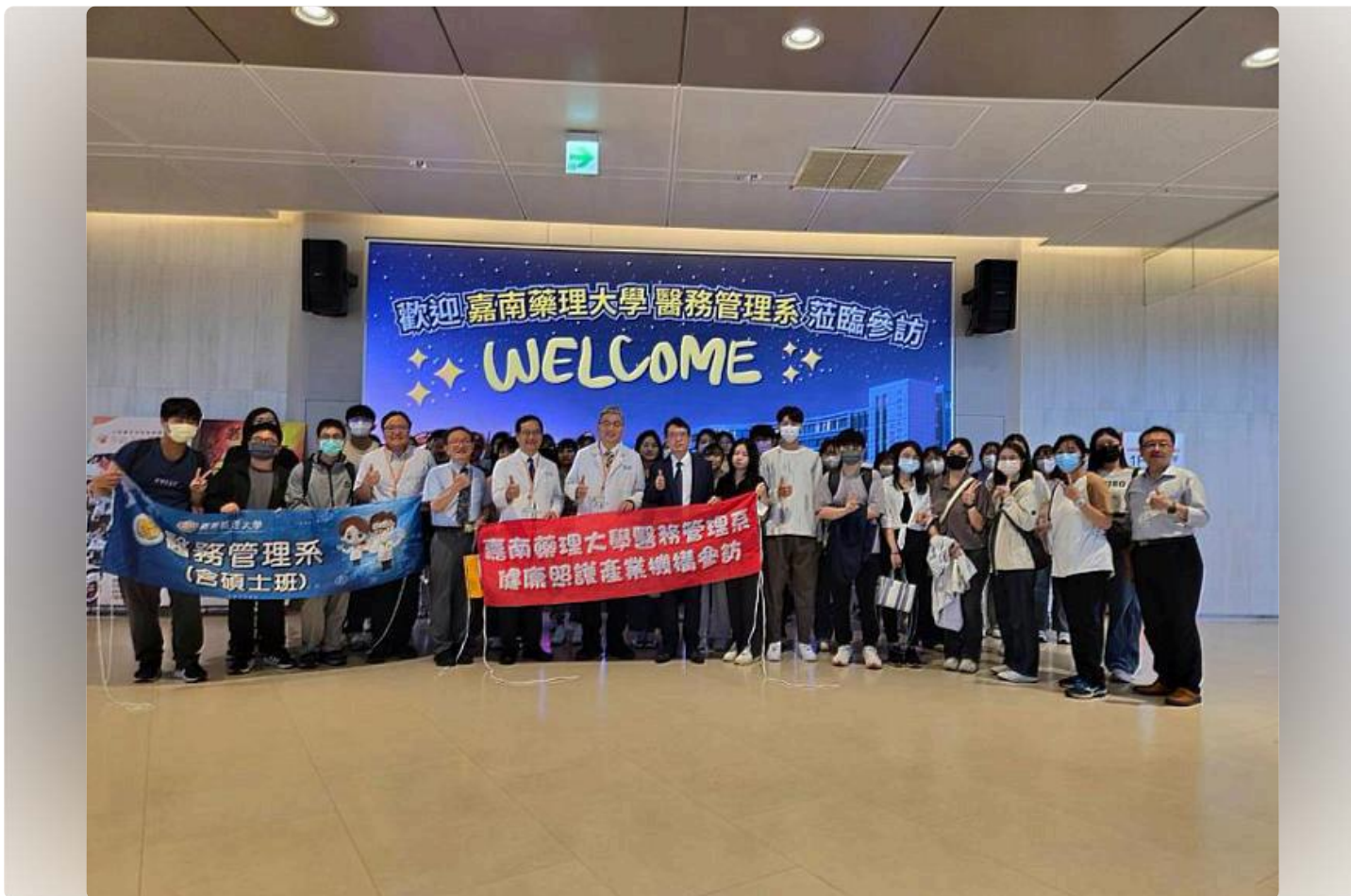
嘉藥與高醫岡山醫院簽署合作備忘錄 推動智慧醫療創新

(中央社訊息服務20250508 09:33:08)高醫附設岡山醫院即將設立滿一周年之際，嘉南藥理大學與高醫岡山醫院於5月5日下午正式簽署合作備忘錄，象徵雙方在學校與醫院合作上的嶄新里程碑，此次合作將為嘉藥學生提供見習參訪、實習及就業機會，同時展開醫藥與醫療照護管理相關的研究與發展，並共同推動AI技術在智慧醫療領域的應用與創新。