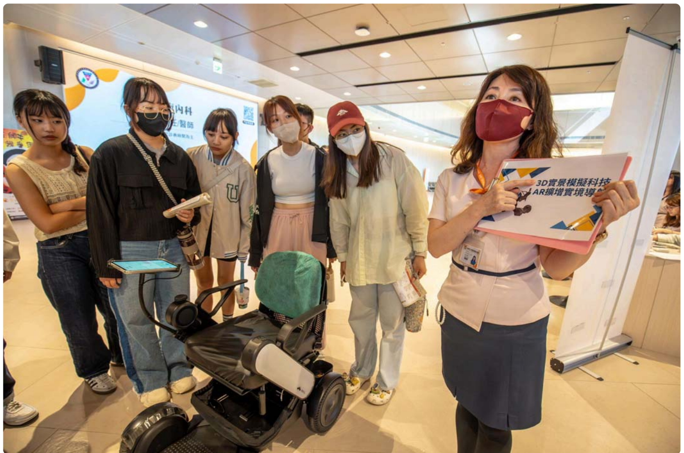
醫院導入3D實景模擬與AR設備