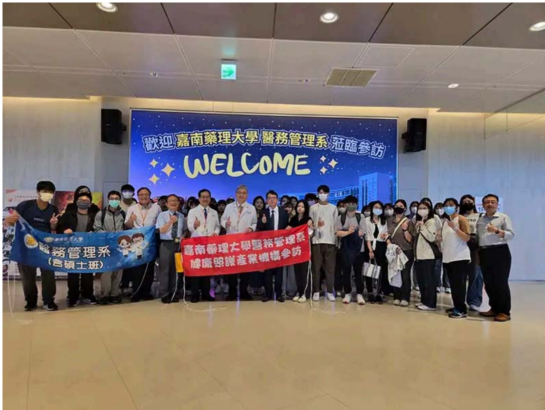
嘉藥與高醫岡山醫院簽署合作備忘錄 推動智慧醫療創新。