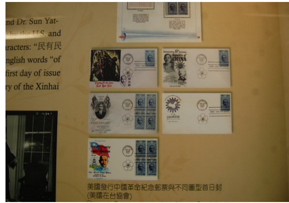
Dr. Sun Yat-sen in U.S. and Chinese characters: "民有民治" and the English words "of the first day of issue of the Xinhai"